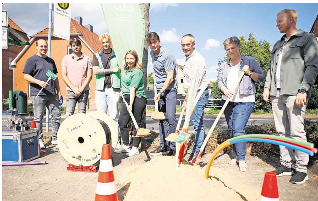
Vertreter des Anbieter Das beste Netz, der Verwaltung der Samtgemeinde Mittelweser und der Kommunalpolitik machen den symbolischen ersten Spatenstich für den Glasfaserausbau in der Gemeinde Stolzenau.

Das beste Netz (DBN) hat damit begonnen, Glasfaserleitungen zu den Kunden zu verlegen