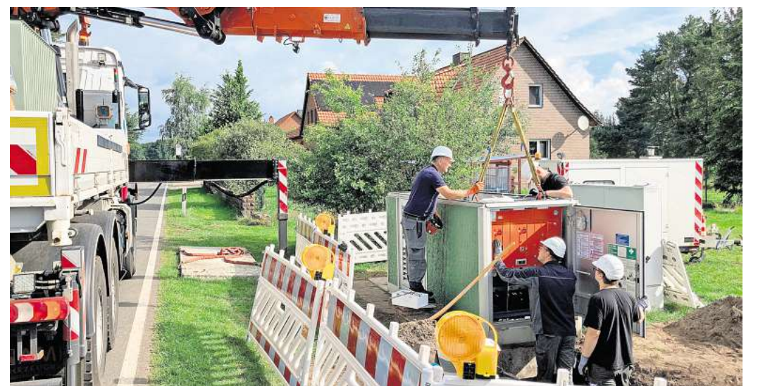
Im Rahmen des Millionenprojekts erneuert Avacon Netz auch mehrere Schaltanlagen und Trafostationen.

Zudem werden vier Trafostationen durch moderne, digitalisierte Systeme ersetzt, um den Anforderungen der Netzberechnung gerecht zu werden. Außerdem werden im Zuge der Baumaßnahmen Lichtwellenleiter-Leerrohre für künftige Kommunikations-