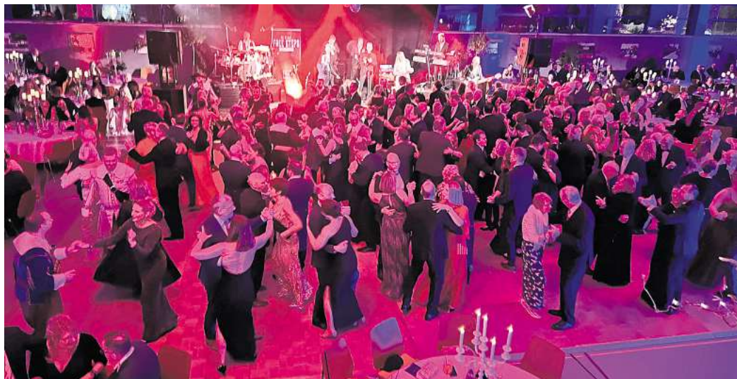
Die Tanzfläche war gut gefüllt. Hier noch in der Nienburger Leintorhalle.

Weil die Leintorhalle nicht im ursprünglichen Sinne für große Feiern, sondern maximal für Sportveranstaltungen konzipiert wurde, müssen zu jedem Ball immense Maßnahmen ergriffen werden. Dabei geht es etwa um Brandschutz und Fluchtwege, aber auch um sanitäre An-