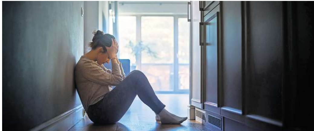
Nicht für alle Frauen, die von häuslicher Gewalt betroffen sind, ist im Nienburger Frauenhaus Platz.

Aktuell sucht der Trägerverein händeringend Unterstützung: Da die derzeitige Vorsitzende wegzieht und ihre Stellvertreterin ihr Amt aus persönlichen Gründen ab-