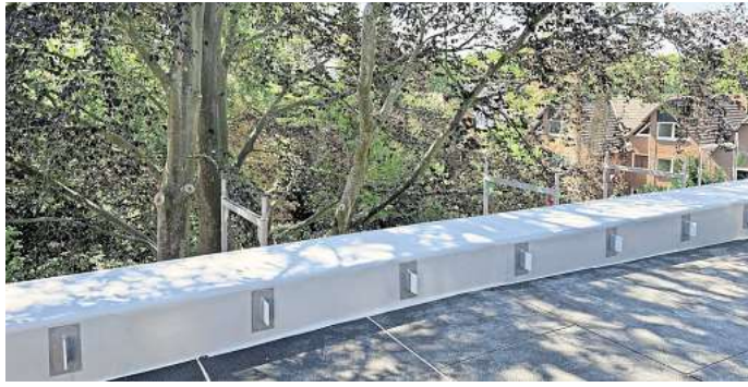
Bäume gehören zum Konzept des „ecohofs“: Blick von einem der künftigen Balkone.