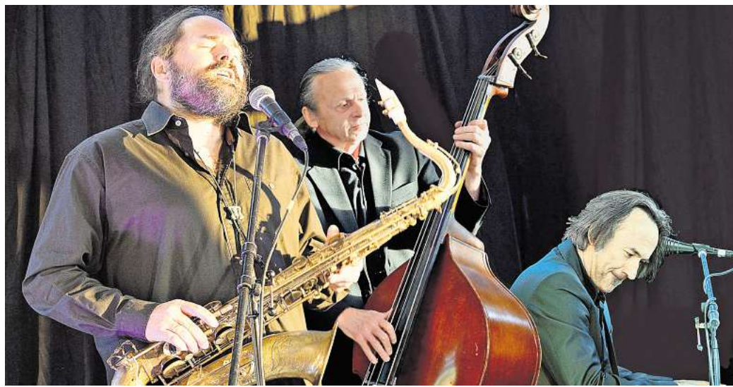
Die „Alligators of Swing“ gastieren am 12. September im Burghof Rethem.

„Alligators of Swing“ aus Franken am 12. September im Rethemer Burghof