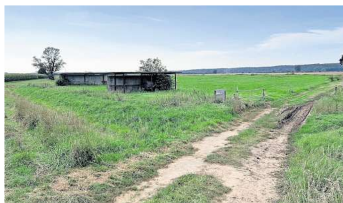
Der Kiesabbau im Bereich Leeseringen soll um weitere 90 Hektar vergrößert werden.

Die Untere Wasserbehörde, angesiedelt in der Landkreisverwaltung, wird im Anschluss an das Beteiligungsverfahren die Stellungnahmen zu bewerten haben. Inwieweit an der Stelle gewünschte Mindestabstände Eingang in die Bewertung finden, bleibt abzuwarten.