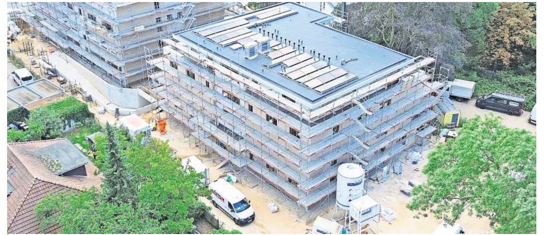
Der "ecohof" an der Verdener Straße soll Mitte Dezember fertig sein. Im Hintergrund ist der Neubau der Baubetreuungsgesellschaft Lange & Lossau für ein Wohn- und Geschäftshaus zu sehen.

Weitere Informationen zum „ecohof“ gibt es hier.