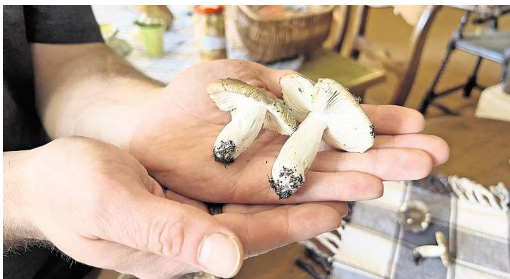
Nicht alle Täublinge sind essbar. Wer ein kleines Stück probiert und nicht auf einen scharfen Geschmack trifft, hat eine essbare Variante gefunden.