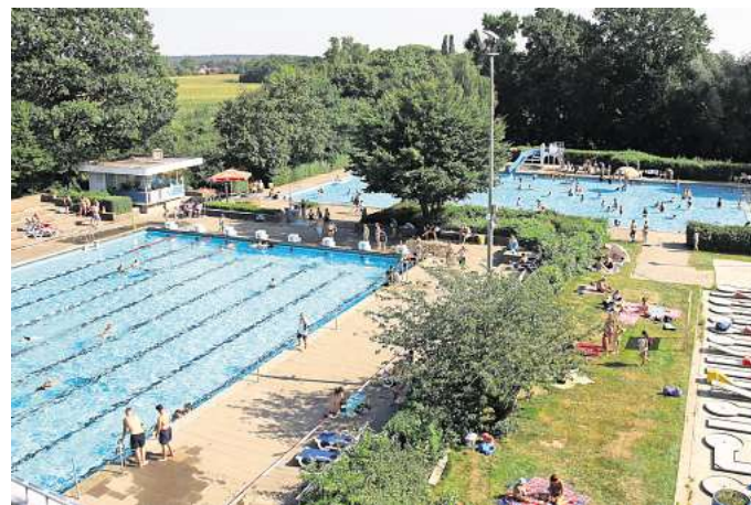
Das Freibad in Holtorf vom Zehn-Meter-Turm aus: Am Mittwochnachmittag ist es voll im Bad.

es jährlich von der Stadt. „Wir wirtschaften sehr gut damit“, sagt Schütz: „Drei Euro pro Badegast sind sehr wenig. Der Betrieb ist nur möglich durch