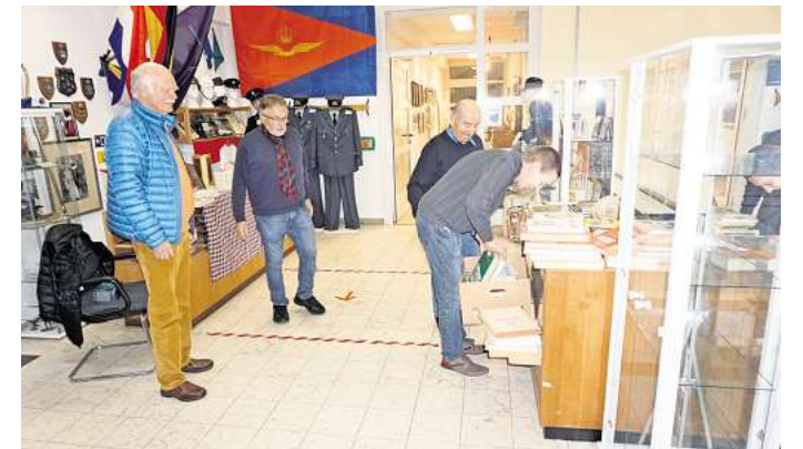
Der Bürger- und Heimatverein „Wir Stolzenauer“ bemüht sich immer wieder darum, neue Exponate präsentieren zu können. So wird es auch zum 25-jährigen Vereinsbestehen wieder sein.

werden mit Sicherheit Aufnahmeanträge des Bürger- und Heimatvereins ausliegen.