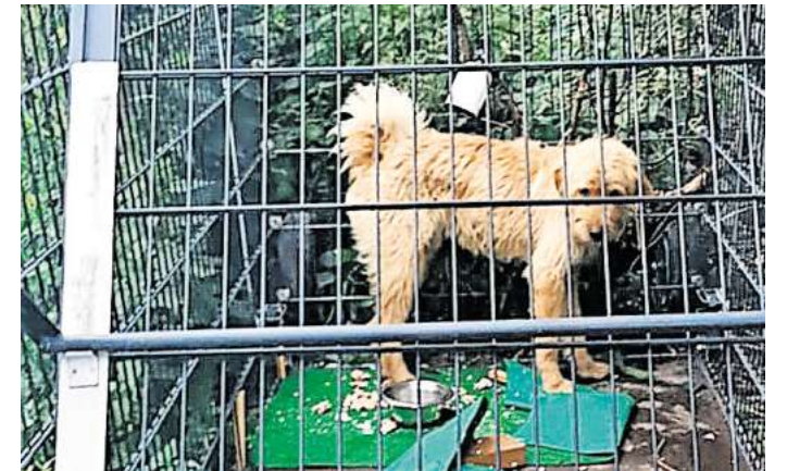
Am Freitag hat die Gruppe „Hundesicherung Mittelweser“ mit einer Falle „Bailey“ eingefangen.

Suchen werden nach Meiers Worten oft per Facebook veröffentlicht. „Dann können wir Kontakt aufnehmen und versuchen zu helfen.“ In naher Zukunft dann mit einer eigenen Falle.