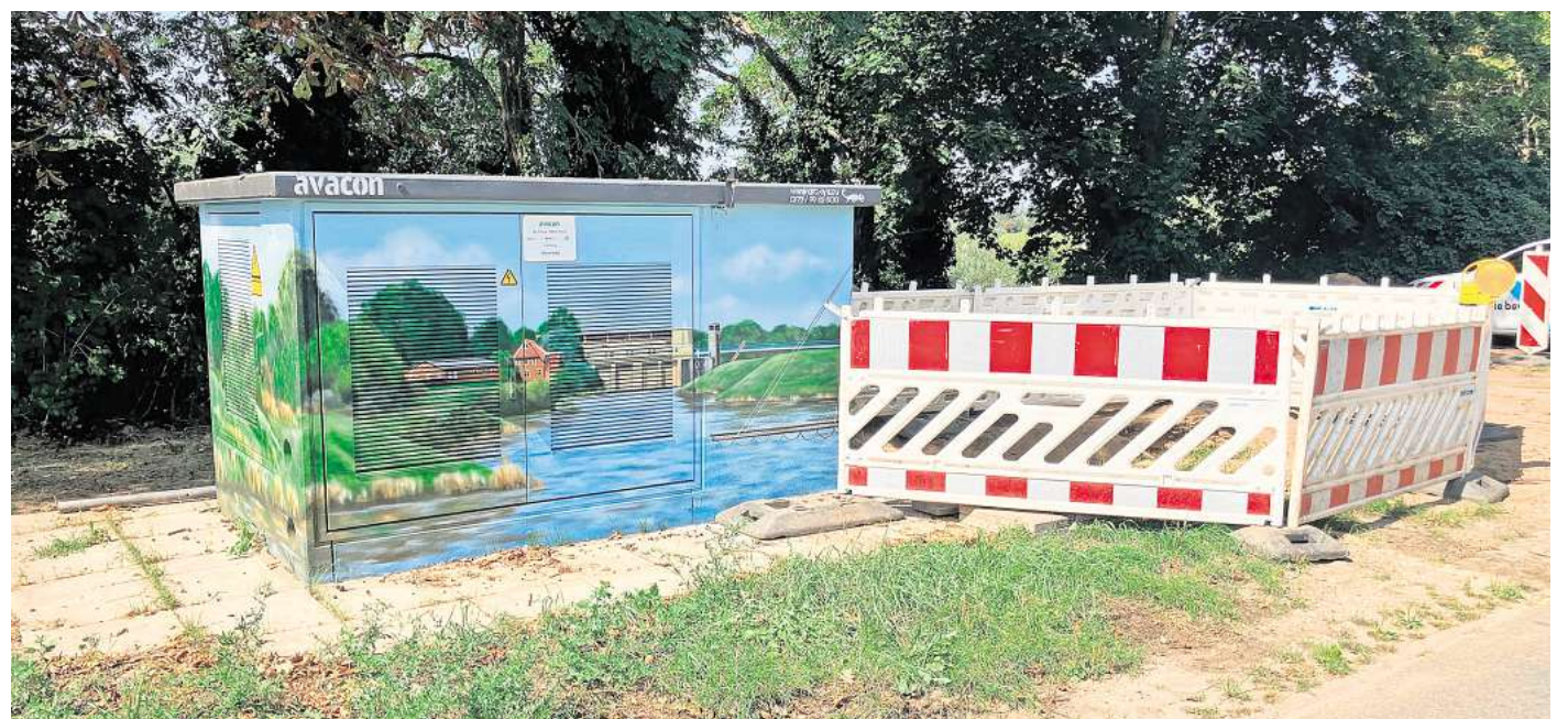
Die Trafostation der Avacon am Drakenburger Weserweg.

Die Avacon verstärkt das Stromnetz in Drakenburg und investiert dafür mehr als 500.000 Euro. Diese Straßenzüge sind betroffen.