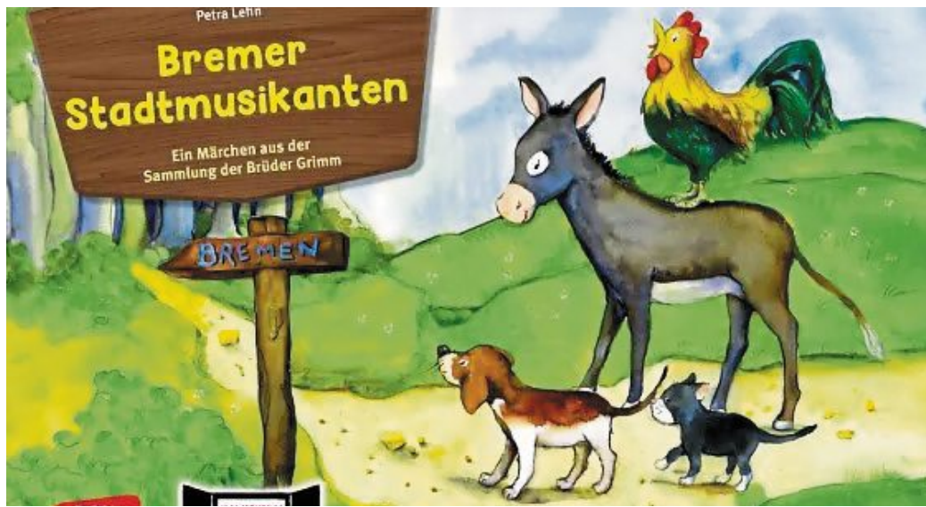
Das Märchen von den „Bremer Stadtmusikanten“ ist am 26. Februar in der Bücherei in Rehburg zu erleben.

Jahrelang hat der Esel für den Müller das Getreide geschleppt. Jetzt, da er alt und nicht mehr ganz so kräftig ist, will ihn der Meister loswerden. „Ich reiße aus und werde Stadtmusikant! In Bremen.“ Auf seiner Reise trifft er einen Hund, eine Katze und einen Hahn. Als es Nacht wird, ent-