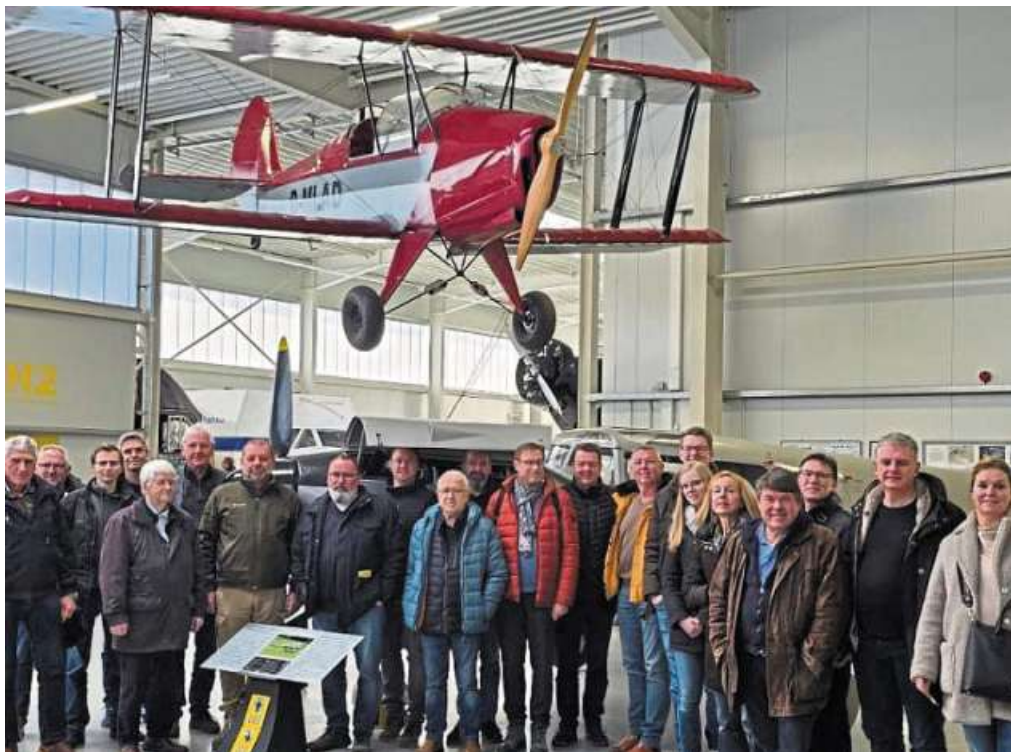
Die Nienburger Pilotengruppe lies sich von Mensch und Technik im Luftfahrtmuseum Wernigerode inspirieren. Hier steht sie unter einem „Kiebitz“-Doppeldecker-Ultraleicht-Flugzeug in Halle eins.

Luftsport-Club Nienburg war zu Besuch im Luftfahrtmuseum Wernigerode