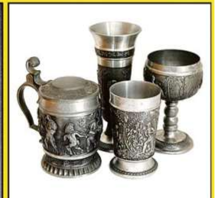
ZINN (in jeder Form)

Lange Straße 70 (gegenüber Netto) 31582 Nienburg