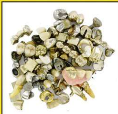
ZAHNGOLD (auch mit Zahnresten)