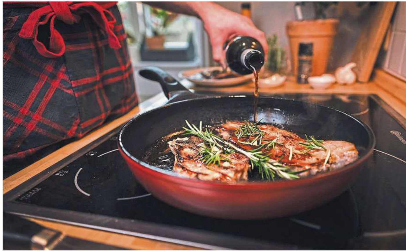
In der Fleischindustrie zu arbeiten, ist ein Knochenjob. Im Landkreis Nienburg sind laut Gewerkschaft 370 Menschen in dieser Branche beschäftigt.

„Wer Tiere schlachtet oder Grillwürste verpackt, verdient