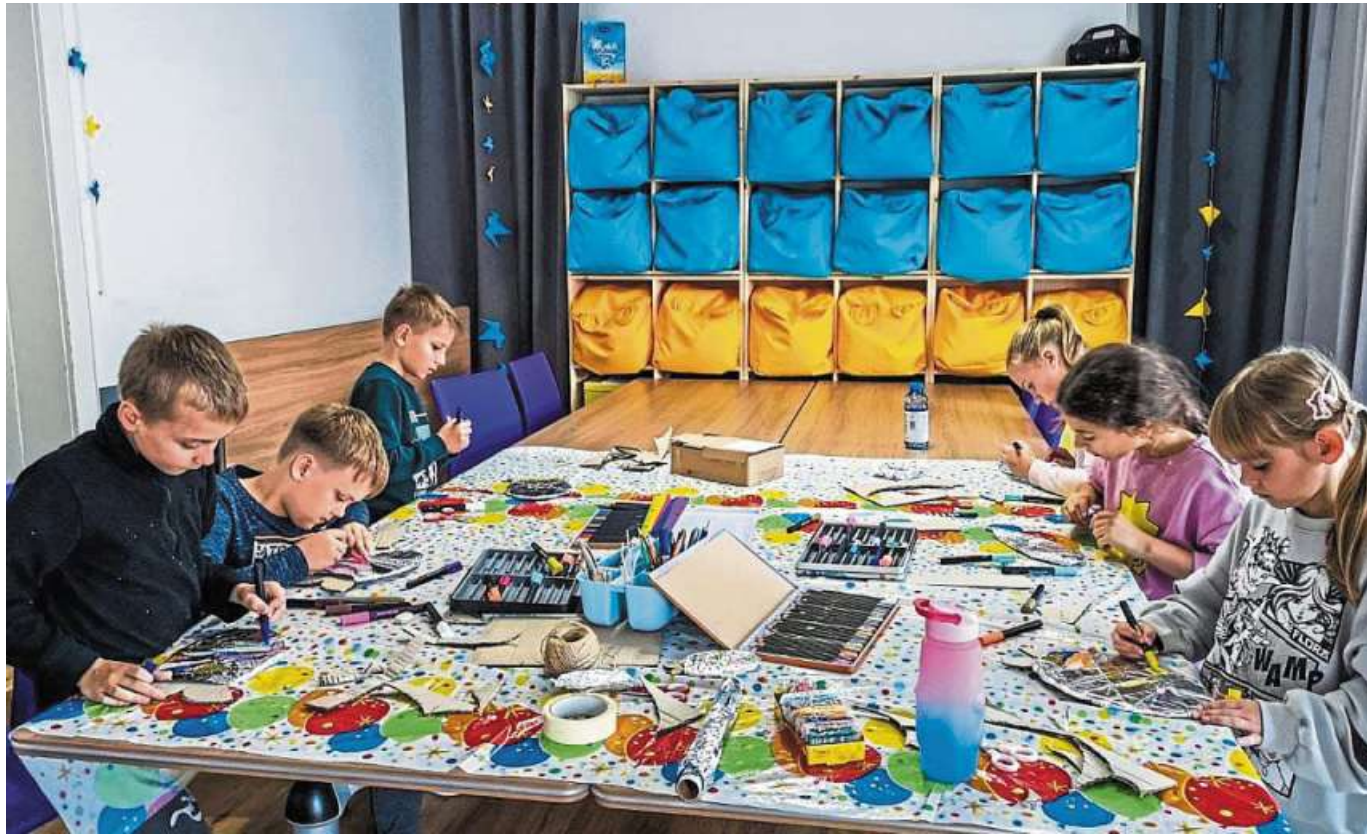
Die Kinder beim Malunterricht.