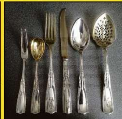
BESTECK (Silber und versilbert)