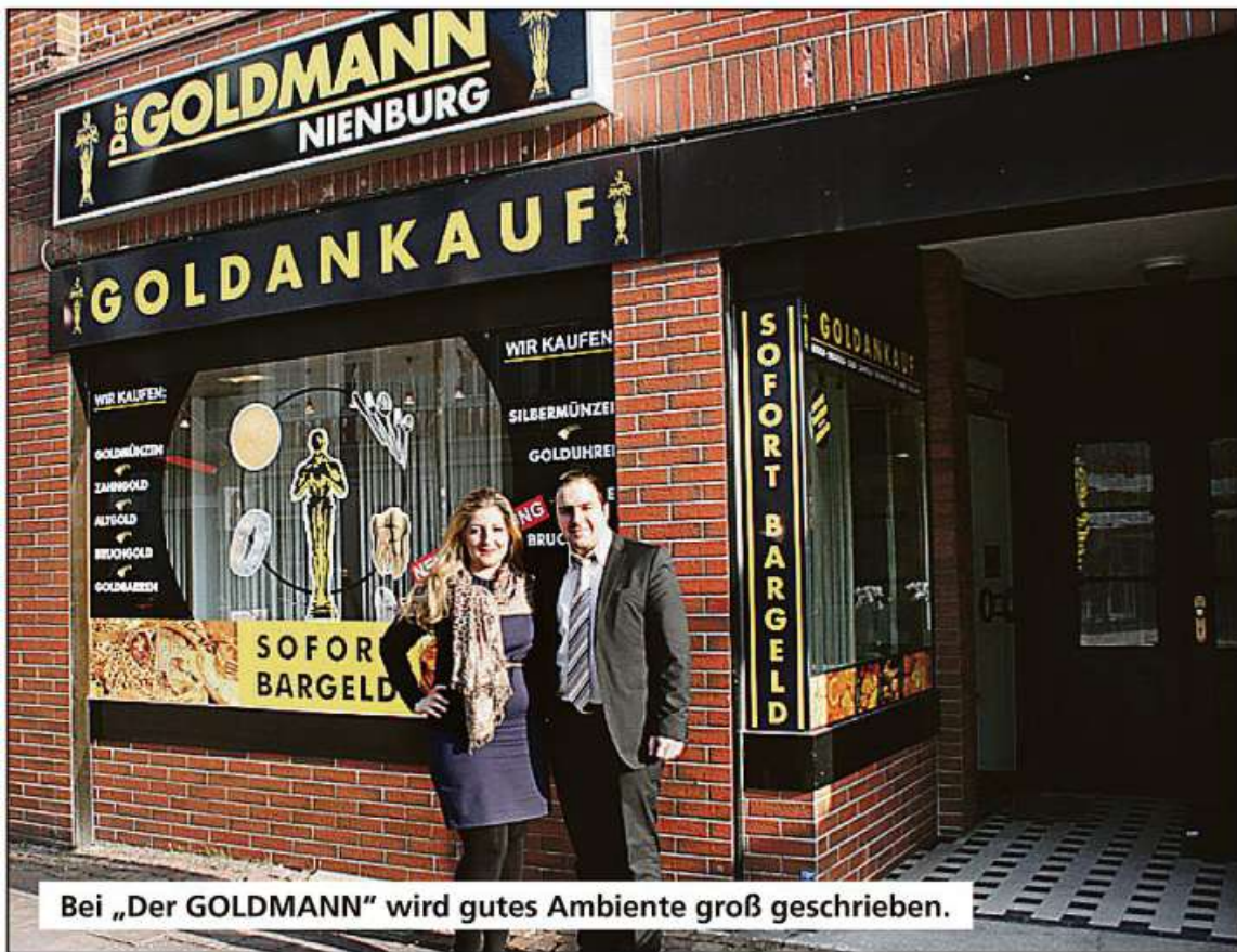
Bei „Der GOLDMANN“ wird gutes Ambiente groß geschrieben.