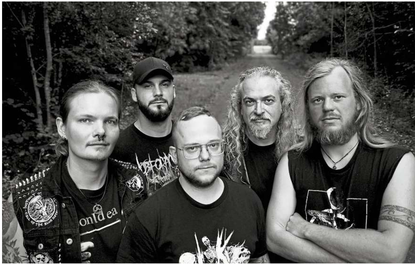
Die Bands Death Atlas, Grand Devourer und Catbreath sind am Freitag live und gegen Spende im Jazz Club zu erleben.

„Catbreath“ - Slayeresque MaMö-Texte aus der Sicht von Fat Freddy – eine kateregordene Symbiose aus Mahatma Gandhi und einem Serienkiller