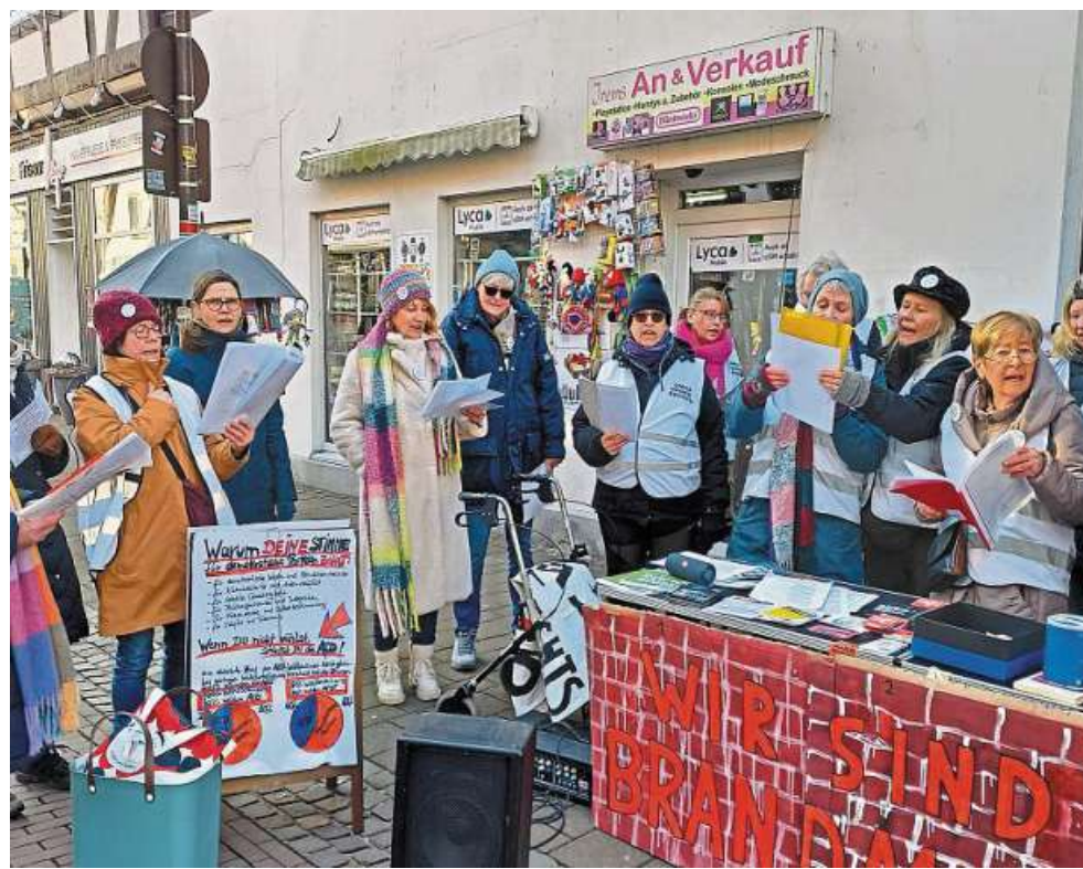
Die Nienburger „Omas gegen Rechts“ am vergangenen Sonnabend in der Innenstadt. Ihre Botschaft: Die Tür nach Rechts außen muss geschlossen bleiben.