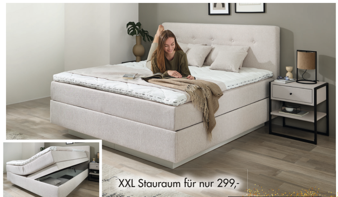
GAUSMANN BOXSPRINGBETT ca. 180 x 200 cm, Unterbau Deluxe mit Taschenfederkern, Wendematratze H2/H3, Outside Kaltschaum Topper, in Stoff beige. Bettkasten auf Wunsch möglich.

ERÖFFNUNGS-PREIS 1999,- 2299,- oder 166,58 monatlich bei 12 Monaten 3)