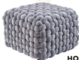
HOCKER 50 x 50 cm