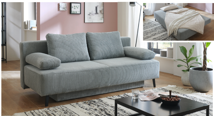
NIGHT & DAY VERWANDLUNGSOFA Liegefläche ca. 140 x 193 cm mit Schaumstoffpolsterung und XXL Bettkasten. Trendstoff Cord grau. Sofort lieferbar 2)

ERÖFFNUNGS-PREIS 2499,- 3299,- oder 208,25 monatlich bei 12 Monaten 3)