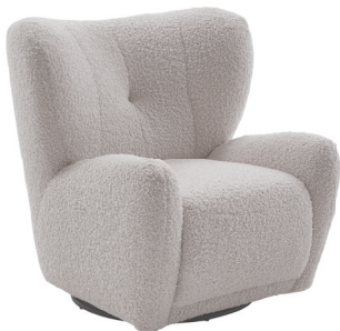
Lounge-Sessel, drehbar, 599,-

ERÖFFNUNGS-PREIS 1299,- 2099,- oder 108,25 monatlich bei 12 Monaten 2)