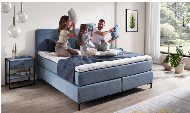
GAUSMANN BOXSPRINGBETT ca. 180 x 200 cm, Unterbau Deluxe mit Taschenfederkern, Wendematratze H2/H3, Outside Kaltschaum Topper, in Stoff blau. Sofort lieferbar 2)

ERÖFFNUNGS-PREIS 1999,- 2299,- oder 166,58 monatlich bei 12 Monaten 3)