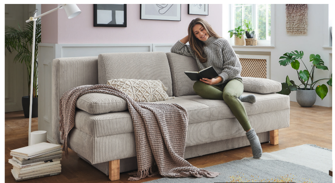
NIGHT & DAY QUERSCHLÄFER Bezug Cord natur, Typ A, Holzfuß Eiche hell, ca. 150 x 200 cm Liegefläche.