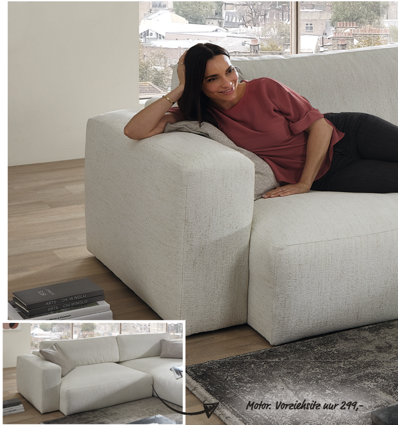
Motor. Vorziehsitz nur 299,-