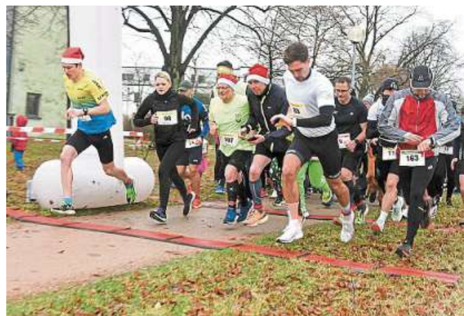
Der Start der Läufer beim Adventslauf im Jahr 2023.

Bei den einzelnen Läufen des Adventslaufs für die Kinder und Erwachsenen wird auch die Kreativität belohnt: Neben Preisen für die Streckenschnellsten werden auch die originellsten Kostüme