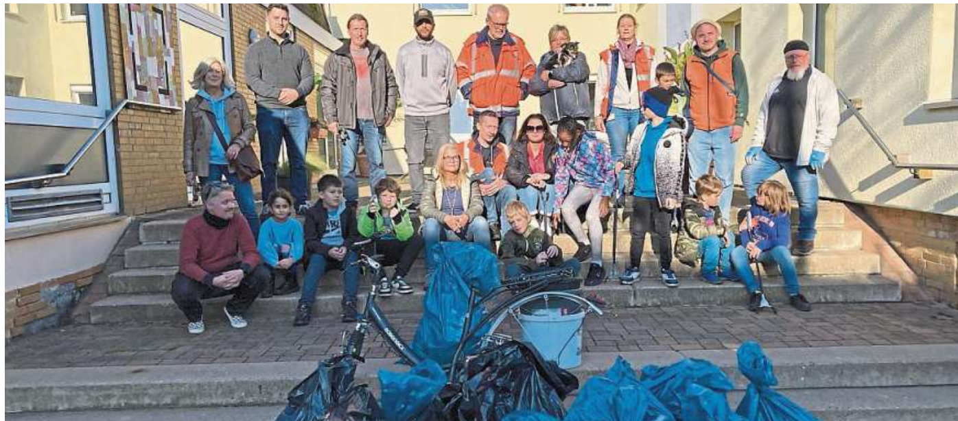
13 volle Müllsäcke und ein Fahrrad: Das ist die traurige Bilanz der Aktion, die die Beschäftigten von H.B. Fuller in diesem Jahr zusammen mit Kindern und Jugendlichen vom CJD in Nienburg durchgeführt haben.

Gut 60 Freiwillige beteiligten sich ausgestattet mit Müllsäcken, Handschuhen und Greifern bei bestem Herbstwetter an der Aktion. Nach einer Begrüßung beim CJD machten sich die Kinder und Jugendlichen aus den Tagesgruppen gemeinsam mit ihren Betreuern und den H. B. Fuller Mitarbeitern motiviert auf den Weg. In mehreren Gruppen waren sie rund um den Bahnhof unterwegs. Nach etwa zwei Stunden haben alle einen großen Berg mit Müllsä-