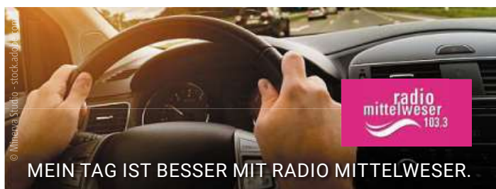
MEIN TAG IST BESSER MIT RADIO MITTELWESER.