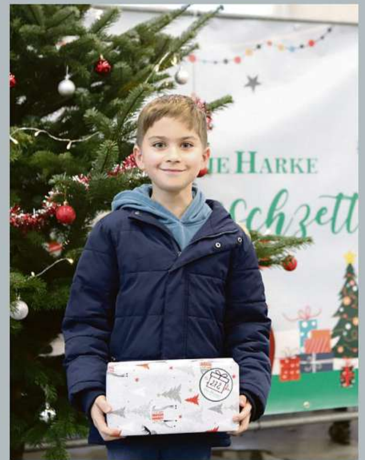
Schöne Erinnerungen an die Geschenkübergabe 2023.