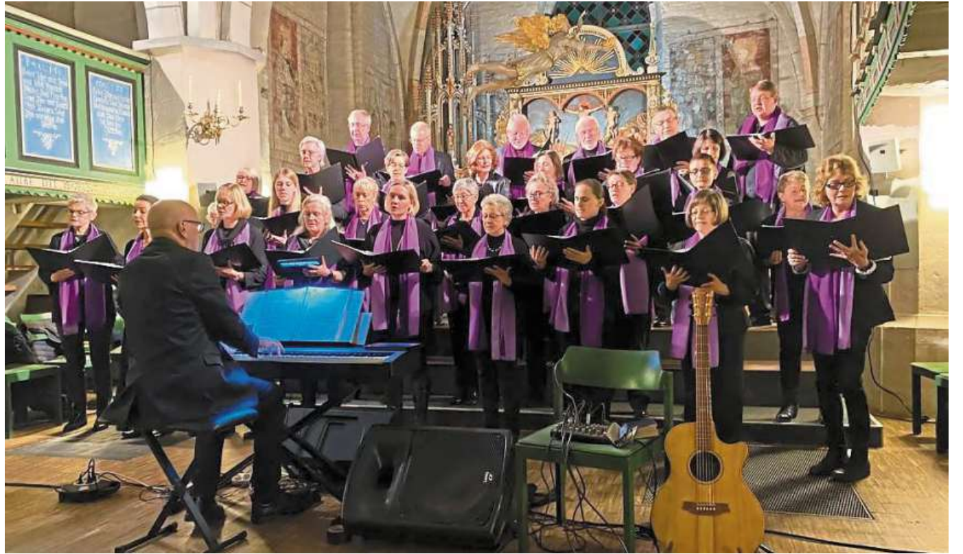
Der Kirchenchor „Himmliche Töne“ ädt am 1. Advent zum Konzert in die Sankt-Laurentius-Kirche Liebenau ein.f

Auch für diesen Abend haben sich beide Chorleiter ein erweitertes anspruchsvolles Programm mit einigen Überraschungen überlegt. Neben der jeweils wechselnden individuellen Eröffnung des Konzertes mit dem Einzug des Chores werden an dem