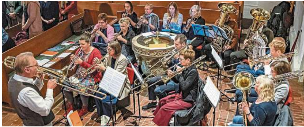
Mit dabei ist dieses Mal der Posaunenchor Wietzen.