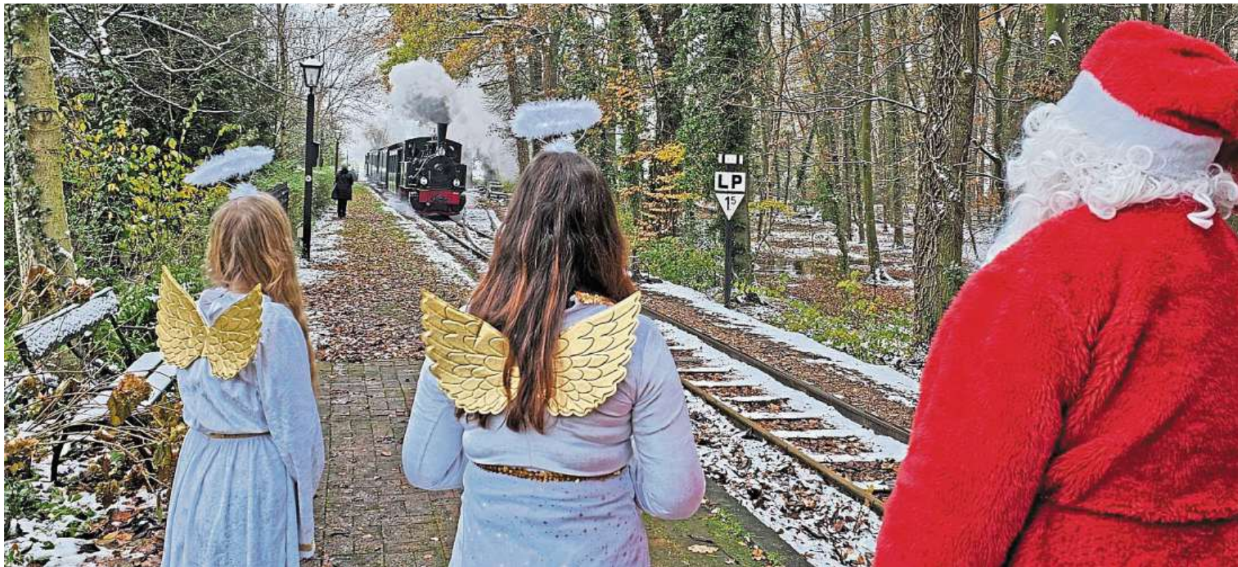
Der Nikolaus mit seinen Engeln wartet auf die Einfahrt des Dampfzuges in Vilsen Ort.

Museums-Eisenbahn lädt wieder zu den beliebten Nikolausfahrten ein