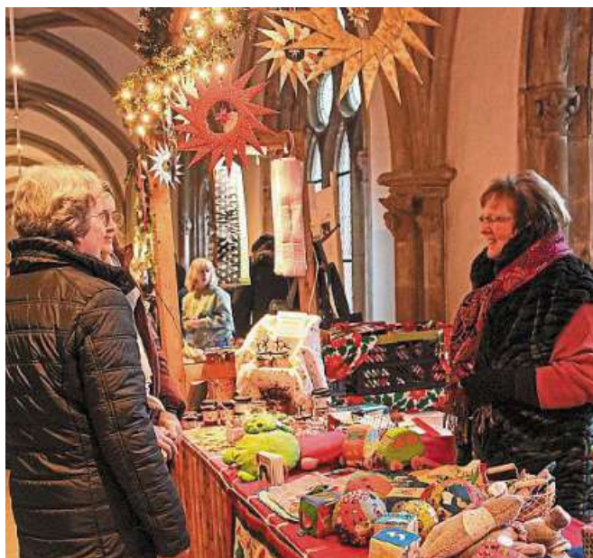
Am Wochenende ist wieder Adventsmarkt rund ums Kloster Loccum.

Eine Zeit des gemeinsamen Schweigens im Gottesdienst lädt dazu ein, das Herz für Gott zu öffnen und mit ihm in Berührung zu kommen. DH