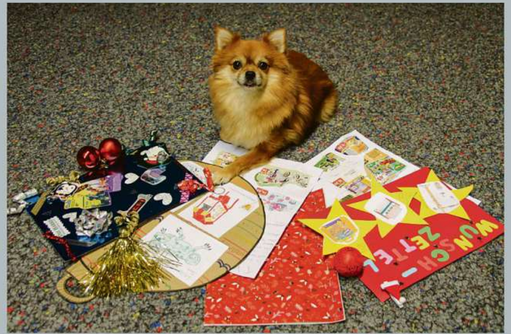
Die ersten Wunschzettel wurden von fachlichen Augen begutachtet.