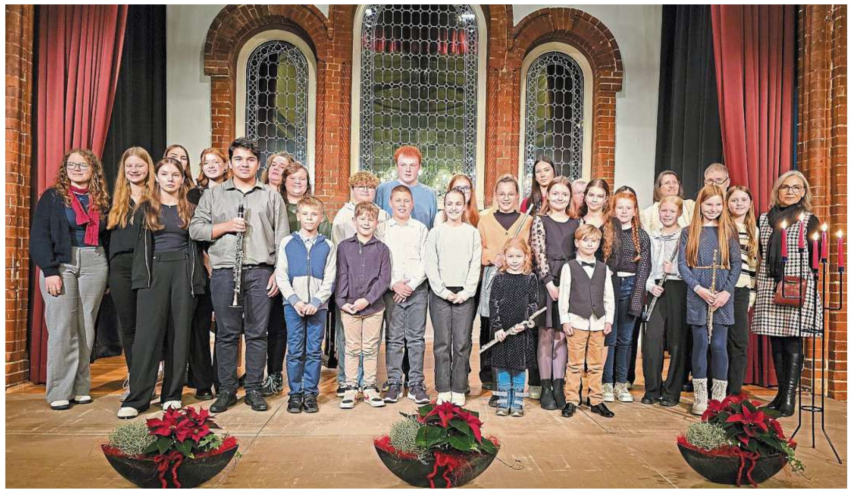
Die Teilnehmerinnen und Teilnehmer des 34. Hausmusikabends der Stadt Rehburg-Loccum.

Stimmungsvoller 34. Hausmusikabend in Rehburg