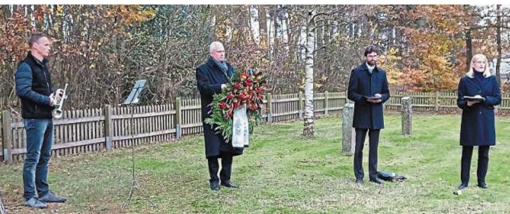
Im Vorfeld des Volkstrauertags an der Gedenkstätte zu Ehren der an Krankheit und Hunger gestorbenen russischen Kriegsgefangenen zu erinnern, ist in Heemsen Ehrensache.