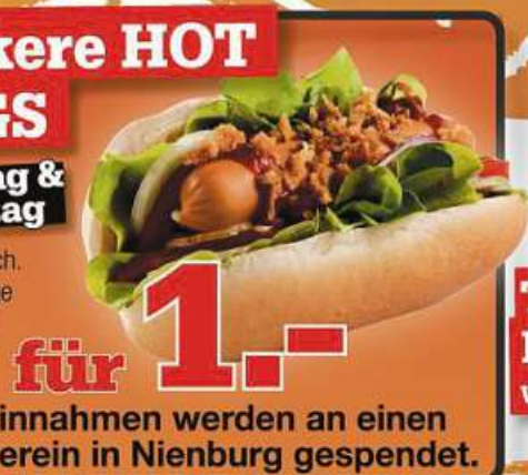
Abb. ähnlich. Nur solange der Vorrat reicht.