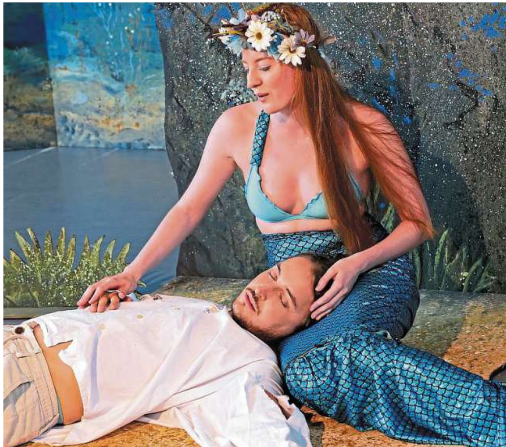
In der Reihe „Theater für Kinder“ zeigt das Nienburger Theater das Andersen-Märchen „Die kleine Meerjungfrau“ in einer lustigen und poetischen Version mit Happy End.

■ „Die kleine Meerjungfrau“ , Sonntag, 2. März 2025, 16 Uhr und Montag, 3. März 2025, 10 Uhr: Das ursprünglich traurige Märchen von Hans Christian Andersen wird hier für ein junges Publikum lustig und poetisch bearbeitet und hat diesmal ein Happy End. Entstanden ist ein zauberhaftes Familien-Musical mit vielfarbiger Musik, die sich in allen Stilen von der fulminanten Opernarie über Musical-Melodik bis zu funky