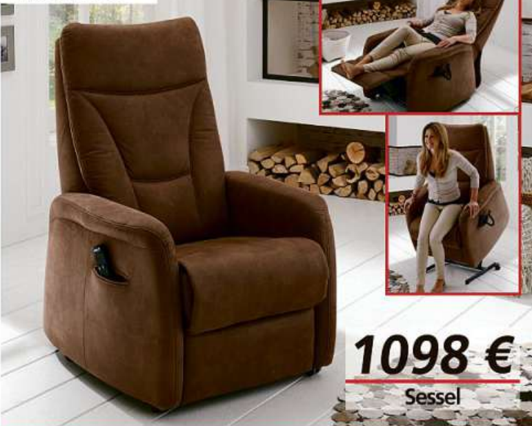
2-motorisch mit Aufstehhilfe.

SCHNELL SEIN LOHNT SICH!! WENN WEG, DANN WEG!