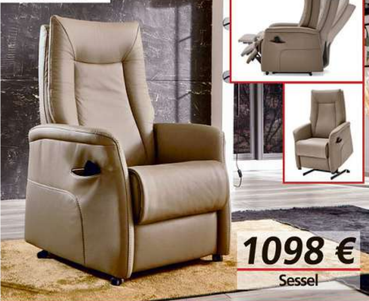
2-motorisch mit Aufstehhilfe.