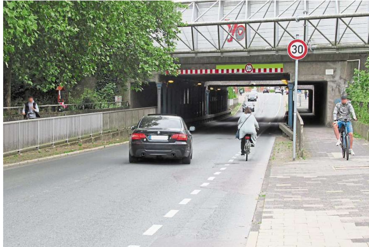
Wie gut kommen Radfahrende im Alltagsverkehr zurecht? Gibt es Schwierigkeiten? Der Fahrradklimatest soll darauf den Verkehrsplanern und der Politik Antworten geben.

„Die Beteiligung an aktuellen Fahrradklimatest ist noch sehr verhalten“, so Berthold