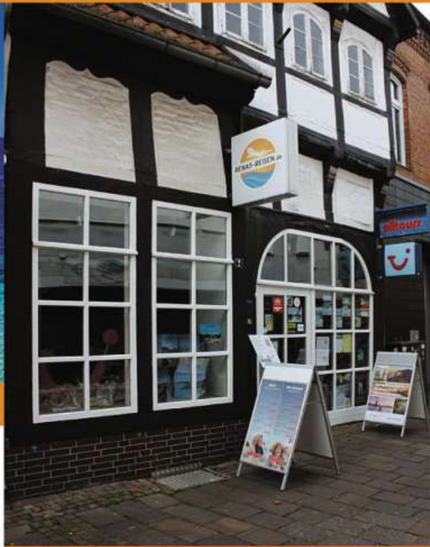
20 Jahre „Renas-Reisen“ an der Friedrich-Ludwig-Jahn-Straße in Nienburg.