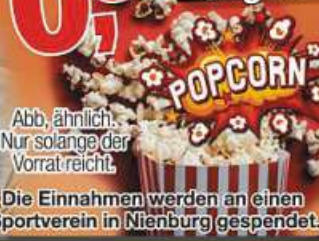
Abb. ähnlich. Nur solange der Vorrat reicht. Die Einnahmen werden an einen Sportverein in Nienburg gespendet.