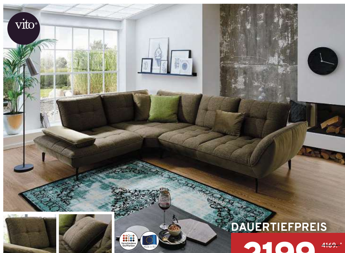
ECKGARNITUR, BxHxT ca. 310x93x250 cm. Mehrpreis für Armlehnen-Rasterfunktion und Schwenkrücken mit Rückenheizung. Ohne Deko. 0592 0087 00 | INKL. LIEFERUNG & MONTAGE