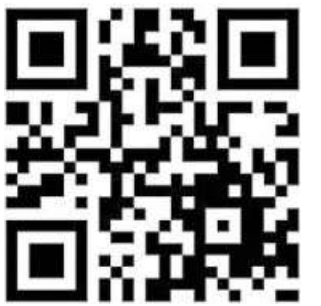
Den QR-Code scannen, den neuen Newsletter bestellen.

Unsere Reporterinnen und Reporter sind täglich auf der Suche nach spannenden Themen aus dem Landkreis Nienburg. Und Sie sind am frühen Morgen mittendrin. Also: Melden Sie sich jetzt schon an – und verpassen Sie keine Ausgabe! seb