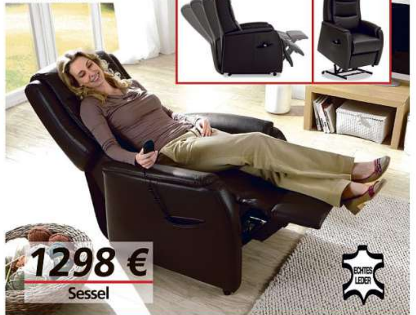
2-motorisch mit Aufstehhilfe.