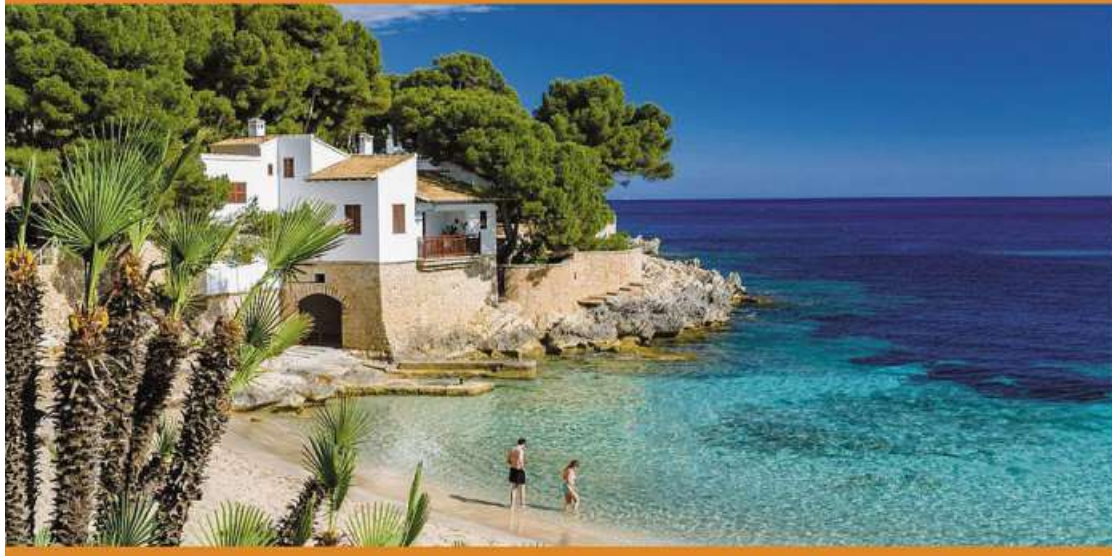
Auf in den nächsten Traumurlaub - dank guter Beratung geht das ganz entspannt.