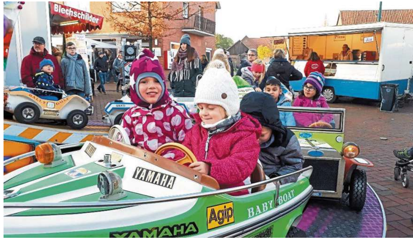
Fahrgeschäfte sorgen für Spaß auf dem Herbstmarkt Loccum.

Zu einem richtigen Loccumer Herbstmarkt gehört natürlich auch der alljährliche Laternenumzug der Kinder am Samstagabend. Um 18 Uhr treffen sich interessierte Kin-