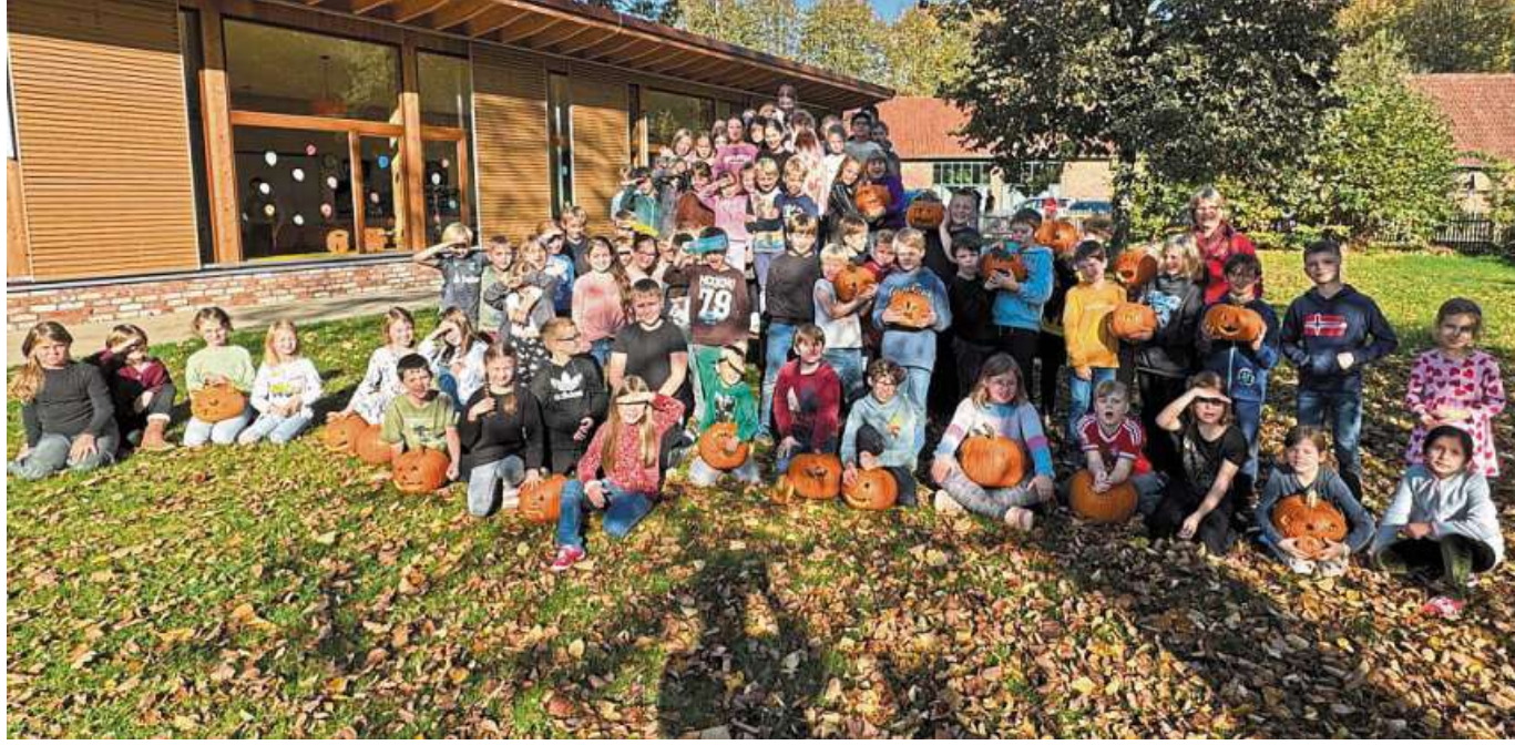
Einen tollen Tag rund um den Kürbis hatten Kinder der Estorfer Grundschule.

Rohrsen. Der Spielmannszug Rohrsen lädt alle Kinder, Eltern, Großeltern und Freunde zum diesjährigen Laternenumzug am Samstag, 9. November, ein. Gestartet wird um 18 Uhr am Feuerwehrgerätehaus. Nach einer kleinen Runde durchs Dorf gibt es Wurst, Pommes und Getränke. DH