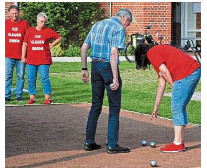
Das erste Bouleturnier des Heimatvereins Leese kam gut an. Eine Neuauflage ist geplant.

Weitere Marken finden Sie in unserer Ausstellung oder unter www.moebelheinrich.de