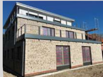
Ansicht Südseite, Kleine Ziegelriede

Kleine Ziegelriede Hier entstehen sehr Innenstadtnah 6 Eigentumswohnungen Fertigstellung Anfang 2025 ab 100 m 2 Whfl., Erdwärmepumpe, Aufzug, 30 m 2 Dachterrasse oder Gartenflächen, große Kellerräume Stellplatz / Carport möglich ab 455.000,- € KP zzgl. Kaufnebenkosten, ohne Maklergeb.