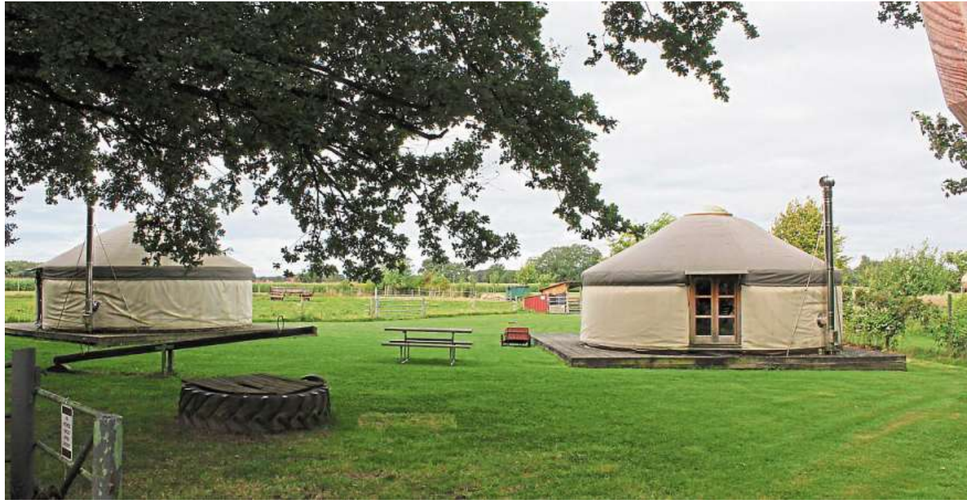
„Unser kleiner Hof“ in Wietzen mit mongolischen Jurten wurde erneut mit dem Zertifikat „KinderFerienLand Niedersachsen“ ausgezeichnet.

Die Auszeichnung zum „KinderFerienLand“-Betrieb ist für drei Jahre gültig. Im Rahmen der Vergabe des Qualitätssiegels wurden rund 50 Kriterien überprüft, die die Messbarkeit von kinderfreundlichen Betrieben generieren sollen. Die Auszeichnung dient als verlässliches Kriterium, um die Qualität des Angebotes zu kennzeichnen. „Unser kleiner Hof“ wurde anhand eines einheitlichen