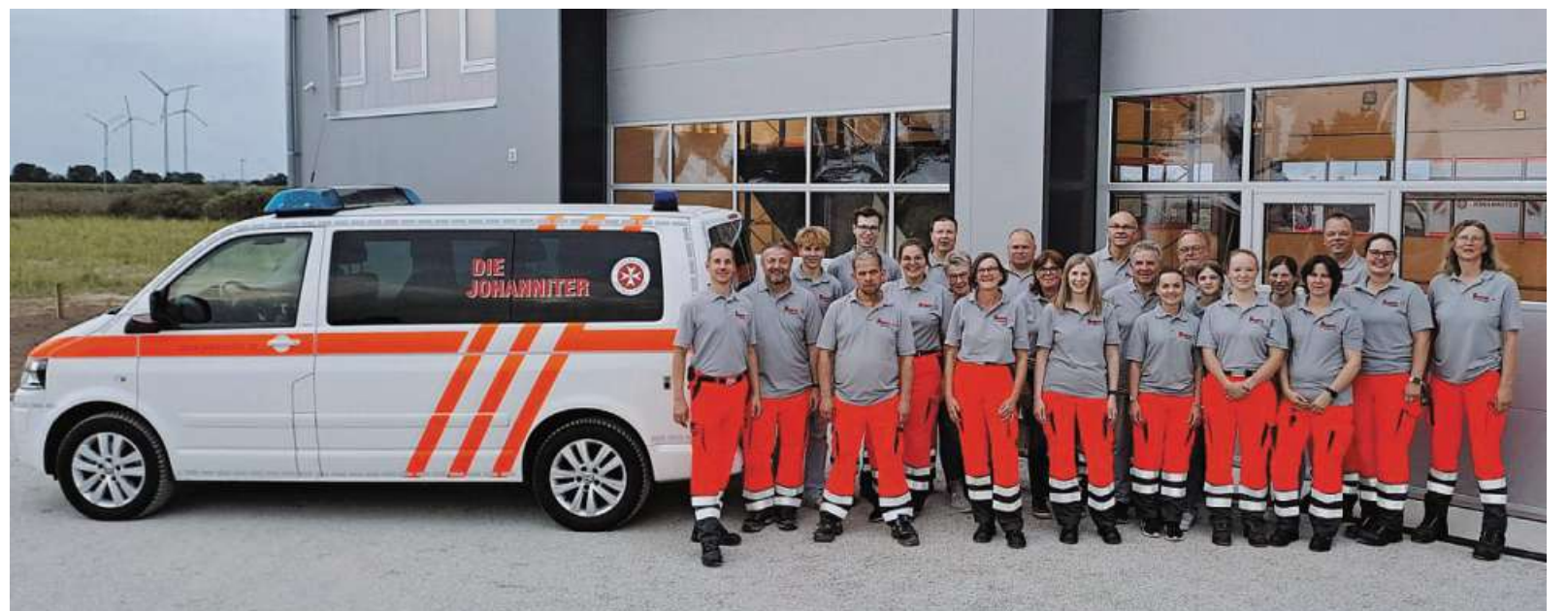
Ehrenamtliche der Landesberger Johanniter vor ihrer neuen Fahrzeughalle.