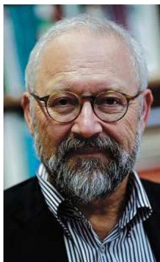
Zu einer Lesung mit Prof. Dr. Herfried Münkler lädt das Museum Nienburg am 28. November ein.

In seinem 2023 erschienenen neuesten Werk „Welt in Aufruhr – Die Ordnung der Mächte im 21. Jahrhundert“ nimmt Münkler die Möglichkeiten einer zukünftigen neuen Weltordnung in den Blick,