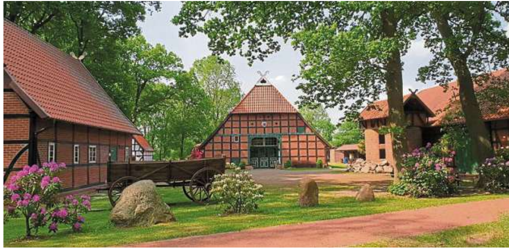
Idyllisch gelegen: der Gehannfors Hof in Warmesen.

Mit dabei ist die Theatergruppe aus Bohnhorst. „Thewabo“ wird durch die westfälische „Mausefalle“ unterstützt und sorgt mit kleinen Sketchen für humorvolle Akzente. Das Orga-Team freut