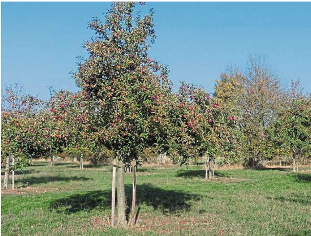
Auch Streuobstwiesen können mit Förderung des Landkreises entstehen.

Der Fördertopf wird aus Ersatzzahlungen gespeist, die