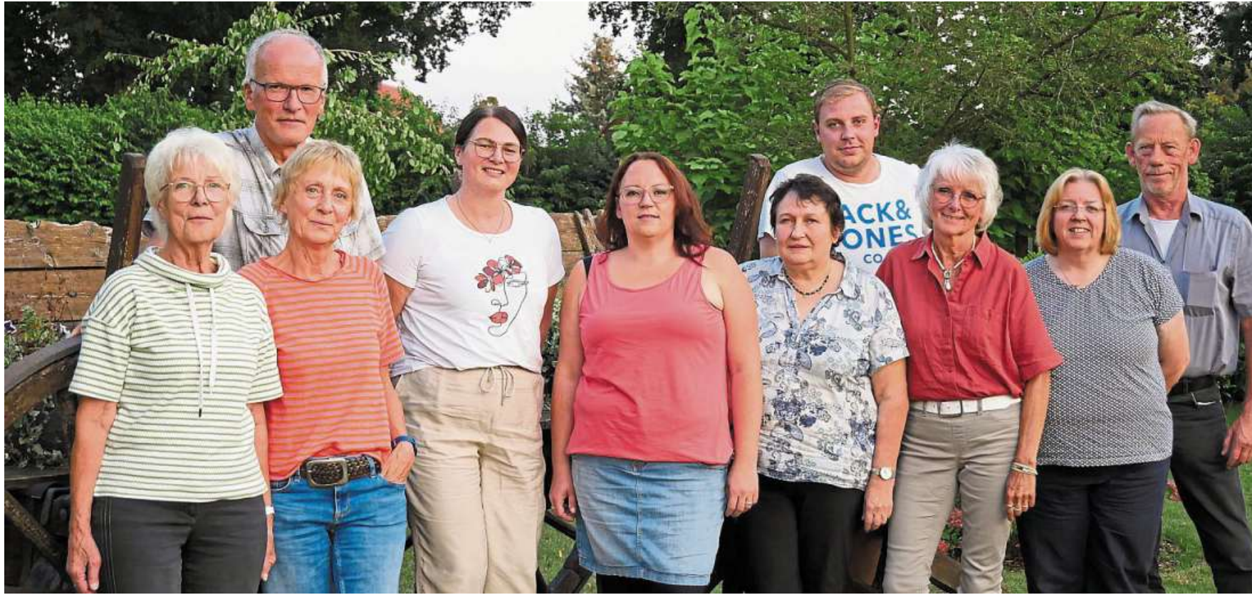
Die Theatergruppe Bahrenborstel in „zivil“.

Theatergruppe Bahrenborstel sorgt mit plattdeutscher Komödie für gute Laune