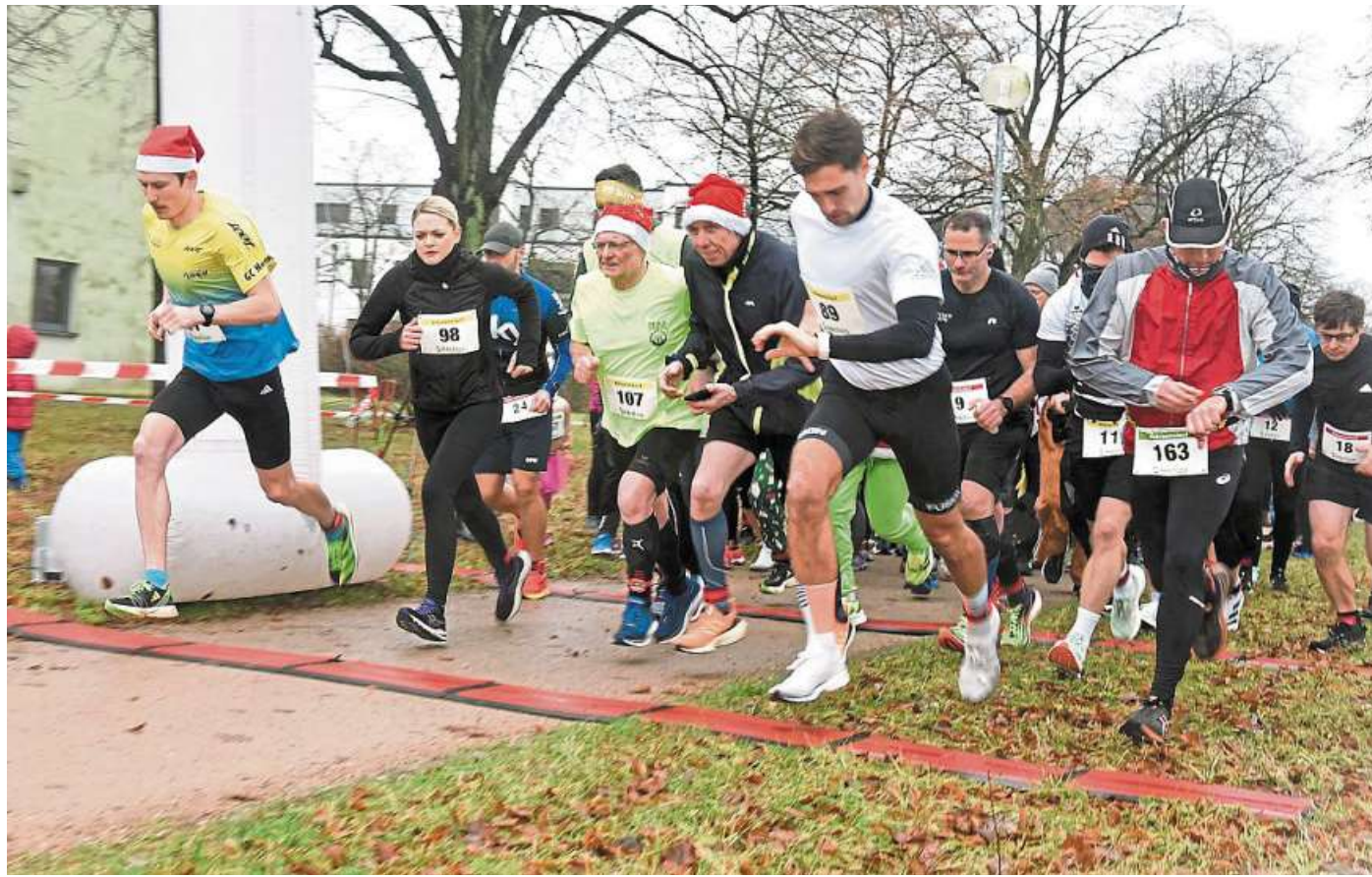
Der Countdown läuft: Am 1. Dezember findet in Nienburg wieder der Helios-Adventslauf statt.

Für die Kinder ist es durch die erlebten Traumatisierungen oft schwierig, Vertrauen zu Menschen fassen, vor allem fällt es aber schwer sich auf das Lernen und den Unterricht zu konzentrieren. „Durch die heilpädagogische Förderung mit dem Pferd werden eine Vielzahl von Entwicklungsbereichen wie Motorik, Wahrnehmung, Kognition, Sprache,