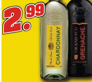
Fotos: willeke.de • Abbildungen nicht verbindlich • Angebote nur in Geschäftsbereich Nienburg • Nur solange der Vorrat reicht • 10/24