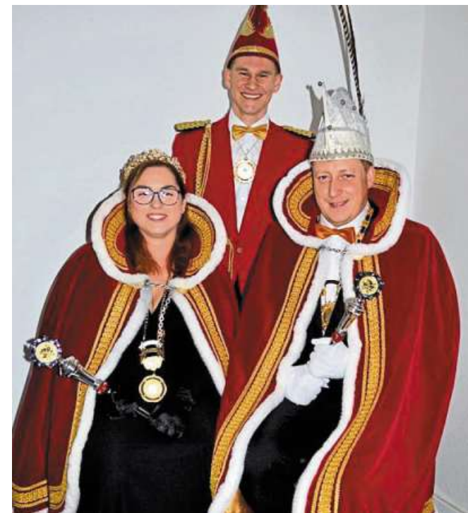
Stolzenaus Prinzenpaar freut sich auf motivierte närrische NachfolgerInnen.

Info Die Veranstaltung wurde durch den Verein Niedersächsischer Bildungsinitiativen e.V. unterstützt.