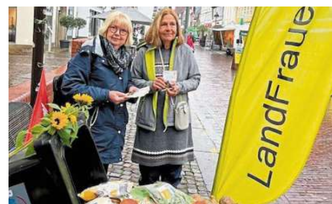
Lebensmittel gehören nicht in den Müll. Darauf machten die Landfrauen auf dem Wochenmarkt aufmerksam.

31628 Landesbergen Brokeloher Straße 8-12 Tel 05025 89-260 www.heineking-raumgestaltung.de Besuchen Sie unseren Online-Teppich-Fachmarkt: HEINEKING 24 Fachmarkt für Raumgestaltung