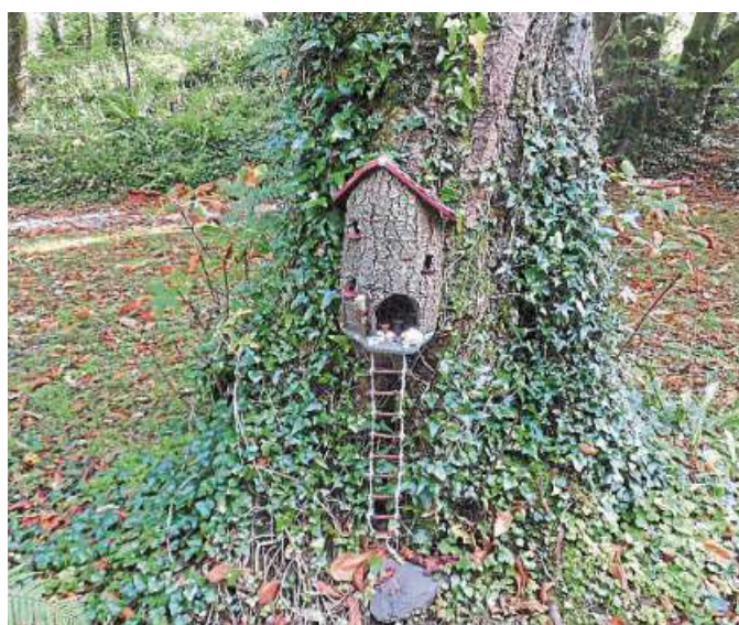
Auch kleine Exkursionen in die Natur sind vorgesehen bei dem Rauzwi-Ferienprojekt.

Wenn es draußen neblig und kalt wird, versammelt man sich am warmen Ofen und lauscht den vielfältigen Abenteuer Geschichten, die in ferne Länder und vergangene Zeiten entführen. „Wir wollen eine Woche lang, jeweils von 9 Uhr bis 16 Uhr, kreativ werden, spannende Geschichten im Erzähltheater präsentieren