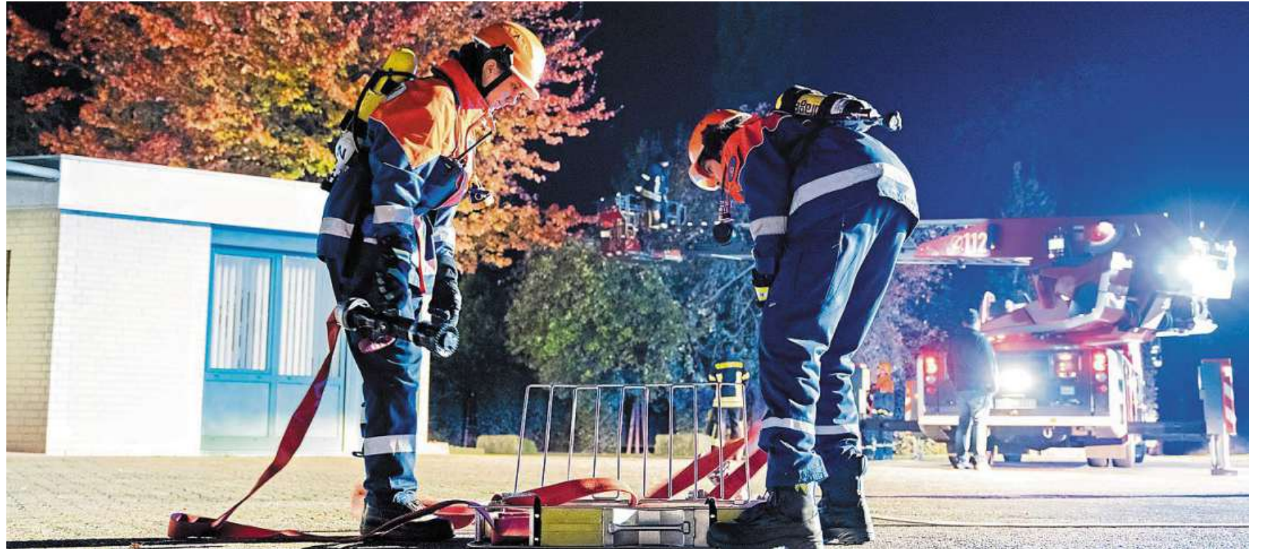
Nienburgs Feuerwehr-Nachwuchs hatte beim Action-Wochenende allerlei Katastrophen zu meistern.