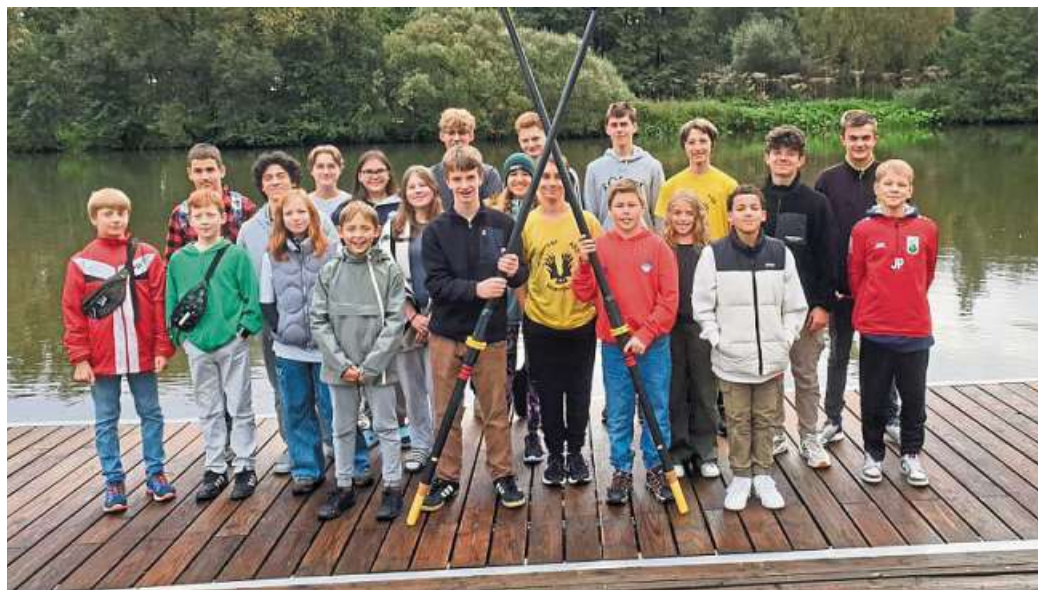
Viel Spaß trotz Schietwetter: die ASS-Ruderriege in Wilhelmshausen.

Am Montag wurde in allen verschiedenen Bootsklassen gerudert, wobei häufig die Größeren mit den Kleineren in