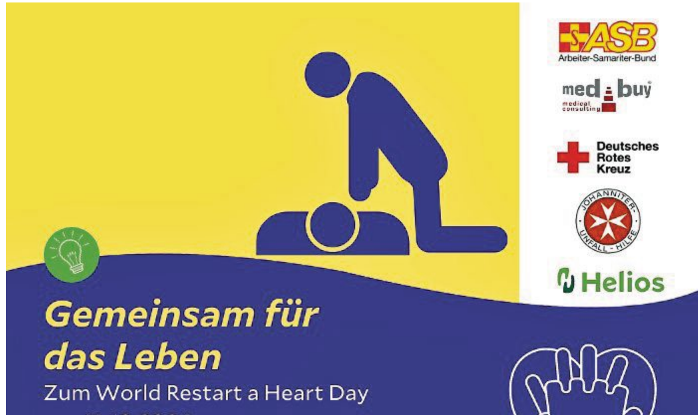
Lernen, Leben zu retten: Das geht am 16. Oktober auf dem Nienburger Wochenmarkt.

Der Deutsche Rat für Wiederbelebung ruft dazu auf, öffentlichkeitswirksame Aktionen zu initiieren, um das Thema Reanimation ins Zentrum der Aufmerksamkeit zu rücken. Die Helios Kliniken Mittelweser, im Zusammenarbeit mit dem Deutschen Roten Kreuz, der Johanniter-Unfall-Hilfe, dem Arbeiter-Samariter-Bund sowie der Firma Medbuy, haben diesen Aufruf in die Tat umgesetzt.