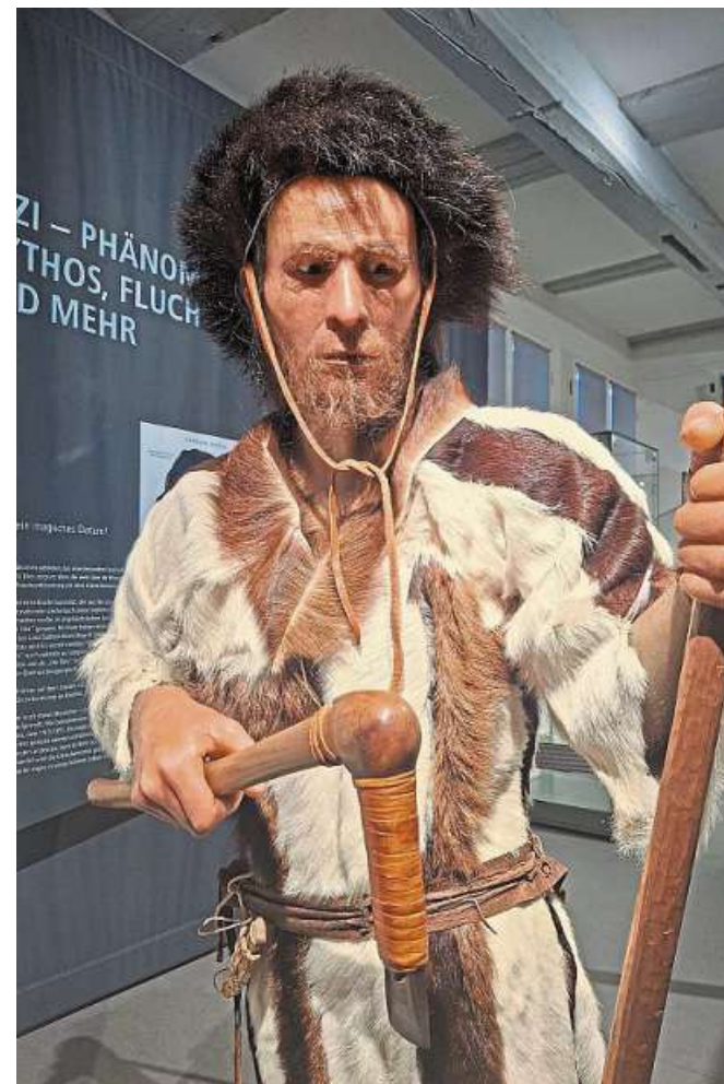
Mittelpunkt der Ausstellung ist die Rekonstruktion von Ötzi, dem Mann aus dem Eis.