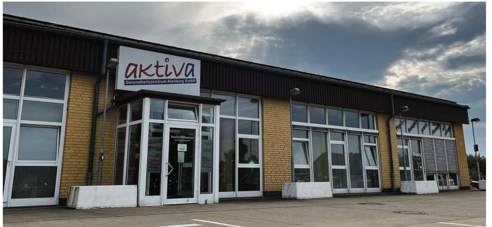
Das aktiva Gesundheitszentrum im Meerbachbogen lädt anlässlich seines 20-jährigen Bestehens zum Tag der offenen Tür ein.

Was misst die InBody-Körperanalyse? Innerhalb von einer Minute wird Ihre gesam-