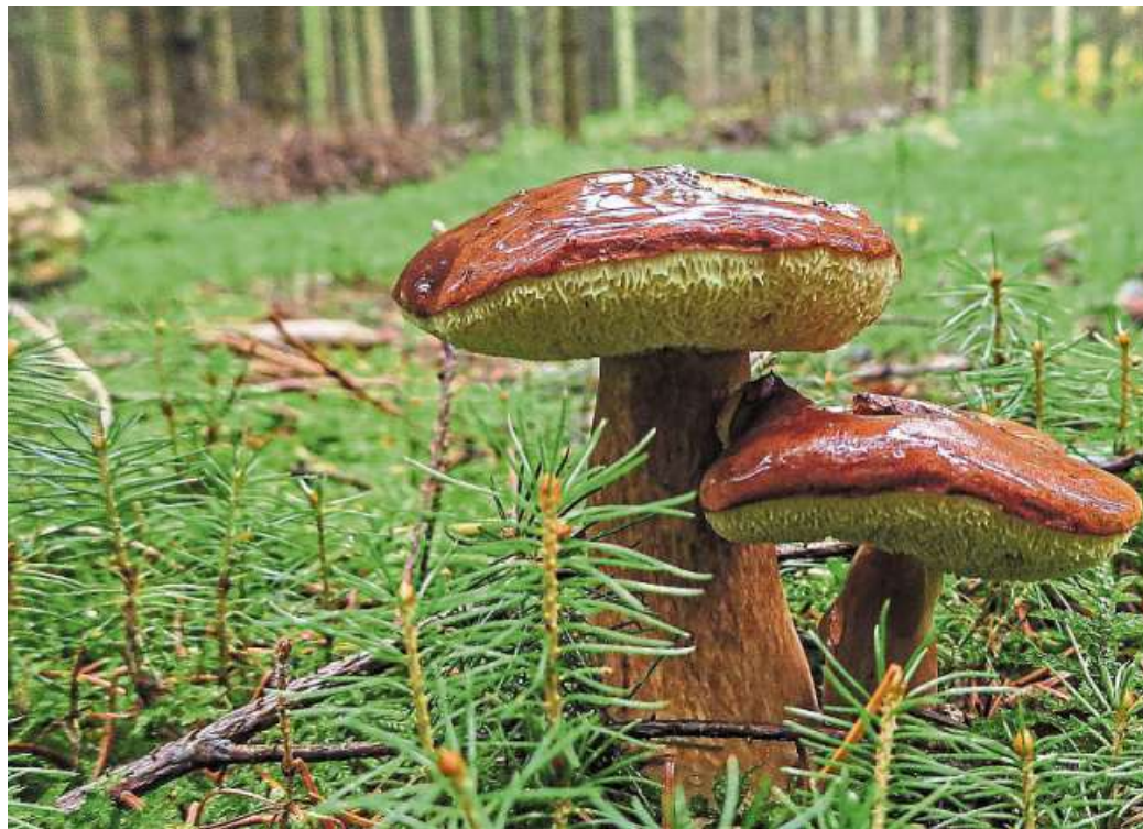
Unverkennbar: die Marone.