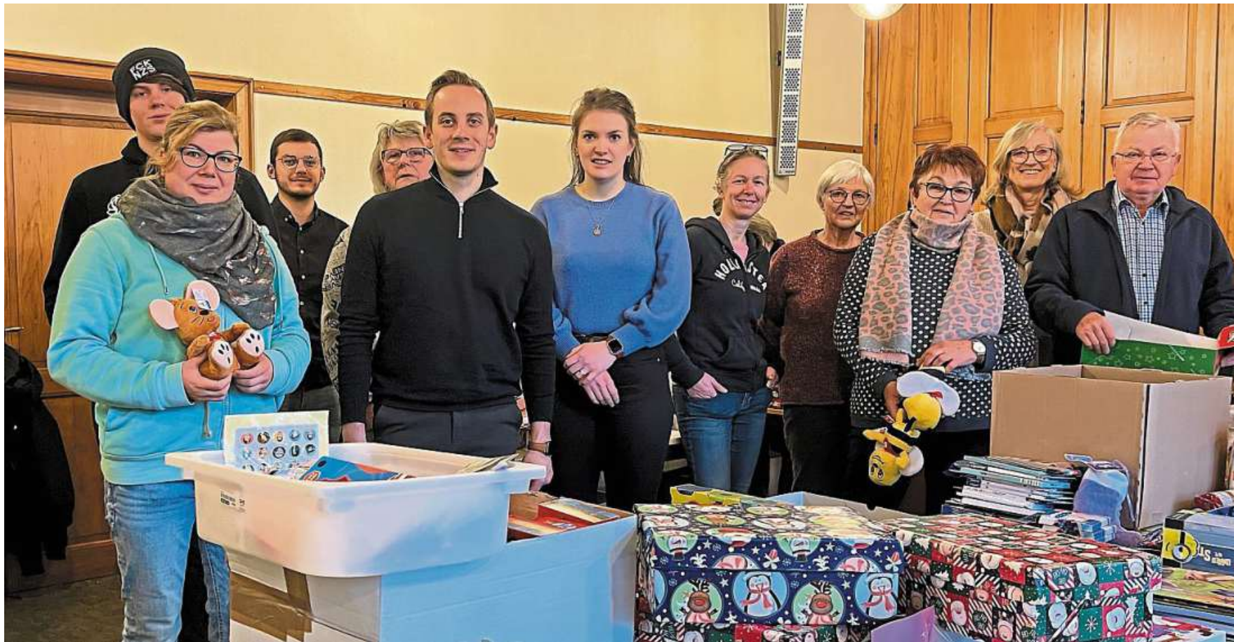
Fast 1000 Päckchen sind im vergangenen November von Langendamm aus auf die Reise geschickt worden.

Im Landkreis Nienburg startet wieder die Aktion „Weihnachten im Schuhkarton“