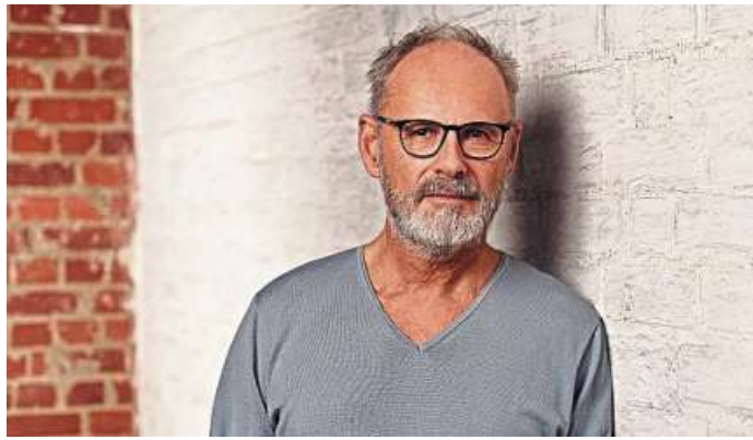
Reinhold Beckmann liest am 23. November in der Wietzener Kirche aus seinem Buch „Aenne und ihre Brüder“.

Wietzen. Reinhold Beckmann, 1956 in Twistringen geboren, ist Journalist, Autor und Musiker. Dem Fernsehpublikum ist er vor allem als jahrzehntelanger Sportschau-Moderator bekannt und aus seiner wöchentlichen Talkshow, in der es um politische Themen ging. Mit seinem Erstlingswerk „Aenne und ihre Brüder“ schaffte es der 68-Jährige direkt und monatelang auf die Bestseller-Listen. Jetzt ist es dem Dorfkulturkreis Wietzen gelungen, ihn für eine Lesung in die St. Gangolf-Kirche zu holen