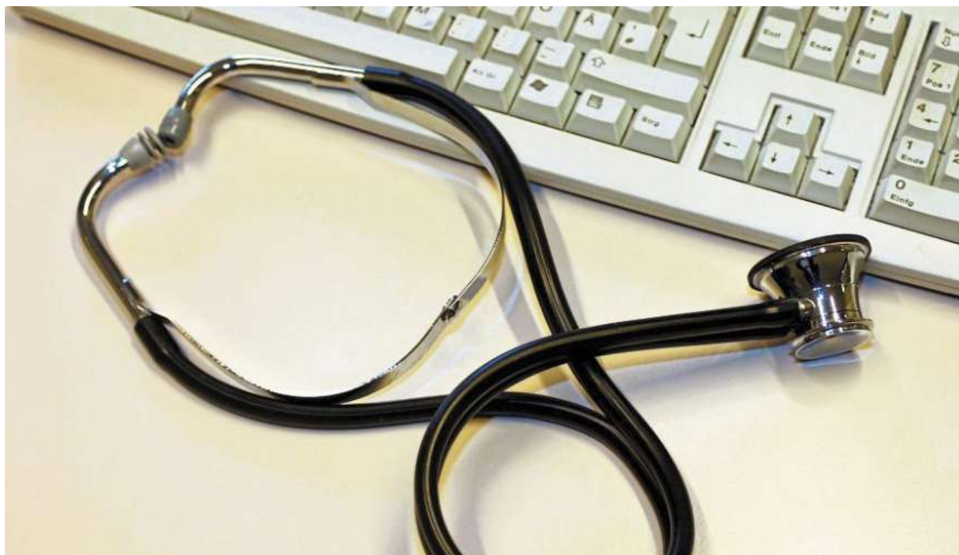
Der Landkreis vergibt auch in diesem Herbst Stipendien für angehende (Land-) Ärzte.