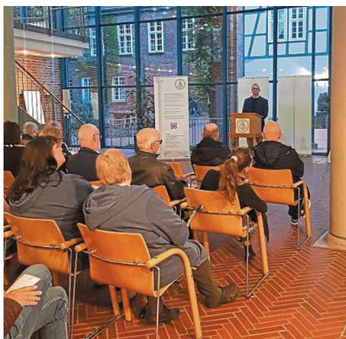
Rund 40 Interessierte waren zu dem Vortrag über die Freimaurerei ins Vestibül des Nieburger Rathauses gekommen.