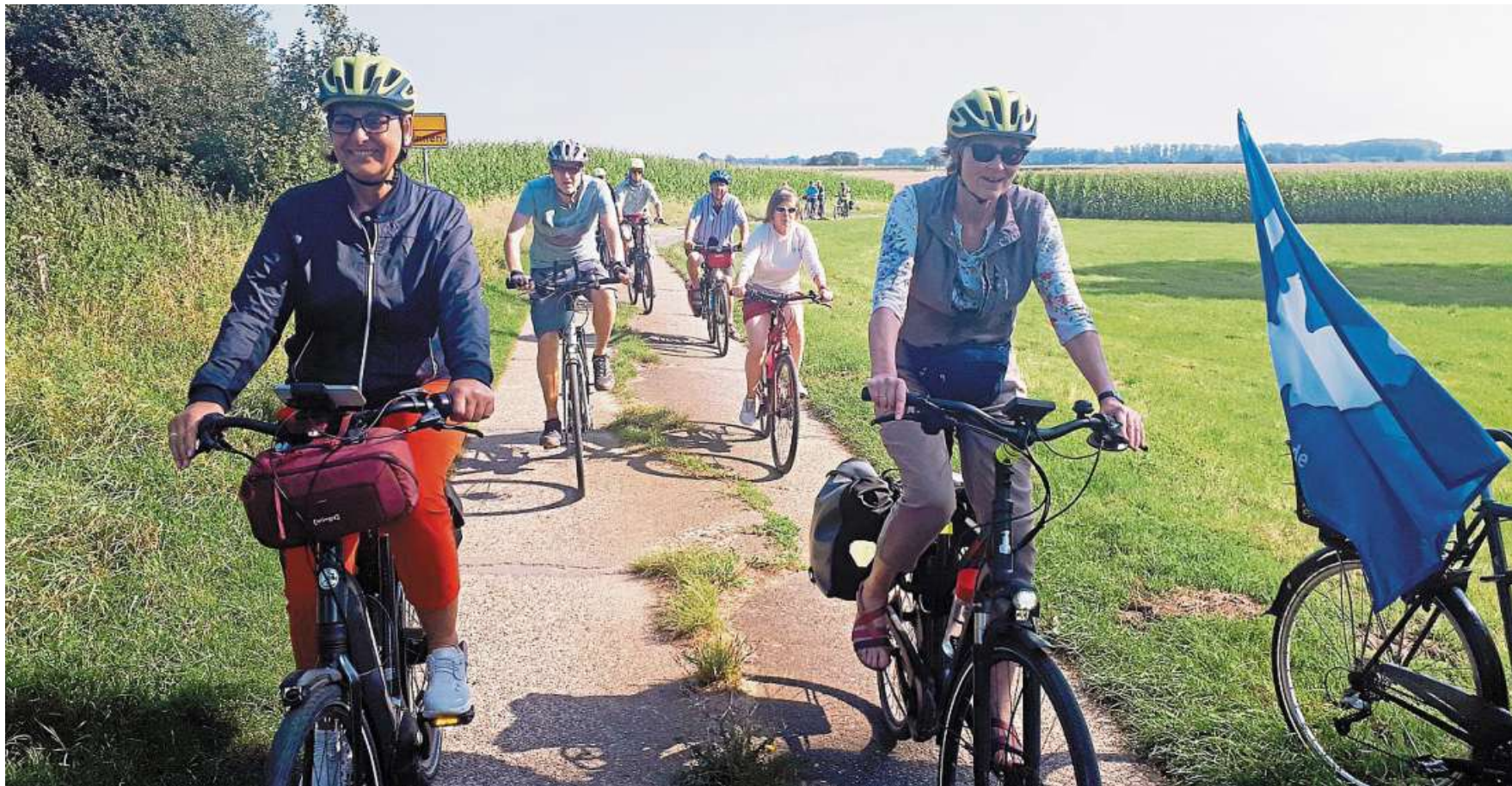
Mit zahlreichen gemeinschaftlichen Radtouren sorgte das Bündnis „Radeln für eine Verkehrswende“ für eine gute Beteiligung auch beim Stadtradeln, wie zum Beispiel bei der Radtour der Naturfreunde mit dem DGB am Antikriegstag zur Dokumentationsstelle Pulverfabrik Liebenau.

Bündnis radelte drei Wochen für eine Verkehrswende