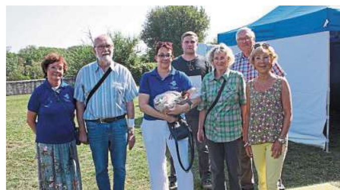
Die Delegation aus Nienburg/Weser beim Kultur- und Sporttag in Nienburg/Saale.

Von der Weser war eine Delegation bestehend aus