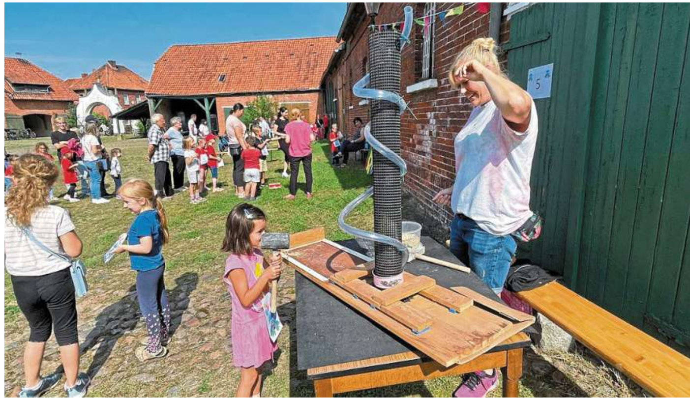
Auch das Erbsenspiel machte den Kindern viel Spaß.

Bei bestem Wetter konnten Kinder von klein bis groß ihr Können an mehreren Spielstationen unter Beweis stellen. Hier galt es mit Geschick, Ausdauer und auch mal ein wenig Kraft die einzelnen Stationen zu bewältigen. Als Belohnung für ihren unermü-