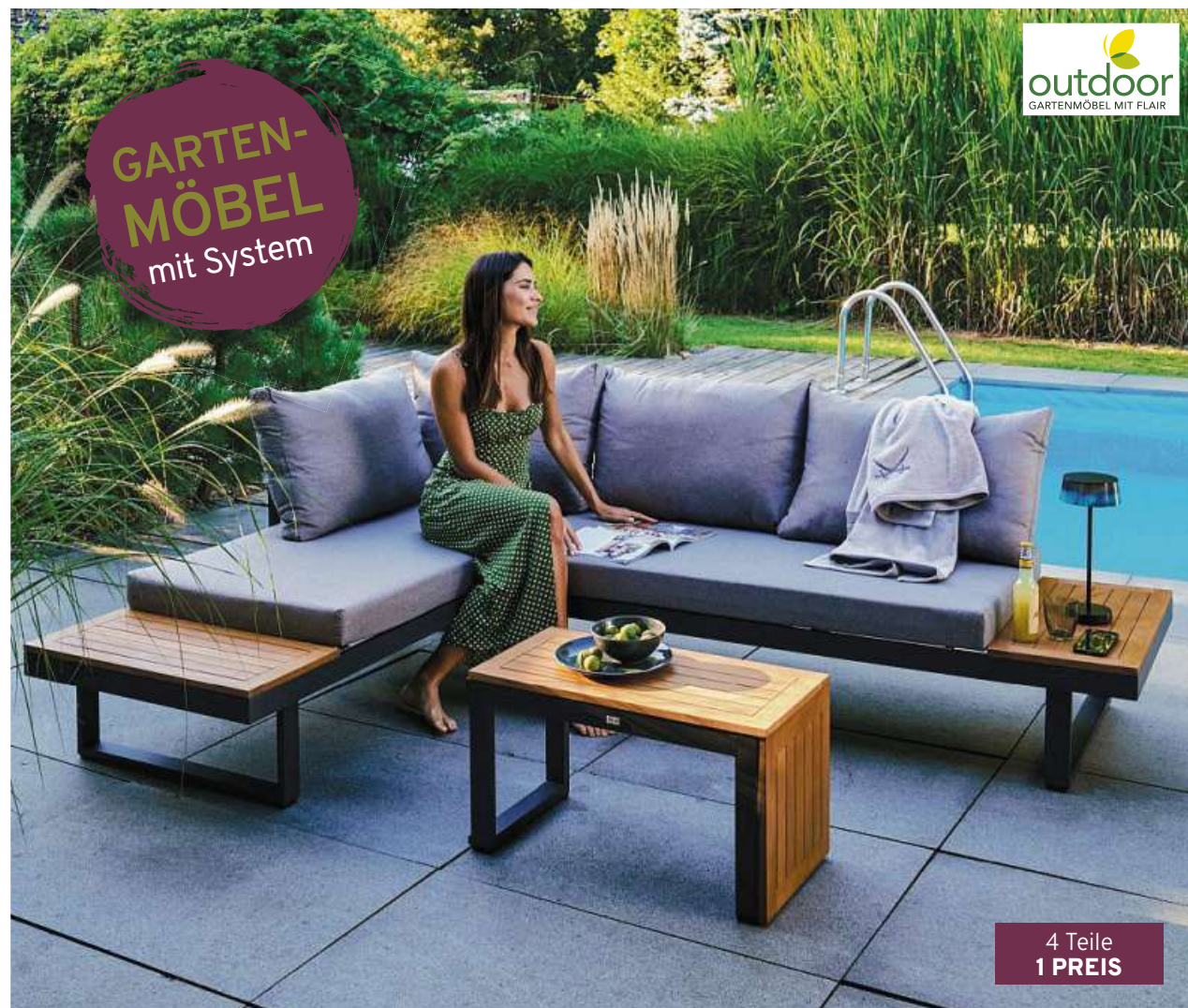
LOUNGE-SET, 2x Doppelsitzer-Sofa mit Beistelltisch BxHxT ca. 175x70x78 cm, 1x Couchtisch BxHxT ca. 70x40x40 cm. Inklusive Sitz- & Rückenkissen. 69010039 00 | Abholpreis

Entdecken Sie die größte Auswahl an Gartenmöbeln in der Region!