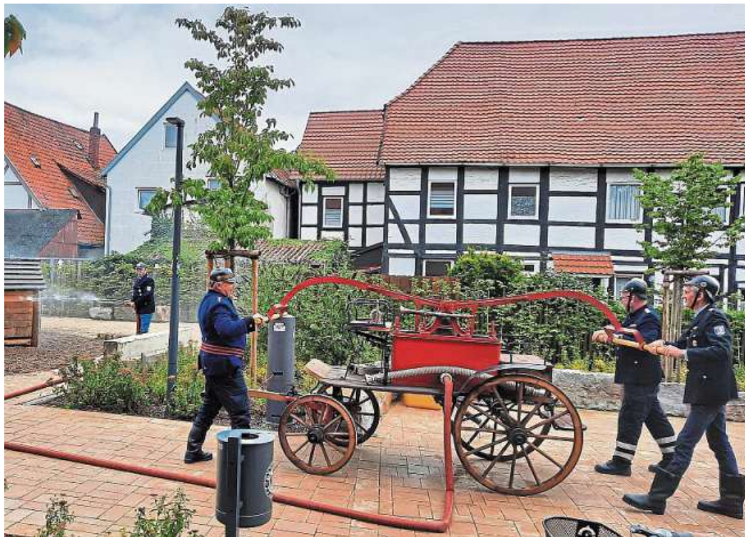
Die Feuerwehr zeigte sich und ihr Können, vor allen Dingen auch viel Historisches, am Museum in Stolzenau.

Die Feuerwehr bot vor dem Museum Bratwurst und Kaltgetränke an und der Heimatverein im Museum Kaffee und Butterkuchen; so war für alle