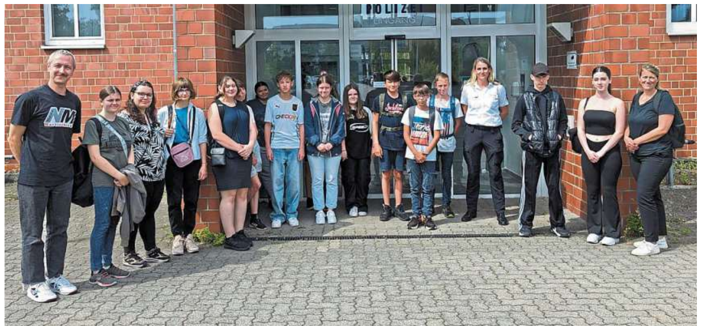
Auch die Polizei war Ziel einiger Schüler und Schülerinnen.