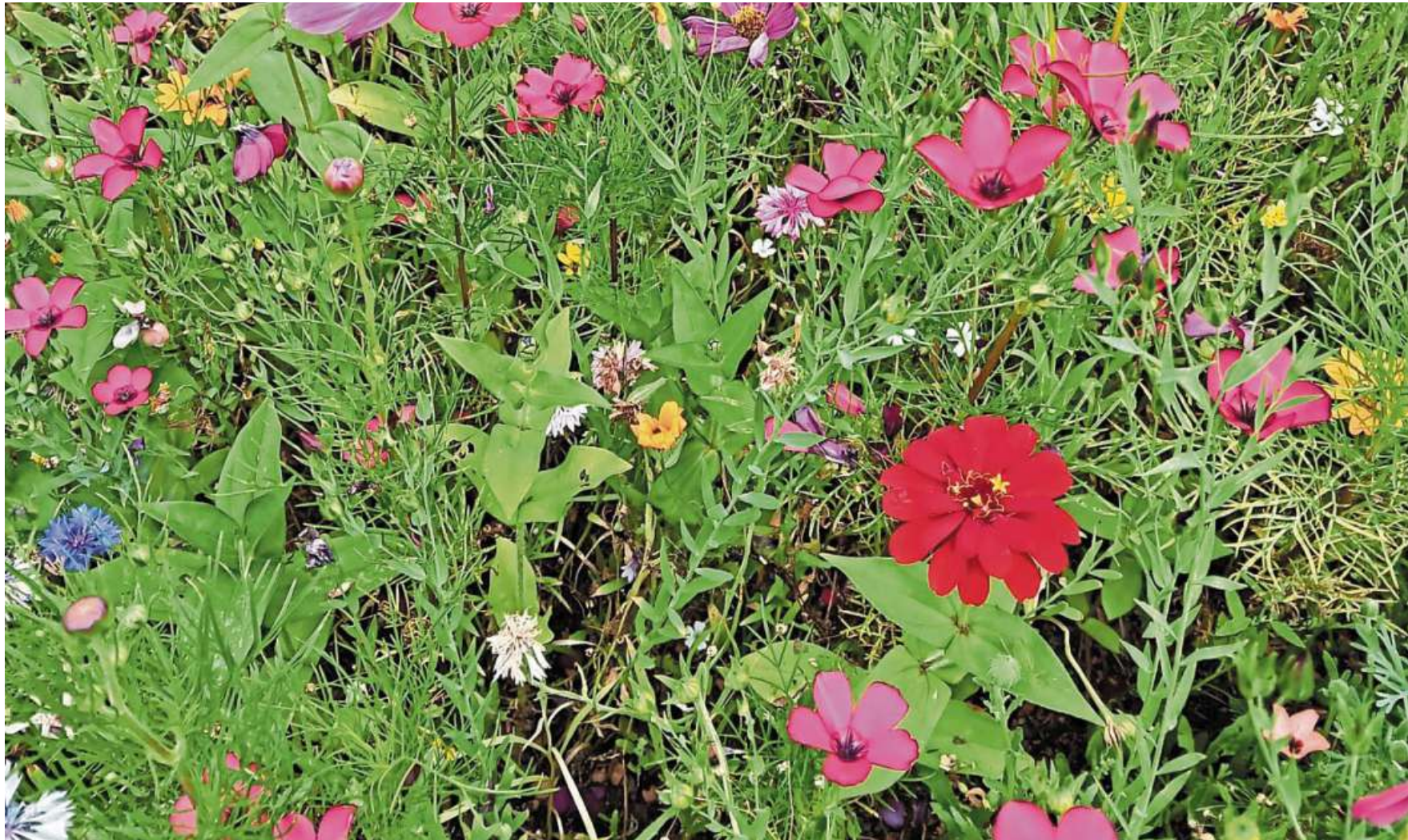
Auch Blumenwiesen tragen zur Artenvielfalt bei.