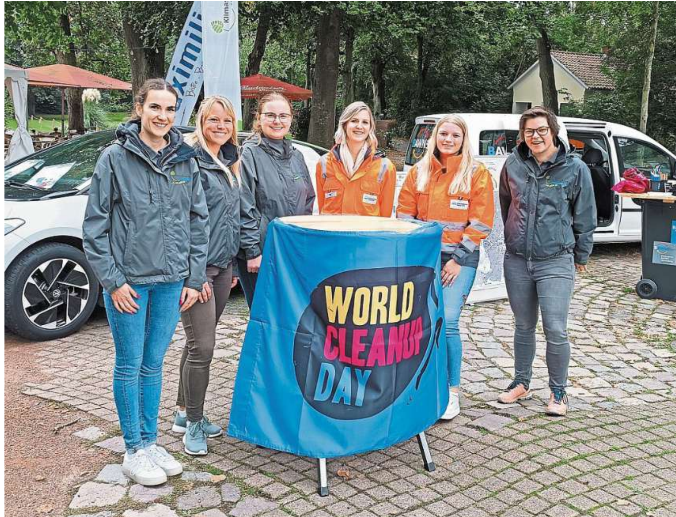
Das Organisationsteam des World Cleanup Days aus dem Vorjahr von Klimaschutzagentur und BAWN.

Die Maßnahme wird in mehrere Bauabschnitte unterteilt. Für den ersten Abschnitt wird der Abschnitt von der „Alten Celler Heerstraße“ bis nach Rodewald komplett gesperrt. Dort werden im Rahmen von ersten Arbeiten Asphalt abgefräst und die Durchlässe saniert. Während der Umsetzung bleibt die Zufahrt zur „Alten Celler Heerstraße“ von Steimbke aus möglich. Voraussichtlich ab Dienstag, 10. September, wird der Streckenabschnitt dann neu asphaltiert. Zeitgleich wird das weitere Vorgehen abgestimmt. DH