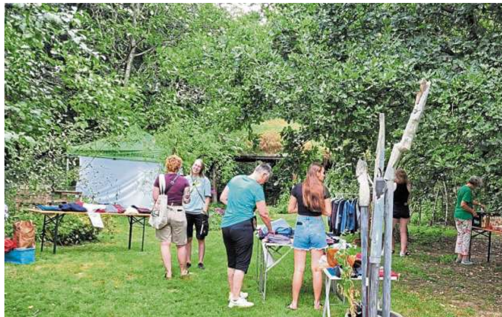
Der Kleidertausch samt Begleitprogramm kam gut an.

Zudem möchte die BUND-Jugend zu folgenden Terminen einladen: 30. August: Critical Mass, Treffpunkt am Goethe-