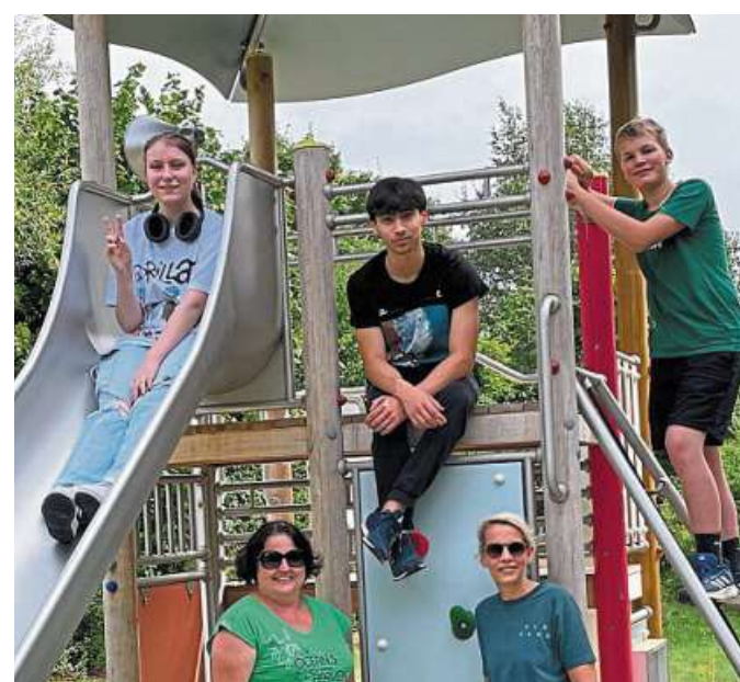
Bei Kaiser & Kühne probierte sich eine Gruppe aus.

Die Jugendlichen konnten im Vorfeld aus einer Auswahl von acht Betrieben wählen, die sie aufgrund ihrer individuellen Interessen besonders ansprachen. Zur Unterstützung dieser Wahl erhielten sie einen Wahlbogen, auf dem die Ausbildungs- und Studienberufe der jeweiligen Betriebe sowie eine kurze Beschreibung der dortigen Tätigkeiten aufgeführt waren. Diese Gelegenheit nutzten die Jugendlichen, um mehr über verschiedene Berufsfelder zu erfahren und ihre beruflichen Interessen zu vertie-