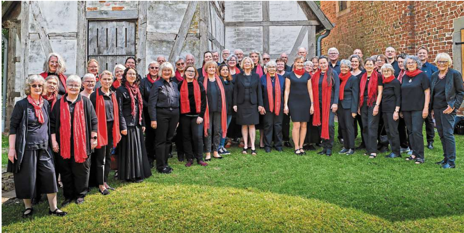
Probenwochenende der Chöre in Schinna

Der Eintritt ist frei, es findet ein Kaffee- und Kuchenverkauf statt. DH