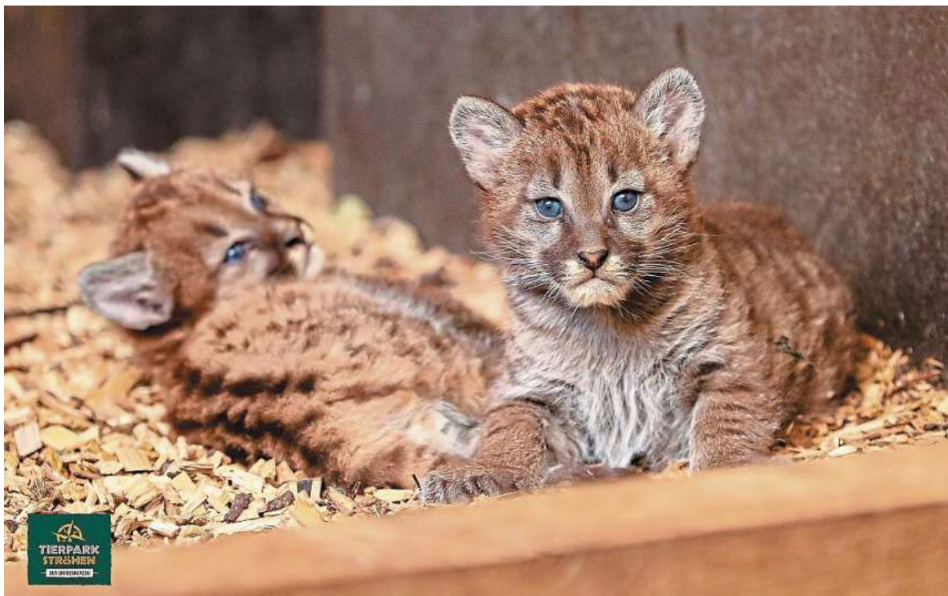
Zuckersüße Puma-Zwillinge: Im Tierpark Ströhen hat es Nachwuchs gegeben.

Tierpark Ströhen lädt dazu ein, mehr über die Tiere zu erfahren