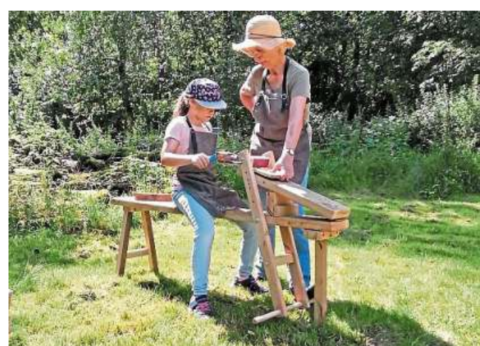
Holz bearbeiten wie im frühen Mittelalter: Das geht noch einmal beim Workshop des Vereins „Rauzwi“ am kommenden Sonntag auf dem Freigelände zwischen Liebenau und Steyerberg.

Mit Dechsel und Zieheisen wird Holz in eine neue Form gebracht, um uns einen Begriff davon zu geben, wieviel Zeit und Sorgfalt es braucht, um werthaltige Arbeiten, zum Beispiel für den Hausbau, mit den frühmittelalterlichen