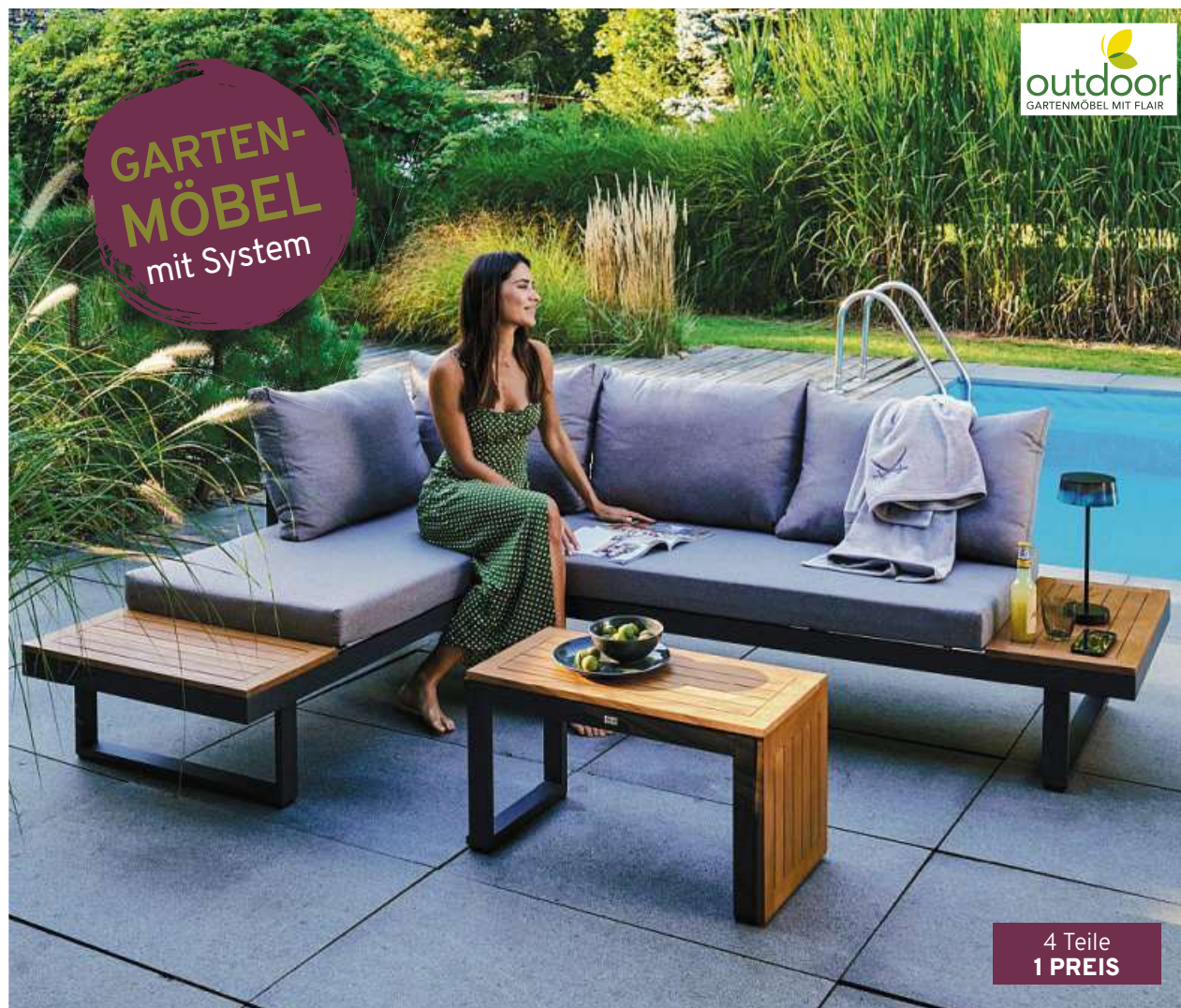
LOUNGE-SET, 2x Doppelsitzer-Sofa mit Beistelltisch BxHxT ca. 175x70x78 cm, 1x Couchtisch BxHxT ca. 70x40x40 cm. Inklusive Sitz- & Rückenkissen. 69010039 00 | Abholpreis

Entdecken Sie die größte Auswahl an Gartenmöbeln in der Region!