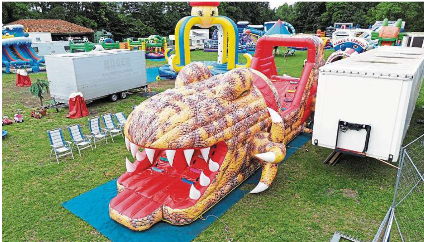
Der „Fun City Park“ auf der Nienburger Festwiese aus der Drohnenperspektive.

Hüpfburgenpark bietet 27 Meter langen Kletterparcours