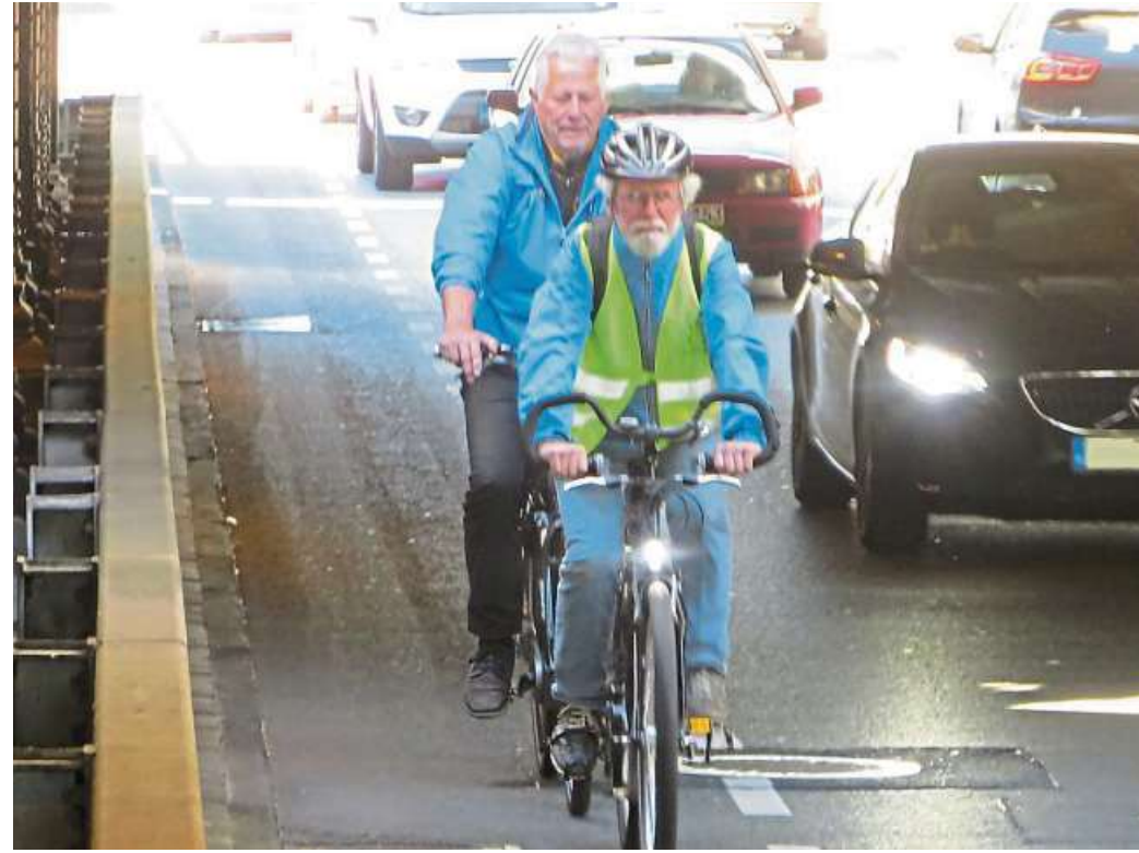
Für die Radfahrerinnen und Radfahrer ist die Durchfahrt durch den Tunnel Verdener Straße in Nienburg ein Graus.