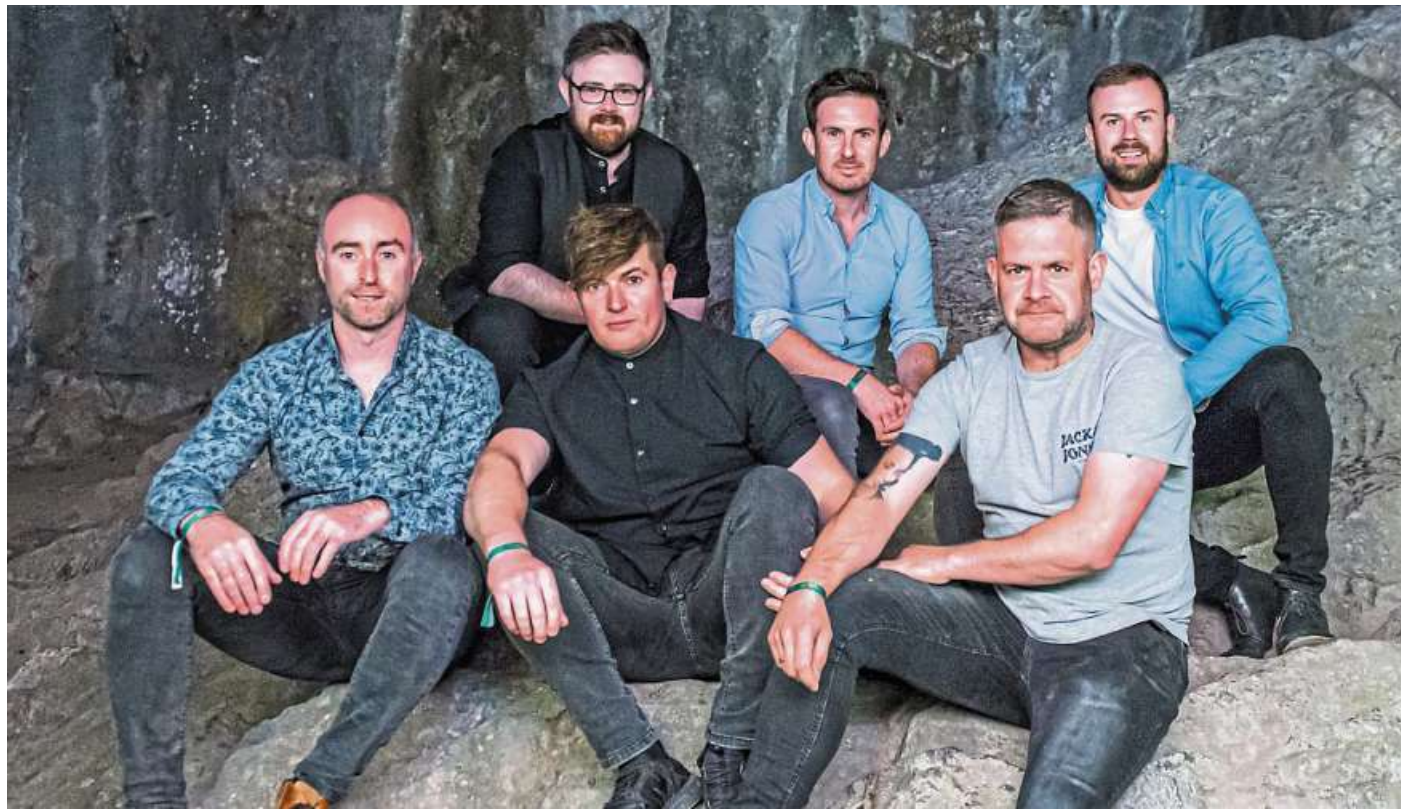
Werden extra aus Dublin eingeflogen: „Drops of Green“ aus Kilkenny/Irland.

Dann der Hauptact um 22 Uhr mit Drops and Green und im Anschluss eine gemeinsame Session der Musiker und