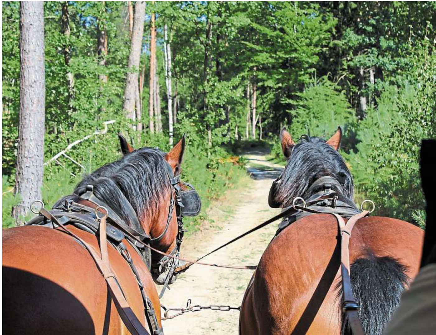
Die Mittelweser-Region ist ein Paradies für Pferd und Reiter. Auch Kutschfahrten können gebucht werden.