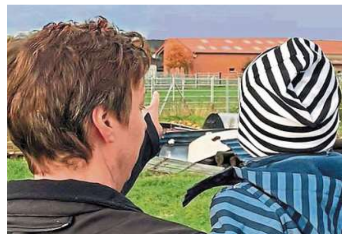
Eine Dorfhelferin im Einsatz.

Eine Anmeldung mit einer Einverständniserklärung der Eltern (zum Herunterladen auf der Internetseite www.vhs-nienburg.de oder erhältlich in der Volkshochschule) ist ab sofort möglich. DH