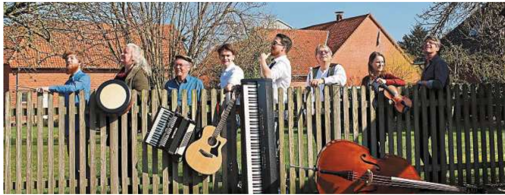
Natürlich auch dabei: die Hausband Old Chapel Five.