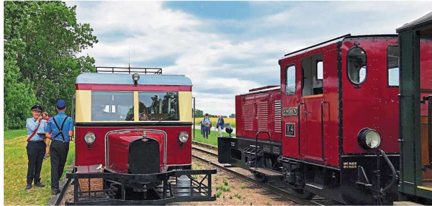
Das Foto zeigt eine Zugkreuzung zwischen dem Triebwagen T41 und der Diesellok V4 in Heiligenberg.

Für Fotofreunde wird wieder ein Fotopaket, unter ande-