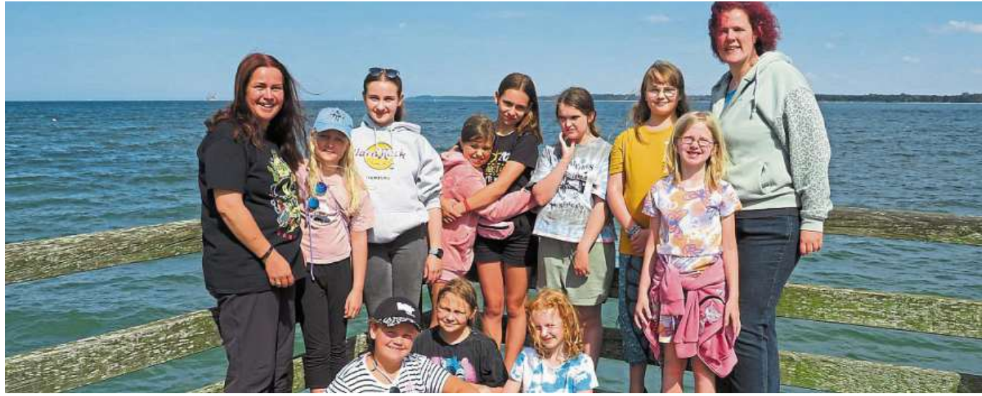
Auch in diesem Jahr machte sich eine Gruppe Mädchen aus dem Jugendhaus „House of Life“ auf den Weg zur Ostsee.

Am ersten Tag ging es nach Travemünde an die Ostsee. Bei strahlendem Sonnenschein wurde in der Ostsee ausgiebig geplänscht, Steine