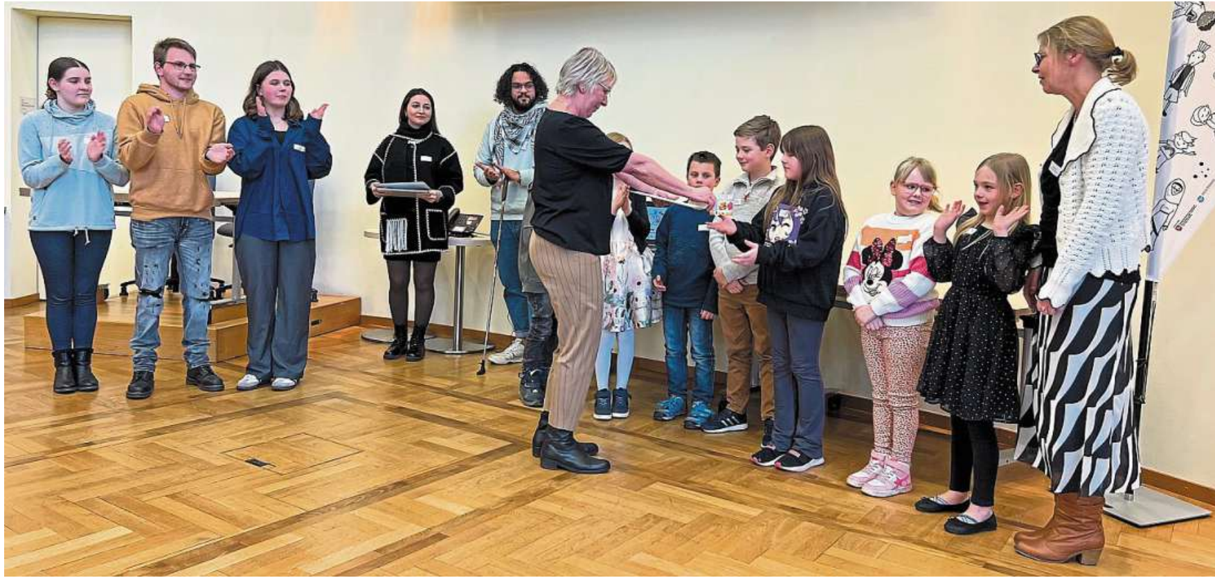
Standing Ovations für die Schülerinnen und Schüler der Grundschule Haßbergen: Bei der Auftaktveranstaltung der Wertschätzungskampagne im Landkreis Nienburg hatten sie passend zum Thema Wertschätzung einen Poetry-Slam vorgetragen.

Am 7. August, also nach der Sommerpause, werden die Kinder der Schule an zwölf verschiedenen Stationen die Arbeit, die Projekte und die Besonderheiten dieser kleinen Schule darstellen. Die Schule wird derzeit von 83 Kindern