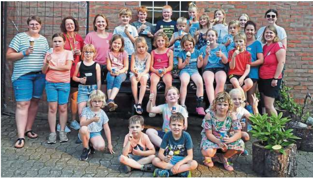
Auch in diesem Jahr hatte der TSV Essern eine tolle Ferienaktion auf die Beine gestellt.

So gestärkt ging es zur Schnitzeljagd quer durch den Ort und der „Schatz“ war doch tatsächlich in Verenas