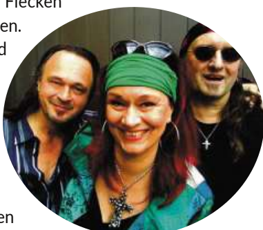
„It's M.E.“

Auch am Abend des 01. Juni 2024 erwartet Sie großartige Musik und Feierstimmung an der Remise. Die offizielle Eröffnung findet am Samstag, den 01. Juni 2024 um 14 Uhr ebenfalls an der Remise statt. Zu diesem Anlass wird Bürgermeister Marcus Meyer auch das neue Gewerbeflächenentwicklungskonzept präsentieren.