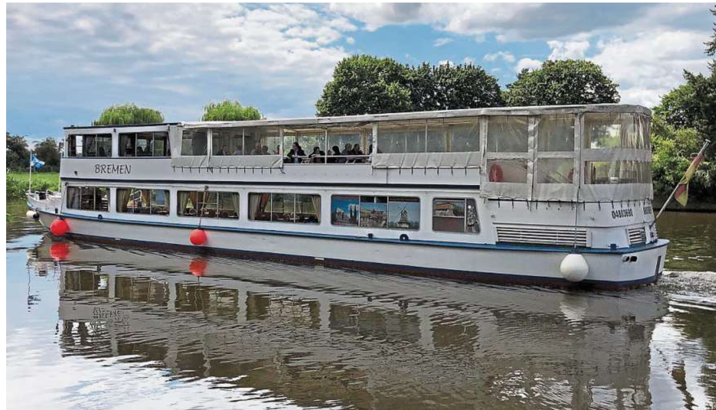
Die Flotte Mittelweser bietet auf den Fahrgastschiffen „Bremen“ und „Stadt Verden“ vielfältige Weserfahrten an.

■ Am Donnerstag, 20. Juni, geht es um 9:30 Uhr einfach nach Verden. Zugebucht werden kann ein Frühstücksgedeck oder auch ein Grillbuffet. Die Ankunft in Verden ist um 14:30 Uhr. Bitte beachten Sie, dass eine Rückfahrt nach Nienburg nicht stattfindet.