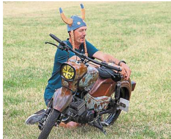
Gute Laune ist garantiert vom 21. bis 23. Juni in Eiße.

■ Die Teamspiele BAD-Games werden von „Moin BOSS!“ gestaltet. Hier nehmen 16 Teams teil und duellieren sich in einem spannenden