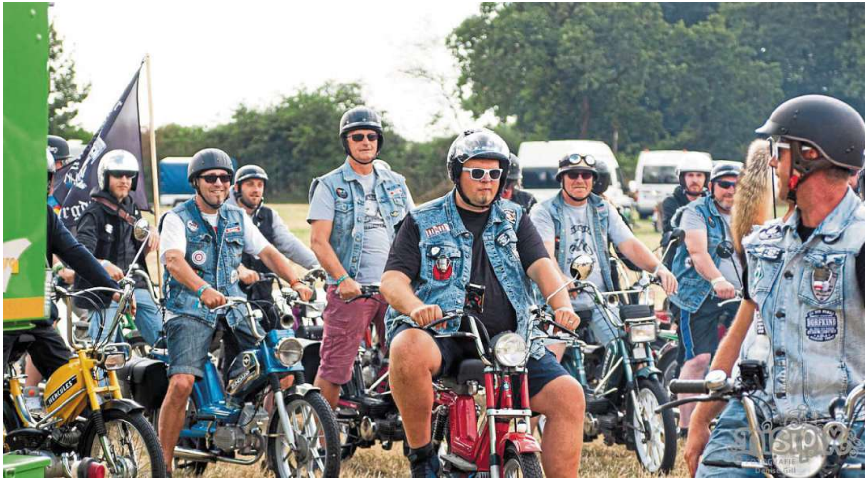
Die Mofa-Rallye startet am Sonntag um 12.12 Uhr. Anmeldungen sind noch möglich.

Vom 21. bis 23. Juni Erlebnis-Wochenende in Niedersachsens geografischer Mitte