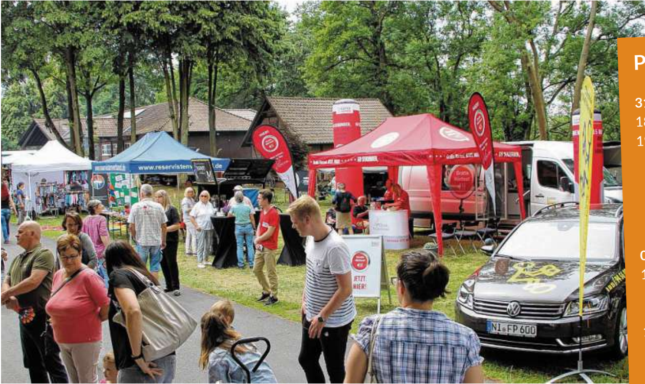
Zuletzt fand die Gewerbeschau in Steyerberg vor sechs Jahren statt – an diesem Wochenende ist es nun wieder soweit.