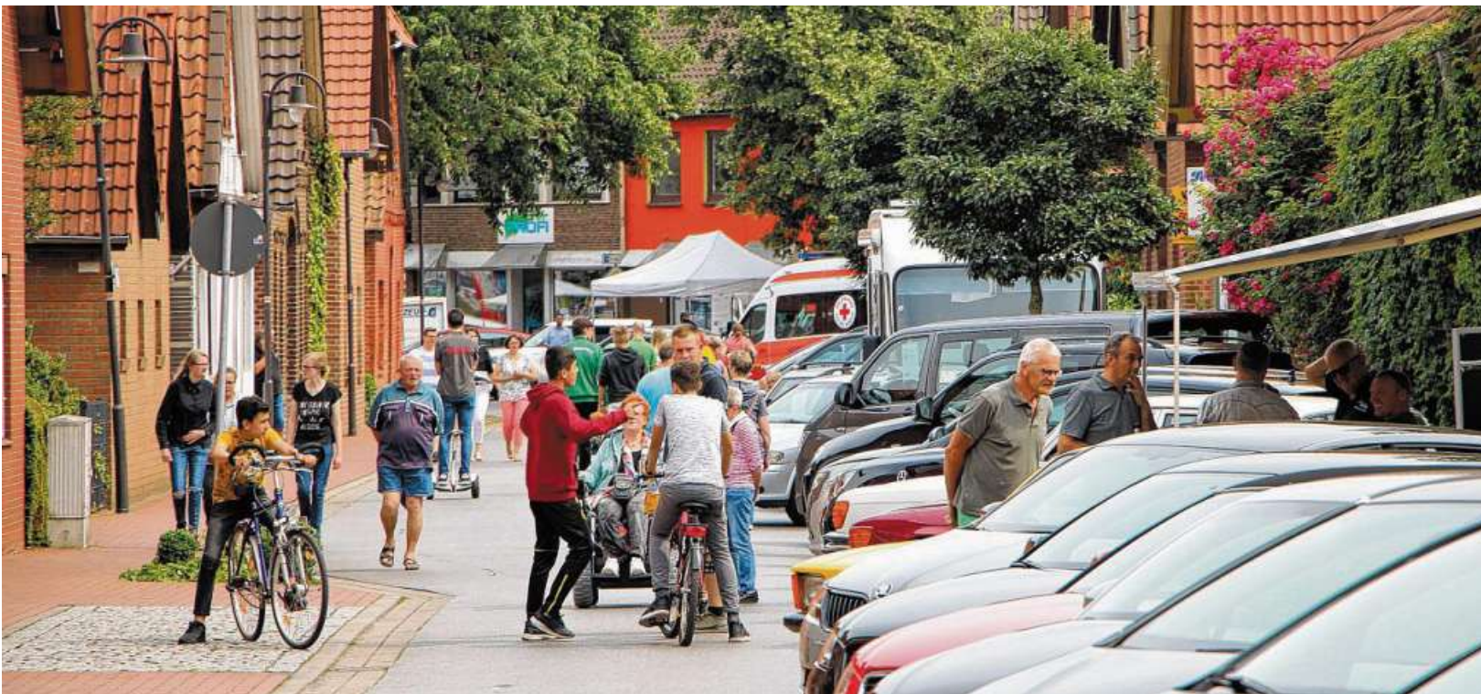
Eine Autoschau wird es am Samstag und Sonntag auch wieder geben.

02. Juni 2024 10 Uhr Gottesdienst Unter der Remise 11-18 Uhr Gewerbeschau 14 Uhr Shantychor Nendorf