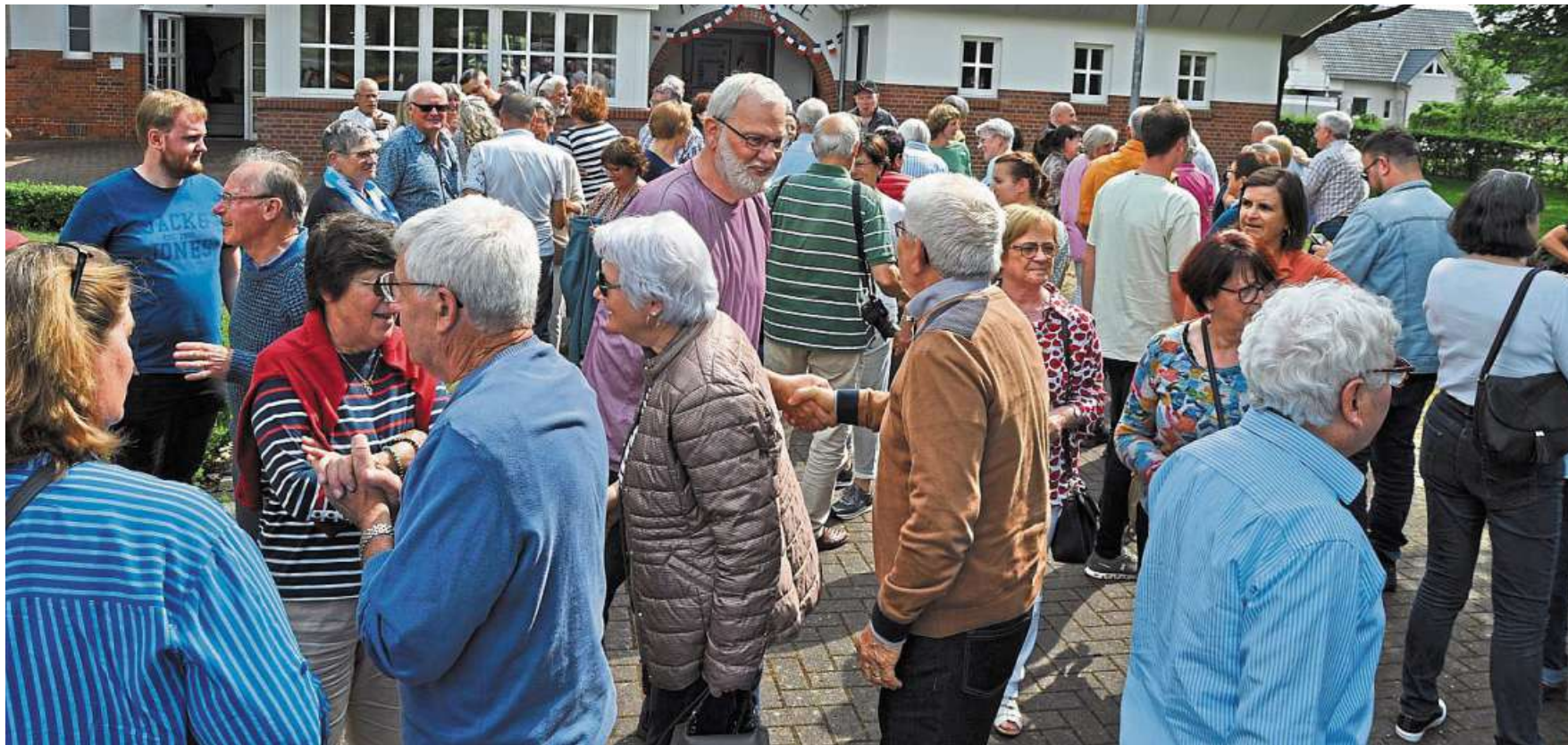
Mit einem großen „Hallo“ wurden die französischen Gäste am Freitagnachmittag vor der Alten Schule in Rohrsen begrüßt.

Heemsen hatte wieder Besuch aus der französischen Partnergemeinde Véron