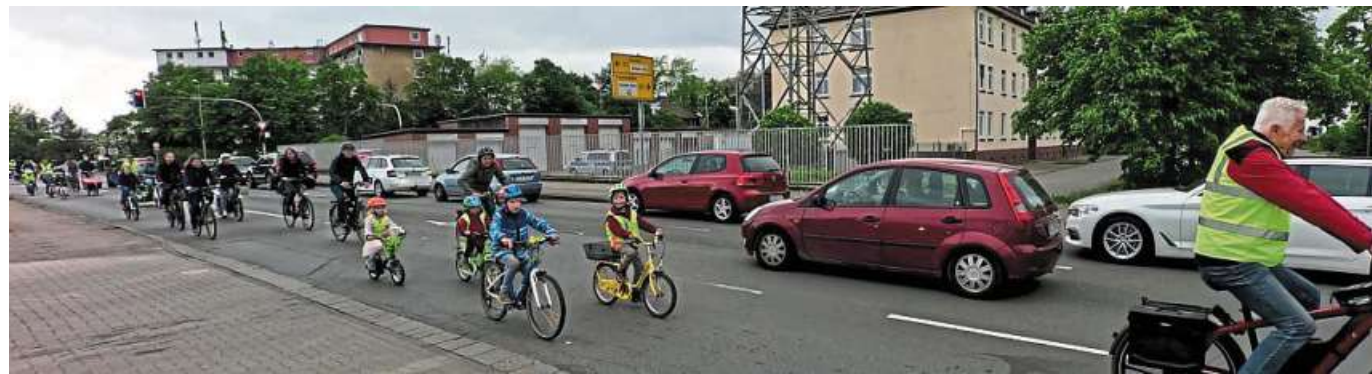
Sicherere Radwege für Kinder und Jugendliche: dafür macht sich die Kidical Mass stark.

„Kidicals Mass“ eroberte Nienburgs Straßen