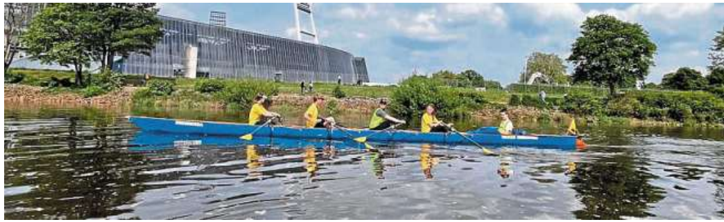
Mitglieder der Ruderriege vor dem Bremer Weserstadion.

Nienburg/Bremen. Die Weser im Weserbergland von Zusammenfluss von Werra und Fulda bis nach Holzminde oder gar an einem Tag bis nach Hameln mit Ruderbooten zu erfahren ist ein Traum. Die Weser, die man in Nienburg vor lauter Bäumen und Büschen an vielen Stellen gar nicht betrachten kann, von Landesbergen bis nach Drakenburg ruderisch zu erkunden ist jeder Nienburgerin und jedem Nienburger nur zu empfehlen. So könnten sie einmal ihren Fluss wirklich erleben. Einmal mit Muskelkraft und der Hilfe der Strömung von Nienburg nach Bremen zu rudern bedarf dann guter Kondition und dem Glück, von Motorbootwellen verschont zu bleiben. Das