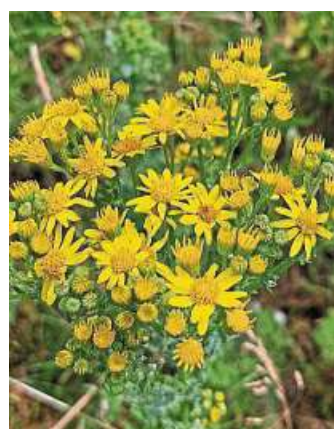
Gelb und gefährlich: das Jakobskreuzkraut.