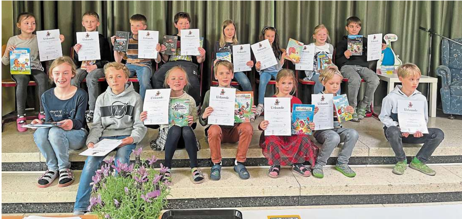
Fotoshooting auf der Bühne: die erfolgreichen Teilnehmerinnen und Teilnehmer des Lesewettbewerbs an der Grundschule am Bach.

Tolle Stimmung beim Vorlesewettbewerb der Grundschule am Bach