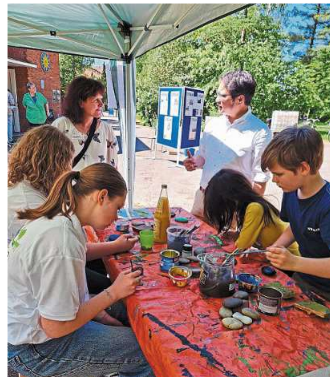
Viel zu tun und zu erfahren gab es beim Tag der Städtebauförderung im Nienburger Nordertor.

Alle Angebote gültig bis zum 11.06.2024 | 1) Finanzierung: Ab einem Einkaufswert von 500,- Euro. Laufzeit der Finanzierung jeweils 24 Monate, effektiver Jahreszins 0,0%, keine Gebühren. Weitere Laufzeiten auf Anfrage. Ein Angebot der TARGOBANK AG, Kassenstr. 10, 40213 Düsseldorf. Bonität vorausgesetzt. Gilt nur für Neuaufträge. | 2) Dauertiefpreis. Bereits im Verkaufspreis berücksichtigt. | Alles Abholpreis. | Ohne Deko. | *) Listenpreis