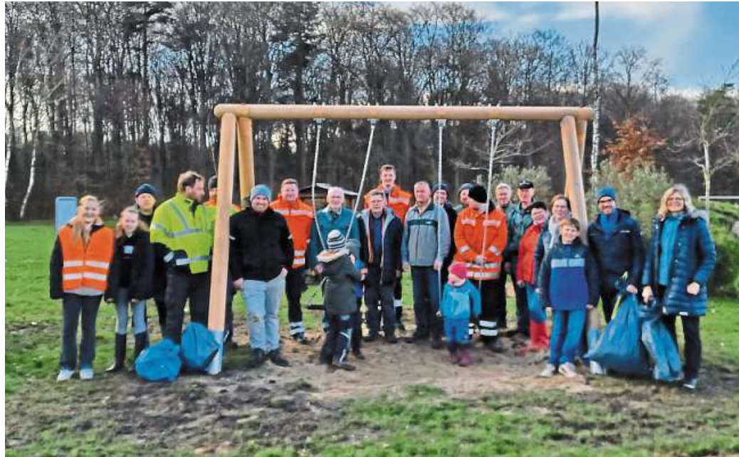
Müll gesammelt, Schaukel aufgebaut: der Frühjahrsputz in Holte-Langeln war dank des Einsatzes der Ehrenamtlichen ein voller Erfolg.

Der Dachverein der Holte-Langelner Vereine hatte eingeladen, das Dorf von Umweltverschmutzung und Plastikmüll aus Feld, Flur, Wald und von Straßen zu befreien. Viele der Ehrenamtlichen waren Wiederholungssammler. Sie machten sich in Kleingruppen in allen Richtungen auf den Weg und staunten am Ende nicht schlecht, wie viel Müll doch von andern Mitmenschen noch immer achtlos in der Natur entsorgt wurde. Außerdem wurde das Gelände des Dorfgemeinschaftshauses vom Laub befreit und alles wieder für die kommende Sai-