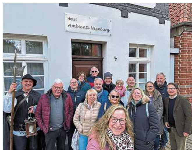
Die Autofreunde Lipperland waren zu Gast in Nienburg und trafen auch auf Bürgermeister Jan Wendorf (rechts).

Uchte. Am 29. Mai bietet die Koordinierungsstelle frau+wirtschaft von 9.15 bis 12.30 Uhr ein kostenfreies Seminar mit dem Thema „Bleibt alles anders - Positiv mit äußeren Veränderungen umgehen“ im Mütterzentrum Uchte, Mühlenstraße 9, an. Veränderungen gehören zum Leben dazu, doch wie können wir sie positiv und erfolgreich bewältigen? Dies ist besonders dann von Bedeutung, wenn Veränderungen von äußeren Umständen auferlegt werden. In dem Seminar erhalten die Teilnehmerinnen praxisnahe Werkzeuge und Einblicke in die „Theorie U“ nach Otto Scharmer, die helfen, Veränderungen selbstbewusst anzunehmen. Die Anmeldungen werden bis zum 23. Mai online unter www.frau-und-wirtschaft-ni.de oder telefonisch unter 05021 92291-95 entgegengenommen. DH