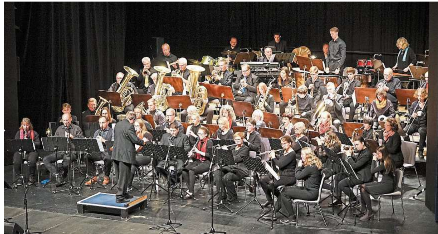
Beim Konzert im Nienburger Theater treten die Bläserbanden der Grundschule Liebenau, Friedrich-Ebert-Grundschule Nienburg und Grundschule Husum sowie die Chöre der Grundschule Liebenau und der Musikschule Nienburg gemeinsam mit dem Jugendblasorchester und dem Konzert- und Swingorchester (Foto) auf.

Die Musikschule Nienburg begleitet Musikerinnen und Musiker von Kindesbeinen an. Der Start in die musikalische Laufbahn ist oft das Projekt Bläserbande an der jeweiligen Grundschule. Nach der Bläserbande gehen die Kinder der 4. Klasse zunächst in ein Vororchester, um dann bald in das Jugendblasorchester zu wechseln.