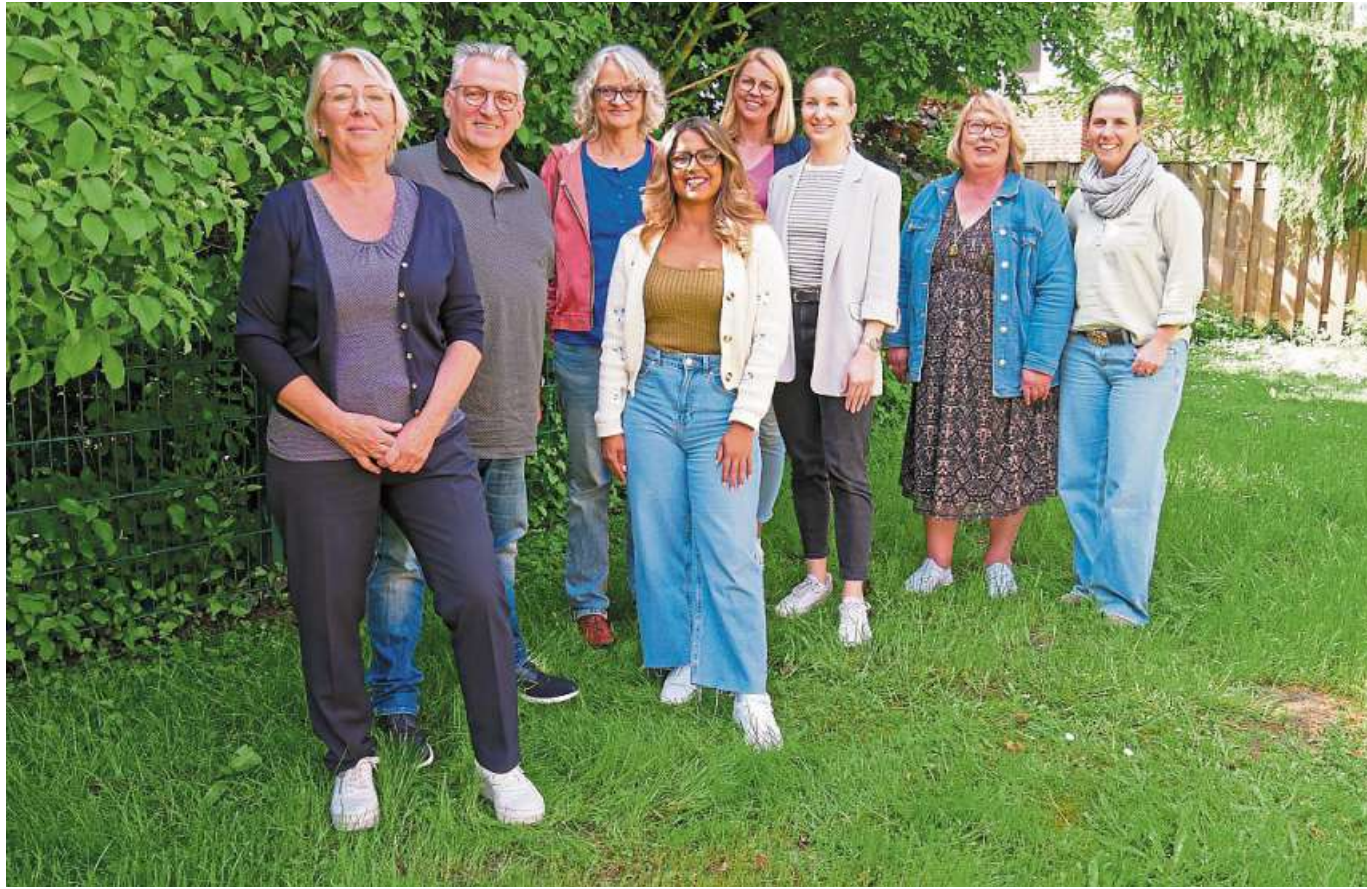
Das EU-Projekt „Together we can“ wird mit Projektpartnerinnen aus fünf Ländern realisiert: Italien, Portugal, Zypern, Österreich und Deutschland. Für Deutschland ist als Partner der Landkreis Nienburg ausgewählt worden...

EU-Projekt „Together we can“ schafft passgenaue Workshops