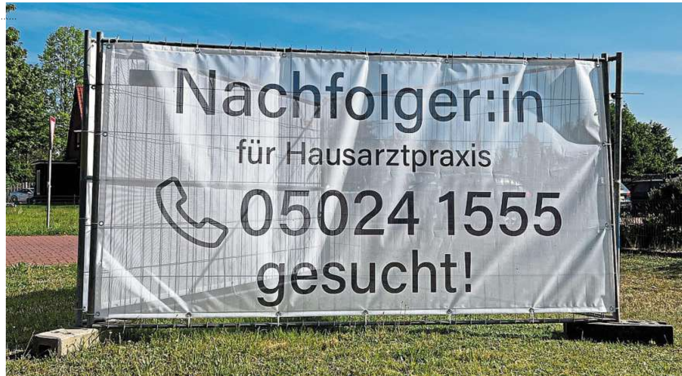
Auch dieses Banner vor der Praxis von Malgorzata Robak direkt an der B 215 ist Teil der Werbekampagne.

Entstanden sind Postkarten, die demnächst an jeden Haushalt verteilt werden, ein YouTube-Video, das auch die Social-Media-Gemeinde erreichen soll, und eine Anzeige, die im Deutschen Ärzteblatt geschaltet wird. Hinzu kommt das Bauzaun-Banner direkt vor der Praxis an der B 215, das