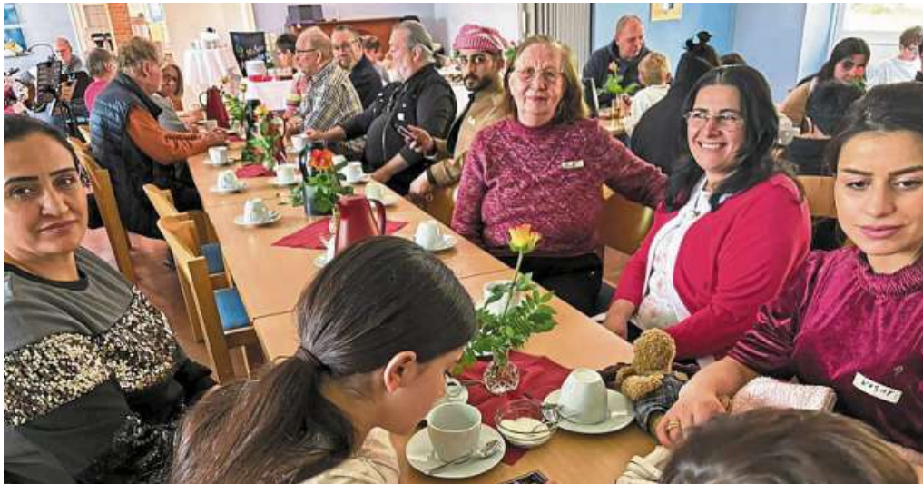
Ein friedlicher Austausch ist möglich. Das wurde in Liebenau deutlich.

Die Flüchtlingsinitiative kümmert sich schwerpunktmäßig um Menschen, die aus welchen Gründen auch immer