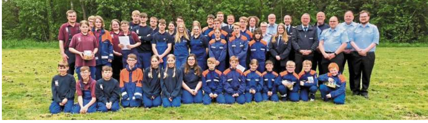
Das Gruppenfoto zeigt die ersten drei siegreichen Gruppen Anemolter-Schinna, Holzhausen und Müsleringen-Diethe mit ihren Jugendwarden und Betreuenden.

Die gastgebende Jugendfeuerwehr Anemolter-Schinna gewann nach Punkten vor Holzhausen, Müsleringen, Landesbergen, Schessinghausen, Münchhagen, Nendorf, Liebenau und der Verbundgruppe aus Husum und Bol-