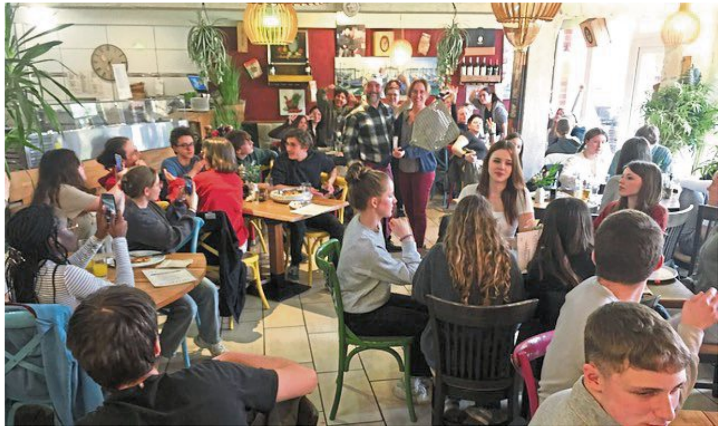
Auch der jüngste Frankreich-Austausch des Nienburger Marion-Dönhoff-Gymnasiums war ein voller Erfolg.

Eine im Kreis Nienburg unter den Jugendlichen durchaus verbreitete Tradition ist in Frankreich quasi unbekannt: Die Tanzstunde. Was liegt da näher, als den französischen Corres eine Kostprobe zu gönnen? „Alors, on danse“ hieß es am Donnerstag.