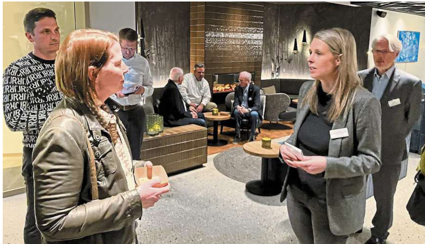
Die Unternehmer und Unternehmerinnen ließen sich in Kleingruppen durch das neu gestaltete Landhotel führen.

Thöles Hotels und Gästehäuser bedienen vier Geschäftsfelder, erläuterte Frieda