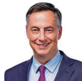
David Mc Allister referiert auf Einladung der Gesellschaft für Sicherheitspolitik am 29. April in Nienburg.

Weiter heißt es: Vor diesem Hintergrund ist es wichtig, dass die EU auch weiterhin außen- und sicherheitspolitisch ein starker Akteur bleibt.