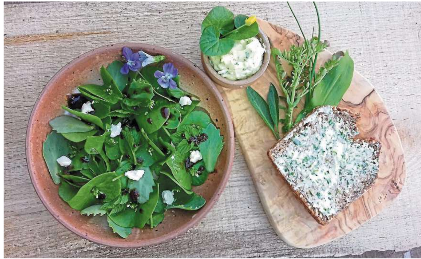
Zur Saisonöffnung am 21. April bietet die Garten-AG eine kulinarische Reise in die Welt der Wildkräuter an.