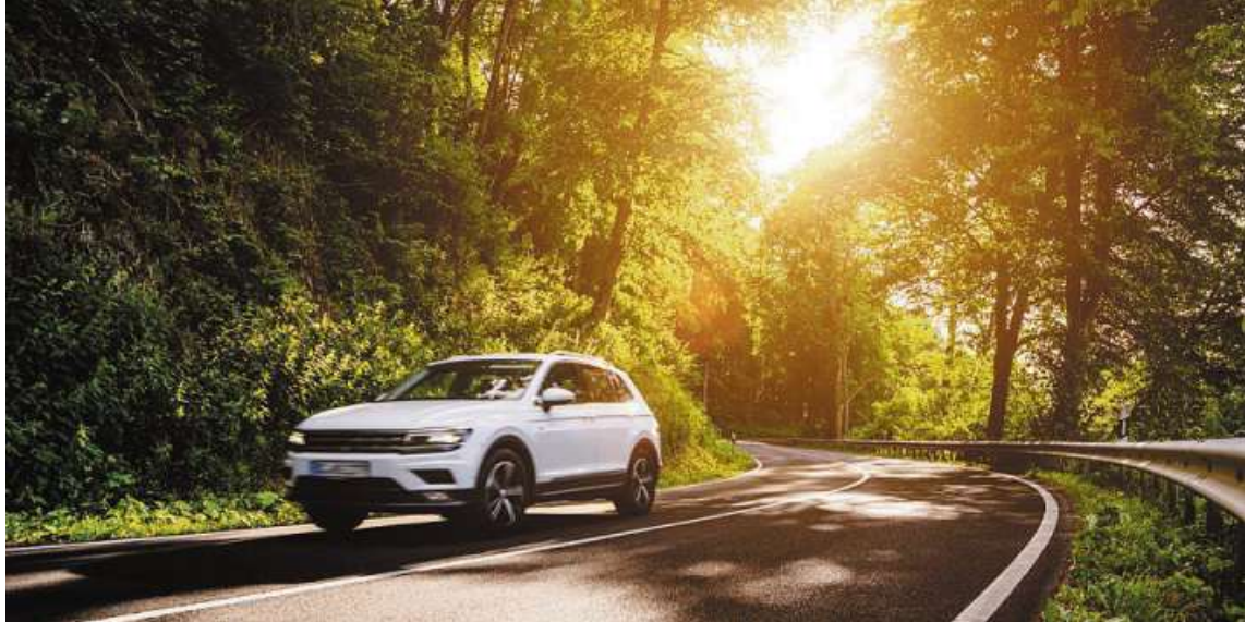
Um die Spuren zu beseitigen, die der Winter am Auto hinterlassen hat, empfiehlt sich ein professioneller Check.

Was sollte beim Frühjahrscheck überprüft werden?