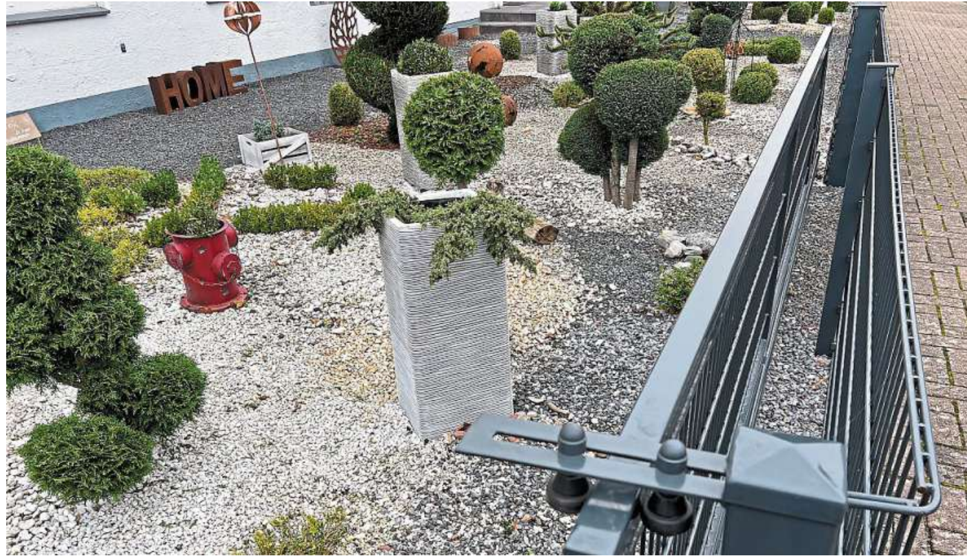
Trist, hässlich und nicht zulässig: Die Oldies for Future beleuchten die sogenannten Schottergärten.

Das zumeist graue Gestein wirkt trist und trostlos. Da nutzen auch die vereinzelt in ihnen anzufindenden immergrünen Pflanzen nichts. Deren oftmals exotische Herkunft bietet den Tieren nichts: keine Nahrung, kein Versteck, keinen Lebensraum. Nichts!