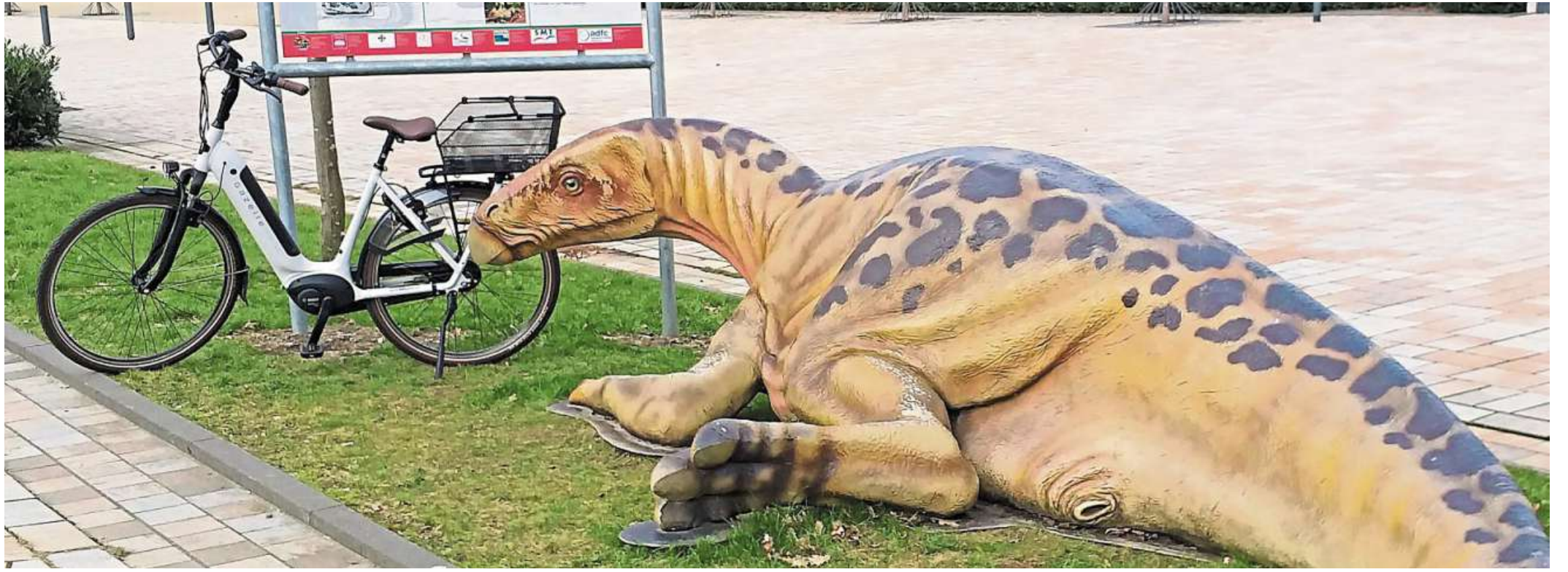
Am 1. Mai lädt die Stadt Rehburg-Loccum anlässlich ihres 50. Geburtstages von 10 bis 18 Uhr zu einem Raderlebnistag ein. Geradelt wird auf den Spuren der Dinosaurier.