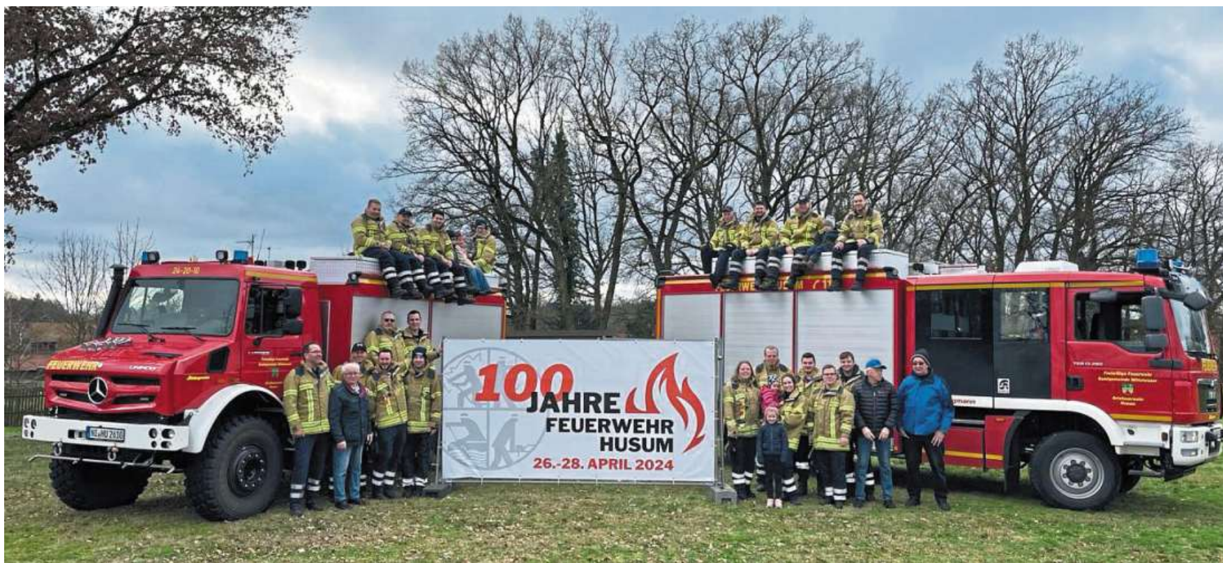
100 Jahre Freiwillige Feuerwehr Husum: Das wird vom 26. bis 28. April groß gefeiert.

In Husum wird am kommenden Wochenende groß gefeiert