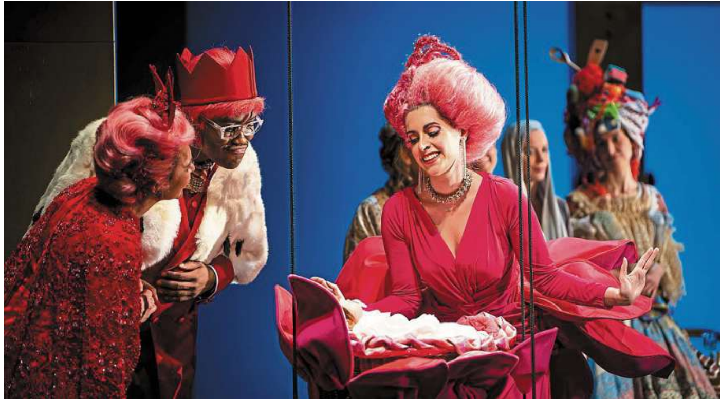
Für die opulente und farbenfrohe Inszenierung von Dornröschen bietet das Theater statt festem Eintritt eine Zylinder-Aktion an. Das bedeutet, man darf erst einmal ohne Eintritt in den Theatersaal und entscheidet später, wie viel man zahlen möchte.

Theater lässt sich was einfallen, um Menschen für Märchenoper „Dornröschen“ zu begeistern