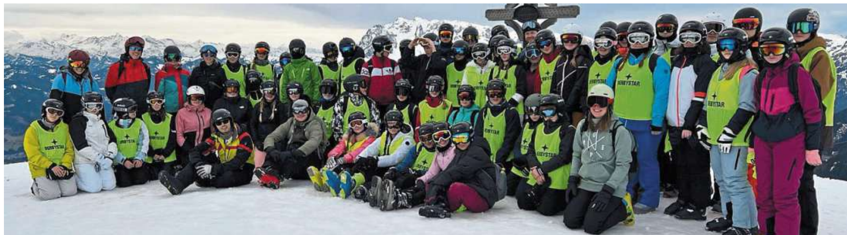
57 Schülerinnen und Schüler der Oberschulen Uchte, Stolzenau, Lemförde und Wagenfeld erlebten eine tolle Woche in Österreich.

Lehrreiche Woche für Schülerinnen und Schüler aus den Oberschulen Stolzenau und Uchte