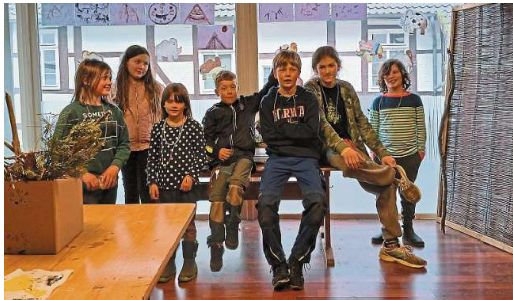
Viel Spaß hatten die kleinen Forscherinnen und Forscher bei „Rauzwi“ in Liebenau.

Bei Regen versuchten die kleinen Forscherinnen und