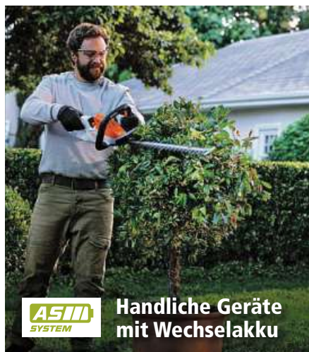
ASIM SYSTEM Handliche Geräte mit Wechselakku