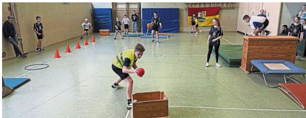
Acht Jugendfeuerwehrgruppen schafften in der Haßberger Mehrzweckhalle echte Stadionatmosphäre.

In zwei Vierer-Gruppen ging es zunächst im Modus „Jeder-gegen-jeden“ um die Qualifikation für das Halbfinale. Während sich in Gruppe A Rohrsen und Hilgermissen vor Haßbergen und Gemeinde Heemsen 2 durchsetzten, ge-