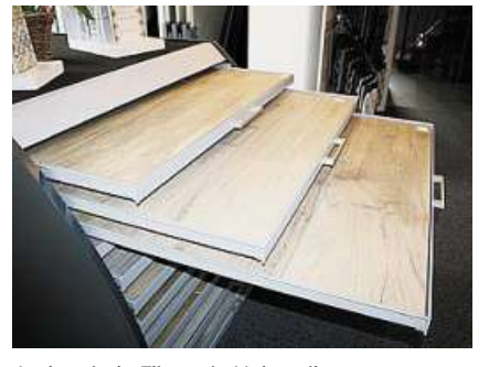
Authentisch: Fliesen in Holzoptik.

Seite, getreu dem Motto: „Geht nicht - gibt's nicht“. Höchste Qualität und perfekter Service - so lautet das Erfolgsrezept.