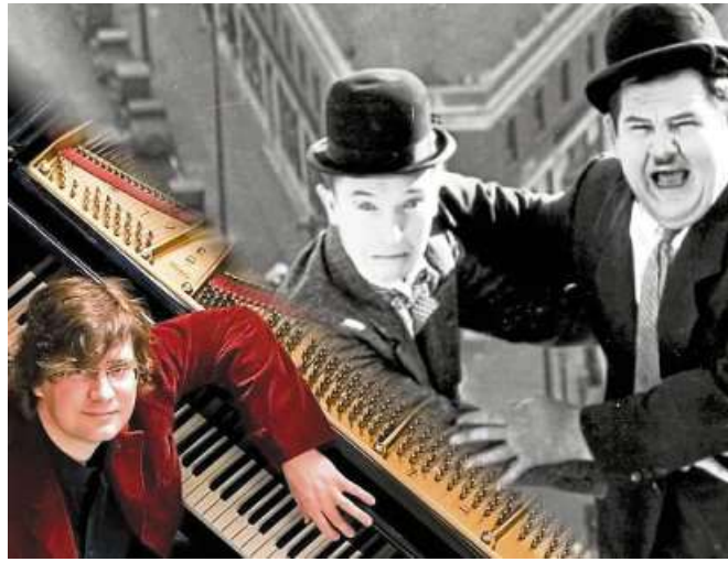
Stephan Graf von Bothmer gastiert mit seinem spektakulären Stummfilmkonzert am 19. April in Uchte.