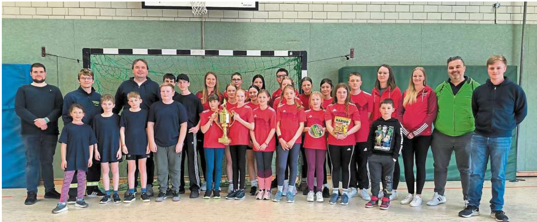
Beim Hallenturnier in Steimbke kämpften insgesamt zehn Teams um den begehrten Wanderpokal. Am Ende konnte sich Nöpke durchsetzen.

Hallenfußballturnier der Jugendfeuerwehren der Samtgemeinde Steimbke