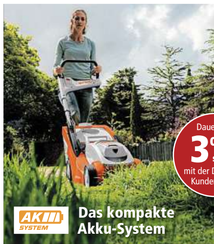
AKIM SYSTEM Das kompakte Akku-System

Dauerhaft 3% sparen mit der Deterding Kundenkarte!