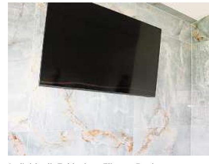
Individuell: Exklusives Fliesen-Design.