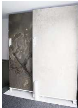
Besonderer Trend: XXL-Fliesen.