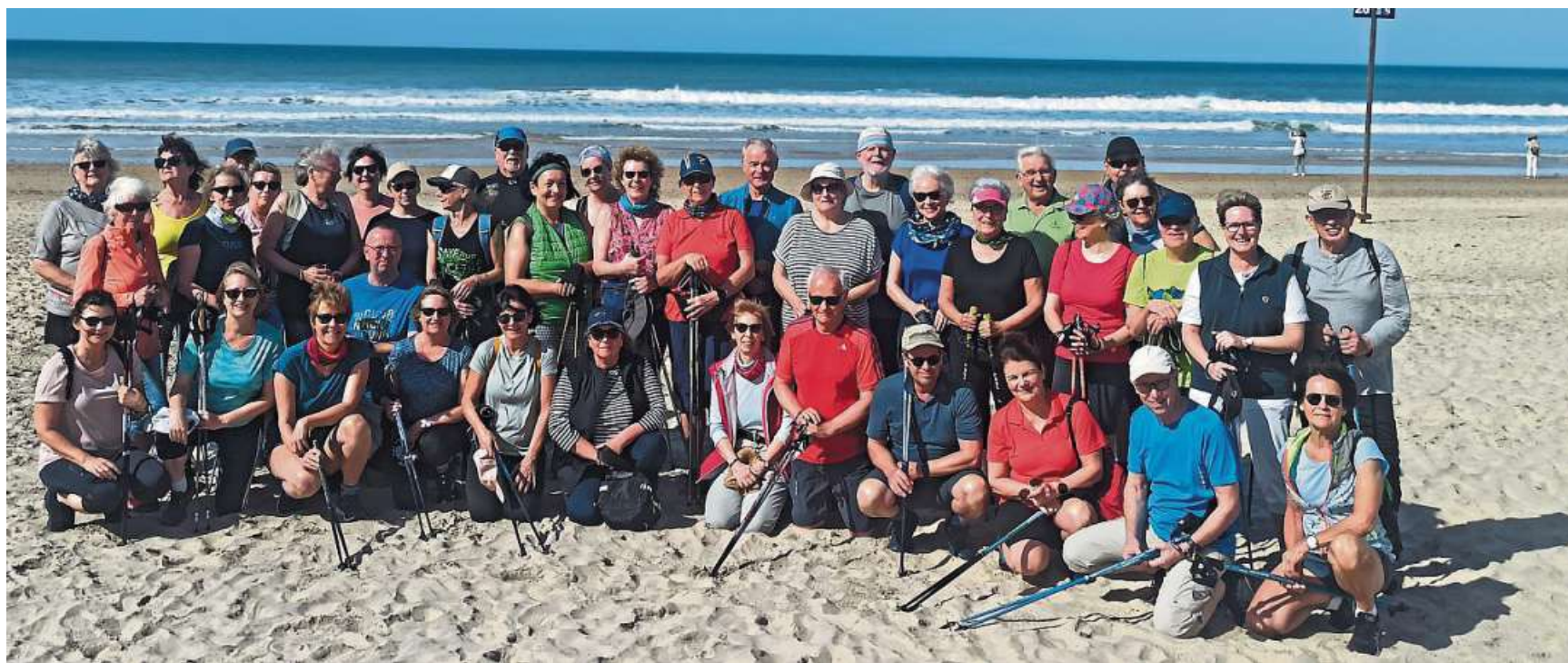
Beste Bedingungen: Die Teilnehmerinnen und Teilnehmer der mittlerweile 19. Walking-Reise nach Andalusien kamen jetzt gut erholt zurück.

Auch die 19. Nordic Walking Reise nach Andalusien war wieder ein voller Erfolg