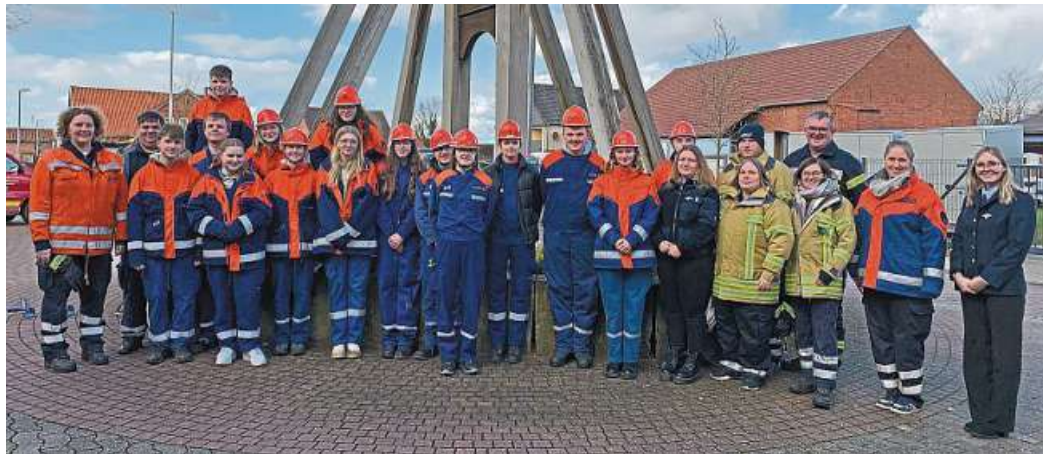
Die glücklichen Bewerberinnen und Bewerber mit ihren und ihre Betreuerinnen und Betreuer nach der Verleihung der Jugendflammen.

Die Jugendflamme gilt als Ausbildungsnachweis für das in den Jugendabteilungen gelernt und ist in Form eines Abzeichens in drei Stufen gegliedert. Zum Erlangen der