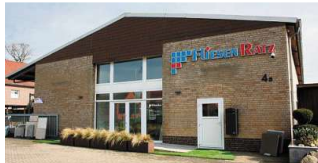
Das Fachgeschäft „Fliesen Ratz“ an der Hauptstraße 4a in Hassel.

Seit 30 Jahre steht „Fliesen Ratz“ bei allen Fragen rund um die Fliese mit Rat und Tat zur