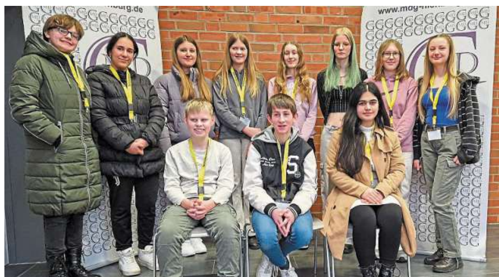
Prävention statt Eskalation: Das ist das Ziel der MDG-Schülerscouts.

Nienburg. Streit in der Schule mit Mitschülern? Oder ein unguetes Gefühl in der Pause? Hoffentlich klingen diese Aussagen nicht vertraut – in der Realität kommen oder kamen sie leider immer wieder vor. Nienburgs Marion-Dönhoff-Gymnasium hat als erste weiterführende Schule in der Stadt Nienburg für solche und viele andere Fälle seit diesem Schuljahr die Schülerscouts fest etabliert. Unterstützt und ausgebildet durch den Landkreis Nienburg, die Polizei und den Kreisjugendring gibt es jetzt Schülerscouts und Schüler an der Schule, die bei Konflikten, Sorgen und Nöten eingreifen, helfen, schlichten und vermitteln können. Die Schülerscouts sind in einem besonderen Programm speziell für solche Fälle ausgebildet worden und treffen sich wöchentlich in einer AG, um im gegenseitigen Miteinander Erfahrungen auszutauschen und somit noch bessere Ansprechpartner für die Schülerschaft am MDG zu werden. „Ansprechpartner ist an dieser Stelle auch genau das richtige Stichwort“, schreibt die Schule. „Dinge frühzeitig