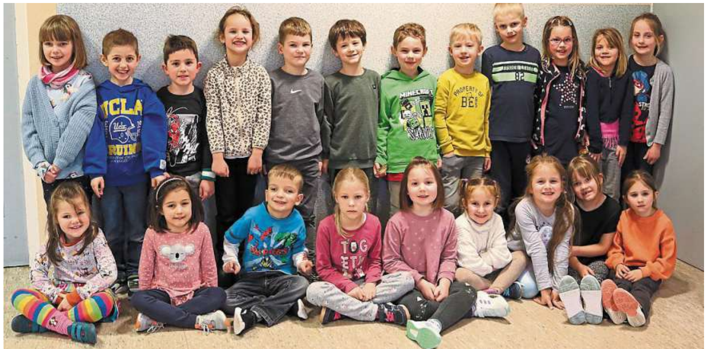
„Stopp! Ich wehre mich!“: Die angehenden Schulkinder lernten, wie sie mit kritischen Situationen umgehen können.

Kinder der Kitas in Heemsen lernen, ihre Grenzen deutlich zu verteidigen