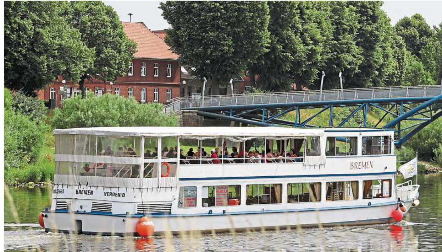
Das Fahrgastschiff „Bremen“ bietet verschiedene Osterfahrten ab Nienburg an.

Die zweistündigen Nachmittagsfahrten werden am Ostersonntag, 31. März, und am Ostermontag, 1. April, in Nienburg und in Verden angeboten. Von Verden geht's auf Al-