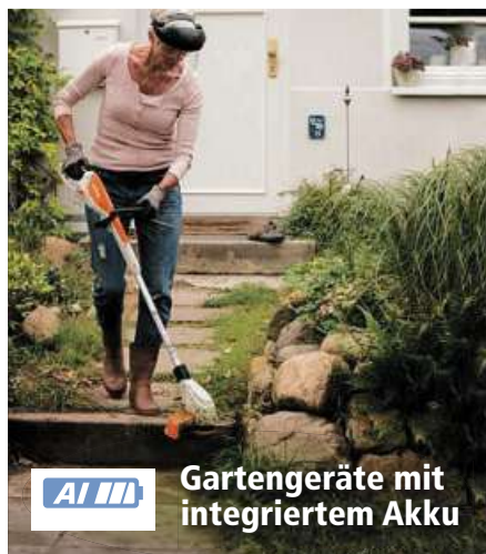
AI III Gartengeräte mit integriertem Akku