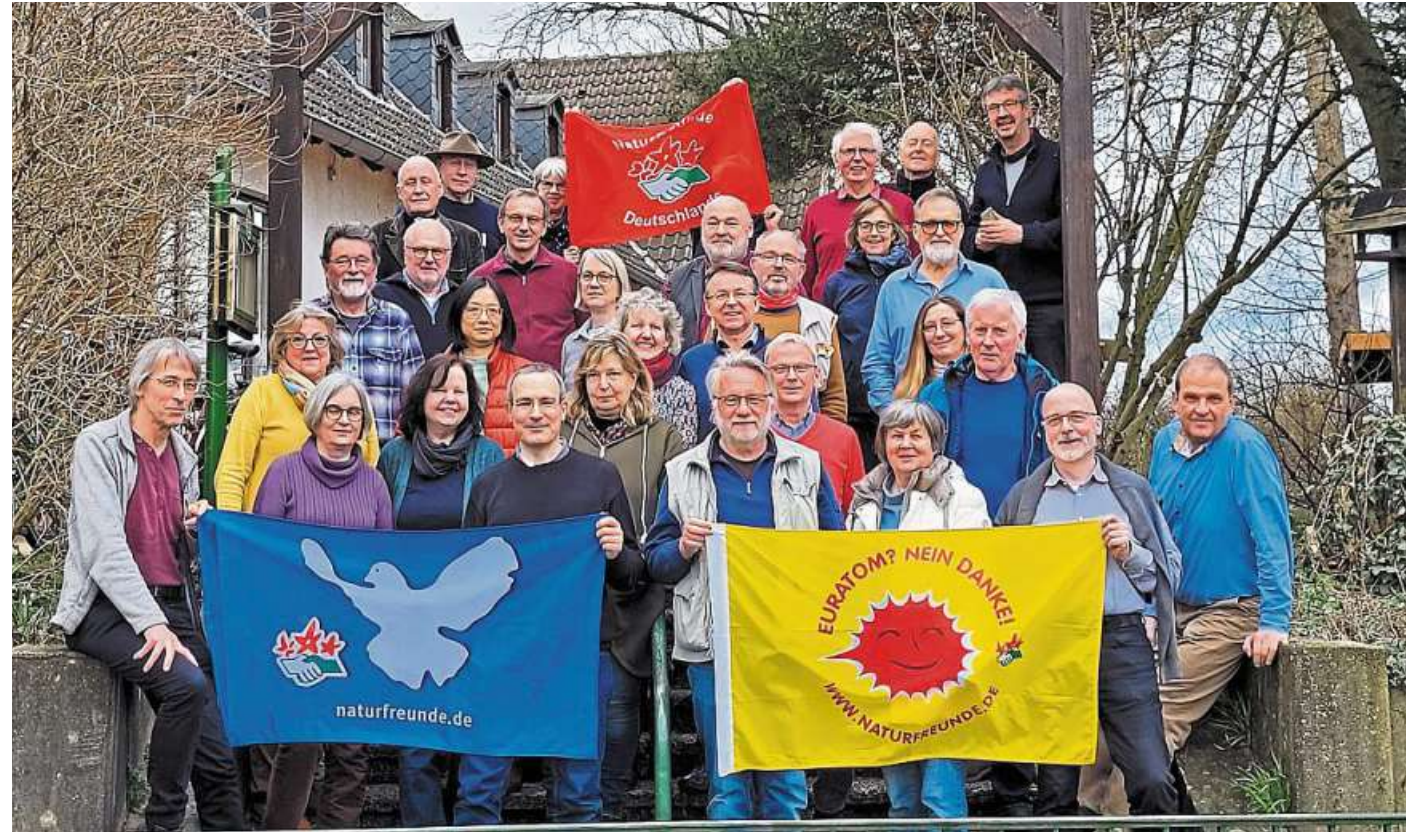
Seit 75 Jahren gibt es die Naturfreunde als festen Bestandteil in Nienburg. Die Gruppe versteht sich als Freizeitorganisation, zu der auch das politische Engagement für eine ökologisch offene und soziale Gesellschaft gehört.