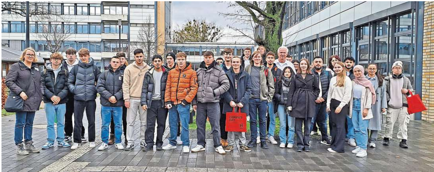
Um sich einen besseren Überblick zu verschaffen, nahmen die Klassen 11 und 12 der Fachoberschule Technik sowie Schülerinnen der Fachoberschule Gesundheit der BBS Nienburg am Campus Day der Hochschule Hannover teil.

Schülerinnen und Schüler der FOS Technik und Gesundheit besuchten Campus Day