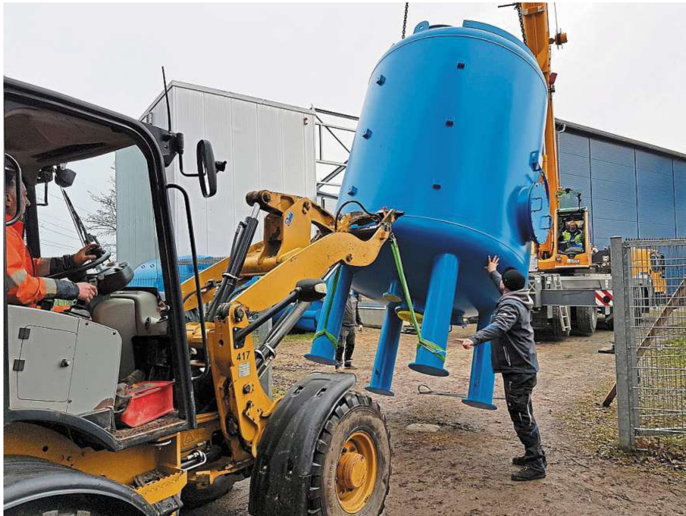
Mit dem Kauf des Wasserwerks am ehemaligen „Wiesenhof“-Standort in Holte will der Kreisverband für Wasserwirtschaft den Wasserbeschaffungsverband Wietzen und angrenzende Bereiche des Wasserverbands Sandkamp zukunftssicher aufstellen. Jetzt hat die heiße Phase“ des Ausbaus begonnen.

Allein die neuen Filter schlagen laut Oltmann mit rund 650 000 Euro zu Buche; die gleiche Summe ist für die bereits im Bau befindlichen zusätzlichen Förderbrunnen veranschlagt. Noch einmal 400 000 Euro soll das Gebäudekosten, in dem die erweiterte Wasseraufbereitung installiert