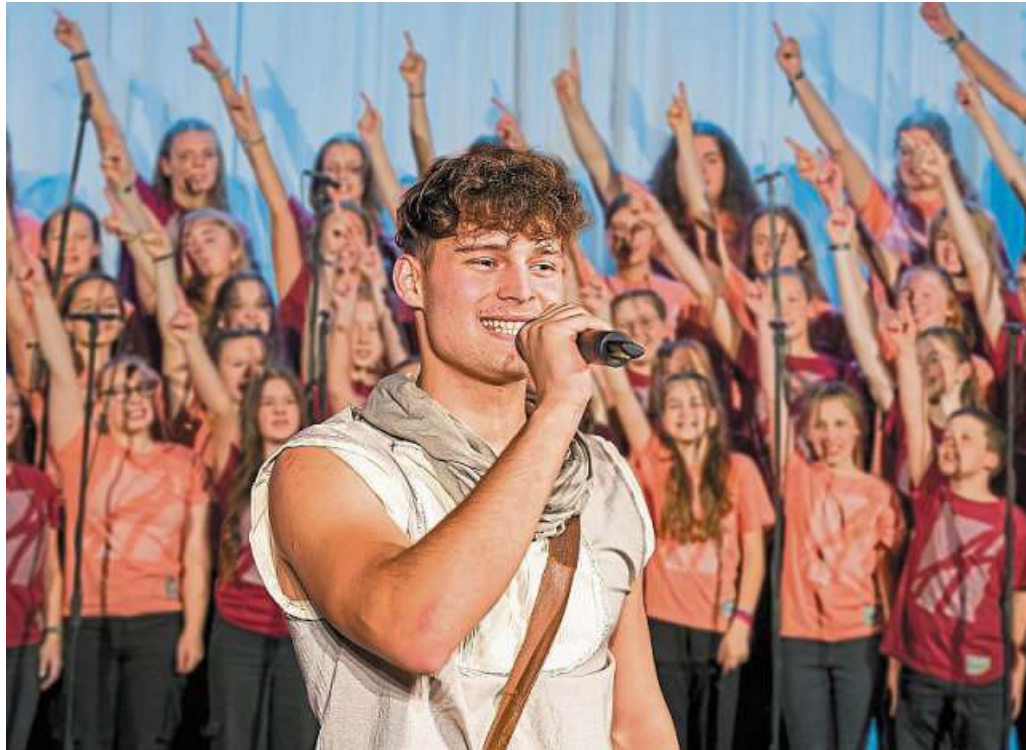
Mitreibend und berührend: Am 21. März ist in der Heemser Schule das Musical „Petrus - der Apostel“ zu erleben.

Doch der leidenschaftliche Petrus spürt, dass sein Auftrag über die Stadtmauern von Jerusalem hinausgeht. Die ganze Welt soll die gute Nachricht hören. So bricht er auf