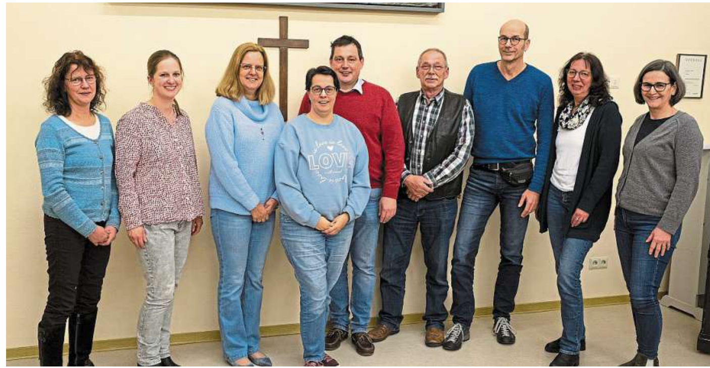
Die Pastorinnen und Pastöre sollen künftig bei einem noch zu gründenden Gemeindeverband angestellt werden. Darauf haben sich die Kirchenvorstände aus Steimbke, Rodewald, Erichshagen, Holtorf und Drakenburg-Heemsen geeinigt.

Allen war klar, dass jede Gemeinde an der einen oder anderen Stelle Abstriche machen muss. Aber beseelt von dem festen Glauben, dass jede Veränderung auch Gutes mit sich bringt, erarbeitete der Ausschuss in nur zehn Monaten ein Konzept, dass über die bloße Stellenreduzierung hinausgeht. Es wurde beschlossen, einen Gemeindeverband zu gründen, der in der Zukunft anstelle der einzelnen Kirchengemeinden die Pastorinnen und Pastoren anstellen soll, denn bis auf Drakenburg-Heemsen wird in der Region Nord keine Gemeinde