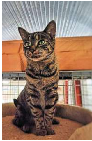
Katzendame Abby.

Tierheim Drakenburg sucht neues Zuhause für Katzendame „Abby“