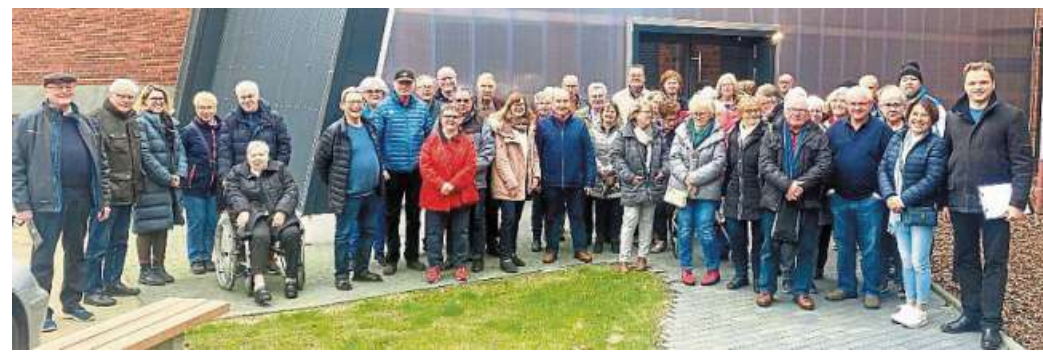
Das Foto zeigt die BesucherInnen vor dem Eingang zur Gedenkstätte.

Mit vielfältigen didaktischen Mitteln und in einer emotional berührenden Weise wird gezeigt, wie menschenverachtend und erbarmungslos der großräumig in die Eickhofer