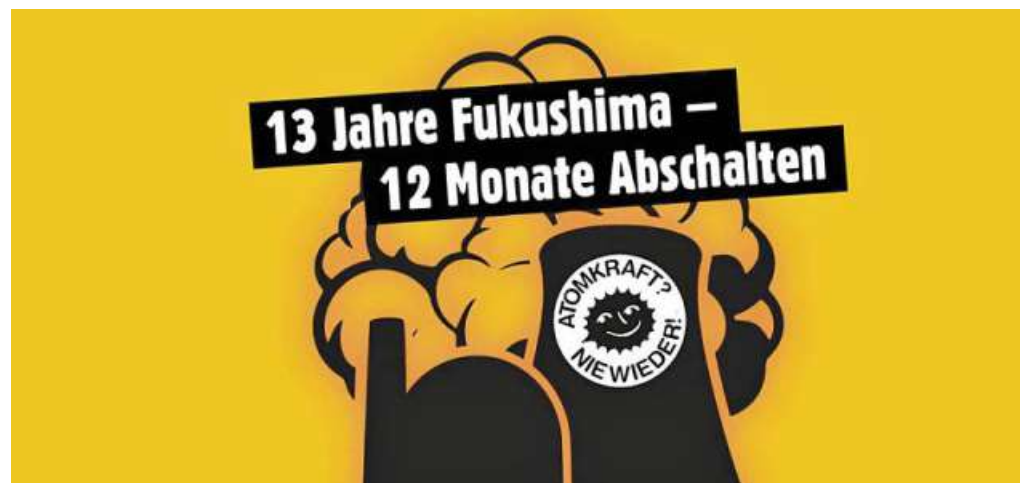
13 Jahre Fukushima, 12 Monate abschalten: Am 9. März findet in Nienburgs Innenstadt eine Mahnwache des Anti-Atom-Kreis Nienburg statt.