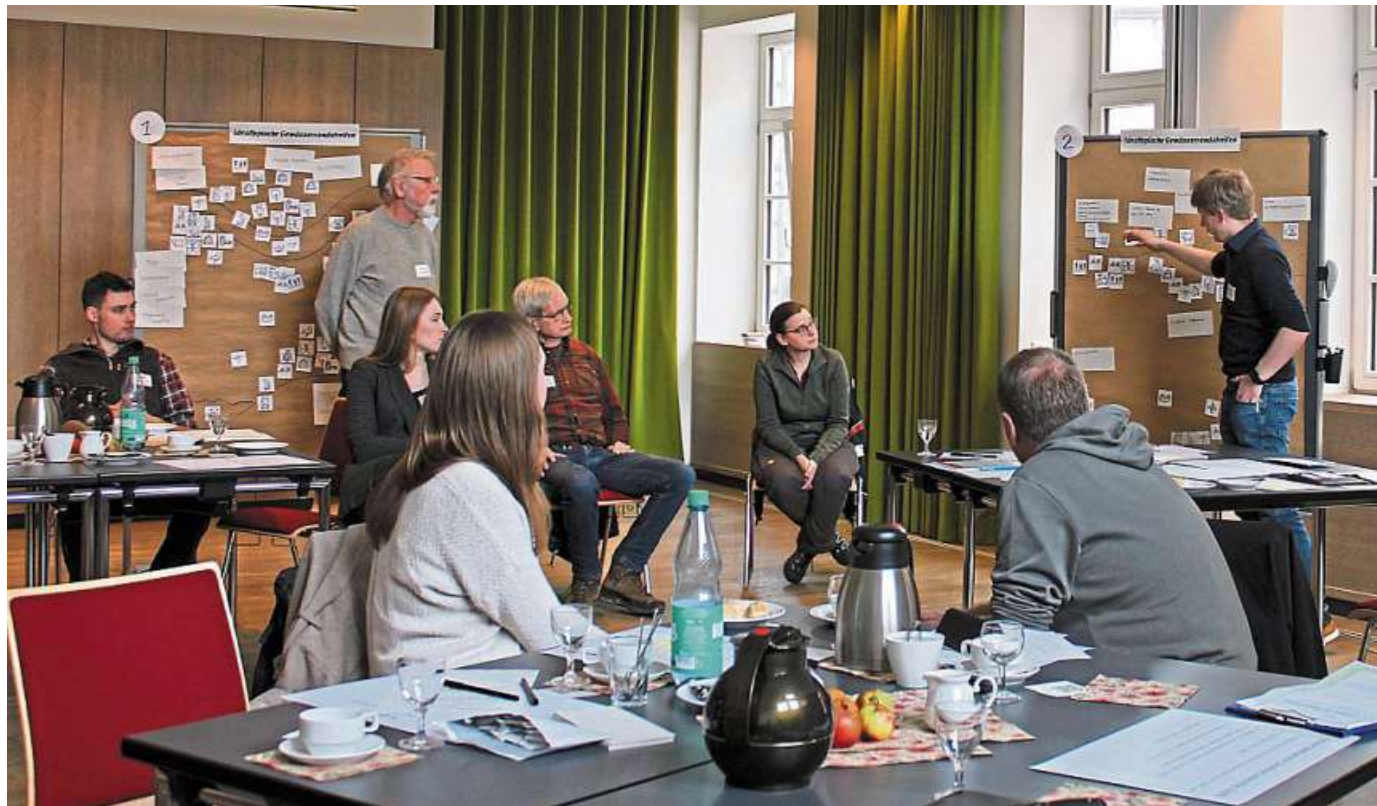
In der Modellregion Nienburg, eine von drei Modellregionen in Niedersachsen, wird in den nächsten drei Jahren versucht, an der Fulde bei Loccum mit Landwirtinnen und Landwirten eine nachhaltige Kooperation zur ökologischen Aufwertung der Gewässerränder zu erreichen.

In der Modellregion Nienburg trafen sich Vertreterinnen und Vertreter vom Bund für Umwelt und Naturschutz (BUND), Landwirtschaftskam-