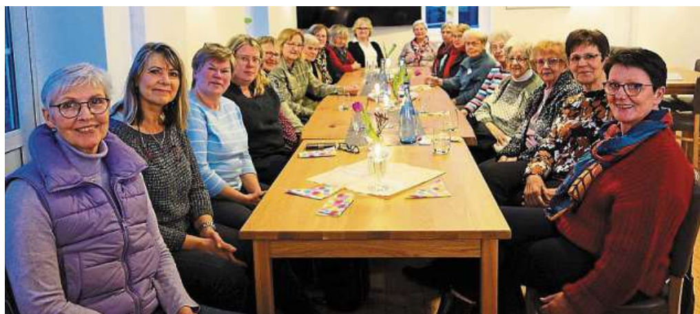
Die Landfrauen Neustadt besuchten den Linsburger Dorfladen.

der St.-Jakobi-Kirche in Stolzenau. Das Thema der Predigt lautet „Wer bist du denn?“ DH