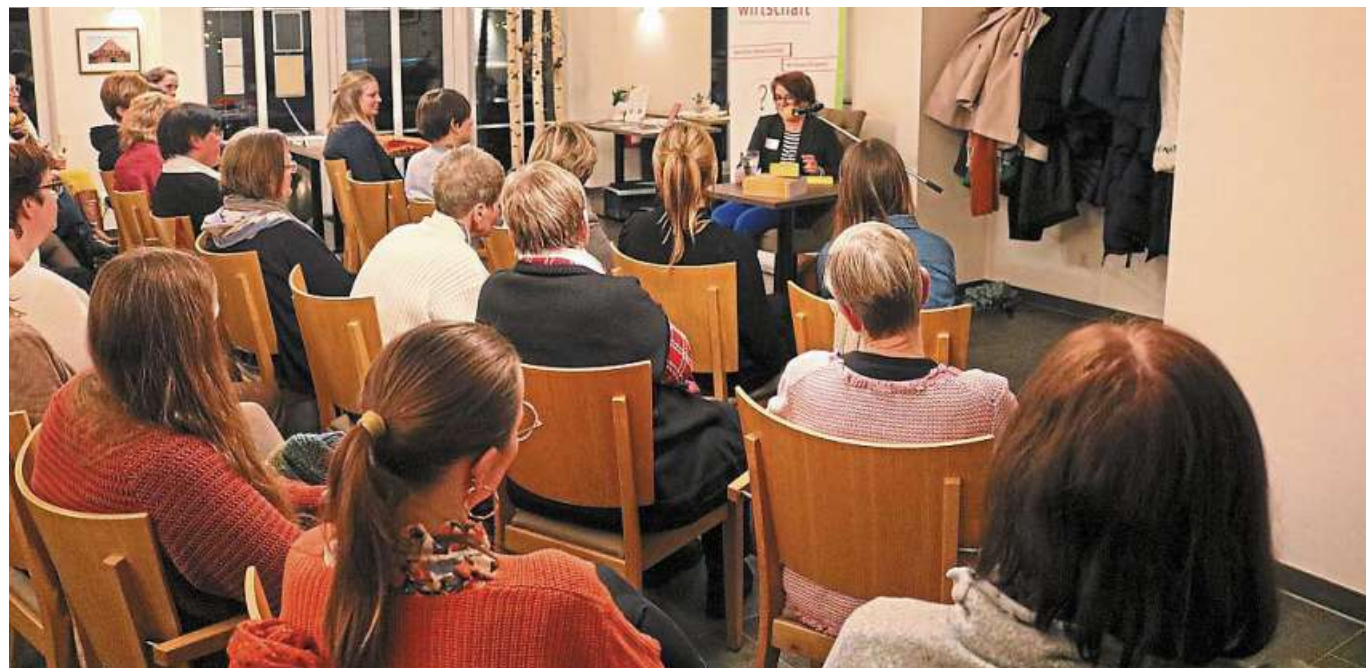
Über 50 Frauen kamen zum Neujahrsevent ins Speicherkaffee nach Marklohe