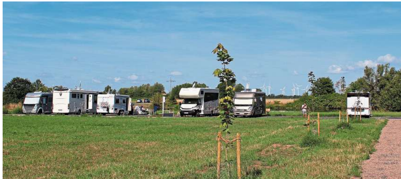
Die Wohnmobilstellplätze in der Mittelweser-Region erfreuen sich großer Beliebtheit; hier der in Landesbergen.