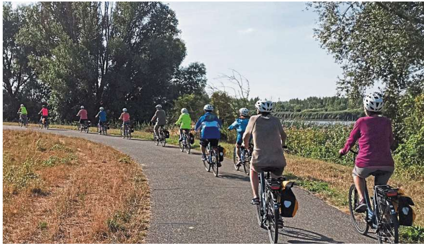
Fahrradfahren macht nicht nur Spaß, es hält fit und schont die Umwelt.

Doch nicht nur, um gezielt von A nach B zu kommen, ist zu Fuß gehen gesundheitsförderlich. Auch Wandern – egal ob sportlich oder gemütlich – hält fit. Von Nienburg aus sei gar keine weite Strecke nötig, um attraktive Wandergebiete