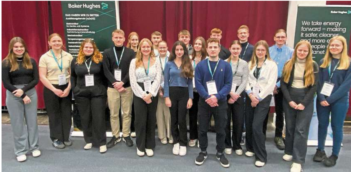
Die Schülerinnen und Schüler des Marion-Dönhoff-Gymnasiums beim Regionalentscheid von „Jugend forscht“.