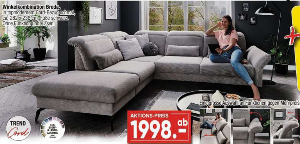
Winkelkombination Breda, in topmodernem Cord-Bezugschmal, ca. 282x236cm, FüÙe schwarz, Ohne Funktion und Kissen.

Bis zu 25% Rabatt AUF MÖBEL-NEUBESTELLUNGEN!