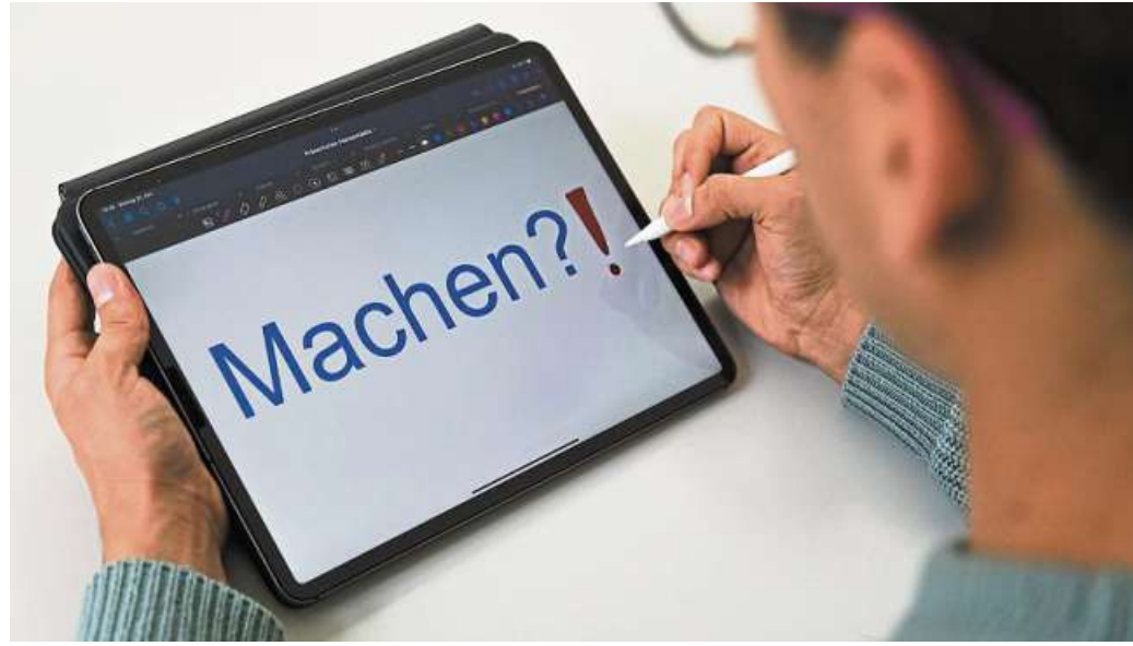
Die NGG appelliert daher an die rund 3.150 Unternehmen im Landkreis Nienburg, mehr in die Weiterbildung ihrer Beschäftigten zu investieren.

„Von der intelligenten Lagerlogistik in der Ernährungsindustrie bis hin zu neuen On-