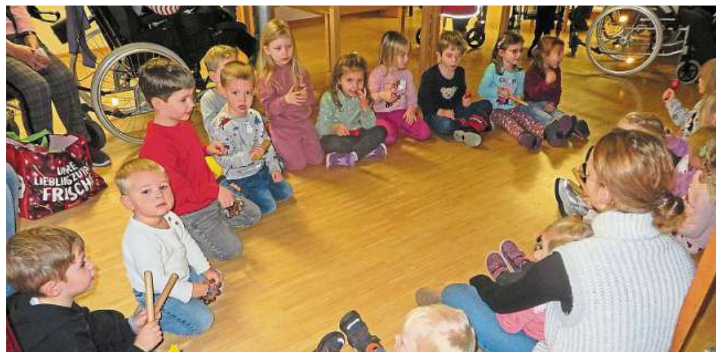
Kurz vor Weihnachten gab es für die Bewohnerinnen und Bewohner des Cura-Zentrums in Uchte einen Überraschungsbesuch.

Die Kinder haben im Vorfeld Sterne gebastelt, die an das Cura-Zentrum in Uchte weitergegeben wurden. Dort wurden sie von den Bewohnerinnen und Bewohnern mit kleinen Wünschen beschriftet, wie zum Beispiel eine Tafel Schokolade, einen Weih-