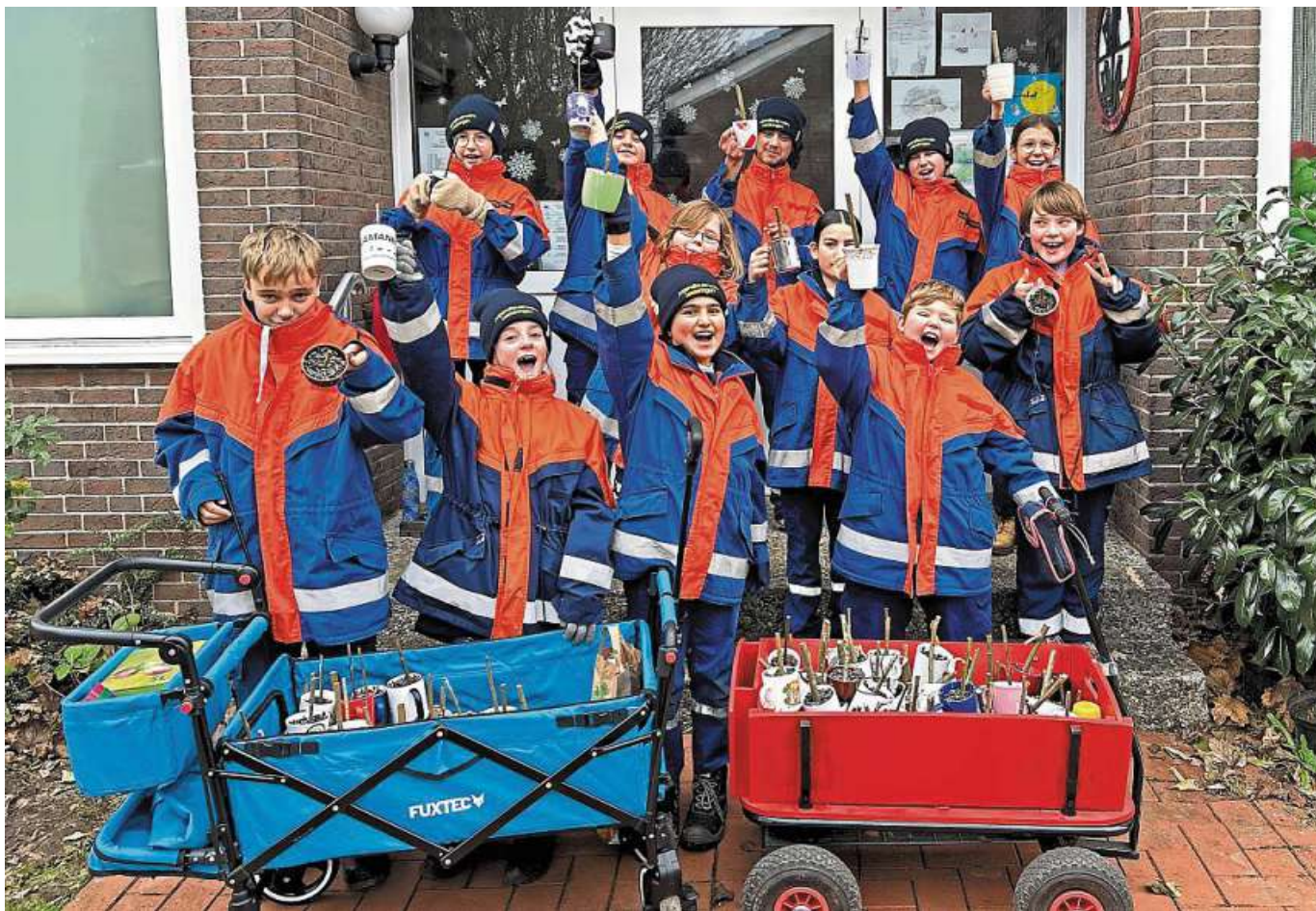
Gute Laune hatten die Jugendfeuerwehrmitglieder vor dem Verteilen der Tassen im Dorf.

Jugendfeuerwehr Leeseringen bereitete kurz vorm Fest eine kleine Freude