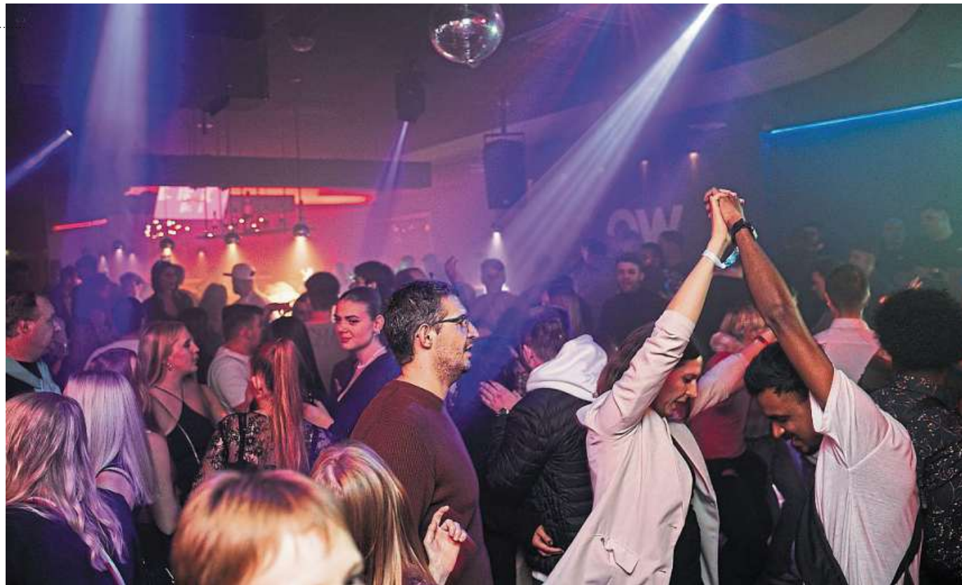
Im Below soll es künftig mehr Events geben.

Denn auch das ist auffällig: Bei Clubabenden sei das männliche Publikum häufig in der Überzahl. „Viele Frauen trauen sich abends nicht mehr in die Stadt. Wenn die Laterne aus sind, dann ist es stockdunkel in der Stadt. Viele Frauen fühlen sich abends