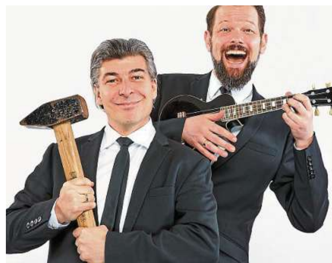
Das Satire-Duo „Onkel Fisch“ startet am 13. Januar mit einem Jahresrückblick ins neue „Kabarett vom Sofa“-Jahr.

„Onkel Fisch“ machen Action-Kabarett. Dabei verbinden sie laut Veranstalter „anspruchsvolle Inhalte und bis-