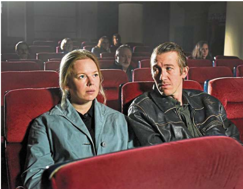
Am 15. Januar gibt es den neuen Film von Aki Kaurismäki, „Fallende Blätter“. Ein typischer Kaurismäki mit wortkargen Akteuren, sparsamem Interieur und vielen Zitaten.

Die nächsten beiden Filme, „Mit Liebe und Entschlossen- heit“ von Claire Denis am 5. Februar und „Die Linie“ von Ursula Meier am 12. Februar erzählen von desolaten Bezie- hungen. Denis seziert in „Mit