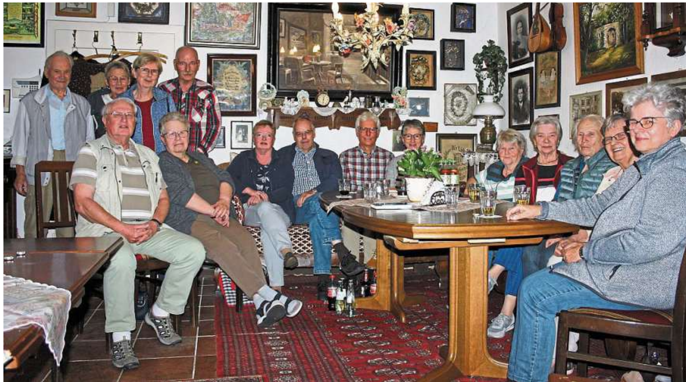
Seit September trifft sich der plattdeutsche Gesprächskreis des Seniorenbeirates der Stadt Rehburg-Loccum im Heimatmuseum Rehburg.

„Wir freuen uns sehr, dass wir uns nun auch in den Win-