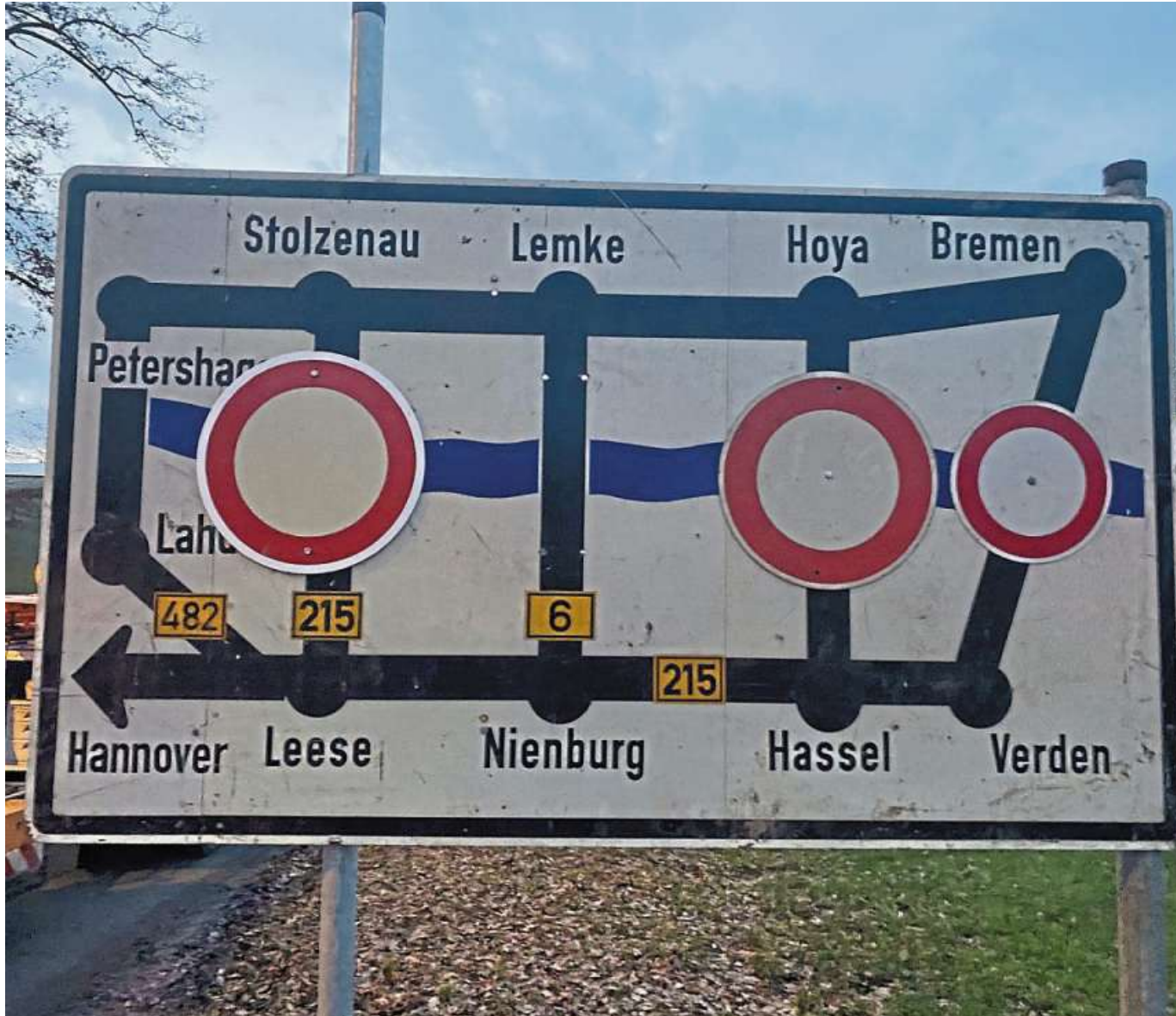
Nur in Nienburg und in Petershagen kommt man noch über die Weser.

Die genauen Abfuhrtermine sind für jede Straße individuell und stehen im Abfallkalender, auf der Internetseite www.bawn.de oder in der BAWN-App. Soweit die Erinnerungsfunktion der App aktiviert ist, weist diese auch automatisch auf die richtigen Termine hin. Am jeweiligen Abfuhrtag muss der Baum um 6 Uhr bereitliegen.