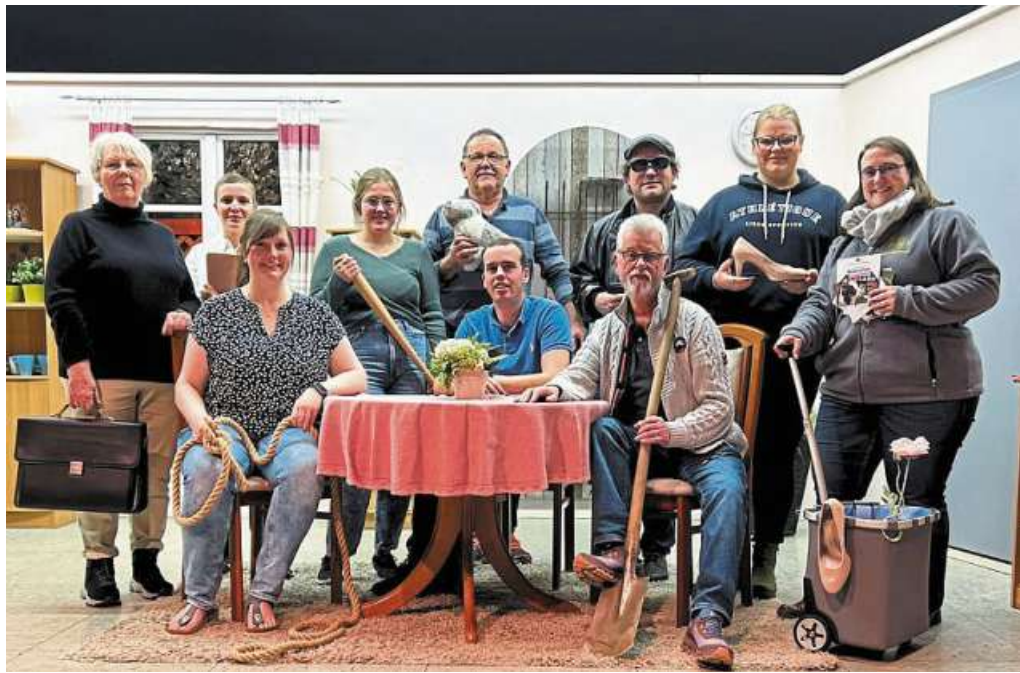
Es darf wieder gelacht werden bei der SSG Rohrsen.

■ 20. Januar 20 Uhr im Nienburger Theater