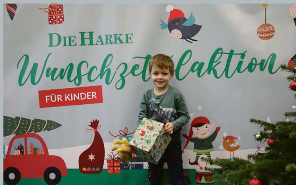
Nun dauert es gar nicht mehr lang, bis die erfüllten Geschenkewünsche übergeben werden können – wie hier im Vorjahr.