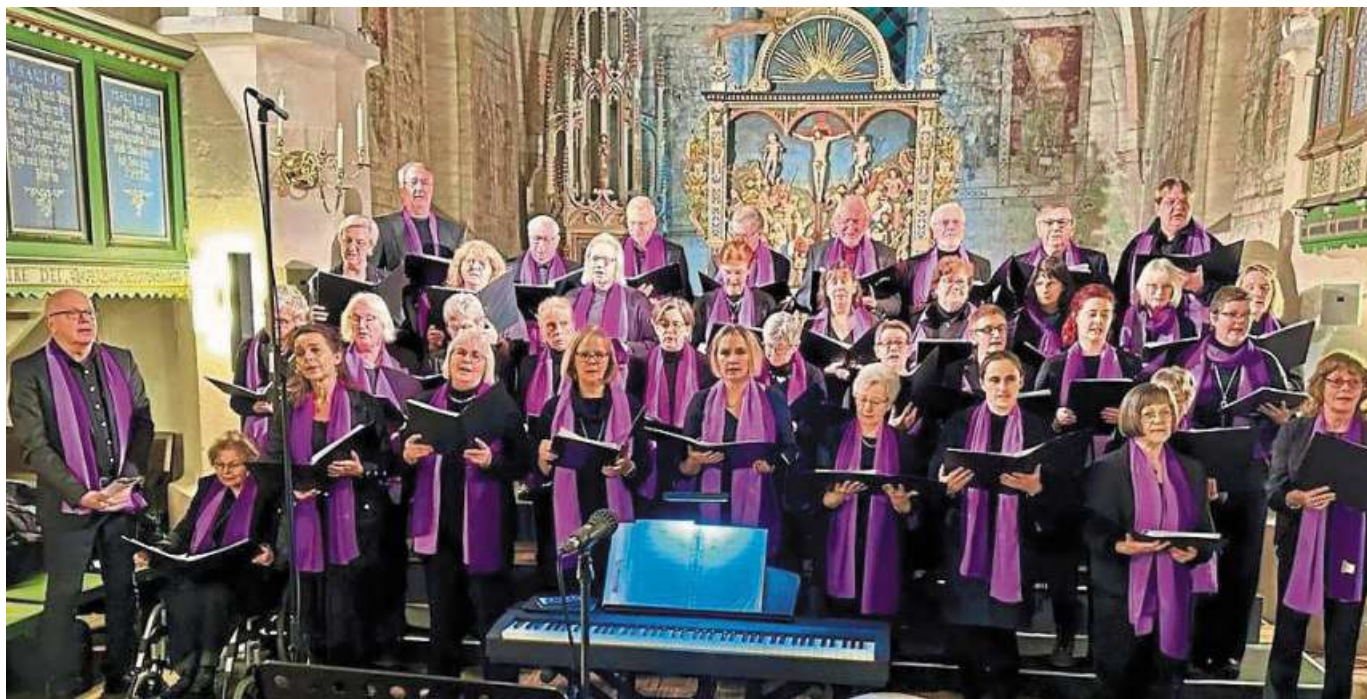
Der Chor „Himmliche Töne“ während seines erneut bis auf den letzten Platz besetzten Adventskonzertes in der Liebenauer Sankt-Laurentius-Kirche.

Landesbergen. Zu einer besonderen Andacht lädt die Kirchengemeinde Landesbergen für diesen Sonntagabend zu 17 Uhr in die Kirche ein. Im Rahmen des „Lebendigen Adventskalenders“ gestaltet der Posaunenchor Landesbergen eine Abendandacht – und lädt anschließend zum gemütlichen Beisammensein „unter der Empore“ ein. Neben Vortragstücken gibt es auch Adventslieder zum Mitsingen, kündigt Pastor Andreas Dreyer an. DH