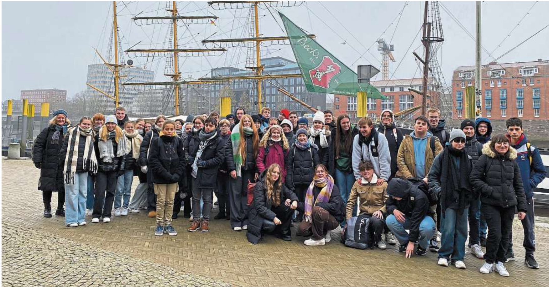
Auch Ausflüge wie der nach Bremen gehörten zum Programm.