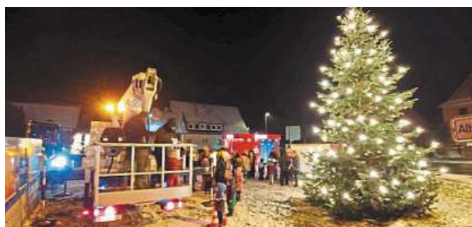
In Rodewald wurde der große Tannenbaum gemeinschaftlich geschmückt.

sei in diesem Jahr richtig winterlich gewesen, sodass die Heißgetränke sehr willkommen waren. An der Feuerschale konnten sich die Teilnehmenden zusätzlich wärmen, was viele erfreut habe. Nach einer Stärkung und netten Gesprächen wurde zusammen die Vorweihnachtszeit eingestimmt, teilt Sabrowski abschließend mit. Unterstützung habe es gegeben von der Firma F&M-Baumservice. DH