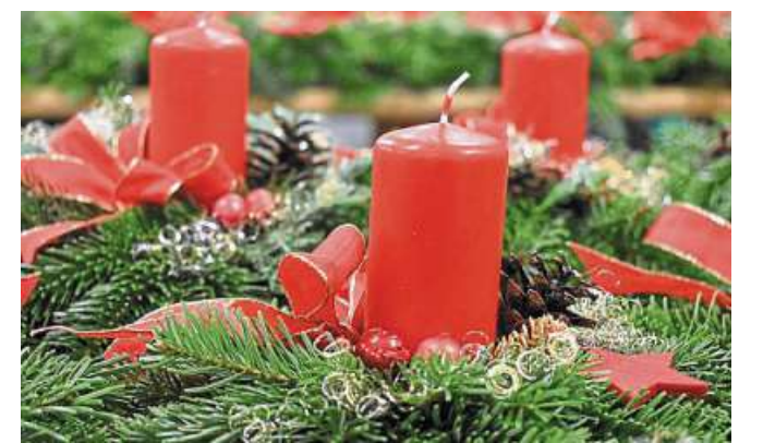
Eines der fertigen Gestecke.

Mittlerweile ist es allerdings kaum noch möglich, diese schöne Tradition aufrecht zu erhalten, da die Kosten deutlich gestiegen sind. Ganz besonderer Dank gilt daher dem Tannenhof Schlemmeyer für die Spenden der Tannen und dem Förderverein der Freiwilligen Feuerwehr Holtorf für die Unterstützung. cbf