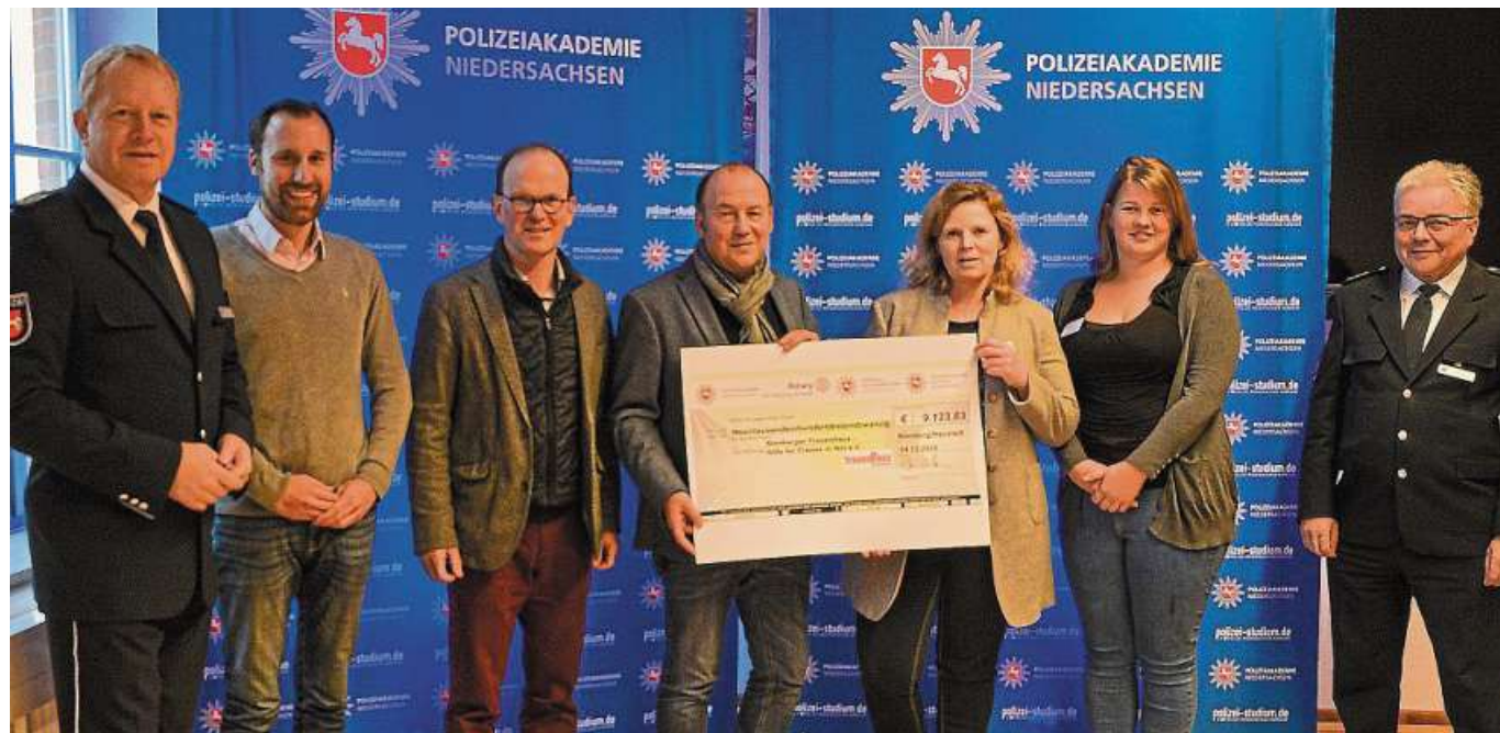
Die Spende überreichten die Veranstalter an den Verein.

der Richtungsfahrbahn Nienburg in dem Bereich ist für Anfang 2024 vorgesehen. Des Weiteren finden Restarbeiten am Brückenbauwerk in 2024 statt. Insgesamt betrachtet befindet sich die Maßnahme weiterhin gut im Zeitplan. Die zuständige Behörde für Straßenbau weist darauf hin, dass sowohl Fahrradfahrer als auch Fußgänger weiterhin den ausgeschilderten Umleitungsstrecken zu folgen haben. DH