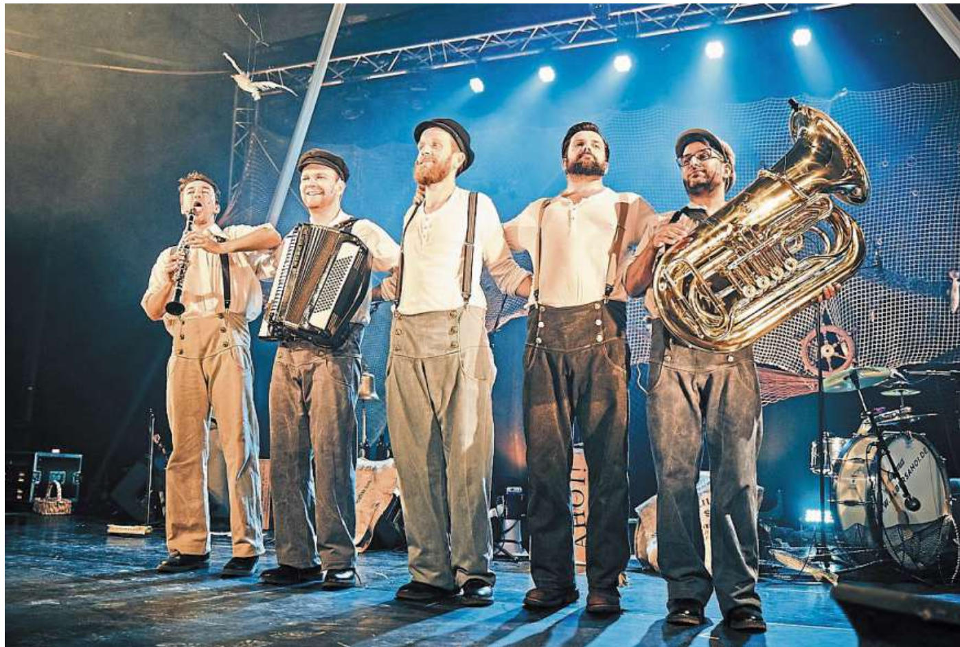
Mit viel Schwung und frischem Wind wollen fünf „Leichtmatrosen“ in der Varieté-Show „Albers Ahoi!“ das Nienburger Theaterpublikum in Silvesterlaune bringen.

Maritimes Varieté zur Einstimmung auf Silvester