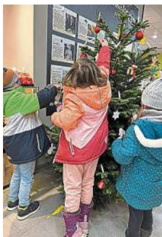
Beim Schmücken ihres Wunschbaumes haben die Kinder aus dem „Schwalbennest“ fleißig mitgeholfen.

Im nächsten Jahr wird zunächst sechs Monate lang für den Förderverein „Kinder-glück“ der Kindertagesstätte Kleeblatt im Nienburger Nordertor gesammelt. Hier soll die Spendensumme für das Anlegen eines Hochbeets genutzt werden. DH