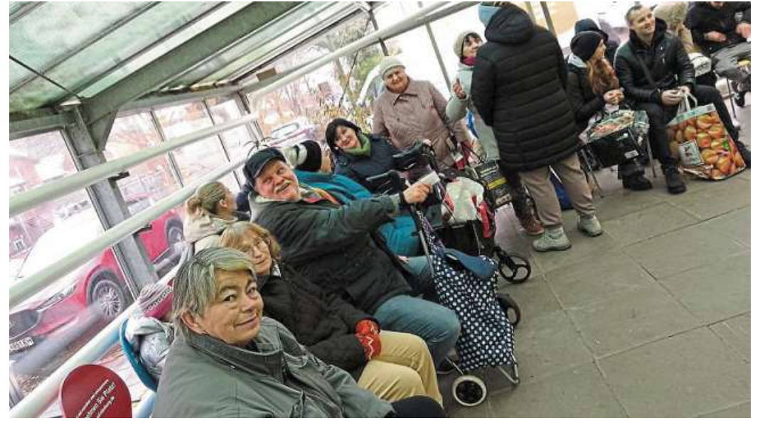
Mehr Kunden gehen nicht mehr: Die Stolzenauer Ausgabestelle der Tafel hat einen Aufnahmestopp verhängt.

In den Ausgabestellen in Nienburg und Hoya erwägt die Tafel noch keine einschränkenden Maßnahmen, schließt aber einen Aufnahmestopp in 2024 auch ausdrücklich nicht aus. „Wir sind abhängig von Entwicklungen in Niedersachsen, die wir überhaupt nicht beeinflussen können. Da verbietet es sich, dass wir weiter als zwei bis drei Wochen in die Zukunft schauen“, sagt der Nienburger Geschäftsführer. Bei Fragen ist Schmied unter Telefon (05021)9083450 erreichbar. nis