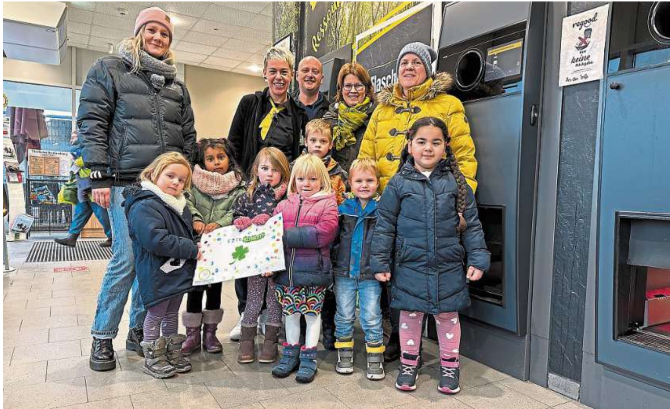
Die Kindertagesstätte Kleeblatt darf sich nächstes Jahr über die Spende aus einer der Pfandboxen freuen. Zum Dank gab es von der Gruppe schon vorab ein buntes Bild.

Keinesfalls dürfen allerdings die Bioabfälle in Plastiktüten, auch nicht in kompostierbaren, in der Biotonne entsorgt werden.