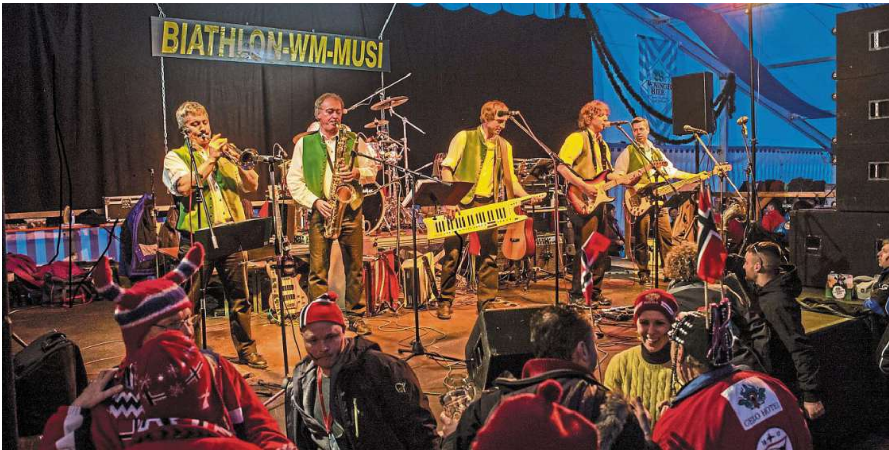
Die Biathlon-WM-Musi auf dem Festzelt beim Biathlon in Ruhpolding. Am 24. Mai gastiert die Stimmungsband in Wendenborstel.

100 Jahre Schützenverein Wendenborstel vom 24. bis 26. Mai / Kartenverkauf gestartet