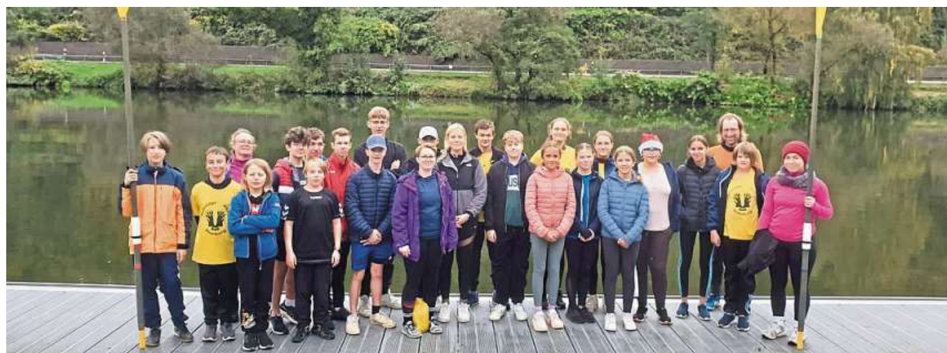
In der ersten Herbstferienwoche erlebte die Ruderriege der Albert-Schweitzer-Schule Nienburg ereignisreiche Tage im Ruderlager in Wilhelmshausen.

Ruderriege der ASS erlebte ereignisreiche Tage im Ruderlager in Wilhelmshausen