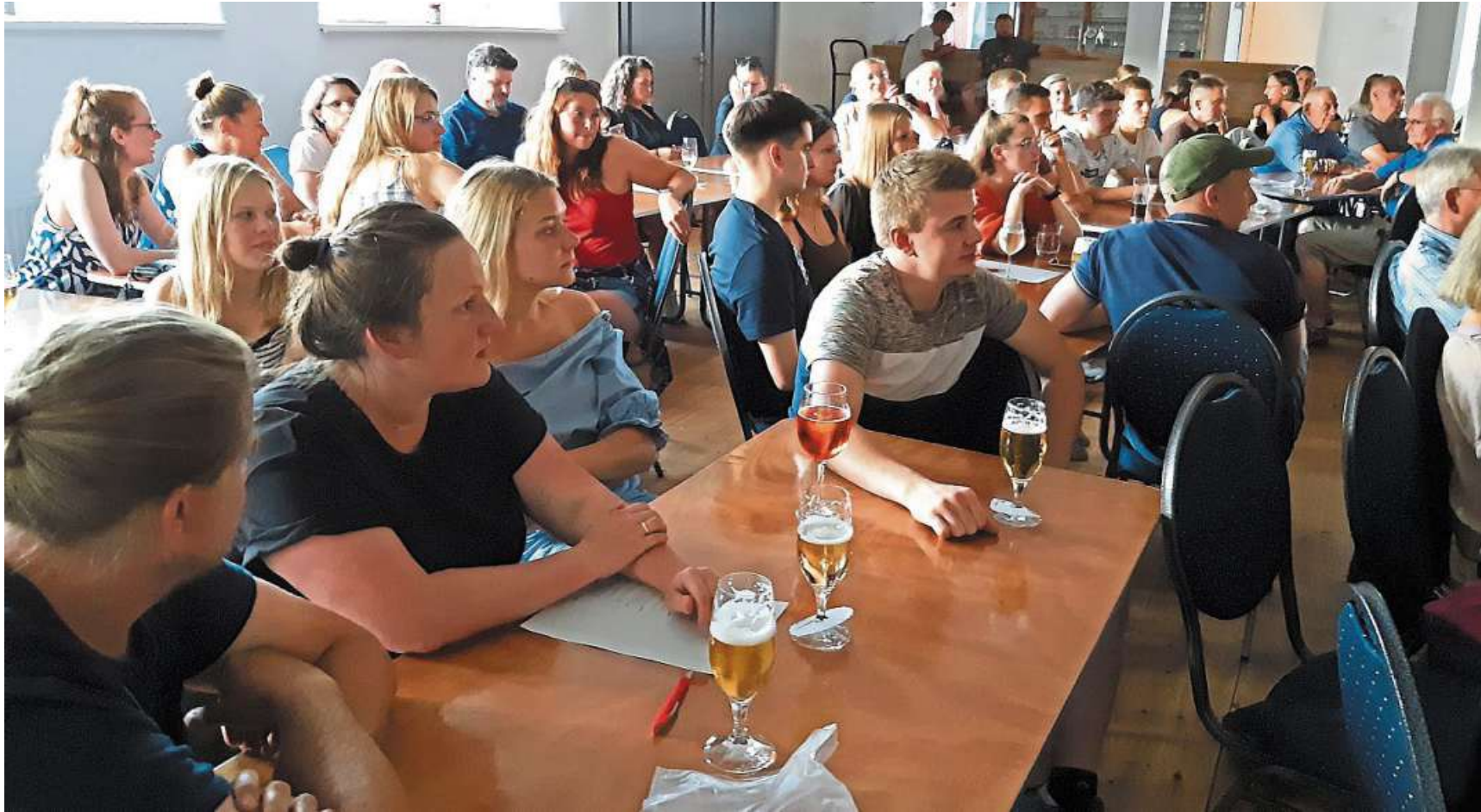
22 Teams mit den originellsten Namen waren gemeldet für das 1. Linsburger Kneipenquiz

Special-Edition-Rätselspaß als Auftakt zur Herzenswoche im „Lindenhof“