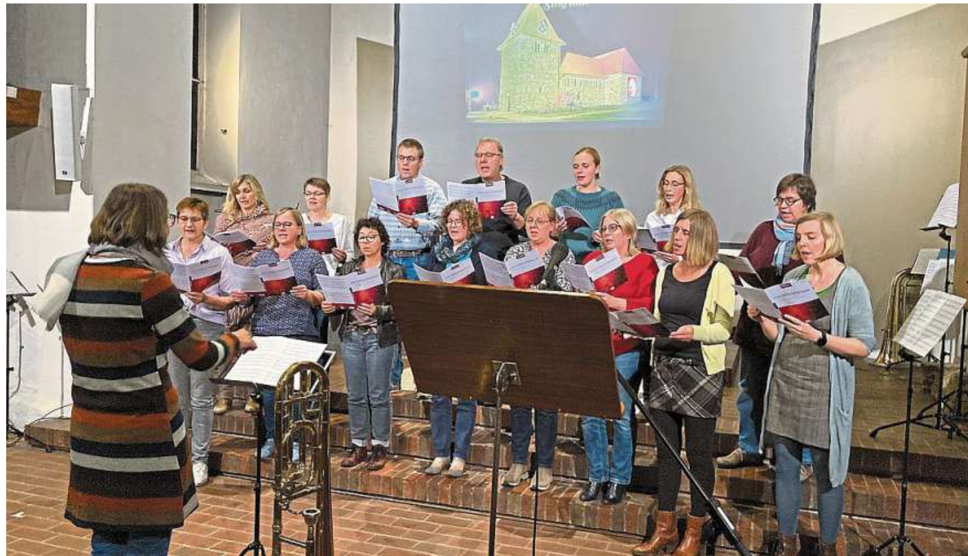
Singen nach Herzenslust: Das war am Montagabend die Devise beim Stiftungsfest in der Wietzener Kirche.

Klassiker wie „Drunken Sailor“, „Bridge Over Troubled Water“, „We Shall Overcome“ und „Country Roads“ konnten alle mitsingen. Und wer nicht textsicher war, für den wurden