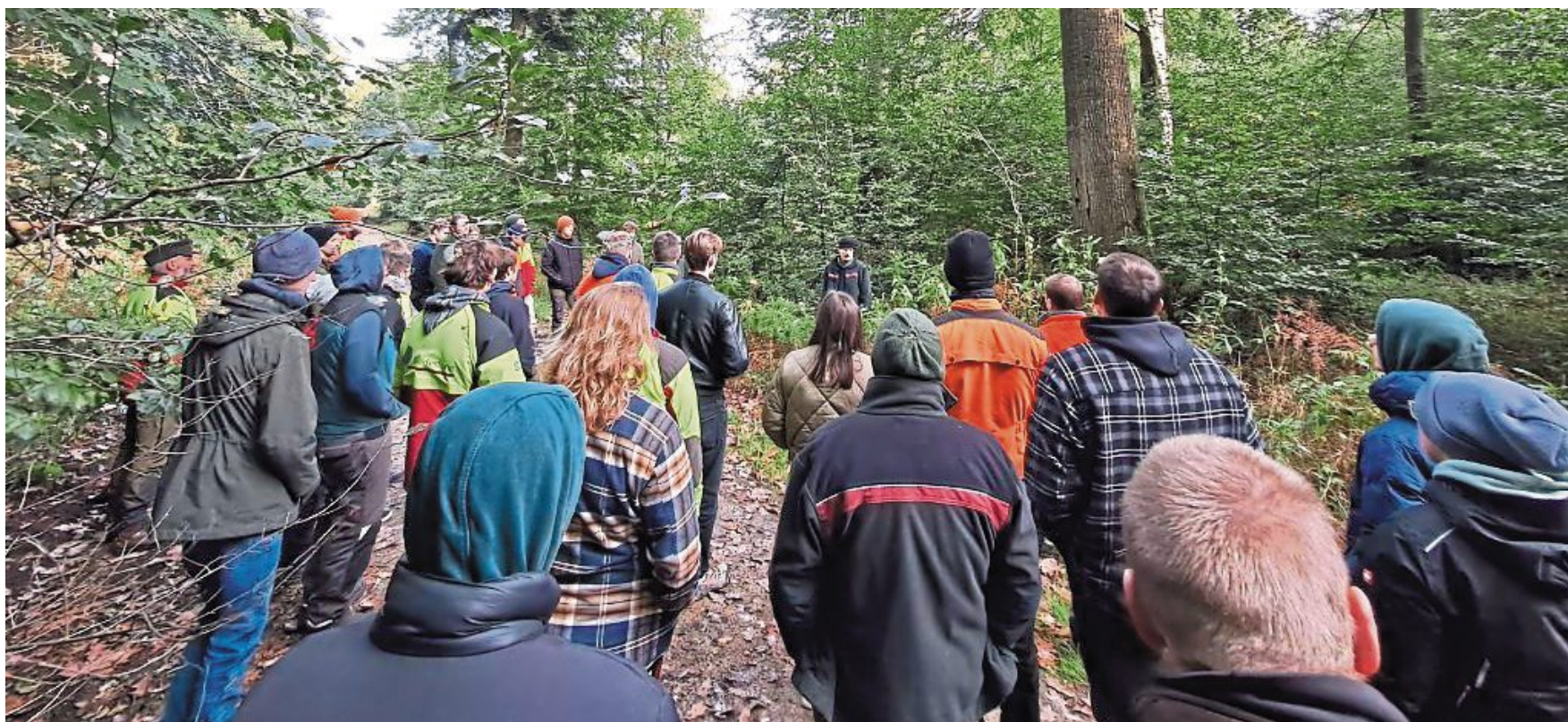
Erstmals nach vier Jahren Coronapause trafen sich jetzt nordniedersächsischen Forst-Auszubildende und ihre Lehrmeister wieder zu einem fachlichen wie persönlichen Austausch. Im Forstamt Nienburg lernten sie dabei die Pflege und Bewirtschaftung der Erdmannwälder kennen.

Forst-Auszubildende aus Nordniedersachsen trafen sich im Forstamt Nienburg