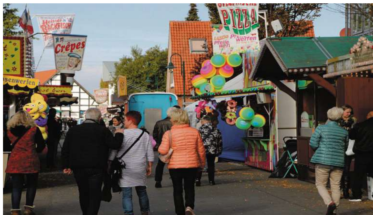
An diesem Wochenende findet im Flecken Uchte wieder der traditionelle Oktobermarkt statt.

Markttreiben, Partyspaß, Gewerbeschau und verkaufsoffener Sonntag