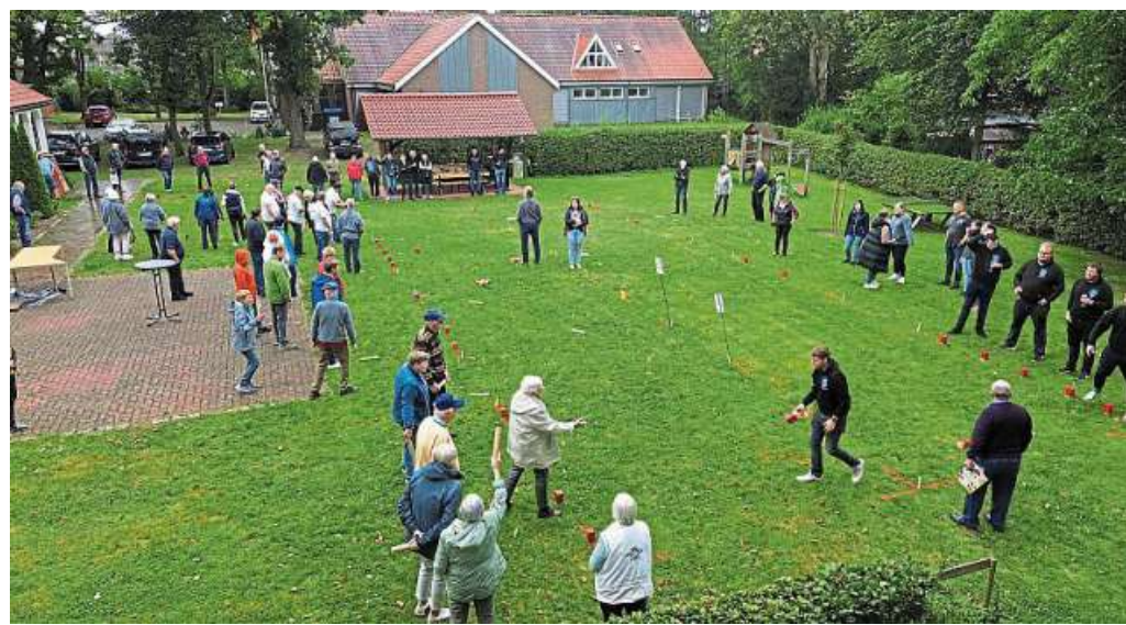
Viel Spaß hatten die Gäste beim Wikingerkegeln in Rohrsen

Bevor das Endspiel zwischen der Soldatenkameradschaft Borstel und der „Habadank“-Gruppe losging, gab es Kaffee und selbstgebackenen Zwetschen-, Apfel- und Butterkuchen. Die Sing- und Spielgemeinschaft geht davon aus, dass alle Mitglieder und Gäste einen schönen Tag in der Alten Schule in Rohrsen verbracht haben. Bedanken möchte sich der Vorstand bei allen Helfern und der Dorfjugend Rohrsen, die zum Gelingen beigetragen haben. DH