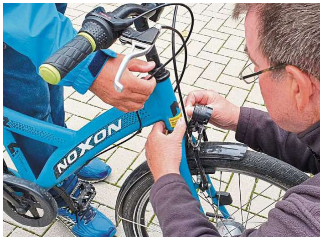
Der Registrierungsaufkleber wird mit einer Code-Nummer versehen, mit einer weiteren Deckfolie überklebt und härtet dann aus.

Nach den Zahlen der Polizei nahm die Zahl der entwendeten Fahrräder 2022 um knapp 14 Prozent gegenüber dem Vorjahr auf rund 266.000 zu. Man gehe von einer deutlich höheren Dunkelziffer aus, heißt es von der Behörde. Der Gesamtverband der Deutschen Versicherungswirt-