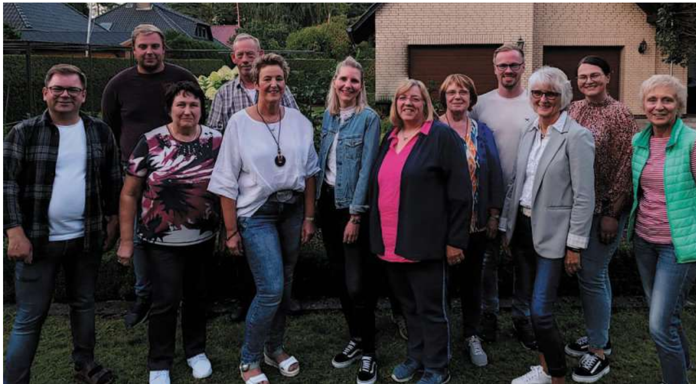
Neurosige Tieden“ brechen ab dem 28. Oktober bei der Theatergruppe Bahrenborstel an.

Theatergruppe Bahrenborstel startet in die neue Saison