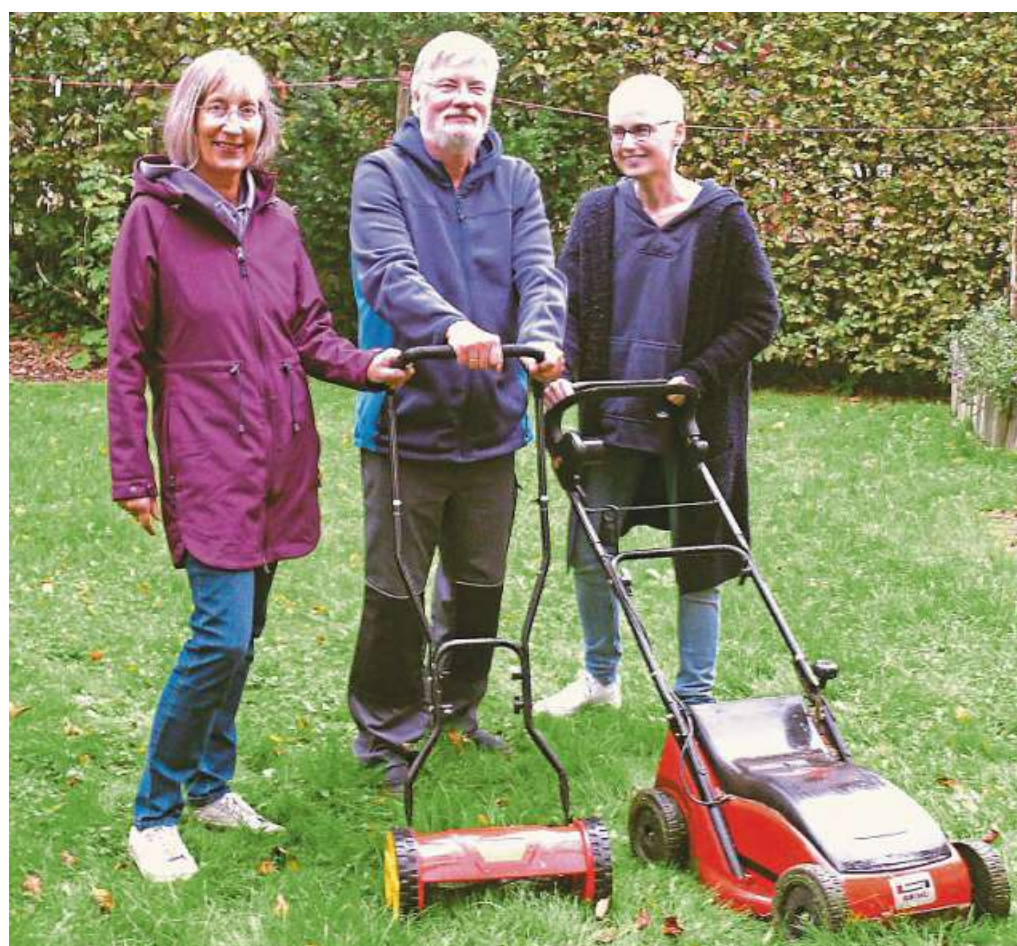
Braucht wirklich jeder Gartenbesitzer seinen eigenen Rasenmäher? Die Oldies for Future plädieren fürs Teilen.

Wenn mal etwas kaputt geht, das man selbst oder die nette Nachbarin nicht reparieren kann, helfen gerne und kostenlos die örtlichen Re-