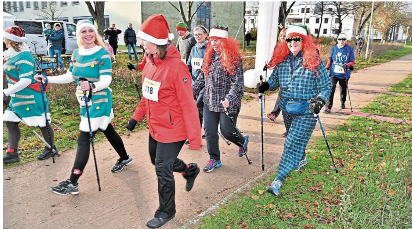
Man muss nicht schnell rennen können – beim Adventslauf darf auch gewalkt werden

Wie bereits in den Vorjahren stehen Spaß und der gute Zweck im Vordergrund: Das Startgeld von 7 Euro pro Starter (3 Euro für den Bambini-Lauf) wird zu 100 Prozent an die Trapez-Jugendhilfe in Liebenau gespendet. Dieser Verein bietet neben ambulanten Hilfen und Erlebnispädagogik auch eine Intensivbetreuung sowie eine stationäre Einrich-