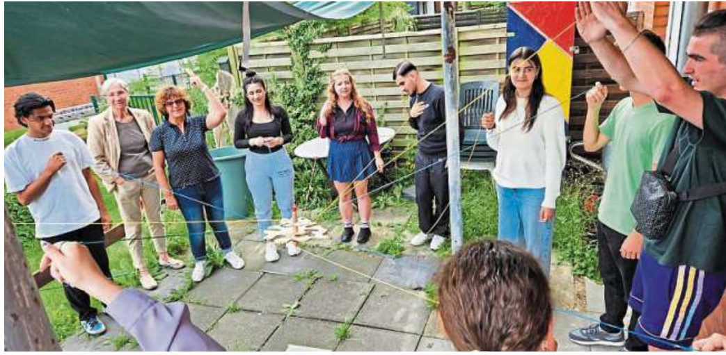
Der Kontakt zu deutschsprachigen Mitmenschen nimmt bei den Jugendlichen einen hohen Stellenwert ein.

fältig und sind sowohl in den künstlerischen und auch kulturellen Bereichen angesiedelt. Durch die gute nachbarschaftliche Vernetzung und