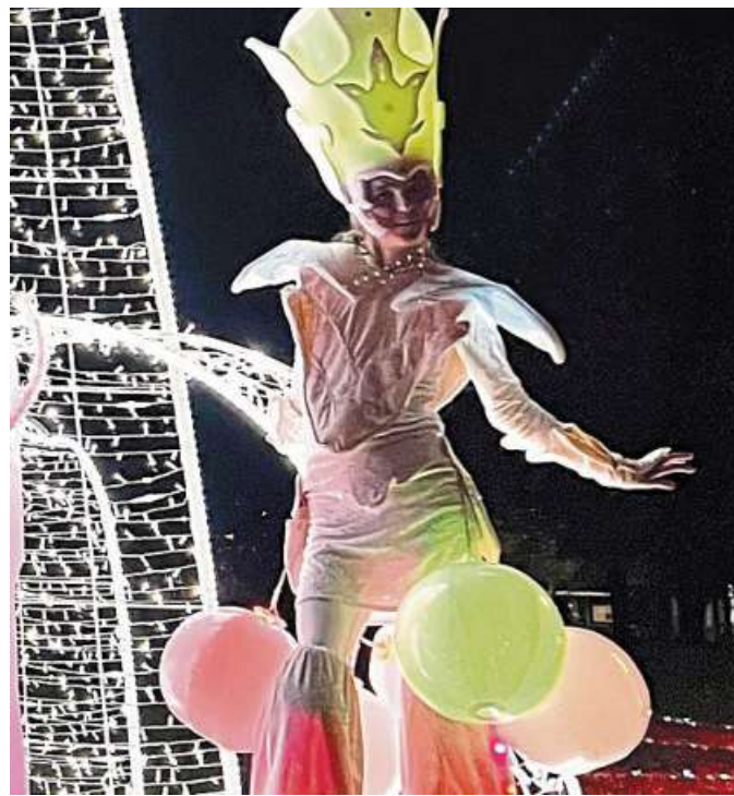
In dunklen Zeiten einen Lichtblick präsentieren: das will der Binderhaus-Verein Rodewald am 28. Oktober.

In dunklen Zeiten einen Lichtblick präsentieren. Das war schon die Idee des Vereins zum Lichterfest 2022. Das Konzept ging im letzten Jahr voll und ganz auf. Bei ungewöhnlich angenehmen Temperaturen kamen sehr viele Besucherinnen und Besucher in den Bindergarten