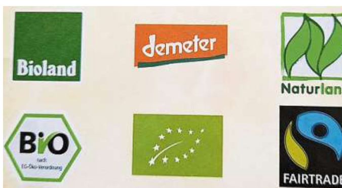
Diese Logos werben für nachhaltige Lebensmittel.

Allein durch die Umstellung auf eine flexitarische, also fleischarme Ernährung könnten wir die Treibhausgasemissionen um 27 Prozent senken. Dafür müssten wir in Deutschland laut Landwirtschaftskammer Niedersachsen unseren durchschnittlichen Fleischkonsum nur halbieren. Würden alle rein vegetarisch leben, könnte eine Senkung von 47 Prozent erreicht werden, bei veganer Ernährung sogar 48 Prozent, hat die Umweltschutzorganisation WWF be-