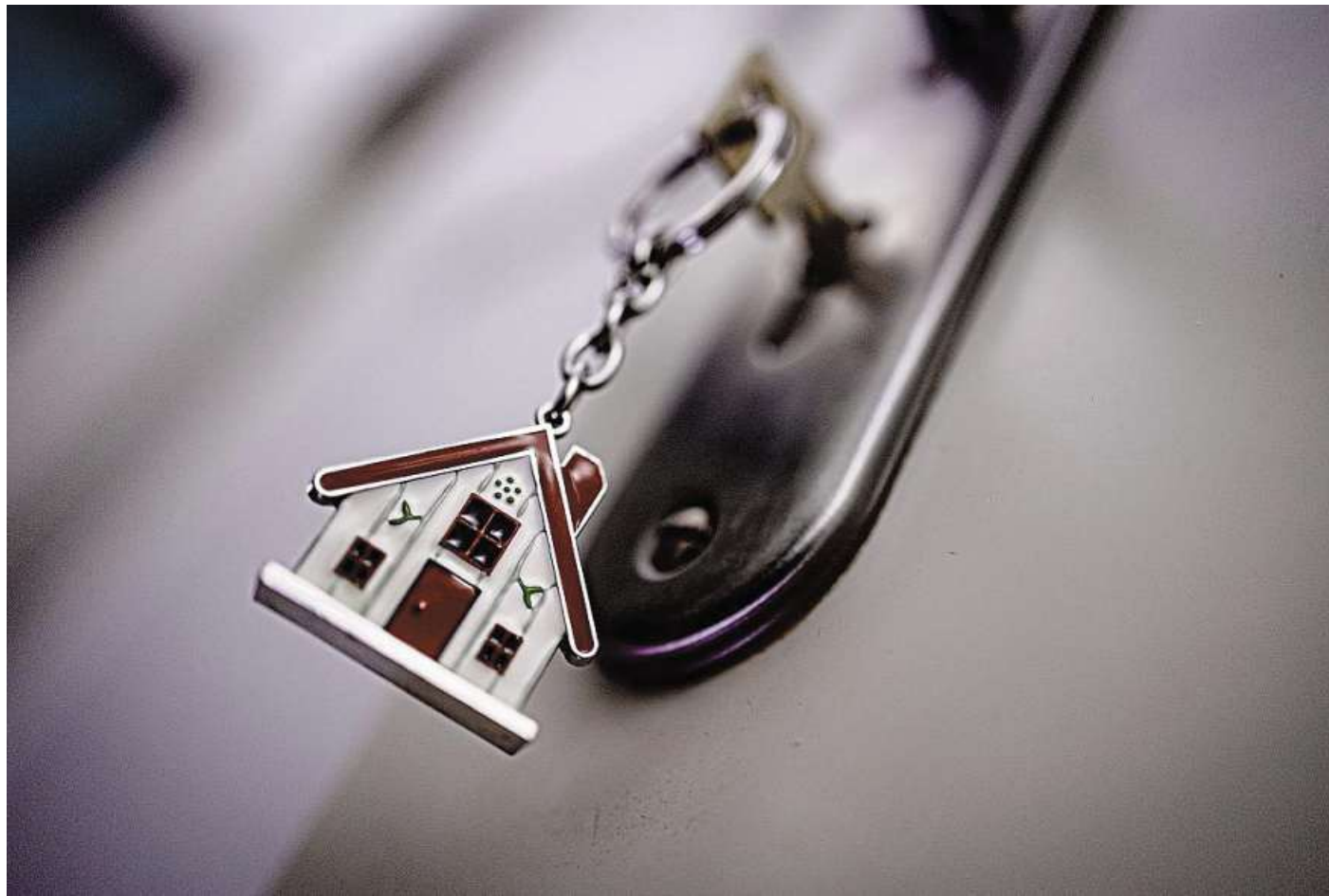
In den ersten sechs Monaten dieses Jahres gab es nach Angaben des Pestel-Instituts im gesamten Landkreis Nienburg (Weser) lediglich 144 Baugenehmigungen für neue Ein- und Zweifamilienhäuser.

Nur wenige Menschen könnten sich die eigenen vier Wände heute noch leisten. „Hohe Zinsen, hohe Bauland-