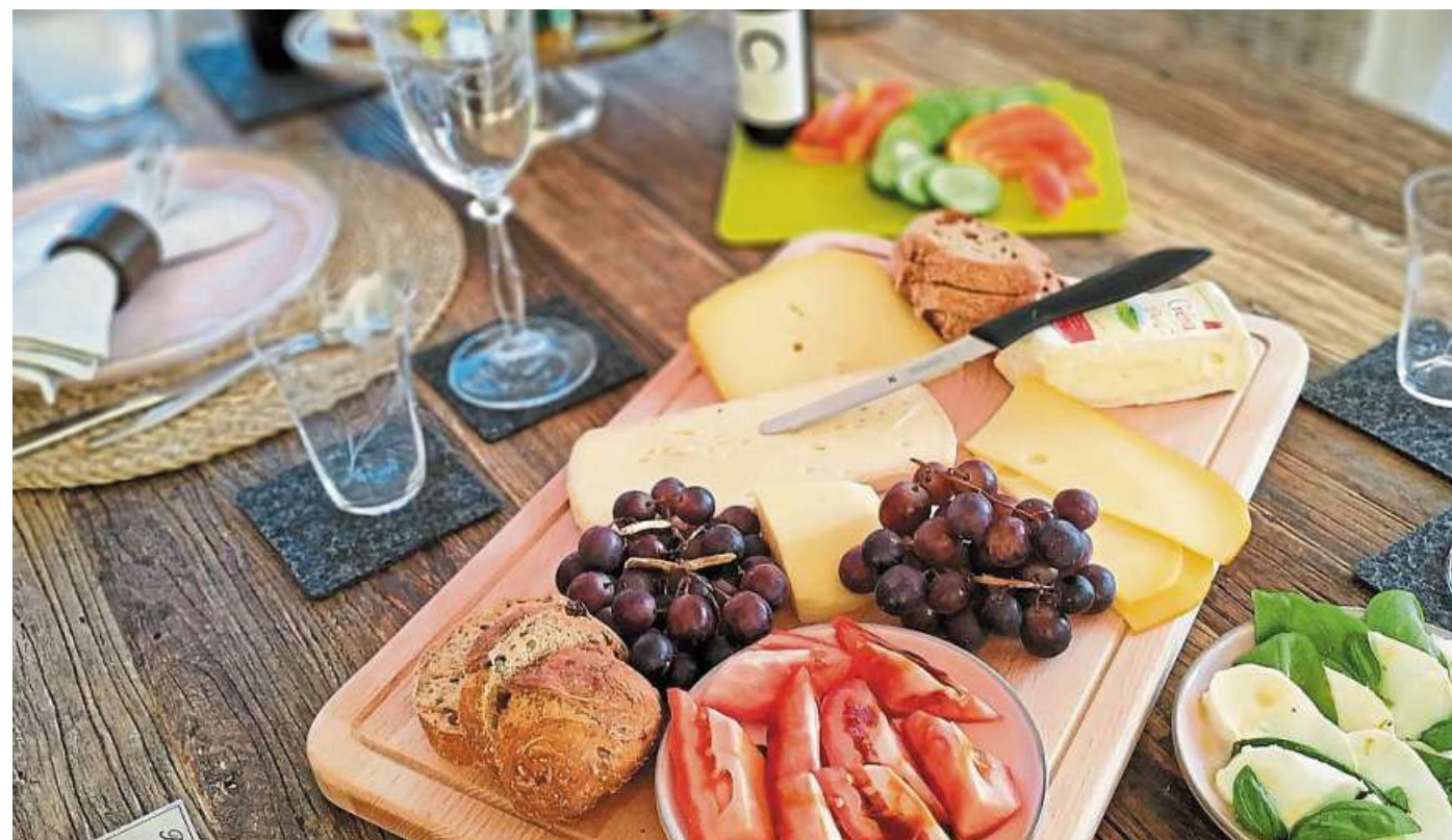
Es ist durchaus möglich, es sich auch ökologisch wertvoll schmecken zu lassen.

Was können wir also tun, um uns klimafreundlicher zu ernähren? Weniger Fleisch und tierische Lebensmittel konsumieren, denn je weniger Fleisch auf unseren Tellern