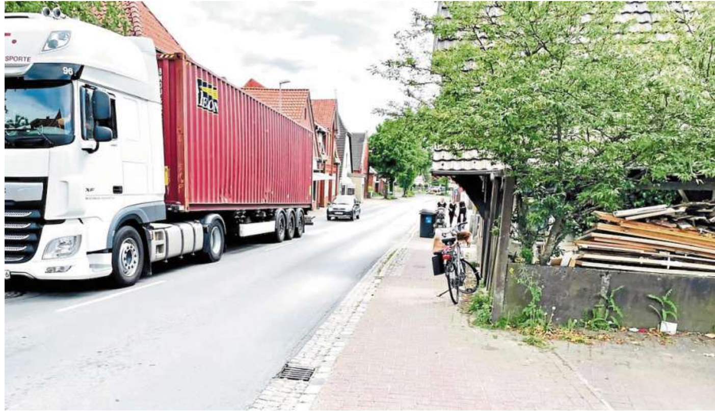
Ortsdurchfahrt Liebenau: Enge Straßen und Gehwege, viel Verkehr und hohe Geschwindigkeiten - jetzt will die Anwohnerschaft dagegen mobil machen.

Das Gemeinwesen- und Quartiersprojekt unter Leitung von Marthe Nietfeld lädt für Donnerstag, 5. Oktober, zu 18 Uhr in das Rathaus Liebenau in die Ortstraße 28 zur Gründungsversammlung ein. Ziel ist, die Interessen der Anwohnerschaft zu bündeln und stärker wahrnehmbar zu machen. Die besonderen Herausforderungen, die das Wohnen an einer Hauptstraße mit sich bringt, sowie Maßnahmen zu Verbesserung der Situation sollen besprochen und Umsetzungs-