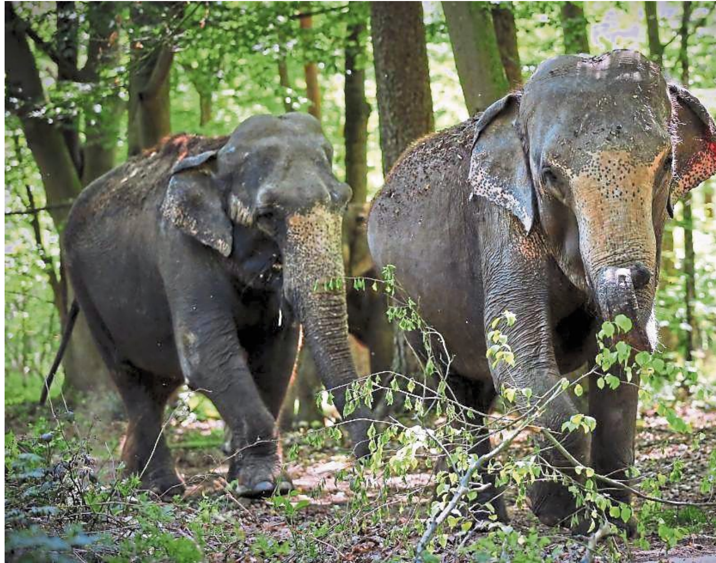
Asiatische Elefanten im Tierpark Ströhen: Zookarten-Inhaber können sie am 14. und 15. Oktober kostenlos bestaunen. FOTO: TIERPARK STRÖHEN

Die Zoos haben eine immens wichtige Aufgabe, ein