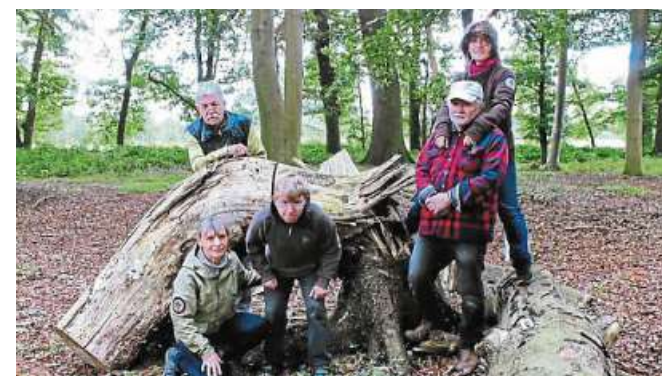
Die Natur erlebten Teilnehmerinnen und Teilnehmer in Raddestorf.

„Für einen kleinen Imbiss ist gesorgt. Wir freuen uns auf ein paar schöne Stunden und nette Gespräche“, kündigen die Veranstalter an. DH