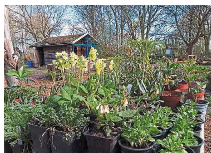
Der BUND-Garten ist an diesem Sonntag zum letzten Mal geöffnet.

Herbstzeit ist Pflanzzeit. Nun können Lücken in Pflanzungen aufgefüllt oder neue Beete angelegt werden. Deshalb bietet die Garten-AG noch einmal heimische Staude- und Gemüsepflanzen, zum Teil aus eigener