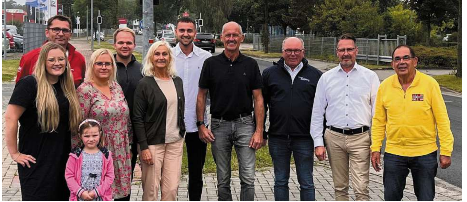
Gewerbetreibende organisieren wieder den „Family Day“ am Nienburger Südring.