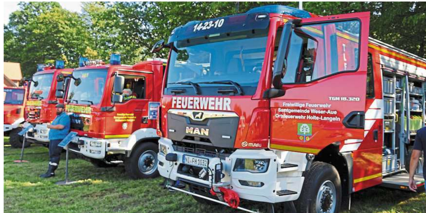
Das neue TLF 3000 ist der Hingucker am Tag der offenen Tür.

Malte Jokiel stellte das TLF mit einem Fahrgestell von MAN, Typ TGM mit 320 PS und dem Aufbau von Inturi vor. Das Fahrzeug hat 4000 Liter Wasser an Bord und verfügt über einen Frontwasser-