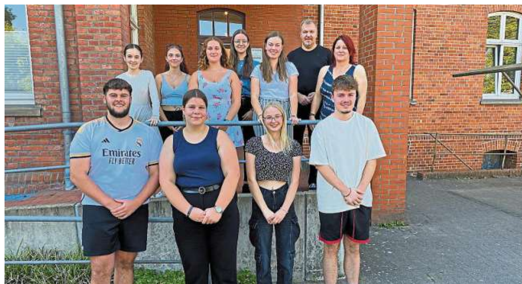
Neun junge Leute sind in der Samtgemeinde Mittelweser bereits als FSJ-ler im Einsatz, weitere sind willkommen.

Die Einsatzstellen sind die Regenbogenschule in Stolzenau, die Grundschulen in Lee-