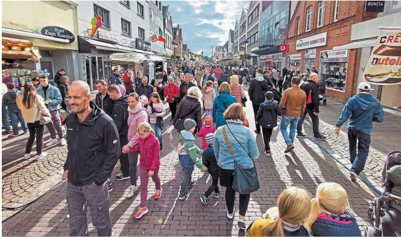
Nienburgs Altstadtfest mündet auch in diesem Jahr in einen verkaufsoffenen Sonntag.

Treffpunkt ist um 10 Uhr an der Nienburger Fußgängerbrücke. Anmeldung – mit dem Hinweis „Pause am Mehberger Kiosk“ oder „Ich versorge mich selbst“ - und weitere Informationen sind bis zum 28. September an dieter.mehring@t-online.de oder 0175-1923700 zu richten.DH