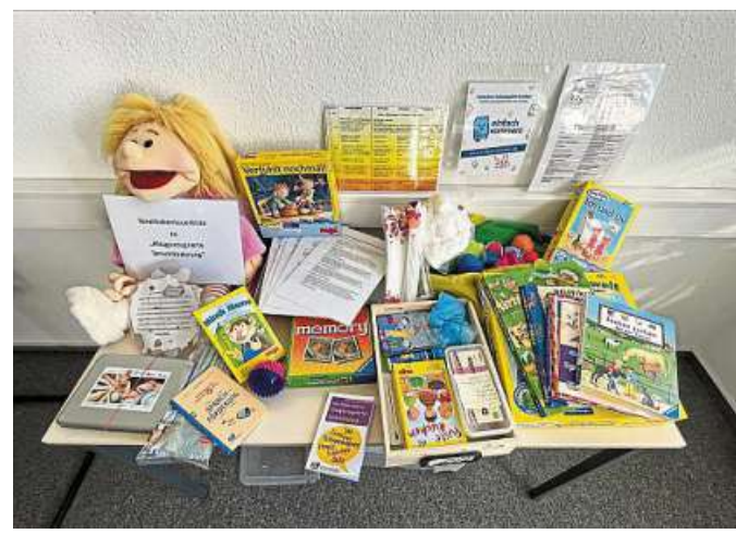
Der Landkreis stellt interessierten Kindertagesstätten ab sofort eine innovative Themenkiste zur Förderung der Sprachentwicklung zur Verfügung.

Durch gezielten Einsatz von altersgerechten, interaktiven Spielen, Büchern und kreati-