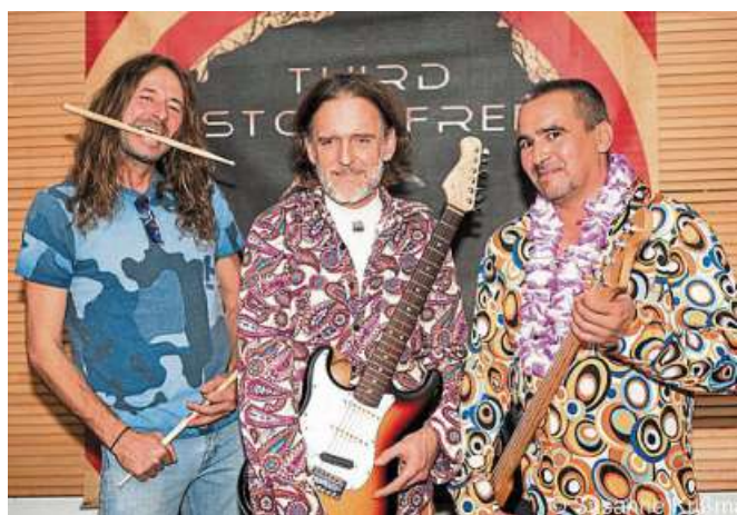
Third Stone Free gastieren am 7. Oktober in der Liebenauer Kulturscheune.