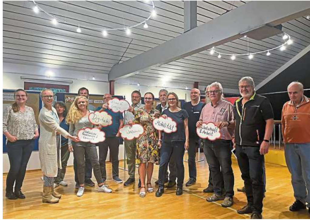
Mitglieder der Arbeitsgruppe Nachhaltigkeit in der Samtgemeinde Uchte beim Themenworkshop.

Am 18. September hat sich die Arbeitsgruppe erneut im Gehannfors Hof in Warmen getroffen und mit dem Plan-