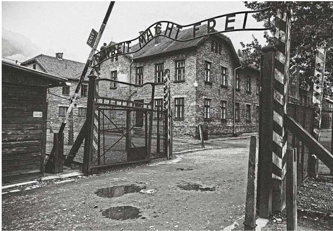
Maciej Michalczyks Fotos von der Gedenkstätte Auschwitz sind Bilder einer Architektur des Todes, die als Mahnung im Gedächtnis der heutigen und aller kommenden Generationen bestehen bleibt. Thomas Gatter vervollständigte die Ausstellung mit poetischen Texten, die er anhand von dokumentierten Aussagen von Überlebenden geschrieben hat.

Wanderausstellung „Architektur des Todes“ ab dem 12. Oktober im Kulturwerk