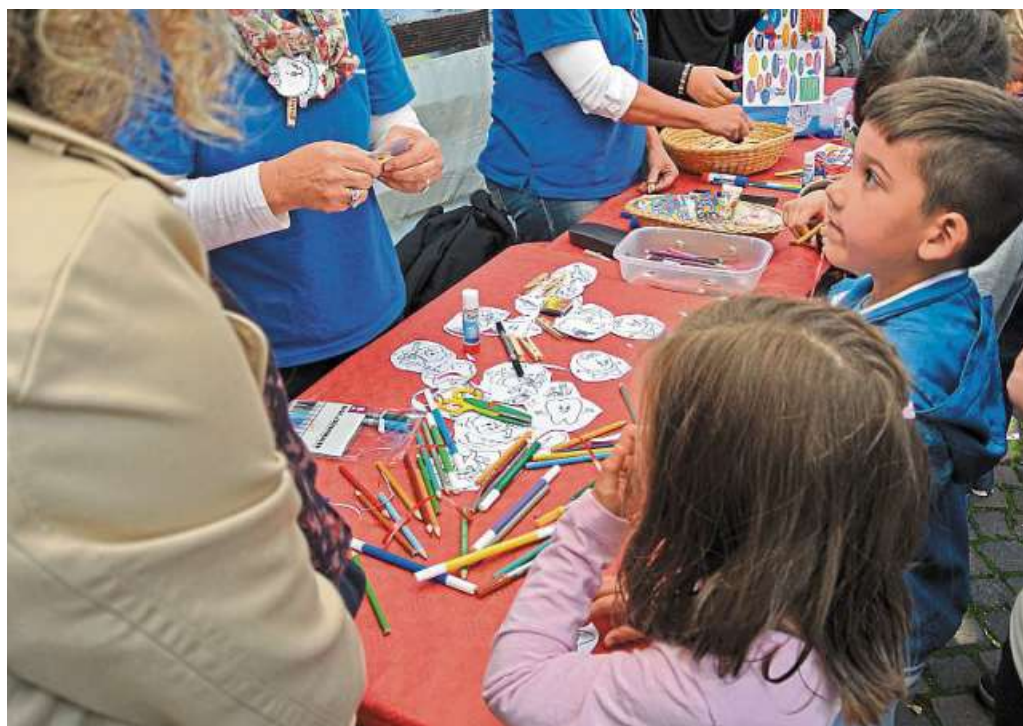
Beim Kinder-Altstadtfest am Freitag gibt es an über 20 Ständen Angebote für die Jüngsten. An ein Rahmenprogramm mit Musik, Kaspertheater und Schatzsuche ist ebenfalls gedacht.

Mit einem Stand dabei sind: TKW Nienburg, TKW Nienburg Basketballsparte, Jugendfeuerwehr Nienburg, Verkehrswacht Landkreis Nienburg, Kreativ 83, Sprotte, Polizeiinspektion Nienburg/Schaumburg, Nienburger Tafel, NABU, DRK-Kreisverband Nienburg, Kita Kleine Krähe, Kita Löwenzahn, Kreisverband AWO Nienburg, Schulen Rahn, La Bottega, Nienburger Kulturwerk, Sozialpädagogische Schule Nienburg, Friseur Capillago, Museum Nienburg, Kita Klee-