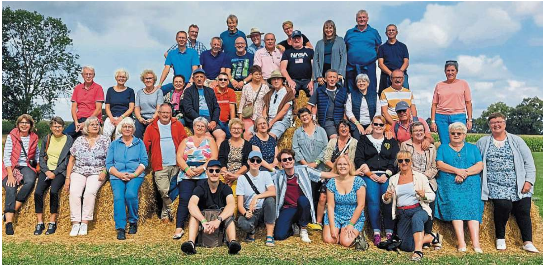
Gute Laune hüben wie drüben: die Steimbker mit ihren Gästen aus Frankreich.

Die Gäste erwartet eine Zeitreise durch die Geschichte des Weserfleckens. Während eines Spaziergangs werden die schönsten Ecken und Winkel erkundet. Außerdem wird Interessantes und Wissenswertes über Stolzenau vermittelt, etwa über die Stolpersteine. Der Rundgang endet im Heimatmuseum. Die Führung kostet 9 Euro, zahlbar an der Tageskasse. Die Anmeldung erfolgt bei der VHS Mittelweser telefonisch unter 05761/9026209, per E-Mail an vhs-Mittelweser@gmx.de oder postalisch an Martina Broschei, Kleine Geest 5, 31592 Stolzenau mit Angabe der Kursnummer 24F1J510. Anmeldeschluss ist der 19. September. DH