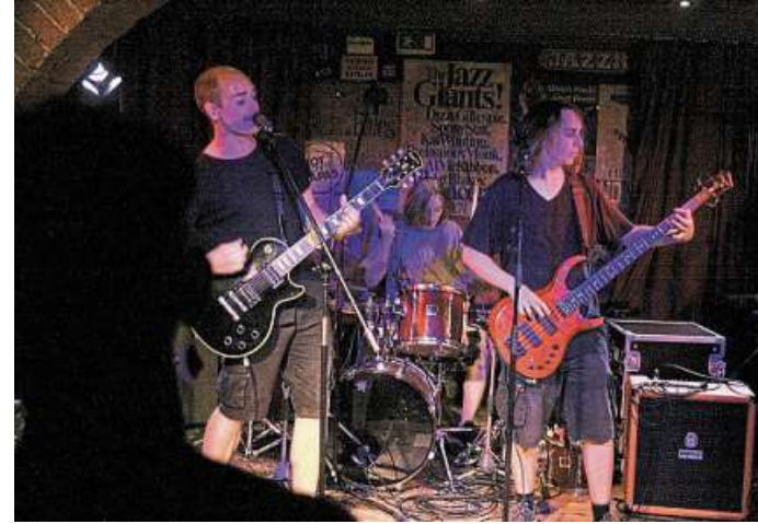
Auch „Unsparrow“ aus Syke sorgte für gute Laune im Jazzkeller.