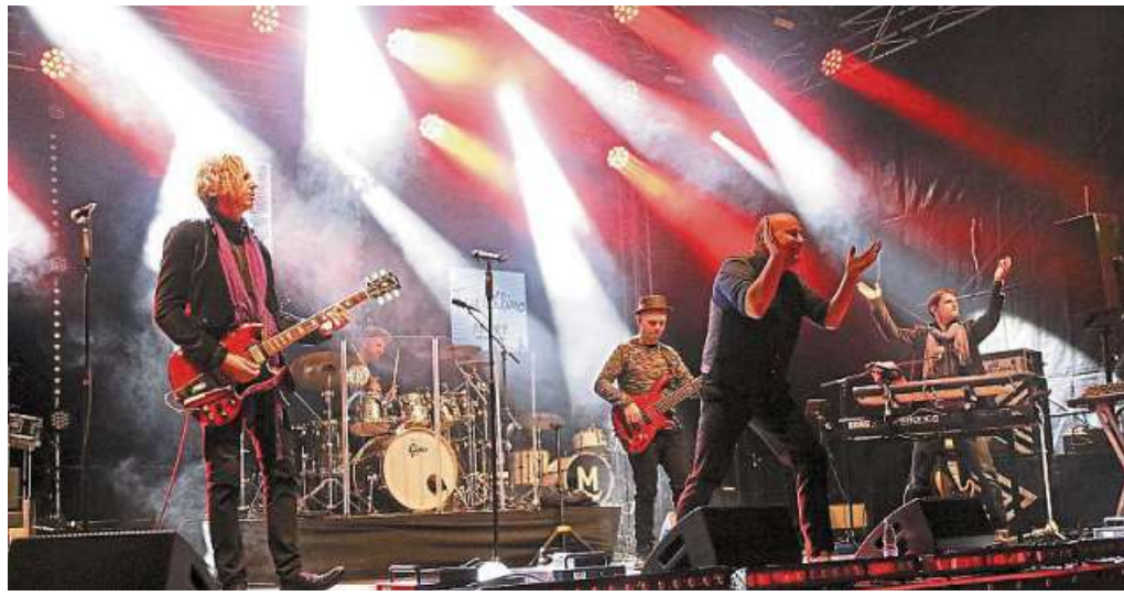
Am Altstadtfest-Donnerstag startet das Bühnenprogramm auf dem Kirchplatz.

■ Kirchplatz: Die Band „Mr. Feelgood“, die sich selbst als „die Partyrockers aus den Bergen“ bezeichnet, spielt ab