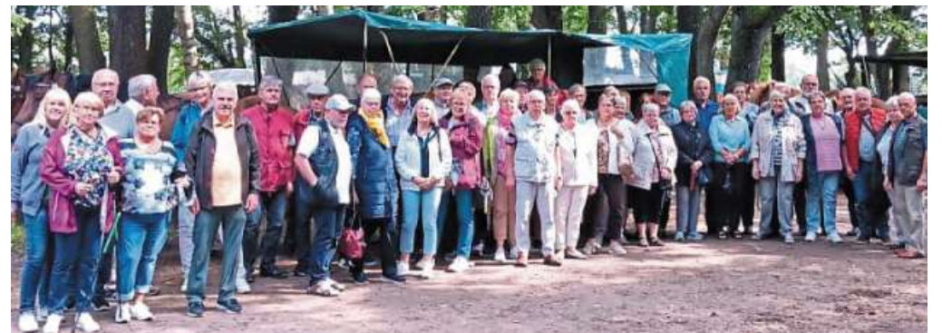
Viel erlebt hat die Soldatenkameradschaft Wenden.

Tagesausflug führte aus Wenden in die Lüneburger Heide