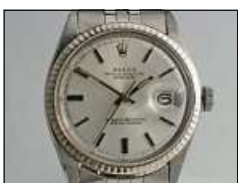
Markenuhren werden auch angenommen.