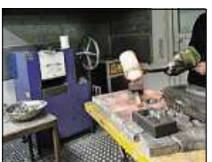
Eigene Schmelzöfen minimieren Kosten bei Der Goldmann