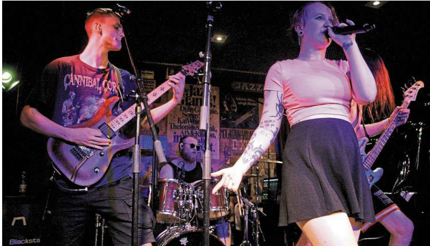
Brachialer Metal und charttauglicher Pop-Charme: „LaVila“ aus Osnabrück.

Für dieses Jahr sind noch weitere Events geplant. Unter anderem wird die Rockinitiative ein Konzert für Rock-Fans am 17. November ausrichten. Wer auf dem Laufenden bleiben möchte, kann der Rockinitiative Nienburg bei Facebook oder dem „Burnout“-Festival auf Instagram folgen oder sich auf der Website www.rocknienburg.com informieren. DH