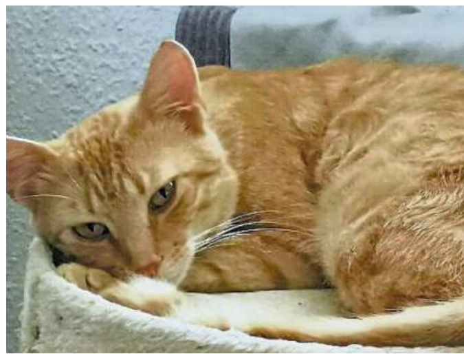
Kater „Nicky“ hat in seinem Leben schon viel Pech gehabt.

Nicky soll in ein liebevolles Zuhause vermittelt werden, in dem er als Einzelprinz verwöhnt und gekuschelt wird oder wo schon Katzen oder Kater mit den gleichen Erkrankungen leben. Ein Zuhause mit gesichertem Frei-