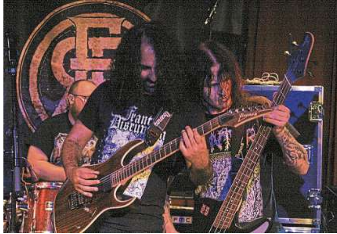
Eingeleitet wurde der Abend von „Eden Rider“ aus Hannover.