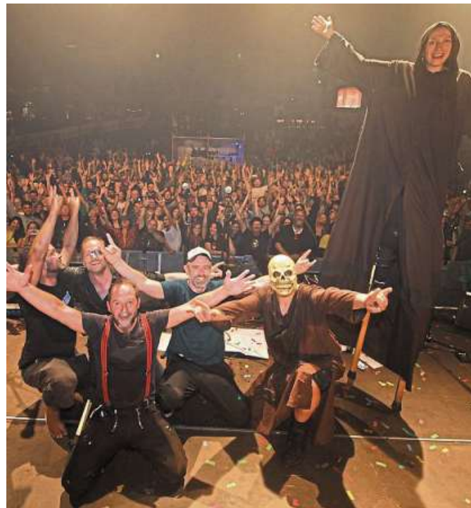
Auch die Monks wollen den Gästen einheizen.

Die Rockinitiative Nienburg organisiert und veranstaltet als gemeinnütziger Verein