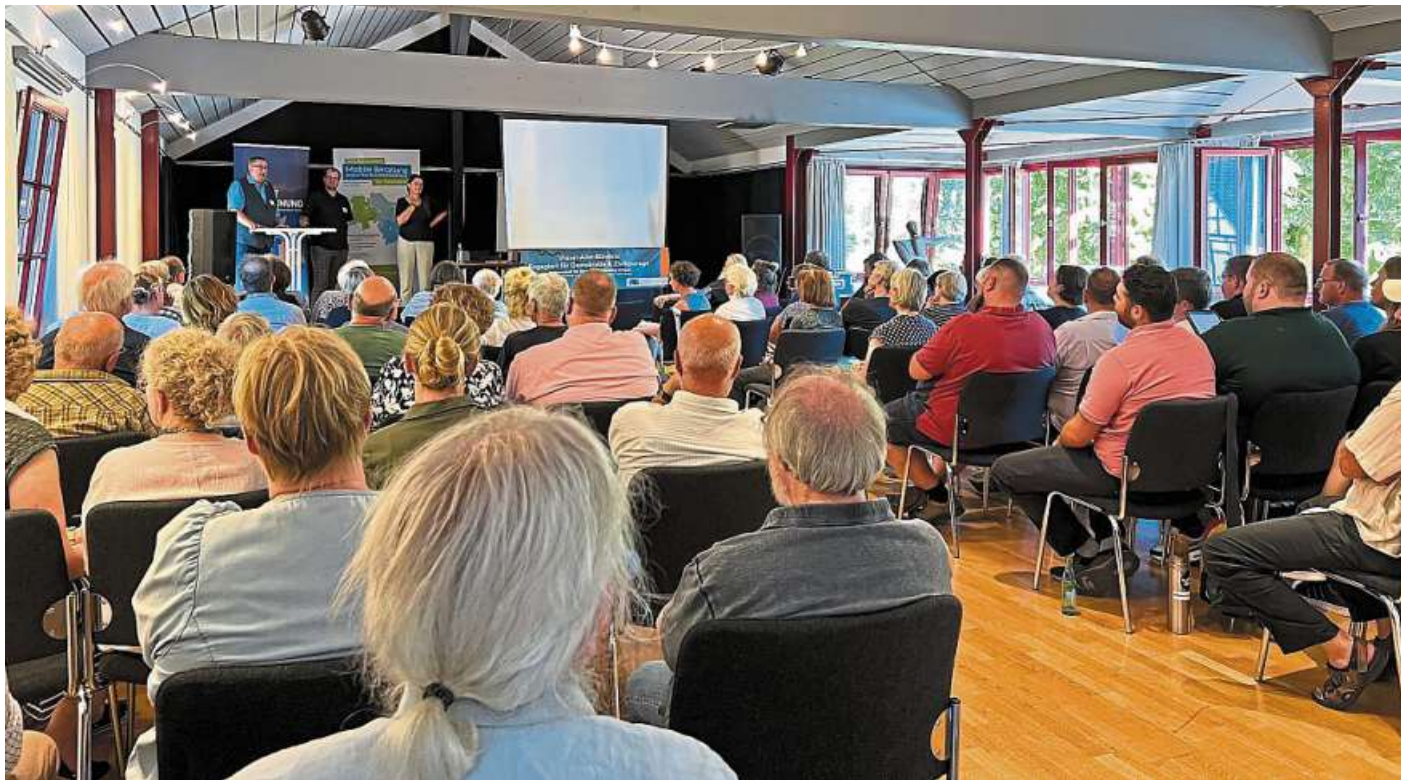
„Extreme Rechte im Südkreis Nienburg“ war das Thema der Veranstaltung, zu der am Freitag mehr als 80 Interessierte ins Uchter Bürgerhaus gekommen waren.

„Extreme Rechte im Südkreis Nienburg“ Thema im Uchter Bürgerhaus