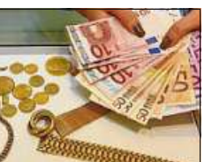
Sofort Bargeld selbstverständlich!

Lange Straße 70 (gegenüber Netto) · 31582 Nienburg · Tel. (05021) 9229289 Mo. – Fr. 10.00 – 16.00 Uhr geöffnet!