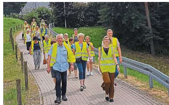
Nienburgs Landfrauen verbrachten informative Stunden beim BAWN und auf der „Kräher Höhe“.