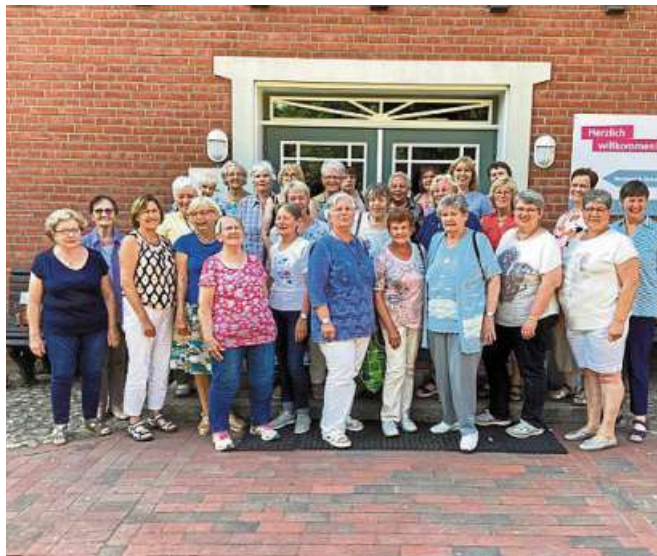
Rodewalds Landfrauen waren unterwegs.

Rodewald. Am Sonntag, 9. Juli, wird im Heimatmuseum Rodewald weiter am Webstuhl gearbeitet. Nachdem bereits die Hälfte der Kettfäden, also die Längsfäden, für ein neues Gewebe geschärft wurden, soll nun die Arbeit fortgesetzt werden. Das Abmessen der Schar Fäden ist eine Arbeit, die spezielles Wissen erfordert und die ebenso wichtig ist, wie der Prozess des Eintrags des Schussfadens, also der Tätigkeit, die man gemeinhin als Weberei bezeichnet. Interessierte sind zum Zuschauen und Mit Helfen von 15 bis 17 Uhr vielmals eingeladen. Das Heimatmuseum hat die Adresse Hauptstraße 3. DH