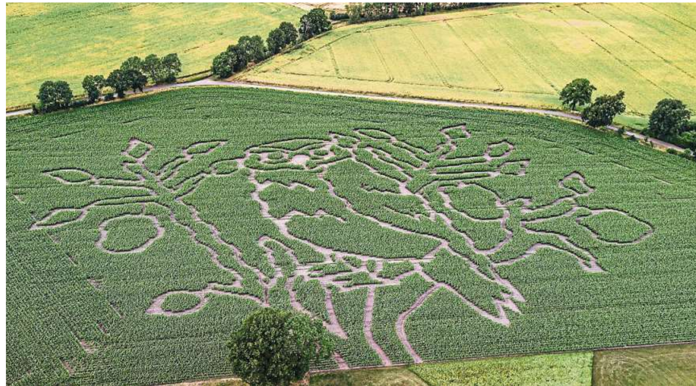
Die Drohnenperspektive zeigt's: Ein Steinkauz auf Obstzweigen prägt diesmal das Gängesystem des Maislabyrinths in Wietzen.