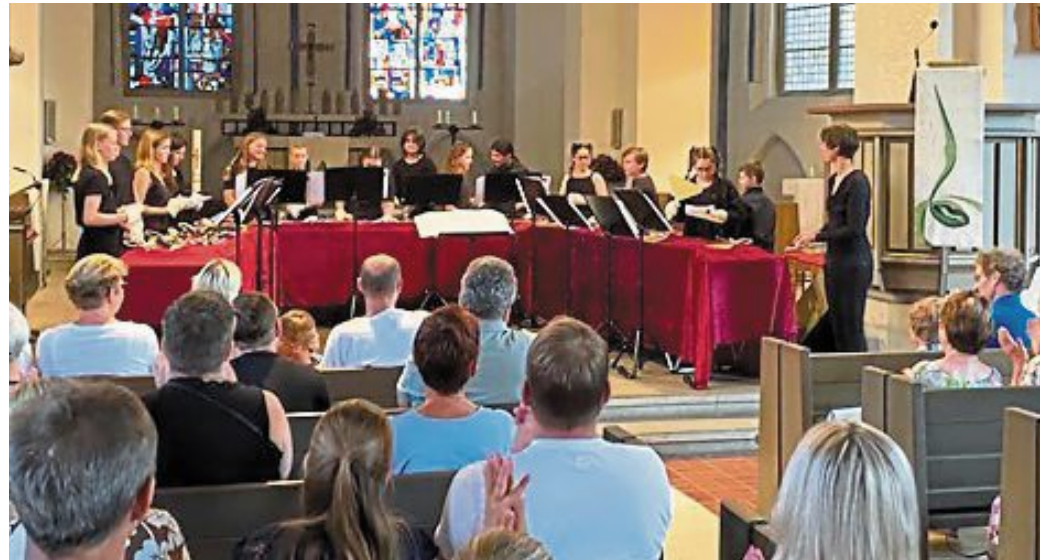
Zauberhafte Belleplates-Klänge waren jetzt in Nienburgs Martinskirche zu hören.

Neben bekannten Melodien wie dem Thema aus dem Film „Schindlers Liste“ oder Pop-