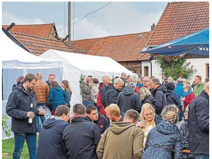
Trotz des Wetters war das Weinfest in Holzhausen ein voller Erfolg.

Das Fest ist allerdings nur so erfolgreich, weil es von vielen ehrenamtlichen Helferinnen und Helfern unter-