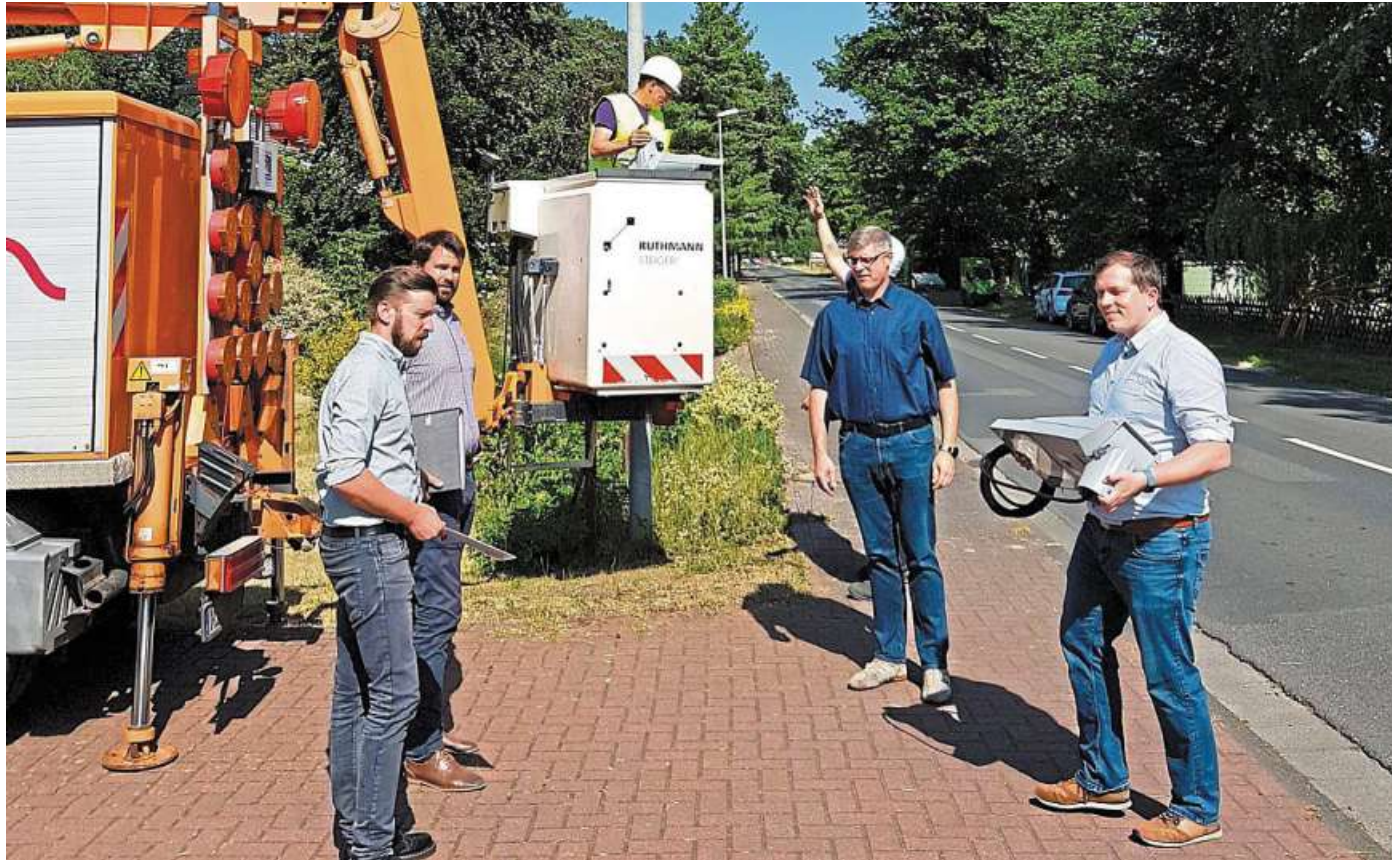
Lampentausch in Rodewald: Eine neue LED-Leuchte verbraucht 77 Prozent weniger Strom.

Inklusive Entsorgung der alten Leuchtmittel kostet das rund 182 000 Euro. Fördermittel sollen den Finanzaufwand für die Kommune auf 127 000 Euro