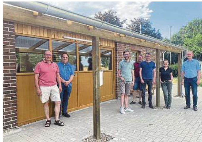
Das Sporthaus in Huddestorf war Ziel des Bau- und Wegebauausschusses.