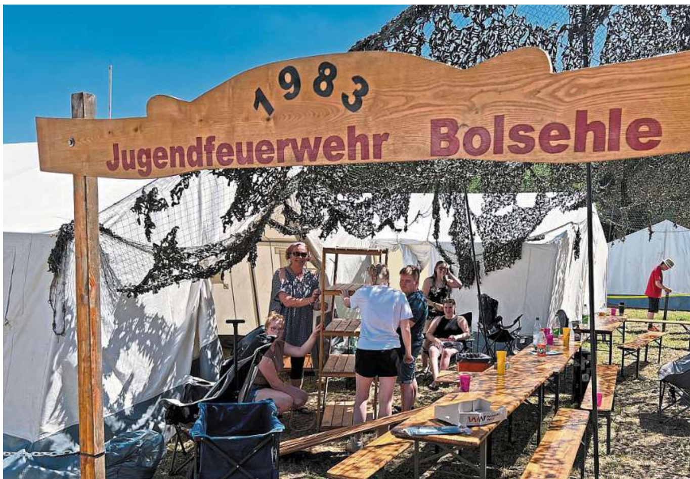
In den Dörfern des Kreis-Zeltlagers ist eine entspannte Atmosphäre angesagt – wie hier bei der Jugendwehr aus Bolsehle.

Jugendfeuerwehr-Zeltlager für alle Interessierten geöffnet