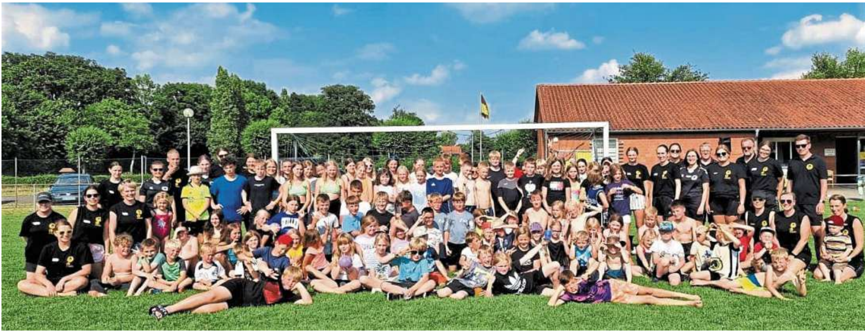
Die mittlerweile sechste Auflage des Jugendzeltlagers des SV Warmesen hat mit mehr als 90 Teilnehmenden für einen neuen Rekord gesorgt.

Mehr als 90 Kinder: Mittlerweile sechstes Jugendzeltlager so gut besucht wie noch nie