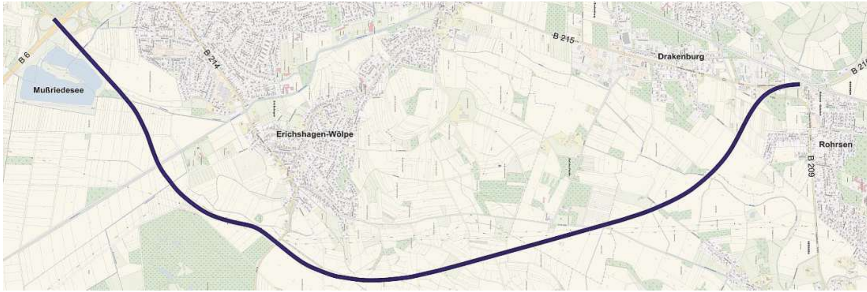
Baubeginn für die Ortsumgehung soll frühestens 2028 sein.