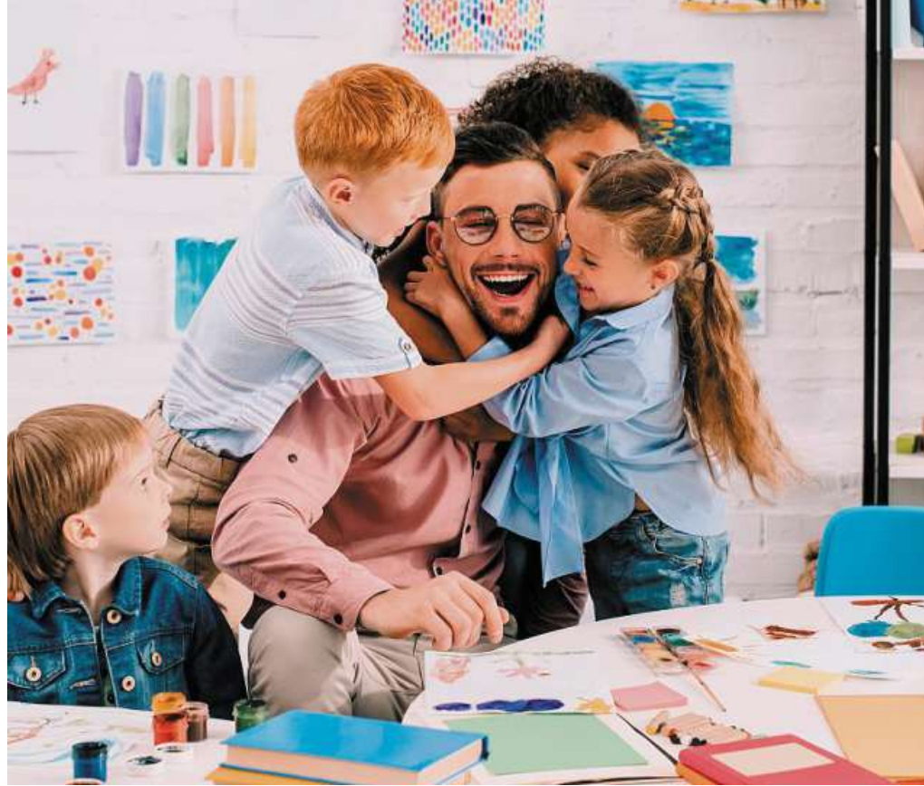
Im sozialen Sektor steht der Mensch im Mittelpunkt.

beinhalten die Tätigkeiten als Erzieher, Kinderpfleger und Heilerziehungspfleger. In diesem Berufszweig stehen der Mensch und seine persönliche Entwicklung im Vordergrund. Die Aufgaben eines Erziehers etwa umfassen neben der Erziehung auch die Bildung und Betreuung von Kindern, Jugendlichen und jungen Erwachsenen in sozialpädagogischen Tätigkeitsfeldern. Unter Berücksichtigung der neuen Anforderungen an die frühkindliche Bildung und Betreuung wird die Ausbildung stetig weiterentwickelt. Wer sich für den sozialen Berufssektor entscheidet, kann Altenpfleger oder Sozialhelfer werden. Hier steht die Unterstützung von hilfebedürftigen Menschen an erster Stelle. Das kann sowohl Unterstützung nach einem schweren Unfall sein