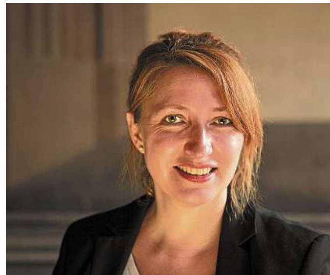
Museum Nienburg Interview Nowak-Klimscha