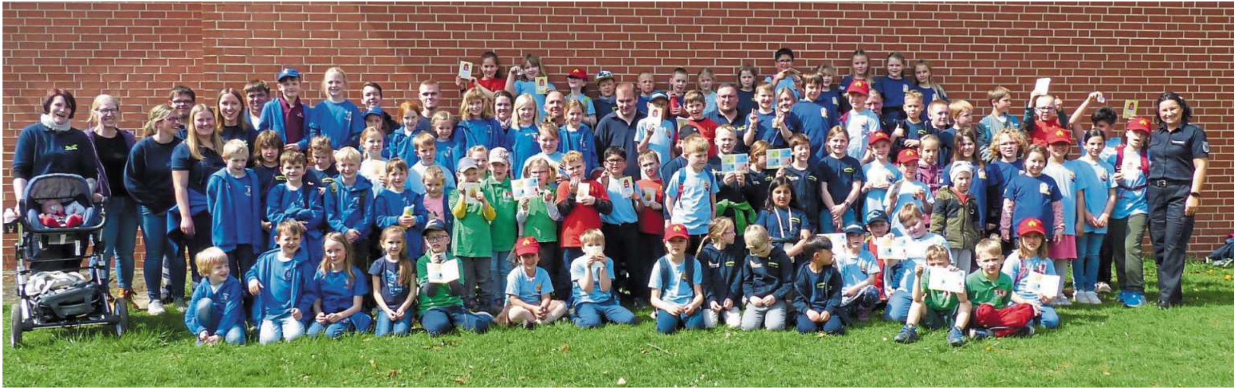
105 glückliche und zufriedene Kinder aus der Samtgemeinde Mittelweser nach der Flämmchenabnahme in Nendorf.