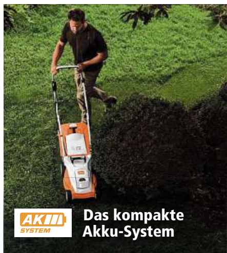
AKH SYSTEM Das kompakte Akku-System