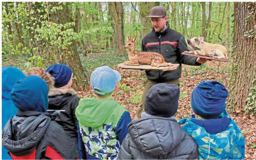
Die angehenden Schulanfänger aus dem Leeseer SpuK-Schloss erlebten in den letzten Wochen einige spannende Aktionen.

Der Bauernhofbesuch in Woltringhausen begann nach einem leckeren Frühstück im Strohhof mit einer Führung durch den Betrieb. Die Kinder erfuhren den Weg „von der Kuh bis zur Molkerei“, fütterten und