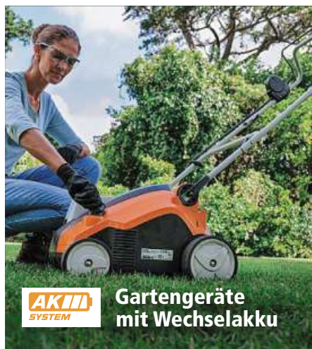
AKH SYSTEM Gartengeräte mit Wechselakku