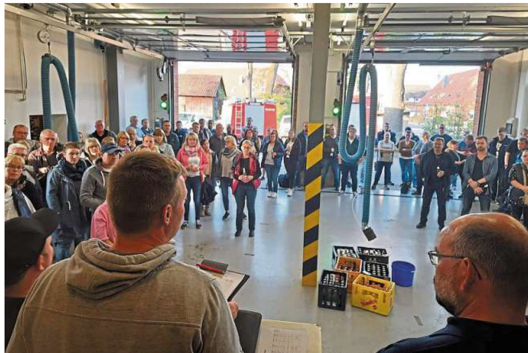
Gut besucht war die Infoveranstaltung im Feuerwehrhaus Erichshagen-Wölpe.

Des Weiteren gibt es die Fachbereiche der Kreisjugendfeuerwehr, unter anderem den Sanitätsdienst, Bas-