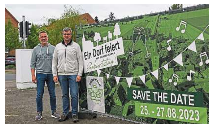
800 Jahre Rodewald: Das wird vom 25. bis 27. August auf elf Kilometern Straßenlänge groß gefeiert

Bürgermeister Höper lädt schon jetzt ein: „Merken Sie sich das Wochenende im Kalender vor und verfolgen Sie die Vorbereitungen auf unserem Instagram-Account @gemeinde.rodewald.“ DH