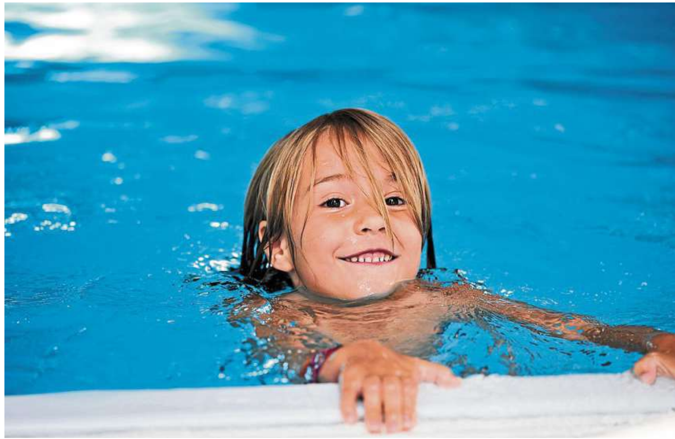
Dank der DLRG Eystrup können alle Kinder an diesem Sonntag im Holtorfer Freibad kostenlos ihr Schwimmabzeichen abnehmen lassen.

Initiative für mehr Sicherheit am und im Wasser im Freibad Holtorf