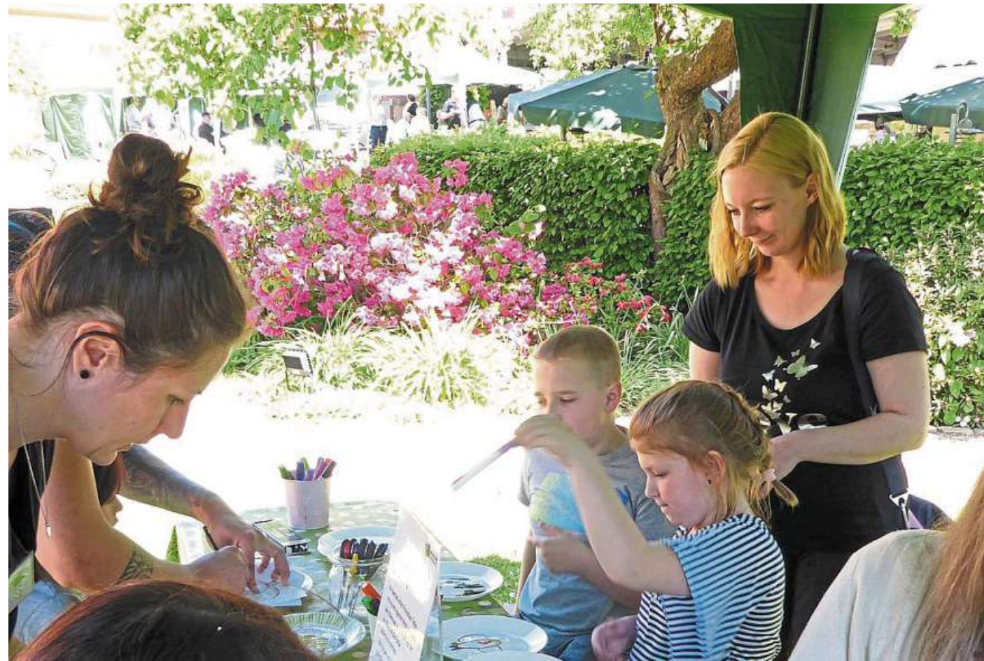
Porzellanteller bemalen konnten die Kinder während des Spargelfests 2022.