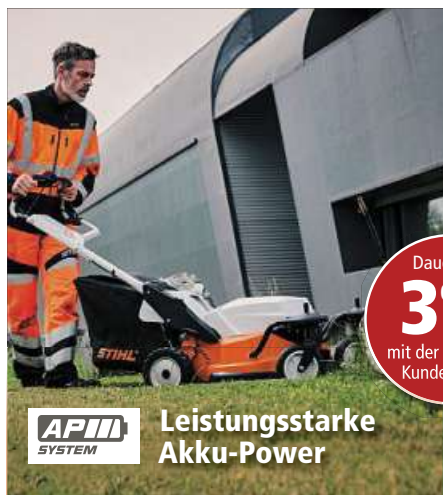
APH SYSTEM Leistungsstarke Akku-Power

Dauerhaft 3% sparen mit der Deterding Kundenkarte!