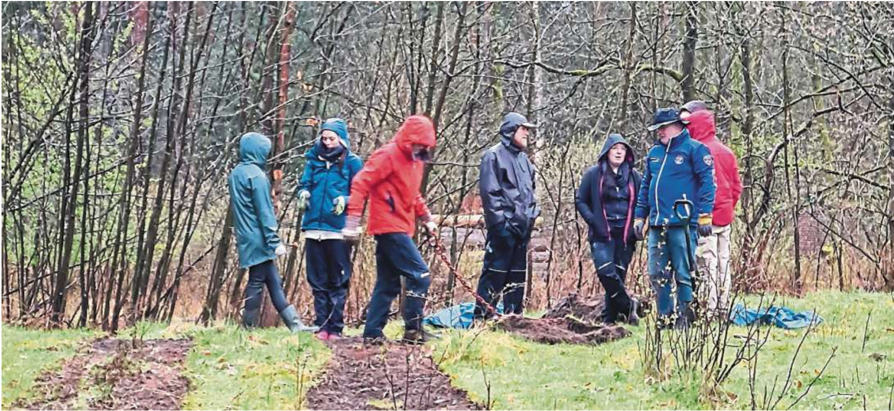
Ein paar ganz hartgesottene Gartenfreunde trotzten am vergangenen Wochenende dem Regen bei den Vorbereitungsarbeiten zum Gemeinschaftsgarten in der Liebenauer Waldsiedlung.

Projekt „Permakulturgarten in der Waldsiedlung Liebenau“ ist gestartet