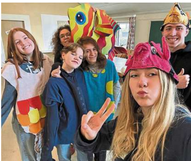
Gute Laune bei der KKJD-Kindertheaterfreizeit.