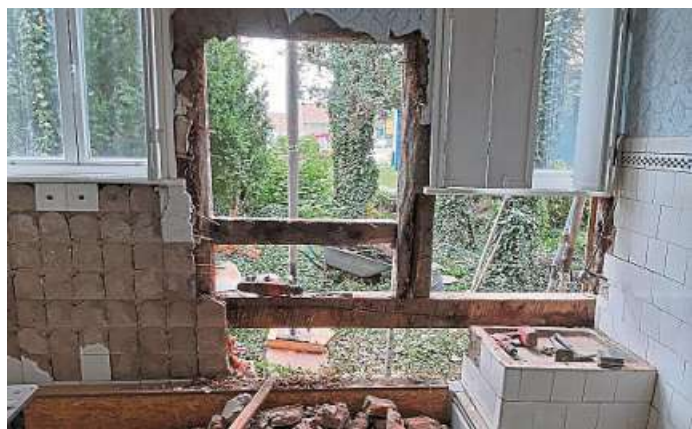
Hier sieht noch alles nach Baustelle aus.