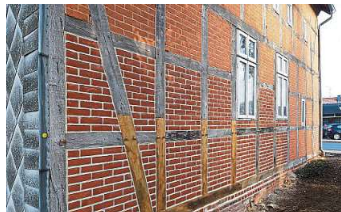
Doch schließlich war alles fertig.

haltungsarbeiten am Museumsgebäude, hierfür wurde ein großes Dankeschön an die Förderer ausgesprochen. Dies sind die Niedersächsische Bin-