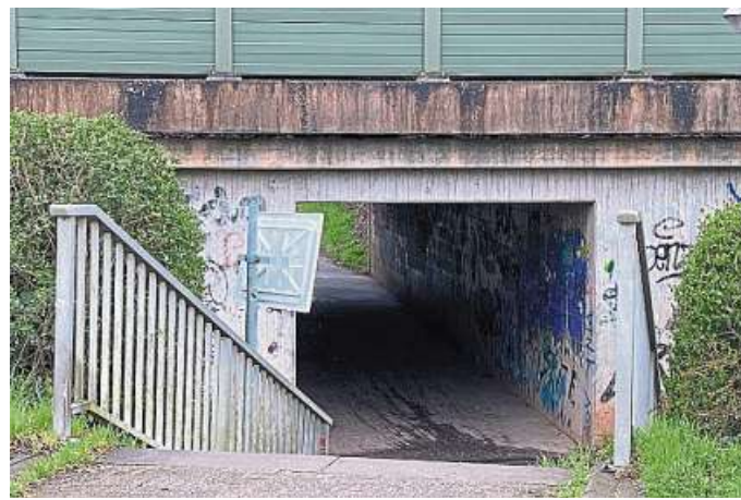
Der Rabe-Tunnel im Nordertor als Ort des Schreckens: Das soll schon bald vorbei sein.

Nach der erfolgreichen Umgestaltung des Friedhofs Bollmannstraße - Schwerpunkt des Tages der Städtebauförderung 2022 - will man jetzt gemeinsam das Projekt Rabe-Tunnel angehen. Nach den Vorstellungen von Schöning und Müller-de Buhr soll der Tunnel des Schreckens in ein Kunstwerk verwandelt werden. Aus dem Angst-Ort soll sozusagen ein trockenes Aquarium werden. Beide setzen auf die Unterstützung aller Menschen, die ab sofort wieder im Offenen Atelier auf dem Friedhof Bollmannstraße zusammenkommen, um aus widerstandsfähigen Glascherben farbenfrohe Mosaik-Fische entstehen zu lassen. Mosaik-Fische sind quasi das Markenzeichen des Geschehens rund um das Stadtteilhaus. Mit Unterstützung von Katja Sturhan und Kalle Sturhan-Dütschke von der Kunstwerkstatt „Artenreich“ in Asendorf sind schon zahlreiche kleinere und größere äußerst witterungs-