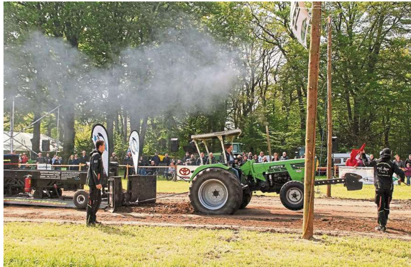
Das wollen die Zuschauerinnen und Zuschauer sehen: Der Treckerfahrer beziehungsweise die Treckerfahrerin sitzt ganz entspannt hinter dem Lenkrad, während der Traktor vorne abhebt und aus dem Auspuff dunkle Wolken kommen.

Der „Tanz in den Mai“ im Partyzelt beginnt um 21 Uhr. Das DJ-Team von Carambolage Music Hall wird für die nötige Partystimmung sorgen und die Wahl der Maikönigin begleiten. Bis Mitternacht haben die männlichen Festbesucher die Aufgabe, durch Abgabe ihrer Stimmkarte die Maikönigin 2023 zu wählen. Die neu gewählte Maikönigin erhält einen Reisegutschein im Wert von 250 Euro, die Prinzessinnen erhalten wertvolle Präsenten. Bis 22 Uhr zahlen die Party-