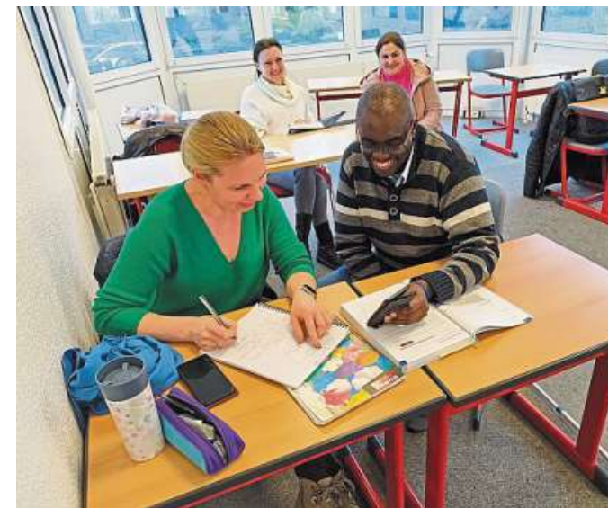
Bei den Ausbildungsstätten Rahn hat der 50. Berufssprachkurs begonnen.

Die Ausbildungsstätten Rahn haben bereits im Juni 2017 den ersten Berufssprachkurs, einen Kurs mit