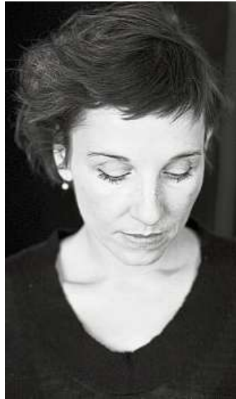
Meret Becker.

Die zurzeit vor allem als „Tatort“-Kommissarin bekannte Meret Becker ist eine Künstlerin mit vielen Gesichtern und ein echtes Multitalent: Schauspielerin, Kompo-