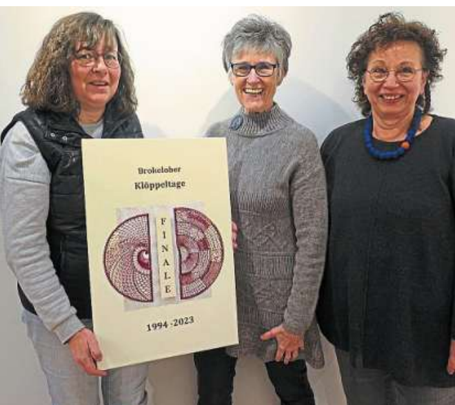
Eine Spitzenausstellung im wahrsten Sinne des Wortes präsentiert der Bürger- und Kulturverein Uchte ab dem 30. April im Bürgerhaus.

Obwohl beide Künstlerinnen immer zu gleichen Themen gearbeitet haben, unter-