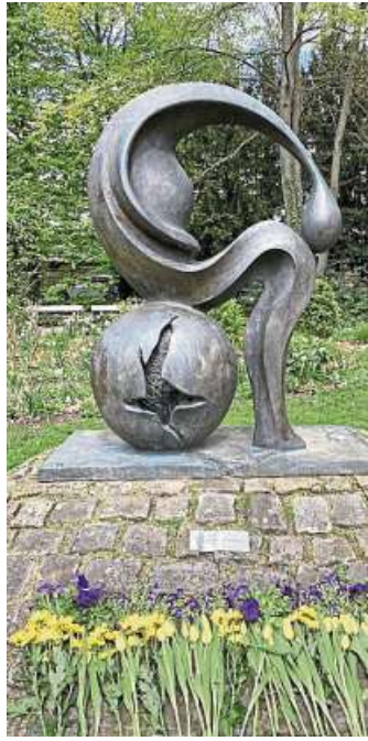
Die Bronzeskulptur „Madonna von Tschernobyl“ auf dem Bürgermeister-Stahn-Wall, geschmückt mit Blumen in den Farben der Ukraine.

„Erinnerung an Tschernobyl, Solidarität mit den Menschen in Belarus, Protest gegen Russlands Kriegsverbre-