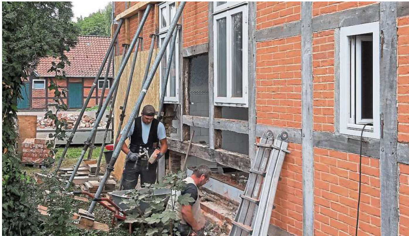
Die Handwerker hatten richtig viel zu tun mit der Sanierung des Rodewalder Heimatmuseums.

Ein Jahr, das geprägt war von vielen wichtigen Unter-