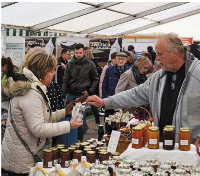
Viele regionale Aussteller präsentieren sich und ihre Waren.