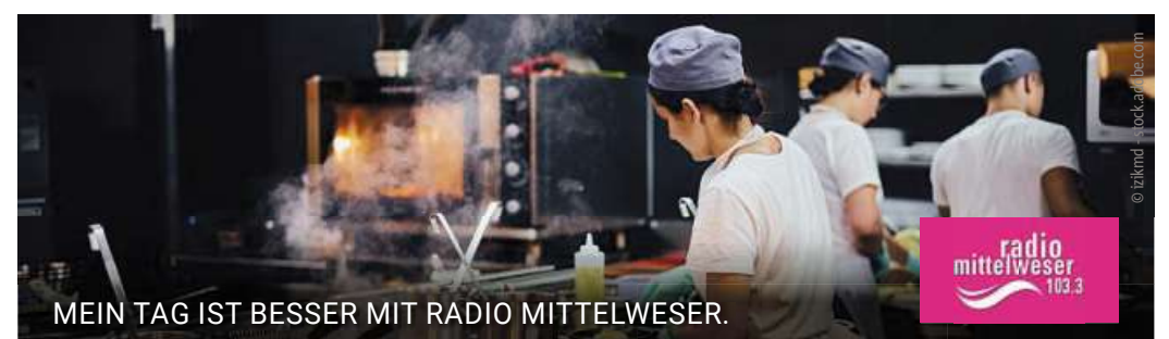
MEIN TAG IST BESSER MIT RADIO MITTELWESER.

Mal schauen ob der Pokal wieder wandert oder an seinem jetzigen Platz verbleibt, so die Organisierenden. DH