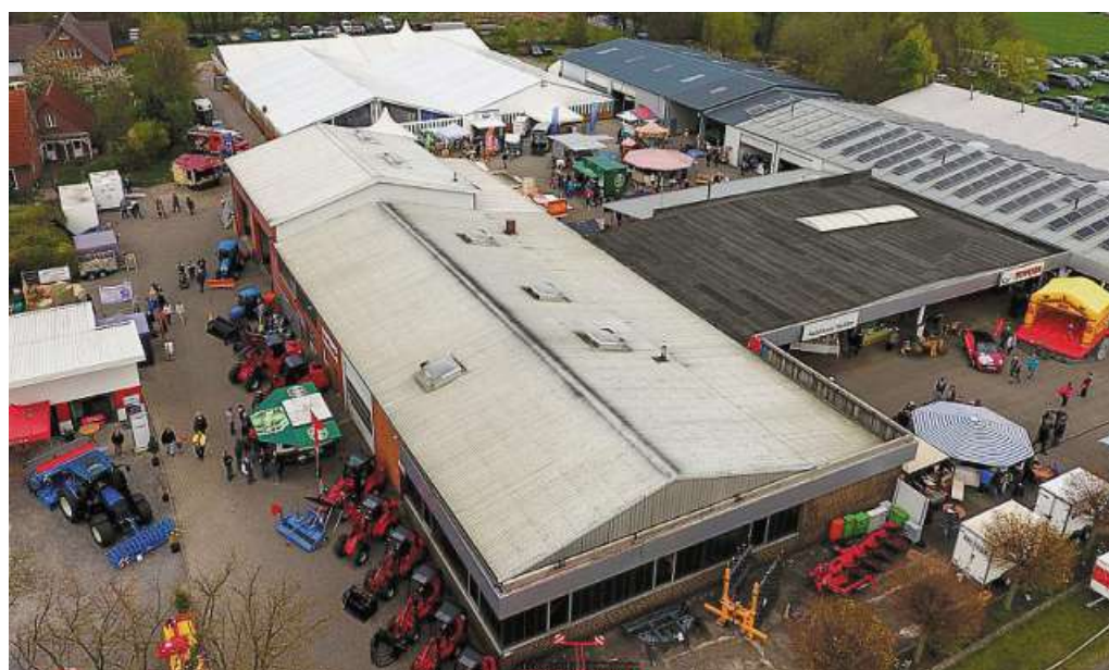
Auf dem Gelände der Firma Nobbe findet an diesem Wochenende wieder „Kieken un köpen“ statt.