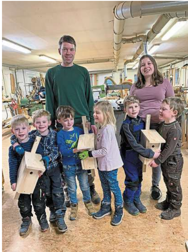
Die Kinder der Kita „Windmühle“ besuchten die Tischlerei Tönsing in Kleinenheerse.

Dorfhelferinnen werben für ihren Beruf / Infoveranstaltung in Loccum am 6. Mai