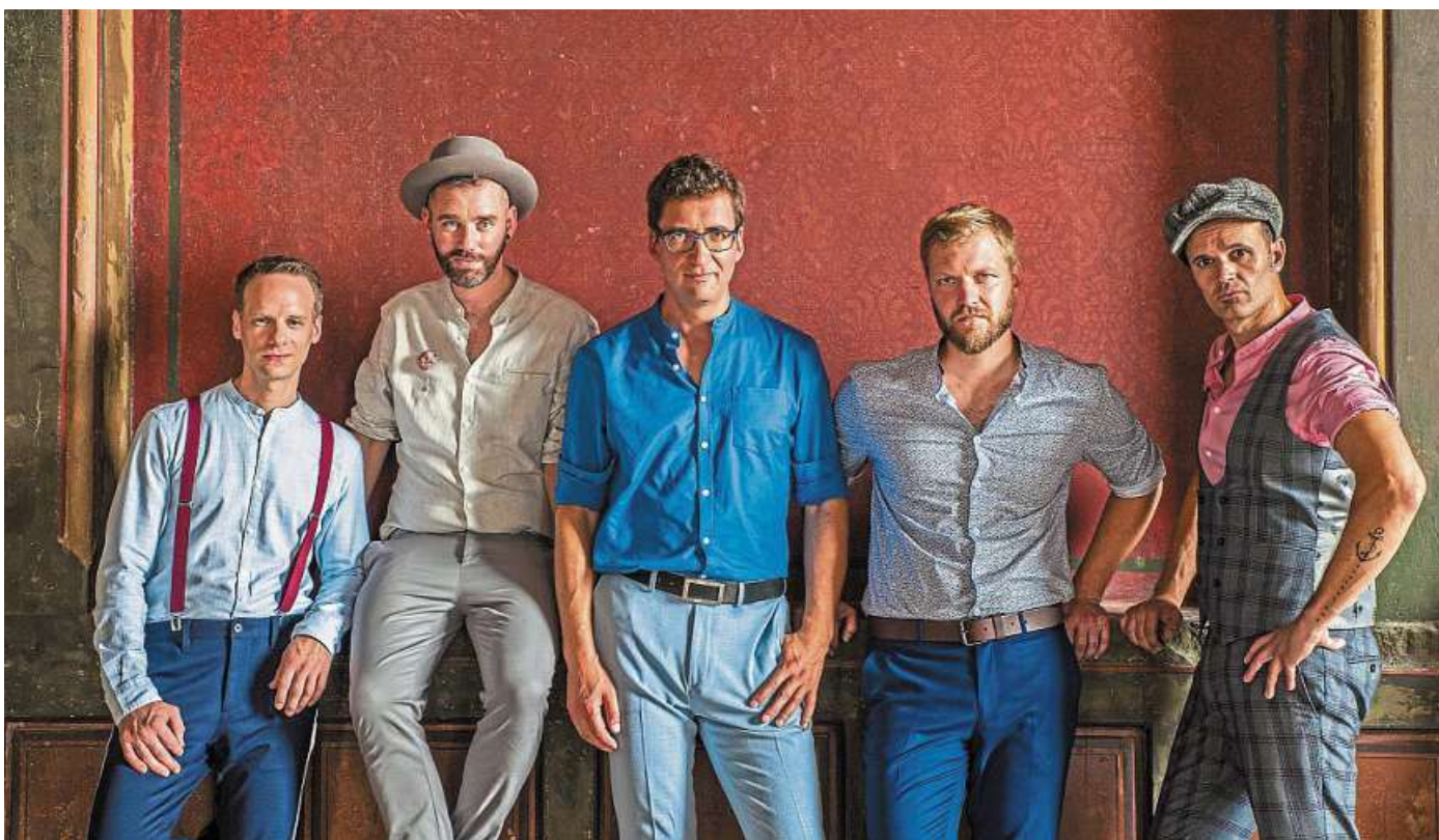
Publikumsbeliebte, Weltbummler, Entertainer: Die fünf Jungs von Vocaldente gastieren am 16. April im Burghof