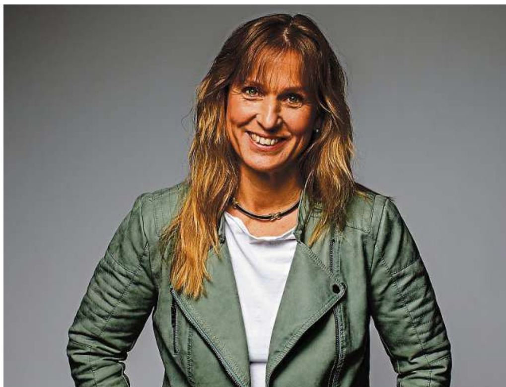
Staatsministerin Katja Keul war vom 26. bis 30. März in den USA.