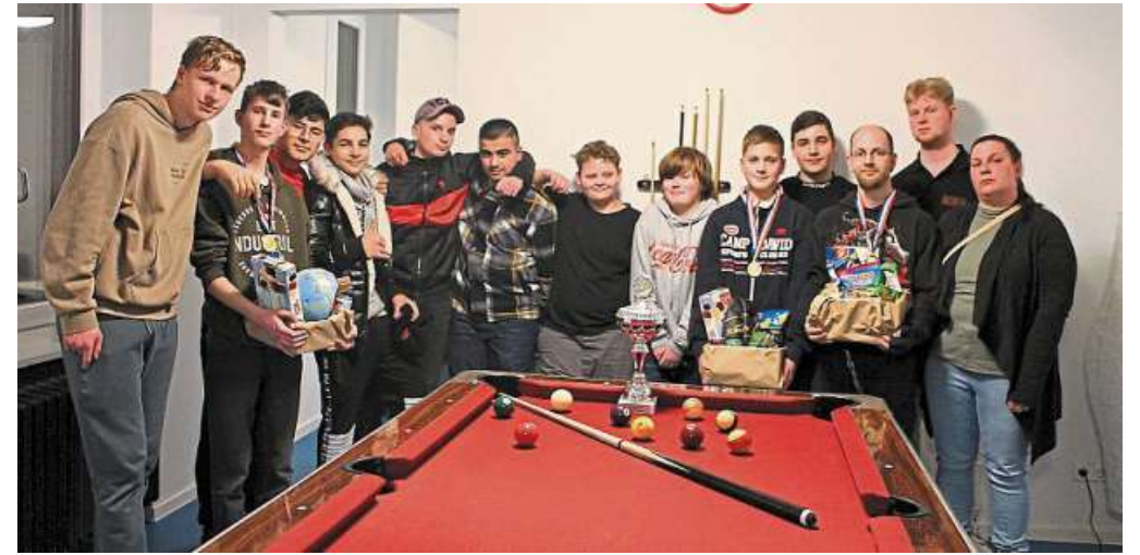
In Liebenau und Steyerberg wurde wieder Billard gespielt.

Wanderpokal auf Wanderschaft: In den Jugendhäusern Liebenau und Steyerberg wurde wieder Billard gespielt