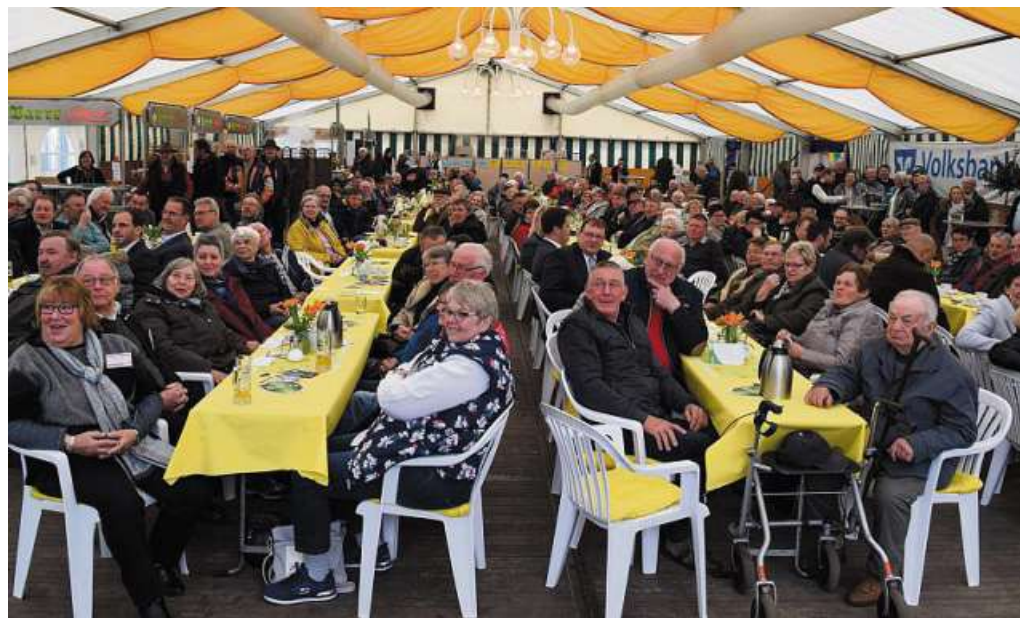
Das Bürgerfrühstück am Samstag ist stets gut besucht.