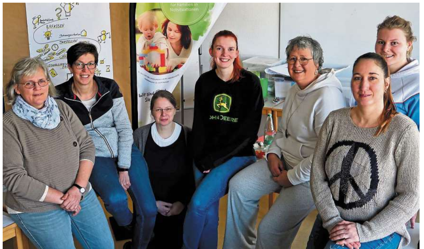
Die Teilnehmerinnen des aktuellen Dorfhelpferinnenkurses.

Die angehenden Fachkräfte werden zentral im Evangelischen Dorfhelpferinnenseminar in Loccum auf den Berufsalltag und die Abschlussprüfung vor der Landwirtschaftskammer Niedersachsen vorbereitet durch Blockunterricht, Lern-