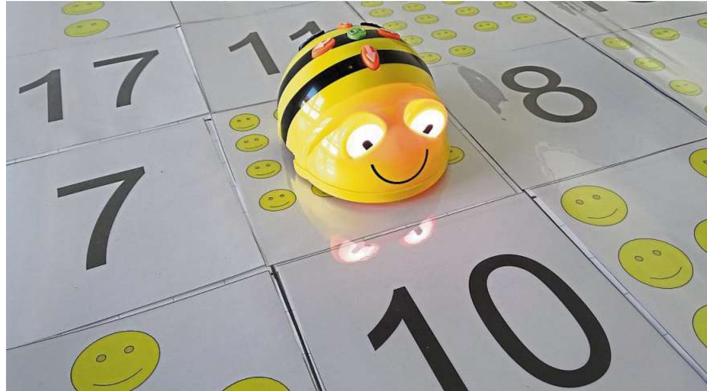
Die Grundversion der Bee-Bots: Auf speziellen Matten planen die Kinder einen Weg zu einem vorgegebenen Ziel. Dafür nutzen sie die Richtungstasten für vorwärts, rückwärts und Links- und Rechtsdrehung auf dem Kriechroboter. Damit kann eine Abfolge von Bewegungen gespeichert werden, die der Bee-Bot dann schrittweise ausführt.

„Durch die Nutzung von Bee-Bots in Kindertagesstätten wird Kindern ein intuitiver Algorithmusbegriff nähergebracht, sie sammeln auf unterschiedlichen Ebenen erste Programmiererfahrungen und