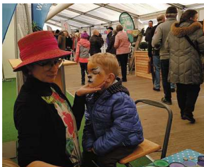
Zum Angebot für Kinder gehört erstmals auch ein Indoor Spielpark.

cum erzählt. „Wir möchten die Wirtschaftsschau auch als Start für ein Netzwerk regionaler Erzeuger nutzen. Die Klimaschutzagentur Mittel-