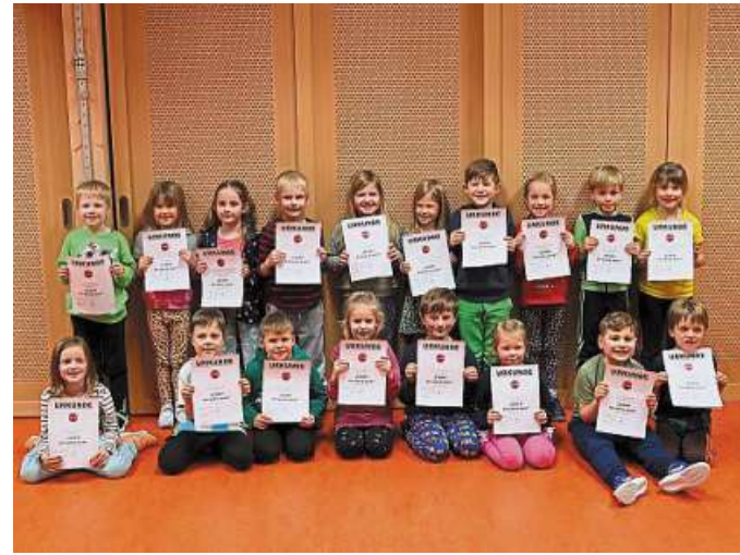
„Stopp! - Ich wehre mich!“ hieß es in der Kita „Am Walde“ in Heemsen.

So wurde ein Rollenspiel, bei dem die Kinder aus einem Pkw heraus angesprochen wurden, genutzt, um mit den Kindern ein entsprechendes Verhalten zu üben. Auch ein Hund besuchte an einem Nachmittag die Gruppe. Dabei durften die Kinder beispielhaft erleben, welche Reaktion ihr Verhalten bei dem Hund auslöst und sie erlangten dadurch Sicherheit in der