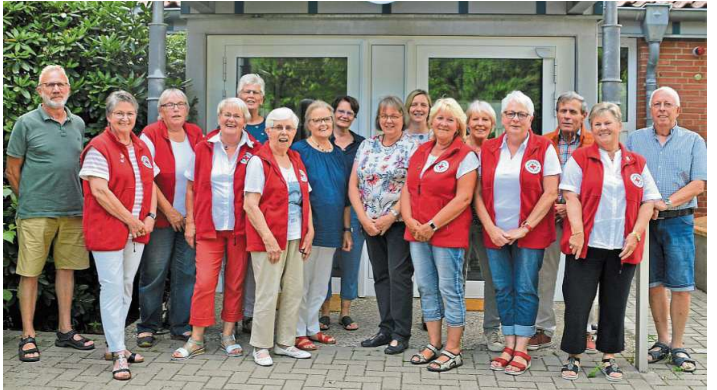
Der Blutspendetermin in der Heemser Schule wird schon seit Jahren von den DRK-Ortsvereinen Rohrsen, Gadesbünden und Heemsen organisiert.

Aktuell wird außerdem über eine Zusammenlegung der Ortsvereine Rohrsen, Heemsen und Gadesbünden zu einem gemeinsamen DRK-Ortsverein nachgedacht. Auch hier werden engagierte Mitstreiterinnen und Mitstreiter für die Mitarbeit im Vorstandsteam gesucht.