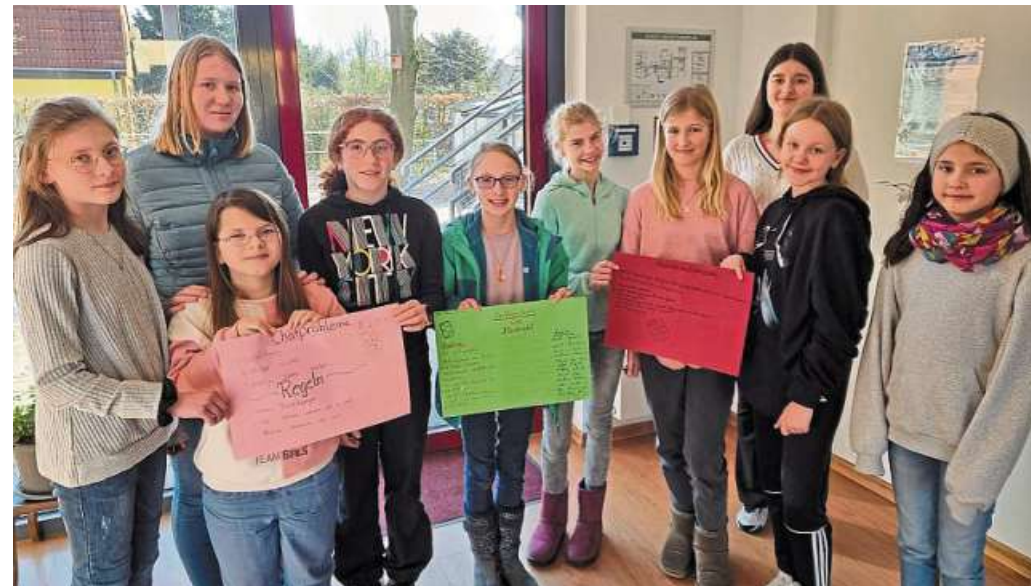
Die 6. Klasse der Realschule präsentiert ihre Ergebnisse vom Medientag.

Es soll bei der Nutzung der iPads nicht darum gehen, her-