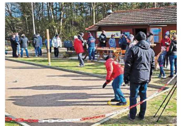
Rund 60 Interessierte hatten sich am Wochenende zur Eröffnung der neuen Boule-Anlage des TTC Haßbergen eingefunden.