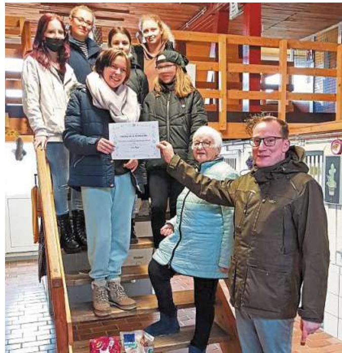
Die Spenden überreichte die Gruppe der Oberschule Marklohe an den Tierschutzverein.

So zogen sowohl Lehrer als Schüler ein durchweg positives Fazit, sodass die Fahrt im nächsten Jahr in jeden Fall wiederholt werden soll. Ein besonderer Dank gilt den Fördervereinen der OBS Marklohe, der OBS Hoya und der IGS Nienburg, die die Fahrt finanziell unterstützten und dafür sorgten, dass der Reisepreis für die Schüler im Rahmen gehalten werden konnte. DH