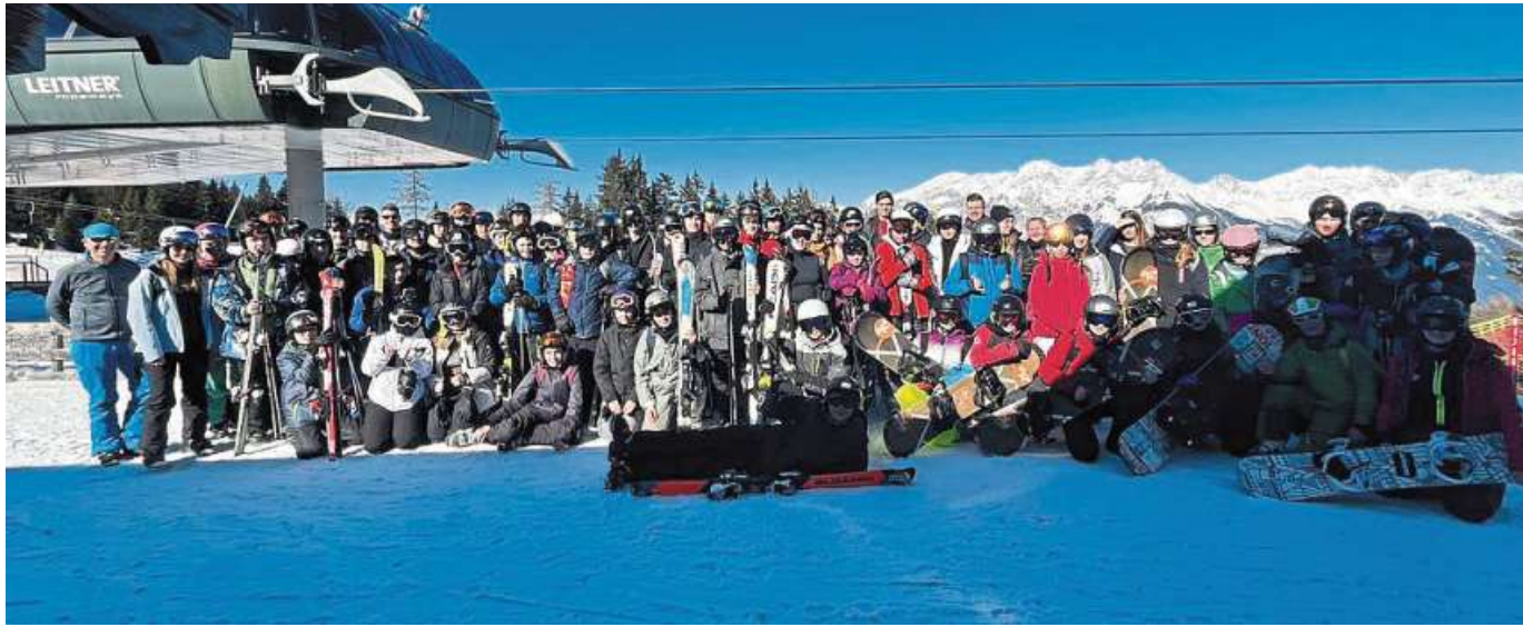
Zu einem gemeinsamen Ski-Kurs waren Schülerinnen und Schüler der Oberschulen Marklohe und Hoya sowie der IGS Nienburg nach Österreich gefahren.