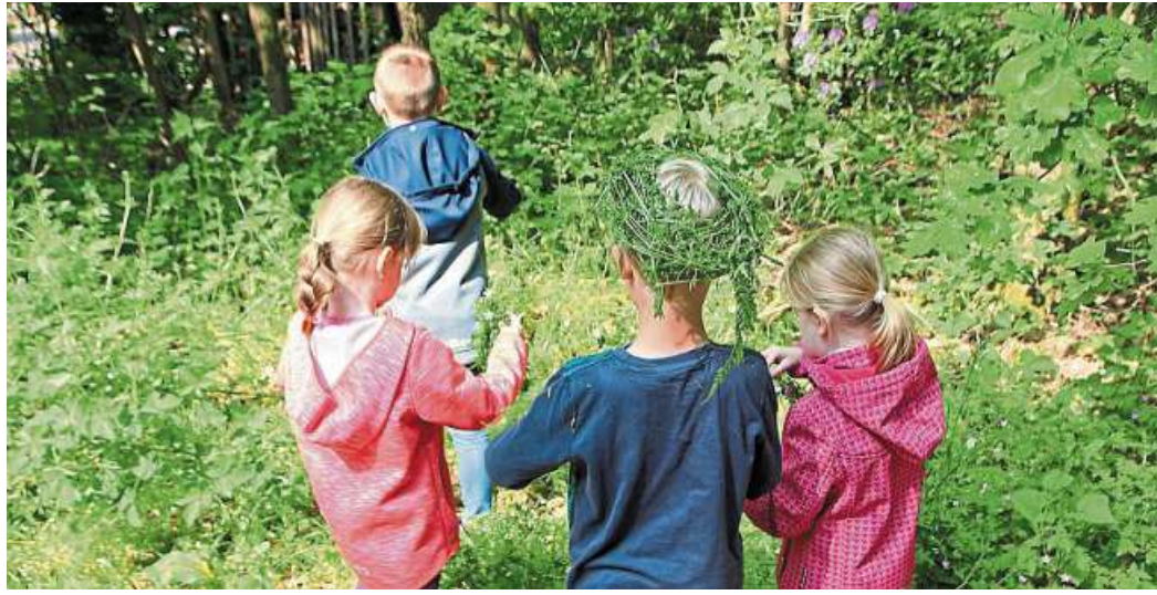
Was passiert im Wald, wenn der Frühling kommt? Dieser Frage können Mädchen und Jungen zwischen 6 und 12 Jahren in den Osterferien nachgehen.

„Wir wollen im Wald entdecken und forschen. Nach Lust