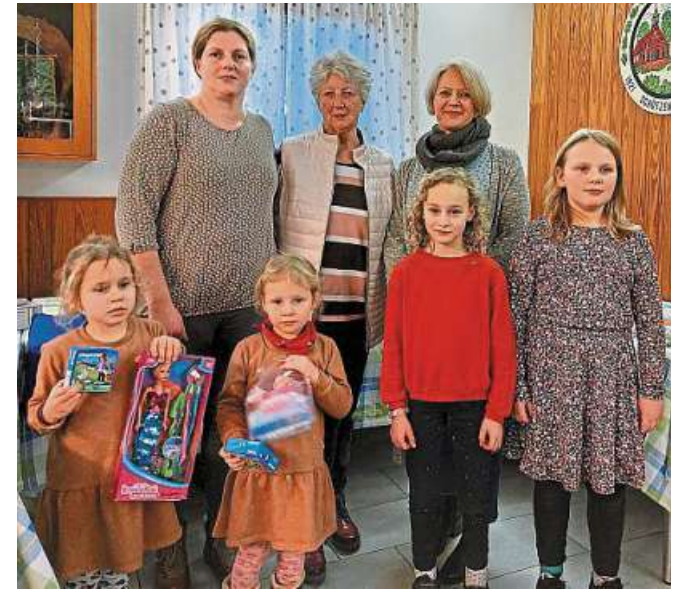
Viel Spaß hatten die Teilnehmerinnen des „Mensch ärgere dich nicht“-Turniers in Lichtenhorst.