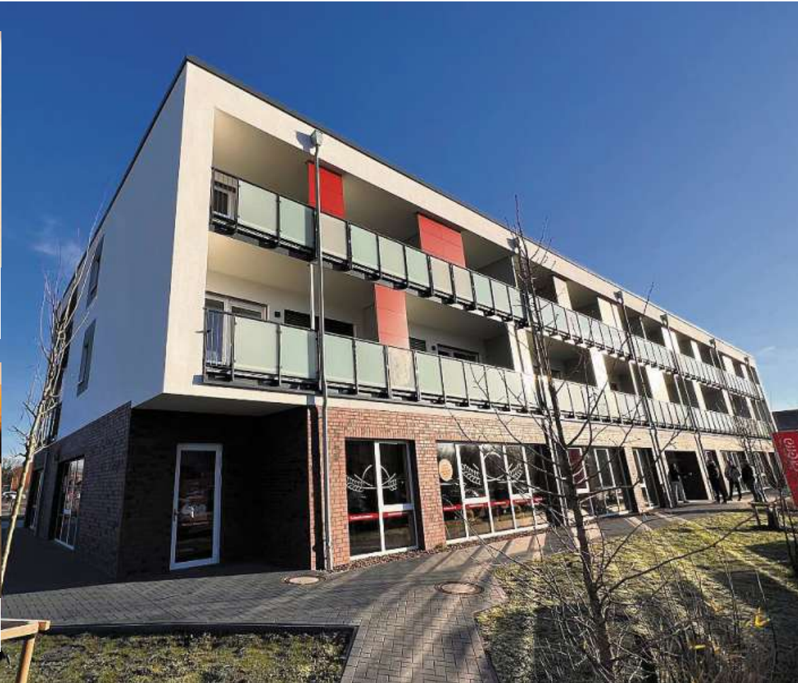
Unten Gewerbe, oben Wohnungen: Insgesamt 24 kleine Wohnungen und Appartements befinden sich in dem Neubau.