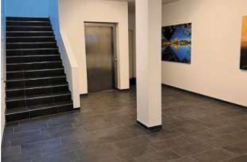
Treppe und Aufzug führen nach oben. Fotografien aus der Region schmücken die Flure.