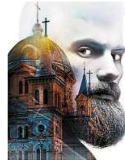
„Der Teufel und der liebe Gott“: Es geht um Moral und soziale Ge- rechtigkeit.

Info Karten sind erhältlich unter Telefon (0 50 21) 8 73 56, Fax