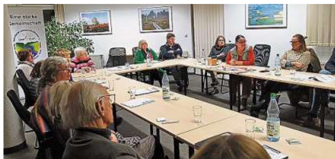
Landfrauen hörten von Fachleuten Wissenswertes über Häusliche Gewalt.

„Wichtig zu wissen: Nachbarn oder Freunde können bei einem nur vagen Verdacht auf häusliche Gewalt die BISS anrufen und es werden in einem Gespräch die nächsten Schritte geklärt“, berichten die Landfrauen. DH