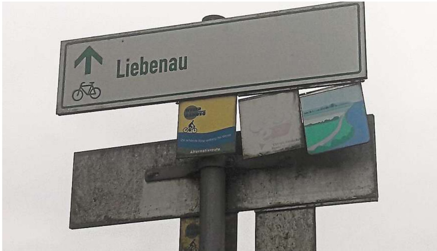
Einige Schilder geben kein gutes Bild von der Region wieder.

Verein würde bei Interesse auch den Kommunen bei regionalen touristischen Fahrradrouten Unterstützung anbieten