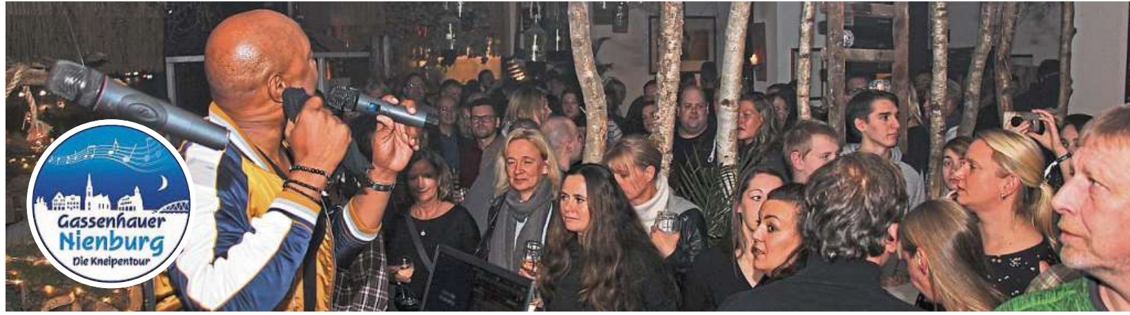
Das beim Publikum beliebte Duo „Rock Meets Soul“ ist im Restaurant „La Matta“ an der Nienburger Hafestraße zu sehen.

Von 1999 bis 2004 hatte sich das Kneipenfestival zu einer Kulturveranstaltung entwickelt. Dann kam die Pause, bis der Gassenhauer 2018 von der HARKE wiederbelebt wurde. 2020 dann die nächste (Zwangs-)Pause. Mittlerweile läuft