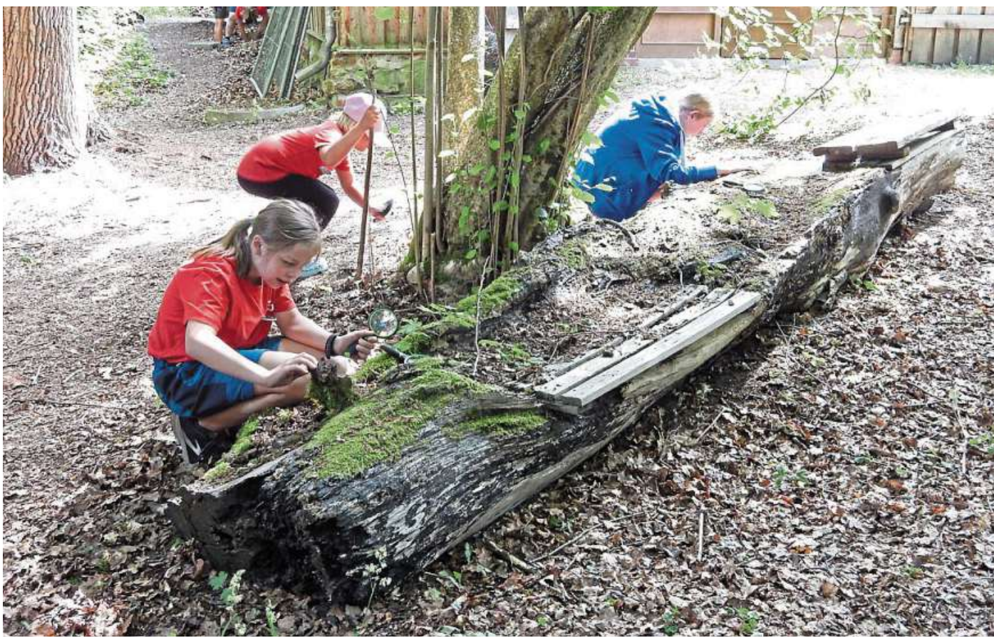
Der NABU bildet Ehrenamtliche für die Arbeit mit Kinder und Jugendlichen aus.

Den Erwerb eines Jugendleiterscheins oder einer verkürzten pädagogischen Ausbildung ersetzt diese Seminarreihe natürlich nicht. Dennoch wird sie alle Teilnehmenden auf ihr künftiges ehrenamtliches Engagement beim NABU und der NAJU vorbereiten, erste Sicherheiten geben und Lust auf mehr machen. Teilnehmen kann jeder nat-