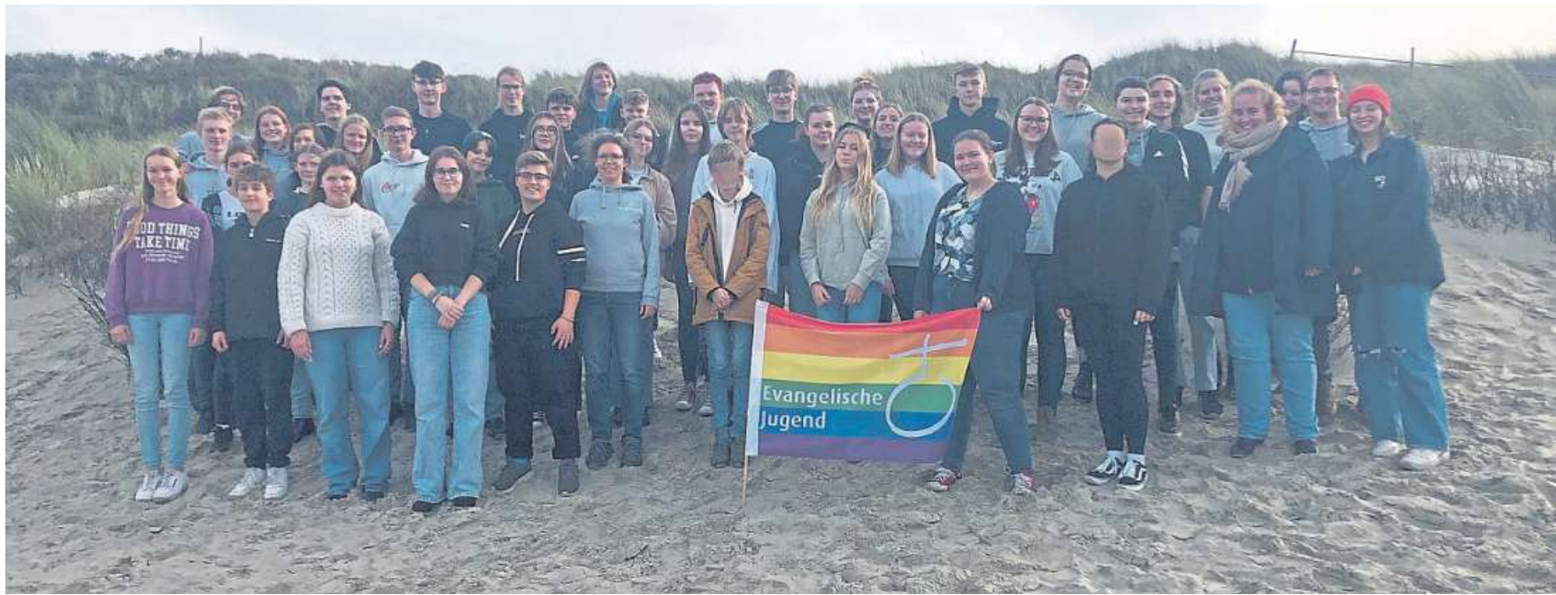
Eine spannende Zeit verbrachten rund 40 Jugendliche mit der Evangelischen Jugend Nienburg auf Spiekeroog.

Evangelische Jugend Nienburg hatte zu Trainee- und Juleica-Seminar eingeladen