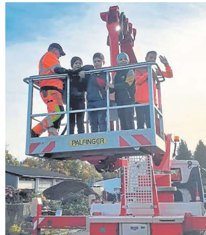
Aus dem Korb des Hubwagens konnten die kleinen Gäste aus dem familienhORT den Bauhof von oben sehen.

Info Karten gibt es im Vorverkauf online unter www.hassbergen.de und telefonisch unter den Nummern 05024/8259 und 05024/617.