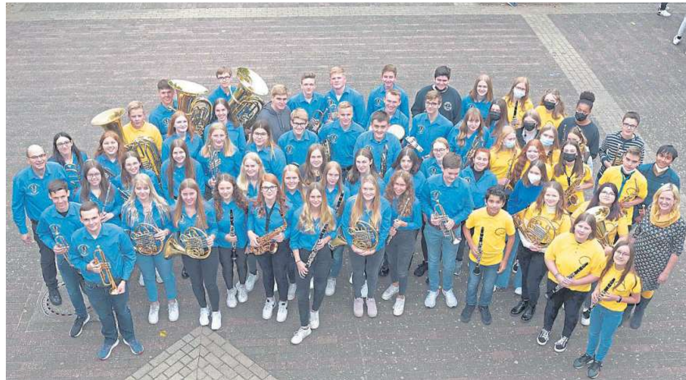
Auch das Jugendblasorchester Stolzenau beteiligt sich an dem Benefizkonzert zugunsten der Nienburger Tafel.