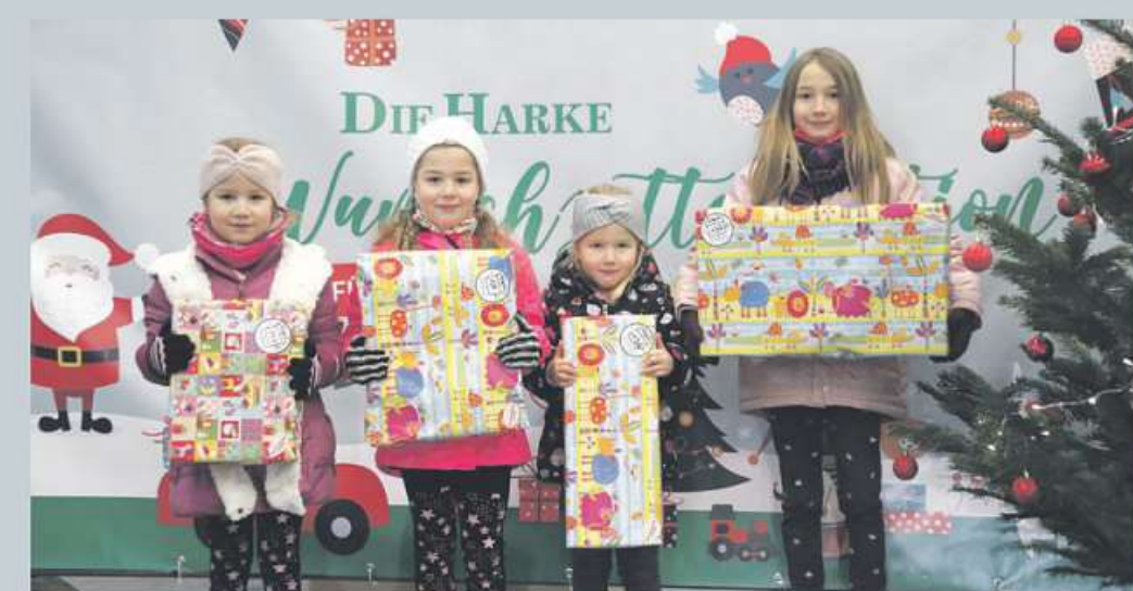
DIE HARKE freut sich darauf, auch in diesem Jahr viele Wünsche zu erfüllen – so wie diese vier im Vorjahr.