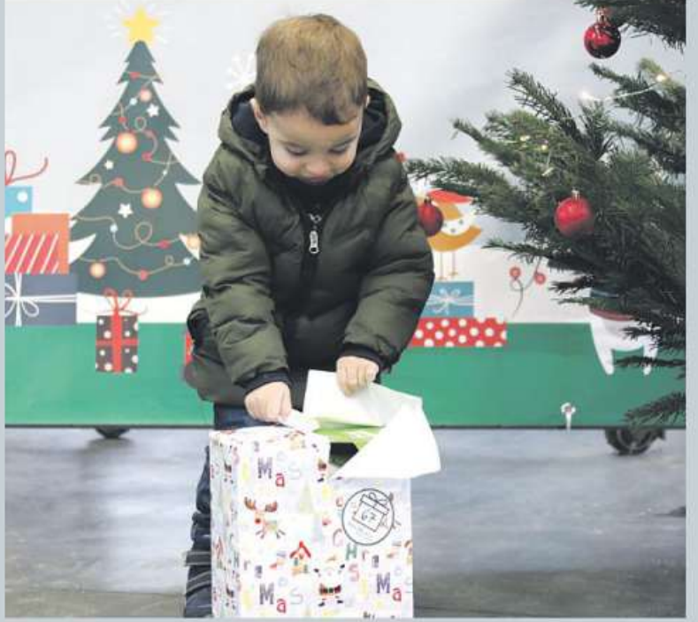
Manchmal ist die Vorfreude zu groß, um mit dem Auspacken zu warten.