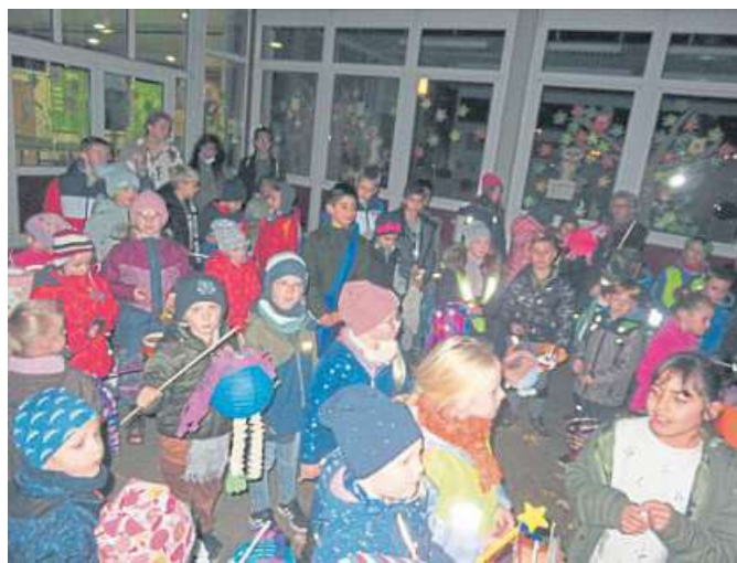
In Haßbergen konnte endlich wieder das Martinsfest gefeiert werden.

Nach der kleinen Theateraufführung versammelten sich Kinder, Eltern und viele mehr vor der Kirche. Der Laternenumzug in Richtung