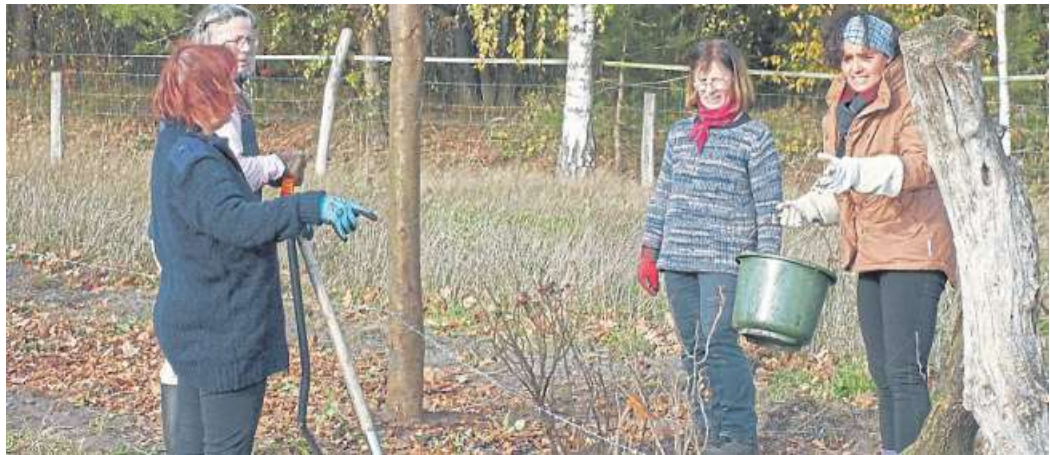
Mitglieder der BUND-Ortsgruppe Uchte beim Anpflanzen der Hecke.

stumpf besiedelt, die gelbe Mordfliege wurde gesichtet, und der Ampfer-Purpur-Spanner war auf der Blühfläche zu finden. Auch der Turmfalke nutzt die Fläche vorrangig als Jagdgebiet, teilt die Gruppe mit. In diesem Herbst wurde die Fläche um eine Attraktion für interessierte Besucher und für die Vogelwelt bereichert. Eine 40 Meter lange Vogel-schutzhecke besonderer Art ist angelegt worden. „Die Gestaltung ist speziell auf das Leben des Neuntöters ausgerichtet. Am Waldrand, nach Süden offen und von der Sonne beschienen, mit dornigem Strauchwerk zum Beispiel dem Kreuzdorn, Feuerdorn und mehreren Rosenarten bepflanzt, so liebt es der Neuntöter“, teilen die Naturschützer