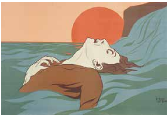
Henri Matisse, Le Testament du Baron Jean von R. die Pont-Jest, um 1905. Öl auf Leinwand, 100 x 130 cm, © Kunstsammlung Nordrhein-Westfalen