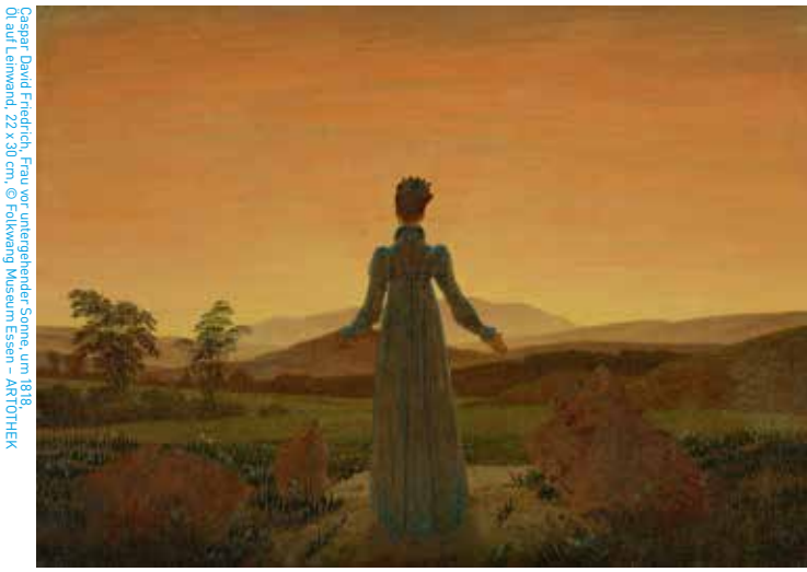
Caspar David Friedrich, Frau vor untergehender Sonne, um 1818. Öl auf Leinwand, 22 x 30 cm, © Folkwang Museum Essen - ART10THEK