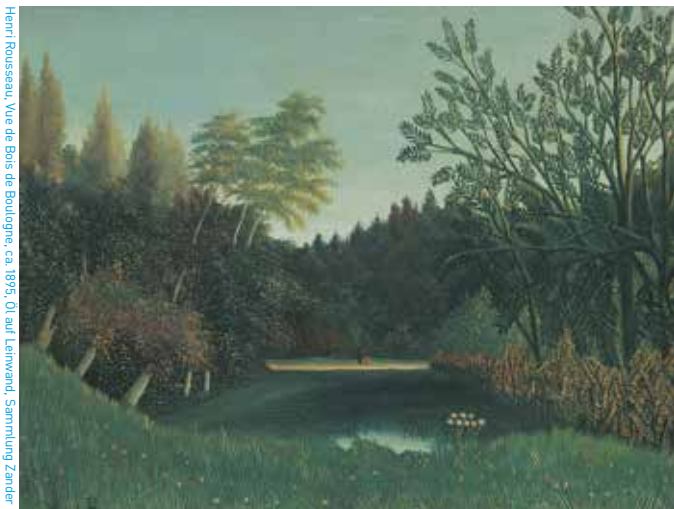
Henri Rousseau, Vue de Bois de Boulogne, ca. 1895, Öl auf Leinwand, Sammlung Zander

Fünf Künstler, eine Ausstellung vom 3. Dezember bis 12. März 2023