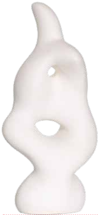
Hans Arp, Mythologische Skulptur, 1949, Gips, 19,5 x 11,5 x 11,5 cm, VG Bild-Kunst, Bonn 2022

Einblicke in Die Firma Arp bis 29. Januar 2023