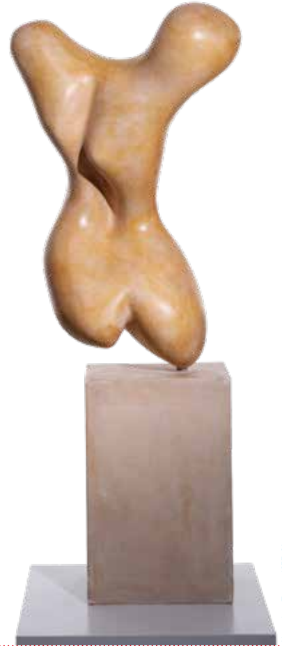
Hans Arp, Torso, 1957, Gips, 19,5 x 11,5 x 11,5 cm, VG Bild-Kunst, Bonn 2022