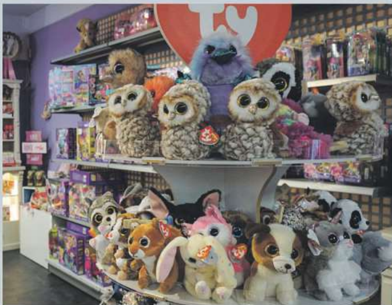
Der lokale Einzelhandel bietet eine riesige Auswahl an tollen Geschenken.