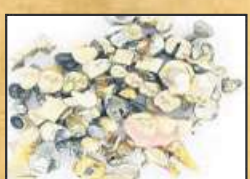
Zahngold (auch mit Zahnresten)

Nicht selten enthalten Schmuckschatullen wahre Schätze. Die explodierenden Goldpreise treiben verständlicherweise die Kunden zu „Der GOLDMANN“ in Nienburg, der auch kleinste Mengen an Altgold entgegennimmt.