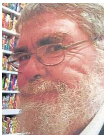
Bernd Kretschmer