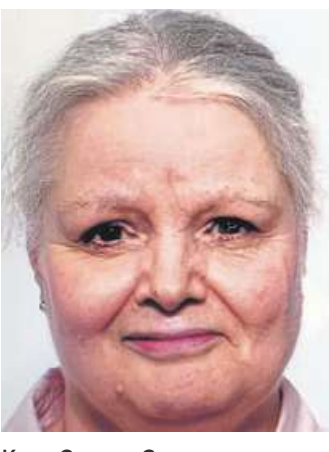
KARIN CERMEJ-GEDKE