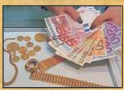
Für schönen Schmuck (bspw. mit Brillanten) gibt es sogar mehr als den Goldpreis