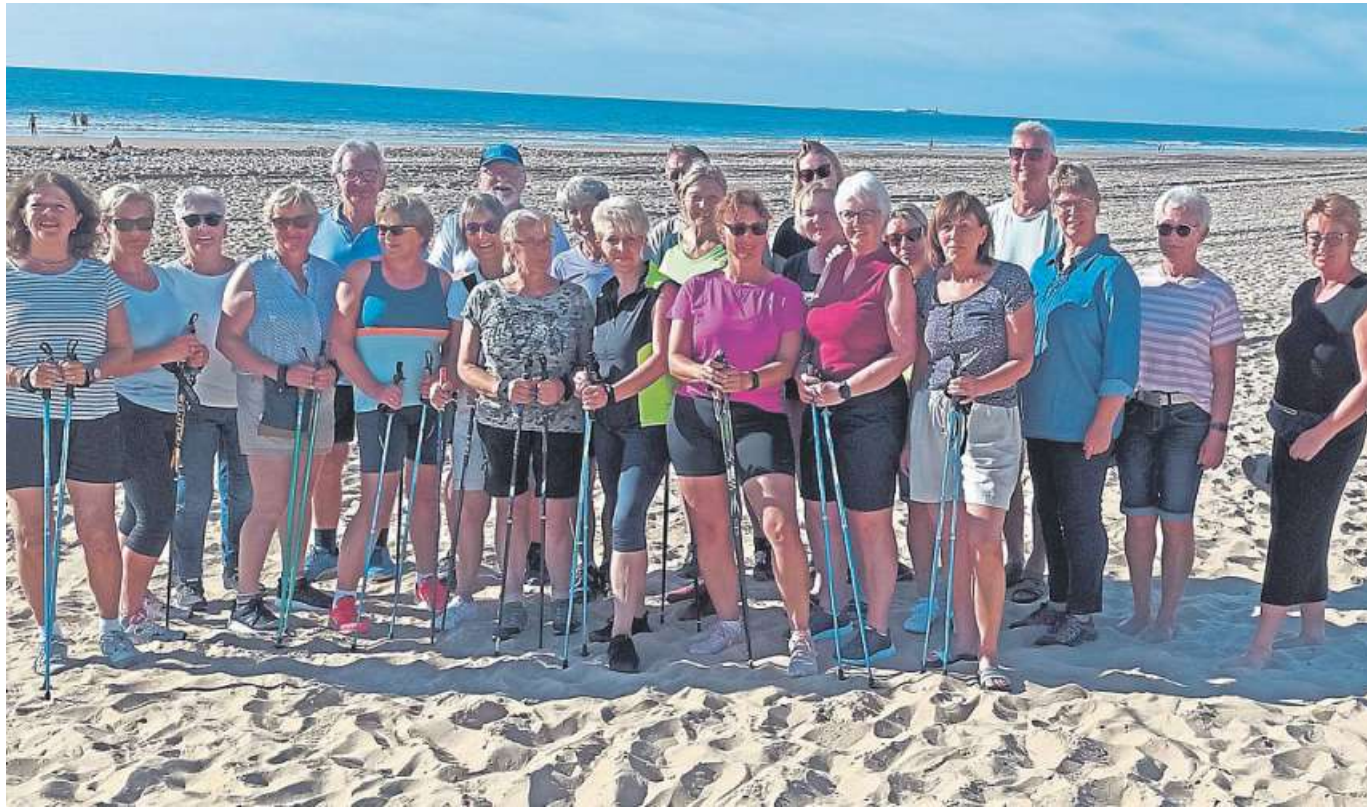
Einen tollen Ausklang des diesjährigen langen Sommers erlebten 26 Nordic Walkerinnen und Nordic Walker, die jetzt von ihrer Reise an die Costa de la Luz, Spaniens südlicher Atlantikküste, zurückkehrten.