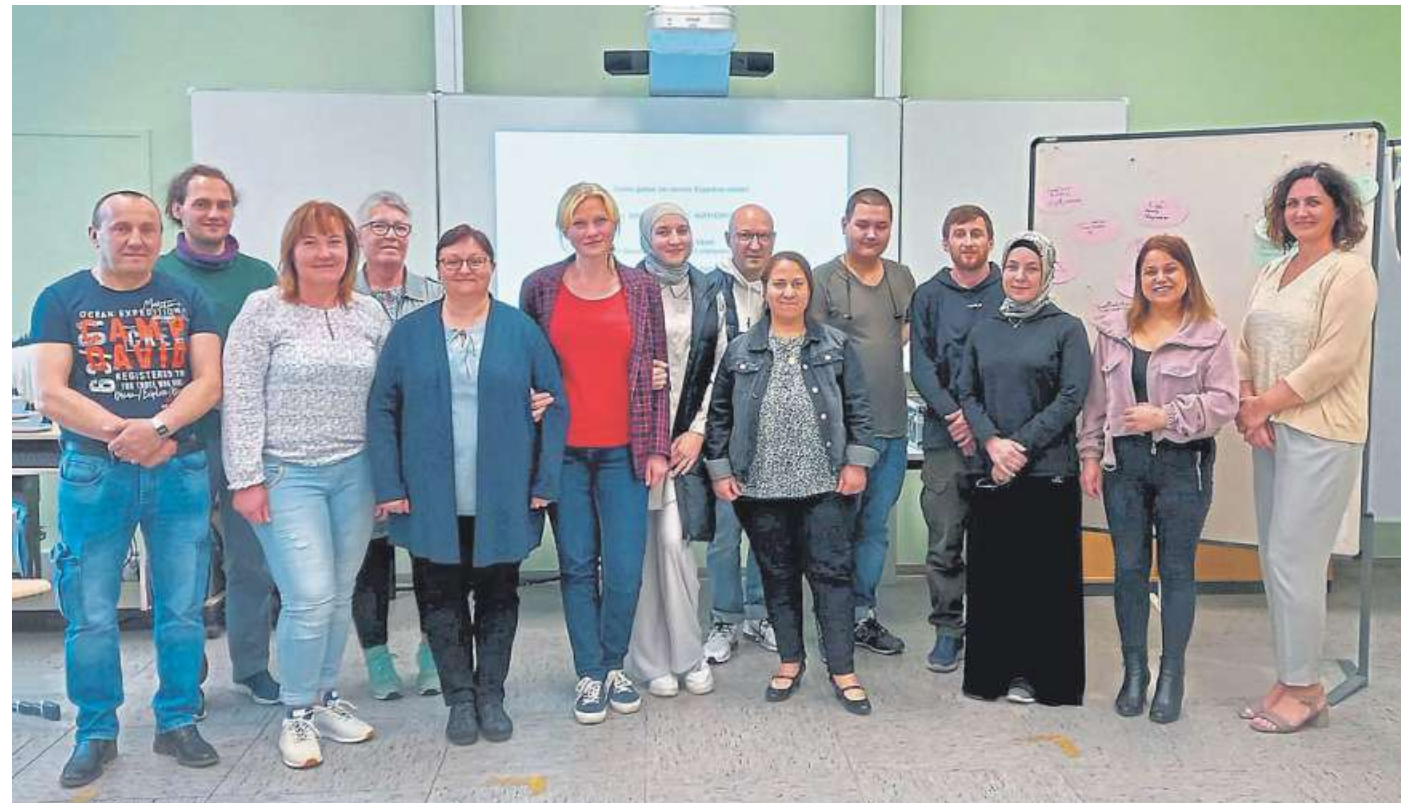
160 ehrenamtliche Sprachmittlerinnen und Sprachmittler gibt es bereits, doch es werden noch mehr benötigt.

Beim Einsatz kann es zum Beispiel um die Übersetzung von Anträgen bei Behörden, Institutionen oder Gemeinden gehen oder um Übersetzungstätigkeiten bei Terminen in