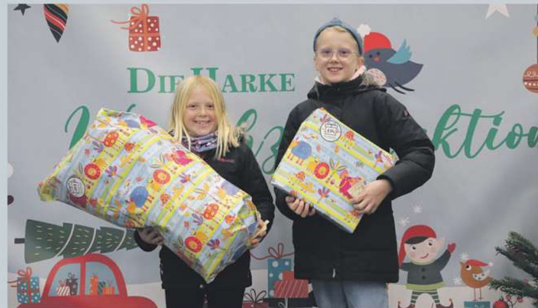
Wie im Vorjahr hofft DIE HARKE auf viele glückliche Gesichter bei der Geschenkübergabe.