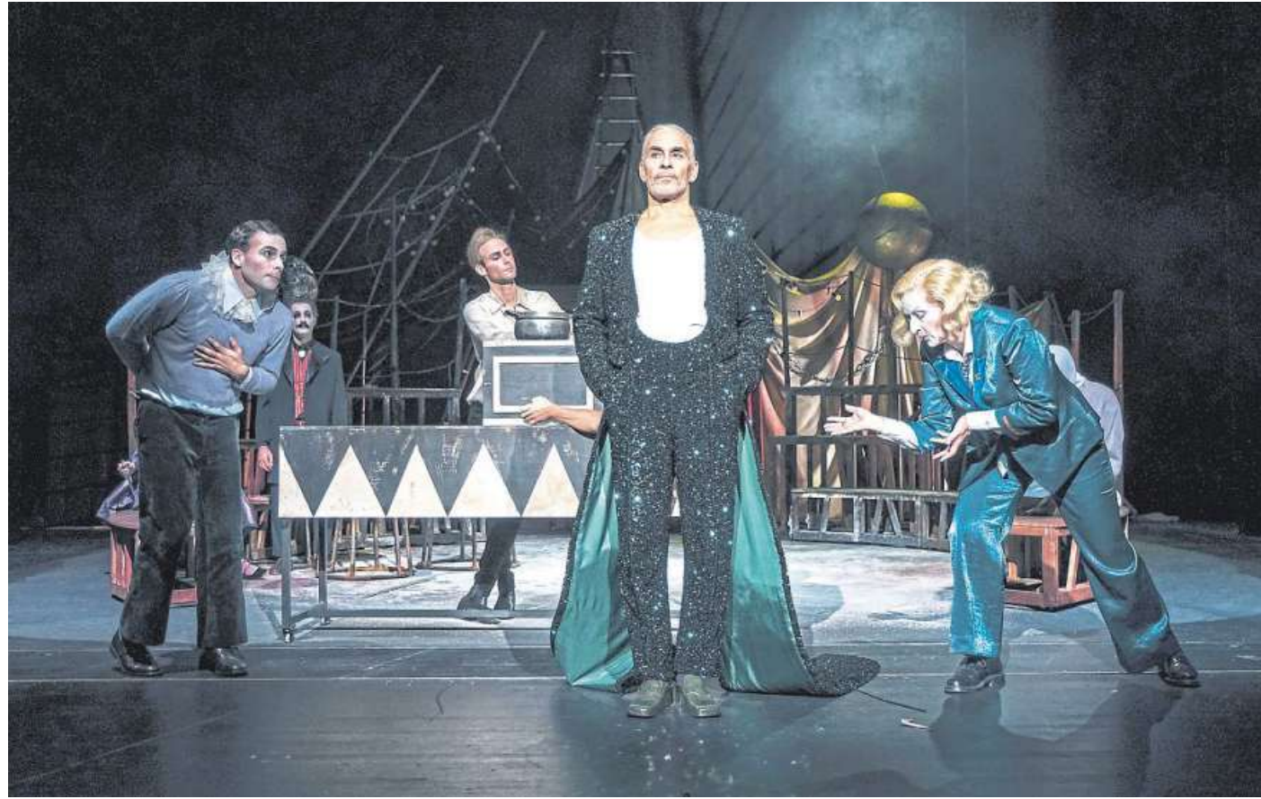
Auf humorvolle Weise erhalten Erwachsene und Jugendliche in „Der Drache“ einen Einblick in das Leben in einer Diktatur.

Es war einmal ein Land, in dem herrschte seit 400 Jahren ein fürchterlicher Drache. Doch obwohl die Menschen hier in Angst und Schrecken leben, haben sie sich mit der Situation arrangiert. Immerhin garantiert sie Stabilität. Sogar der Kater sagt: „Wo du's warm und weich hast, tust du am klügsten, wenn du vor dich