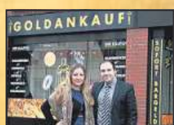
Seriös, kompetent, freundlich!