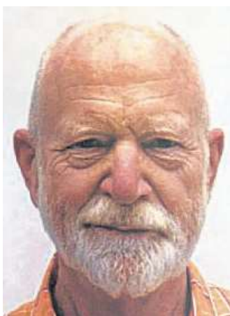
Hartmut Heß