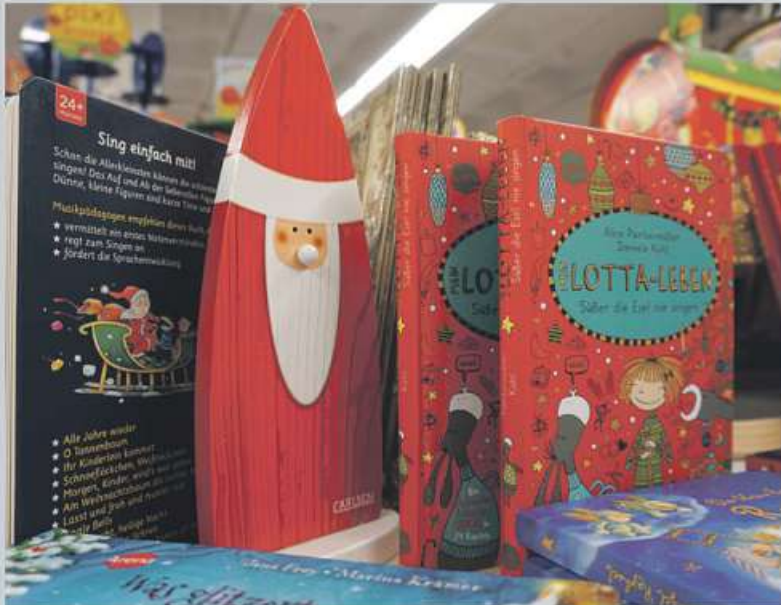
Bücher sind stets auf vielen Wunschzetteln zu finden.