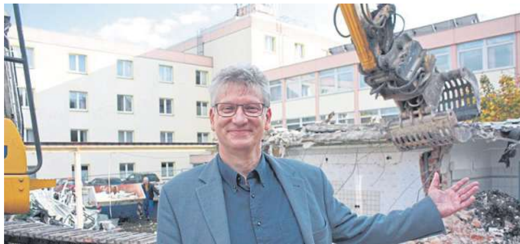
Den alten Wohnungen am Abt-Uhlhorn-Haus, die jetzt abgerissen werden, soll mittelfristig ein dreistöckiger moderner Anbau folgen.

Das erfolgreiche, spezielle Konzept für demenziell er-