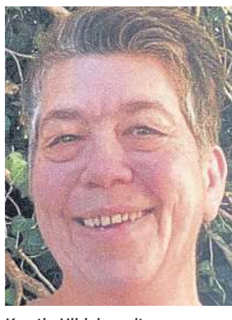
Kerstin Hildebrandt