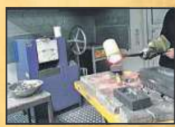
Eigene Schmelzöfen minimieren Kosten bei Der Goldmann