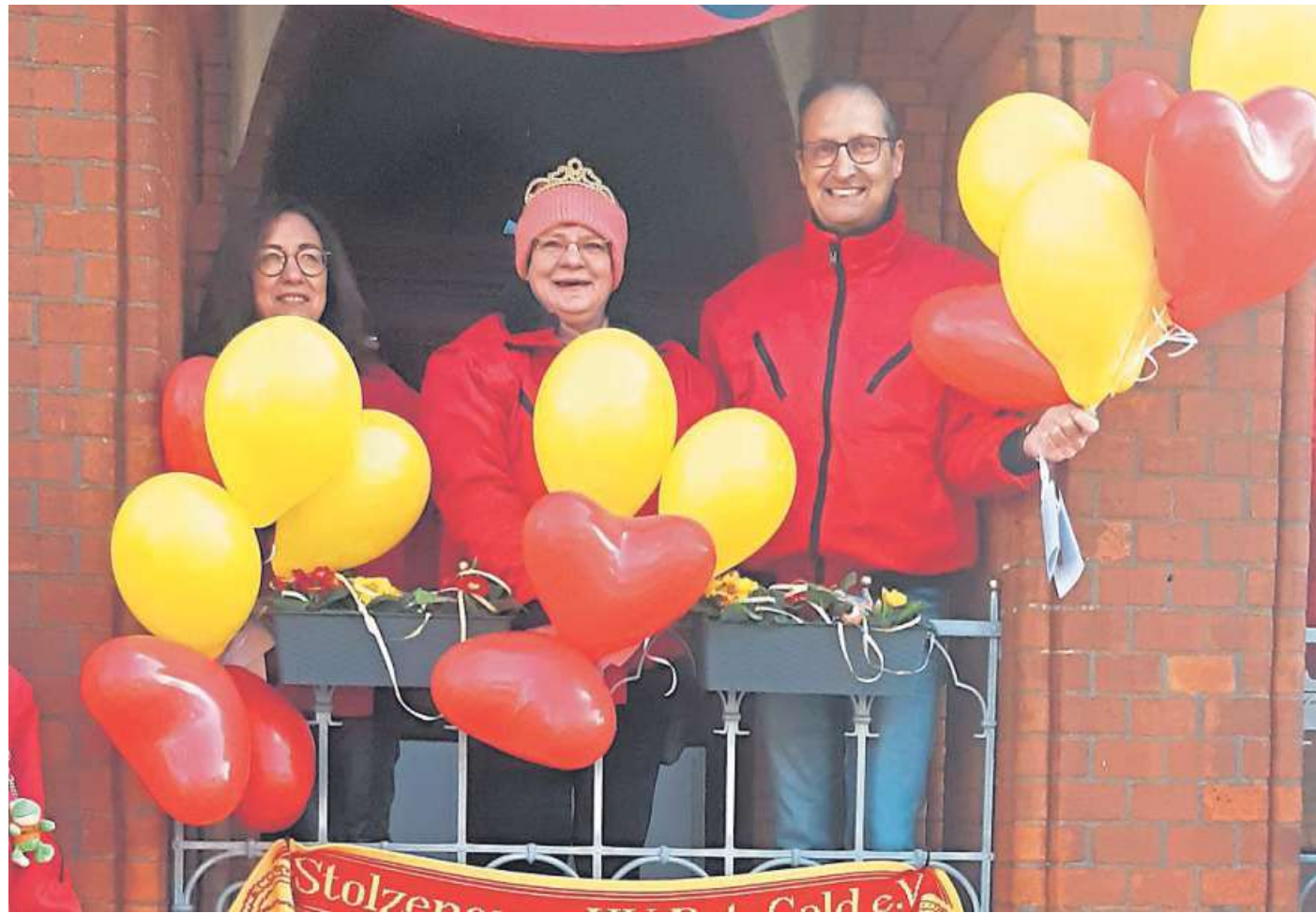
Wenn es am Tag vor Rosenmontag schon keinen Umzug geben konnte, so wurde in Stolzenau von den Närrinnen und Narren doch wenigstens das Rathaus geschmückt.