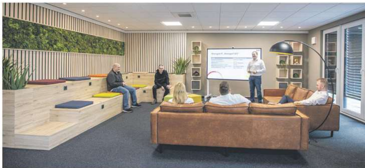
Viel Platz zum Austausch und für Kreativität.

In dem Anbau befinden sich zusätzliche Büros und Meetingräume, außerdem ein „Open Work Office“, in dem sich Mitarbeitende kreativ austauschen können. Und weil sich epc modernes Arbeiten mit attraktiven Bedingungen auf die Fahnen geschrieben hat, gibt es im dem neuen Trakt sogar einen Fitnessraum und eigene Duschräume. Eine Klimaanlage sorgt