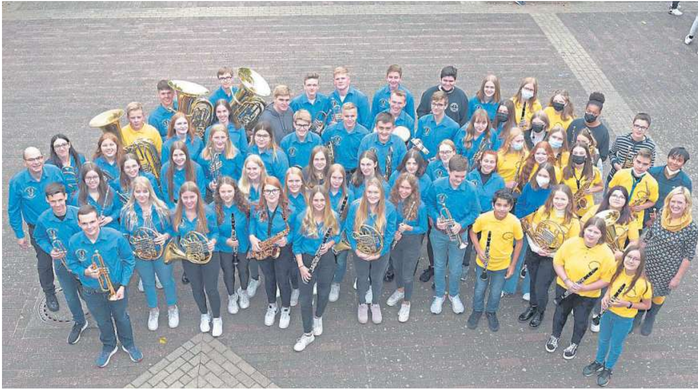
Auch das Jugendblasorchester Stolzenau beteiligt sich an dem Benefizkonzert zugunsten der Nienburger Tafel.

Durch professionelle Darbietungen ist das Orchester ein bedeutender Sympathieträger und Repräsentant poli-