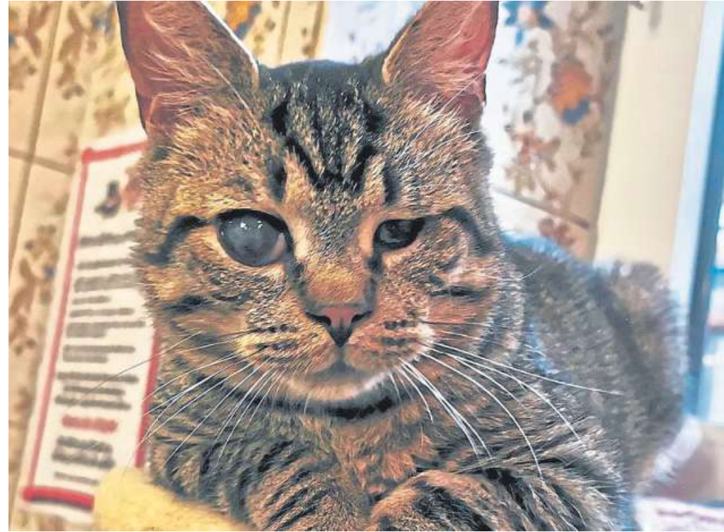
„Findus ist ein tapferes Kerlchen“, schreibt Tierheim-Mitarbeiter Carlheinz Romann. Er würde sich freuen, wenn der junge Kater ein neues Zuhause fände.

„Wer diesem Goldstück ein Zuhause schenkt, ist wahrhaftig gesegnet. Der kleine Fin-