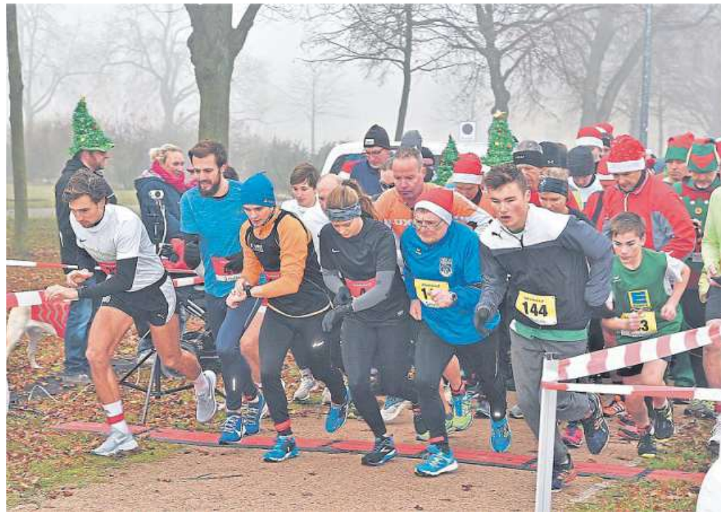
Das Foto zeigt den Start der Läuferinnen und Läufer beim 3. Helios Adventslauf im Jahr 2019.

Gestartet wird der Adventslauf um 10.30 Uhr auf der Nord-West-Seite des Nienburger Krankenhauses (Seite