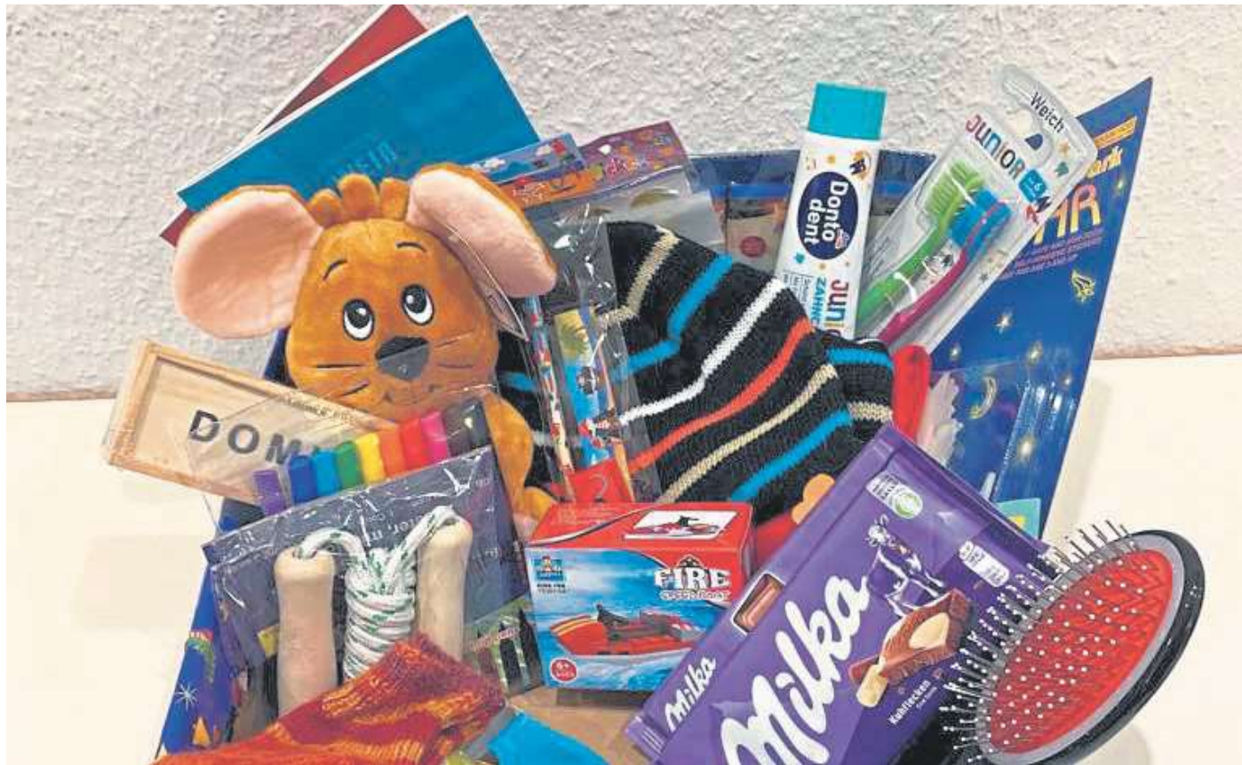
So könnte ein Karton aussehen, der Kindern in Osteuropa eine Freude bereiten soll.

In den vergangenen Jahren hat das Kindergottesdienstteam diverse Rückmeldungen aus Polen, Rumänien und Moldavien bekommen. Die Pakete kommen also an, dort wo sie gebraucht werden und den beschenkten Kindern eine riesengroße, unvergessliche Freude bereiten.