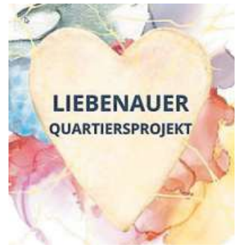
Der Bereich an der Ortsdurchfahrt soll aufgewertet werden. Dieses Logo steht für den Aufbruch.

ken, bemüht sich der Flecken Liebenau derzeit um eine Aufwertung im Bereich der Liebenauer Ortsdurchfahrt.