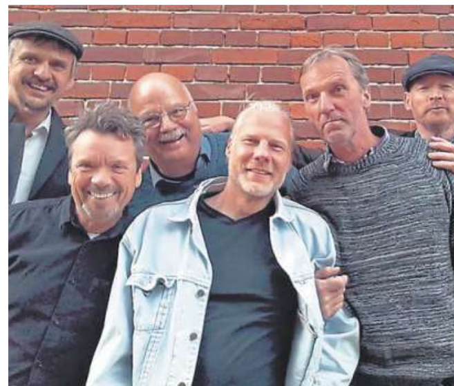
Gute handgemachte Rockmusik: dafür steht die Martfeld Blues Band.

*) Listenpreis - Alles Abholpreise - Ohne Deko. | 2) Gültig bis zum 11.11.2022. Auf Möbel und Küchen ab einem Einkaufswert von 50,00 €. Gilt nur für Neuaufträge, ausgenommen preisreduzierte Werbeware, mit Dauerlieferpreis gekennzeichnete Ware und bereits reduzierte Ausstellungsstücke, die in unserer Ausstellung gekennzeichnet sind, Geschenkgutscheine, Gartenmöbel, Küchenelektrogeräte, Spülen, Armaturen und Küchenzubehörartikel. Diese Anzeige bitte als Ihren persönlichen Gutschein vorlegen. Art. Nr. 0396 1041