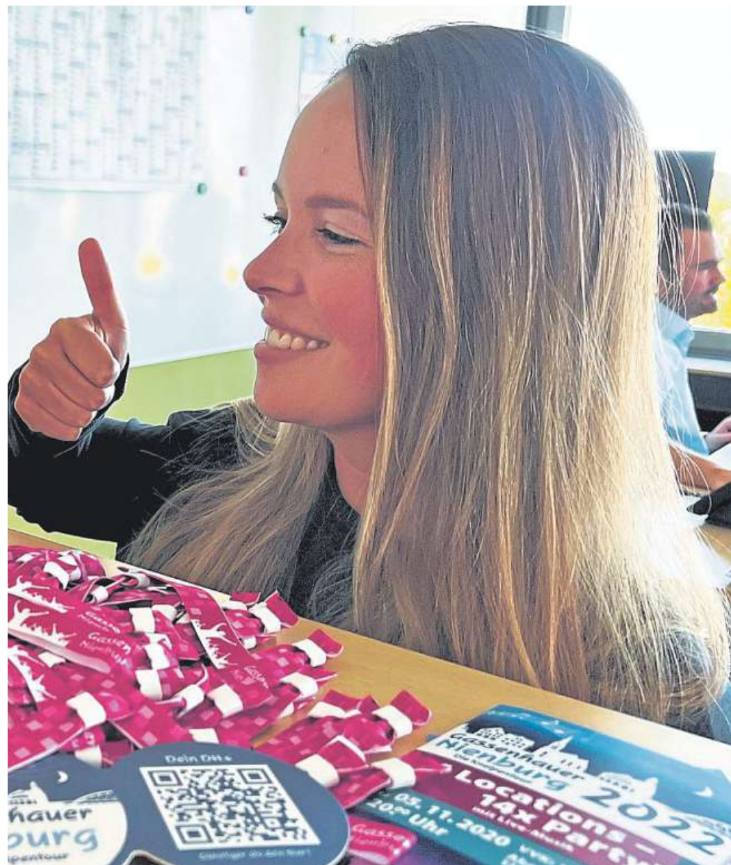
Bändchen für den Gassenhauer.

Nienburg: Vorverkauf läuft noch kommende Woche