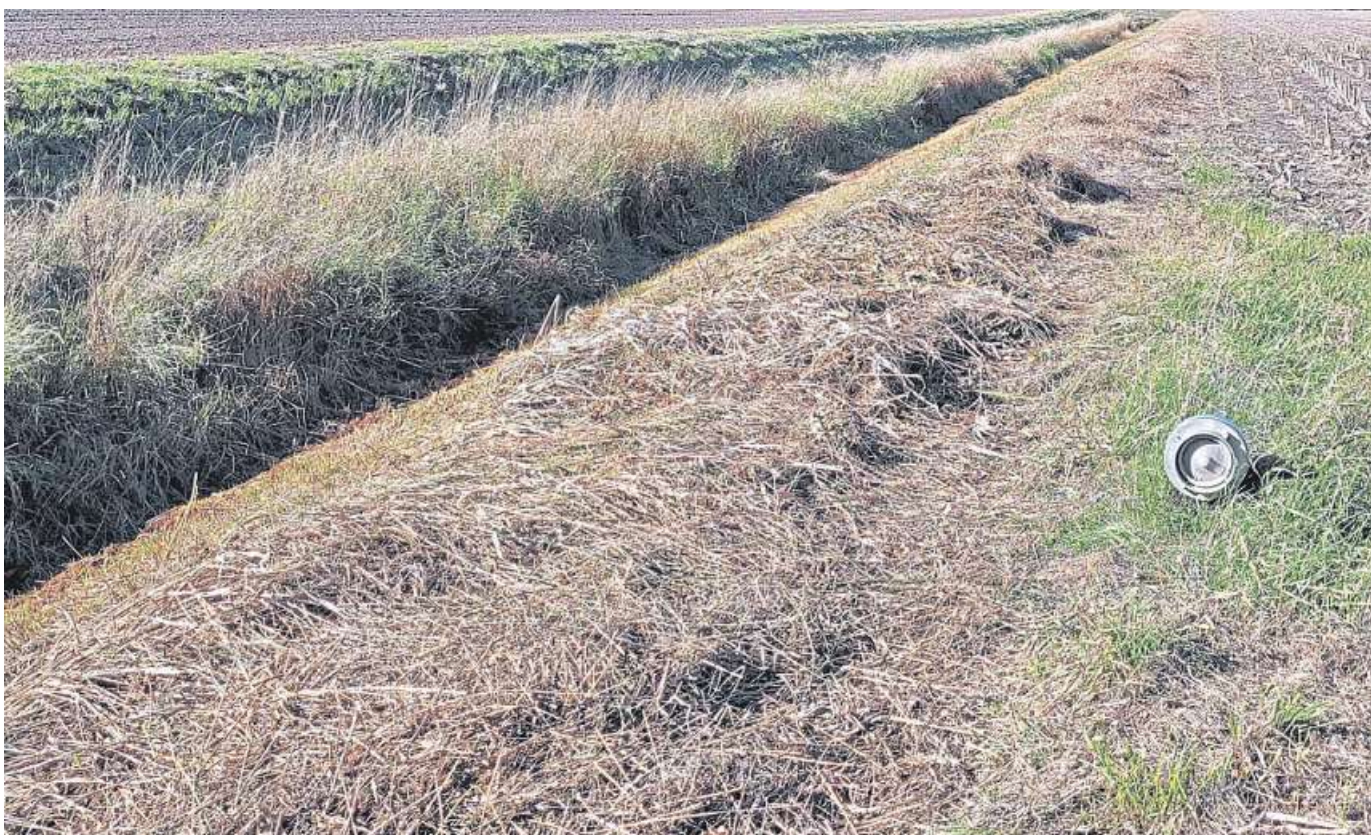
Das Foto zeigt einen einseitig geräumten zwei Meter tiefen Entwässerungsgraben ohne Wasserstand sowie einen Sauganschluss zur Wasserentnahme für eine Beregnung der landwirtschaftlichen Produktionsfläche.

NABU-Kreisverband Nienburg fordert Gewässerunterhaltungsverordnung