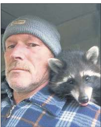
Ansprechpartner für Waschbärprobleme und Schädlinge ist die Firma Mardervergrämung UG.

hier hilft, ist die Vergrämung – da die Tiere nicht getötet werden und den Eingriff unbeschadet überstehen. Um eine Rückkehr zu vermeiden, müssen danach alle Einstiegslöcher verschlossen, die Viren getötet und der Kot entfernt werden. Darauf geben wir auch 5 Jahre Garantie. Die geplagten Kunden freuen sich, dass nach der Vergrämung keine Geräusche mehr die Nachtruhe stören. Pfeffer, Radio, Urinsteine, Diesel, Essig usw. sind ebenso kreative wie erfolglose Hausmittel. Diese kosten nur Zeit und Geld. Etwa 10.000 Bilder belegen unsere Einsätze – die zugleich auch den Erfolg belegen.