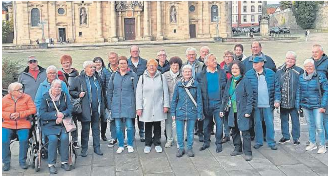
Die Gruppe aus Steyerberg vor dem Dom in Fulda

Die Rhön in ihrer bunten Pracht sahen die Mitreisenden am kommenden Tag. Sie zieht sich durch drei Bundesländer: Thüringen, Bayern und Hessen. Die höchste Erhebung, die Wasserkuppe, konnte lei-