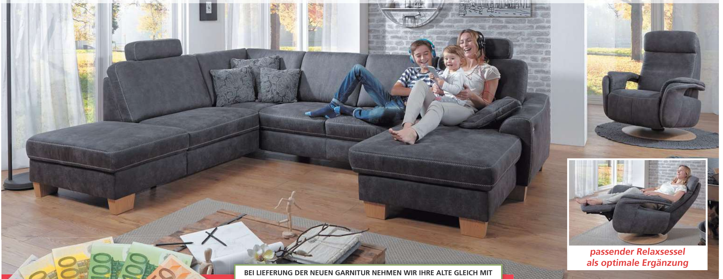
passender Relaxsessel als optimale Ergänzung

Moderne Wohnlandschaft in Stoff mit Kontrastnaht. Abholpreis ohne Funktionen, Kopfstützen und Kissen. Rücken unecht. Ausführung in Kaltschaum oder Federkern preisgleich. Stellmaß der abgebildeten Garnitur ca. 235 x 313 x 167 cm.