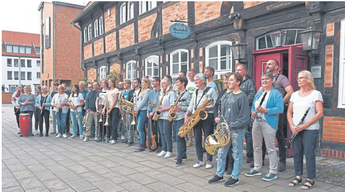
Am 27. November feiert die Musikschule Nienburg im Theater „30 Jahre Konzert- und Swingorchester“.