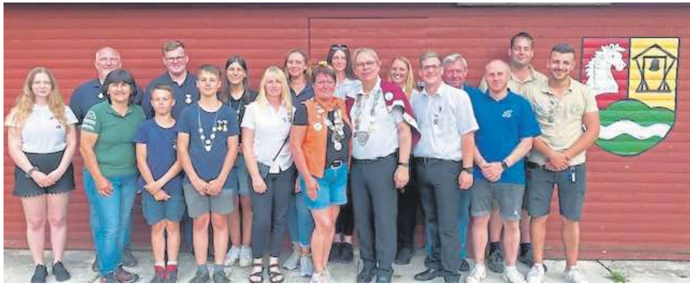
In Haßbergen wurde vier Tage lang bei bester Laune Schützenfest gefeiert.

Interessengemeinschaft Schützenfest bedankt sich für vier tolle Tage