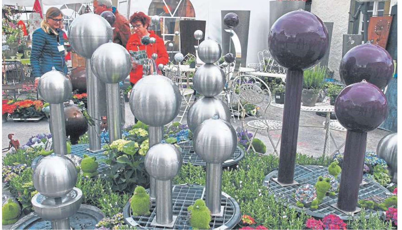
Deko für den Graten nimmt einen breiten Raum ein bei der Landpartie rund um Schloss Landestrost.

Vom 15. bis 17. Juli sommerliche Landpartie rund um Schloss Landestrost in Neustadt