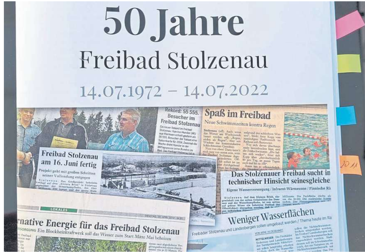
Stolzenaus Freibad-Chronik ist so gut wie fertig. Gefeiert wird nicht. Das Bad ist geschlossen.

So hat sich der Förderverein auf die Suche nach Material gemacht. „Wir haben unsere Mitglieder aufgerufen, uns Material und/oder persönliche Geschichten, Eindrücke, Er-