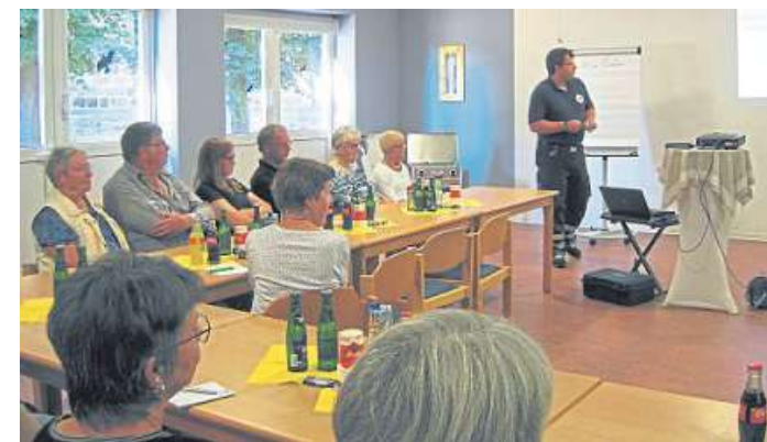
Wie man für den Notfall vorsorgen kann, erfahren rund 25 Interessierte beim DRK in Liebenau.

Zum Abschluss der Veranstaltung erhielt jeder Teilnehmer den vom Bundesamt für Bevölkerungsschutz und Katastrophenhilfe herausgegebenen „Ratgeber für die Notfallvorsorge und das richtige Han-