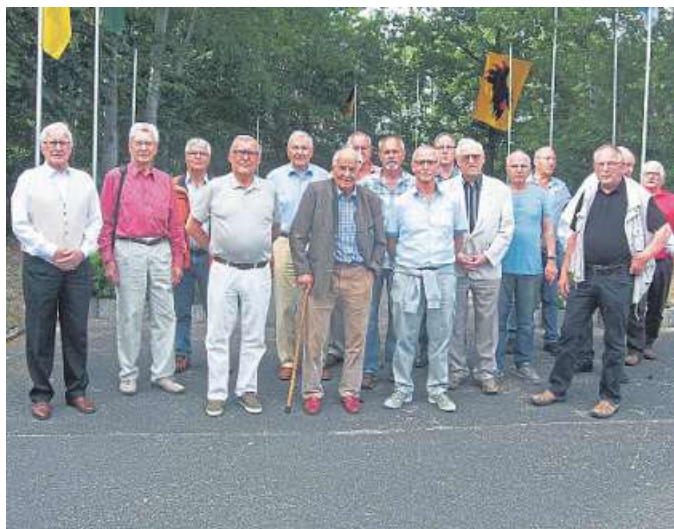
Zum 28. Mal kamen die Nienburger Panzerfreunde in der Langendammer Clausewitz-Kaserne zusammen.

Als Gast referierte der stellvertretende Kommandeur des Bataillon Elektronische Aufklärung 912 über diesen Verband und brachte den „alten Haudegen“ mit seinen Aus-