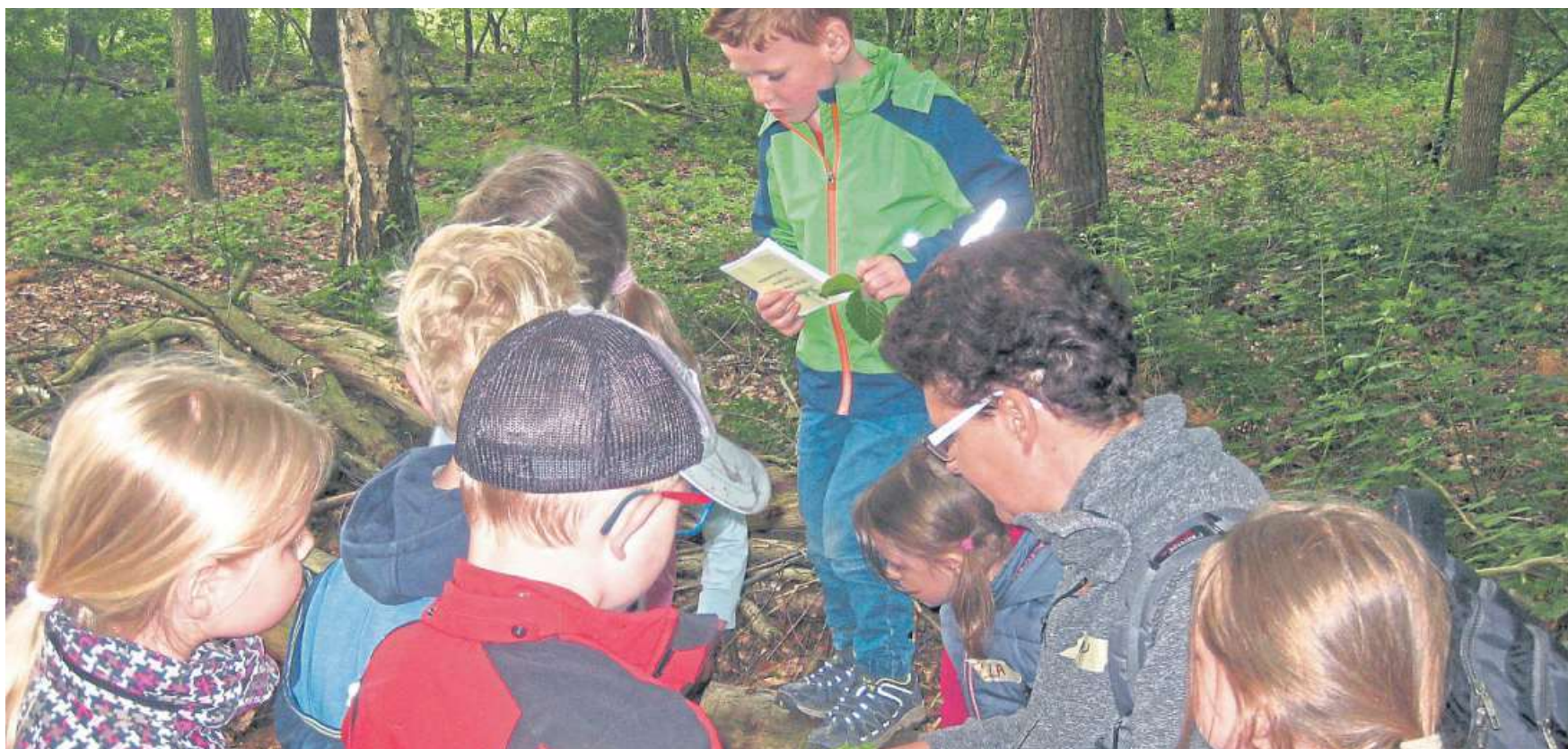
Total begeistert waren die Kinder der Kita „Sonnenstrahl“ aus Warmssen vom Besuch bei den „Waldforschern“ in Uchte.

Kindergarten „Sonnenstrahl“ aus Warmssen besuchte den Waldkindergarten in Uchte