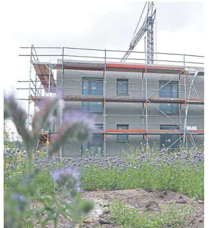
Der Neubau der Diakonie Himmelsthür an der Verdener Landstraße in Nienburg.

Auch in Drakenburg sei in der Zwischenzeit viel passiert. Das Außengelände in Drakenburg habe sich stark verändert. Der schon bestehende Sinnesgarten sei um weitere Flächen erweitert und mit einem großzügigen Gewächshaus und einem Pavillon bestückt worden.