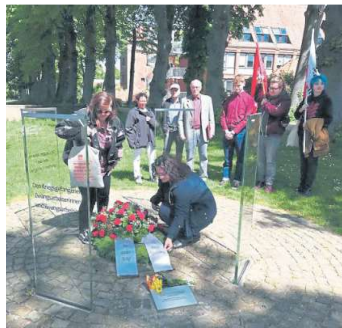
Teilnehmende leten einen Kranz nieder.