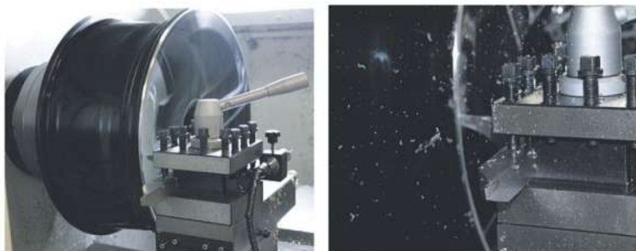
Kleine und große Macken lassen sich von Felgen entfernen. Während die Felge in der Maschine gedreht wird, fliegen feine Späne.

Hannoversche Str. 105 – 31582 Nienburg/Weser – Tel. 0 50 21/8 60 07 60 Öffnungszeiten: Mo. – Fr. 9.00 – 18.30 Uhr, Sa. 9.00 – 17.00 Uhr