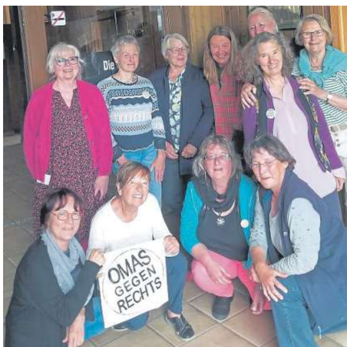
„Omas gegen Rechts“ bildeten sich fort.

Fortbildungstag der Gruppe „Omas gegen Rechts“ Nienburg