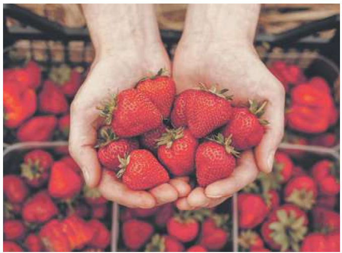
Voller Geschmack und reicher Ertrag sind Kriterien bei der Züchtung neuer Erdbeersorten.

auch südamerikanischen Raum zum Einsatz, um das beste Ergebnis zu erzielen. Für den Eigenanbau ist die Züchtung Polka sehr beliebt, da sie recht robust ist und verlässliche Erträge bringt. Wer auf eine ältere Sorte mit besonderem Aroma setzen will, kann sich an Königin Louise versuchen. Symphony und Thuringa lassen auch noch bis zum Ende der Saison die Erdbeeren höher schlagen. lps/LK