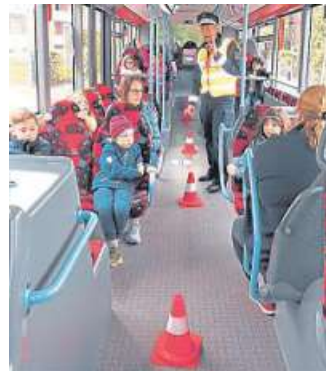
Kinder aus dem Johannissbar bei der Busfahrt.

Nachdem alle Kinder mit freundlichem Gruß an den Fahrer und korrekt gehaltenem Fahrschein ohne zu drängeln eingestiegen waren und Sitzplätze gefunden hatten, fuhr der Bus ab.