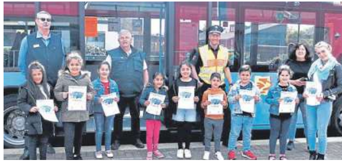
Künftige Schulkinder aus der „Arche Noah“.