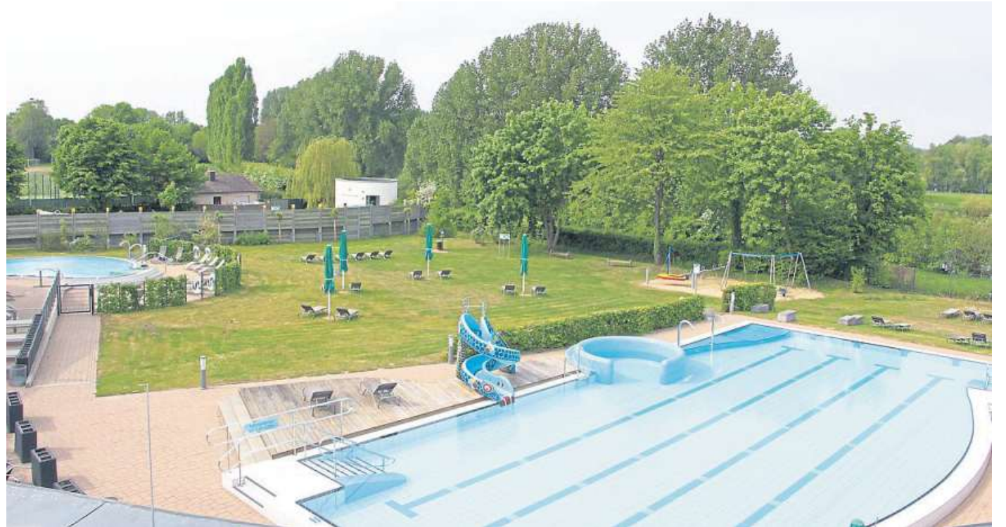
Der Außenbereich ist für die Sommersaison vorbereitet.

Ausgebucht sind bereits Ferienschwimmkurse, für die sich rund 60 Kinder angemeldet haben. nis