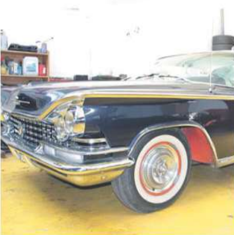
Auch seltene Schätzchen bekommen bei Autobedarf Hoffmann eine entsprechende Behandlung.

Anlässlich des Jubiläums sind für den Juni einige Aktionen geplant. Über facebook (autobedarf hoffmann) und instagram (turbotechs_felgenveredlung) werden sie aktuell veröffentlicht.