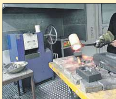
Eigene Schmelzöfen minimieren Kosten bei Der GOLDMANN

Ihre erste Adresse für Goldankauf in Nienburg