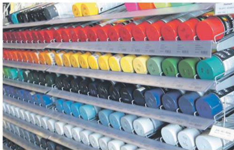
Eine große Palette an Farben und Lacken steht bereit, außerdem sind individuelle Anmischungen möglich.