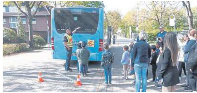
Teilnehmer aus der Kita Alpeheide.