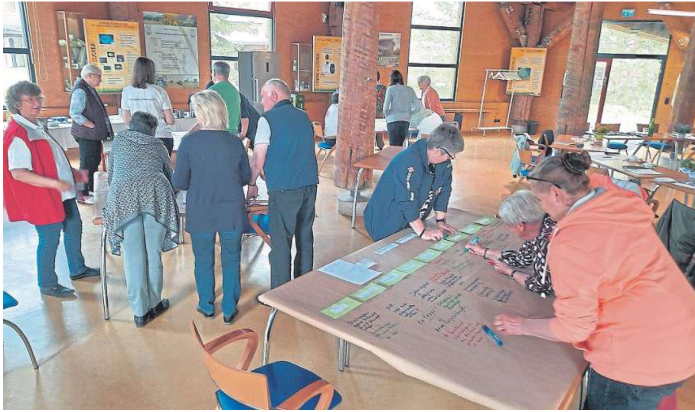
Aktiv arbeiten Vertreterinnen und Vertreter aus den Ortsvereinen an den aktuellen Themen beim „World Cafe“ mit.

Ab kommendem Montag, 16. Mai, ändert sich der bisher geltende Umleitungsplan der VLN-Linien 53 und 6053 SonntagsBus. Die Umleitungsstrecke wird angepasst, somit können die Haltestellen Leese, Bahnhof und Leese, Stolzenauer wieder bedient werden. Weiterhin können aber die Haltestellen Loccumer Straße und Kirchstraße nicht angefahren werden. Das betrifft auch die Linie 60. DH