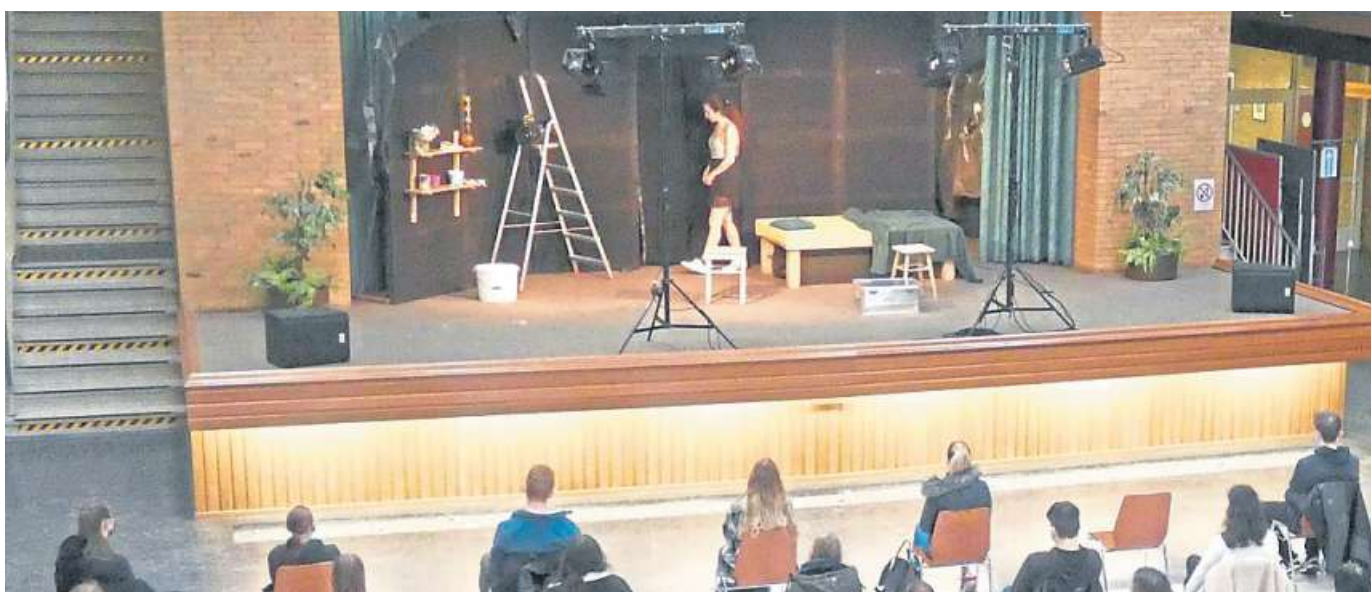
Vor dem Konsum von Drogen warnte der Weimarer Kultur-Express bei seinem Gastspiel an Nienburgs BBS.

Weimarer Kultur-Express thematisiert den Umgang mit Drogen