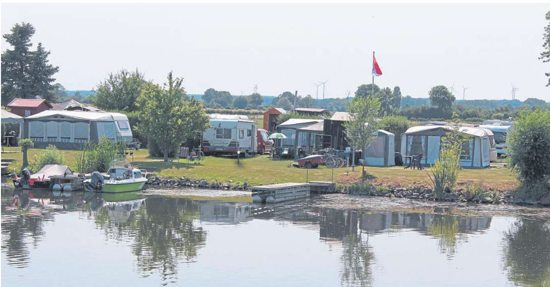
Urlaubsfeeling pur vermittelt der Campingplatz in Drakenburg. Der neue Flyer informiert über alles Wissenswerte rund ums Campen.

Kostenloses Faltblatt informiert über Adressen, Ausstattung und vieles mehr