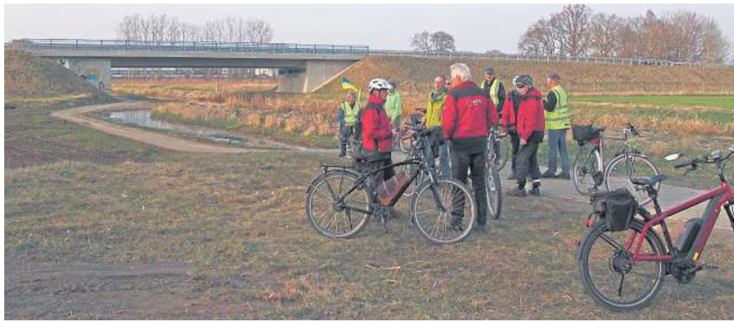
An der Senke am Südringradweg wurde auch über das Projekt der Klimaachse Steinhuder Meerbach gesprochen.