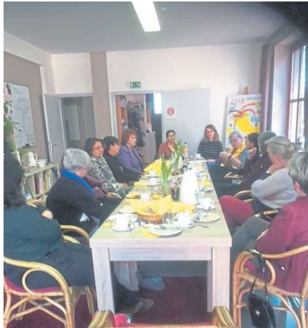
Das Treffen der Kreistagspolitikerinnen fand dieses Mal im Mütterzentrum Uchte statt. Weitere Teilnehmerinnen waren zwei Gleichstellungsbeauftragte aus dem Süden des Kreises Nienburg.

Längst treffen sich im Mütterzentrum nicht mehr nur Frauen mit Kindern, wie der Name mutmaßen lässt, sondern zum Beispiel auch Männer und Frauen zu Nähkursen, Ehrenamtliche, die Sprach-