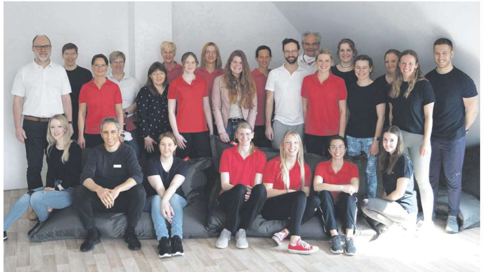
Das Team des Therapiezentrums am Burgmannshof freut sich über das 30-jährige Bestehen.