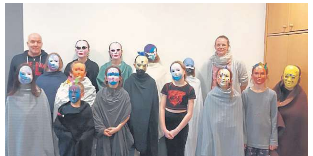
Masken in allen Variationen: Die Kreativität im Jugendhaus kannte keine Grenzen.

Kinder und Jugendliche leiten sich nicht selten Beratungen für Eltern ab. Ob schulische Probleme, Hilfestellungen bei Trennungen oder all-