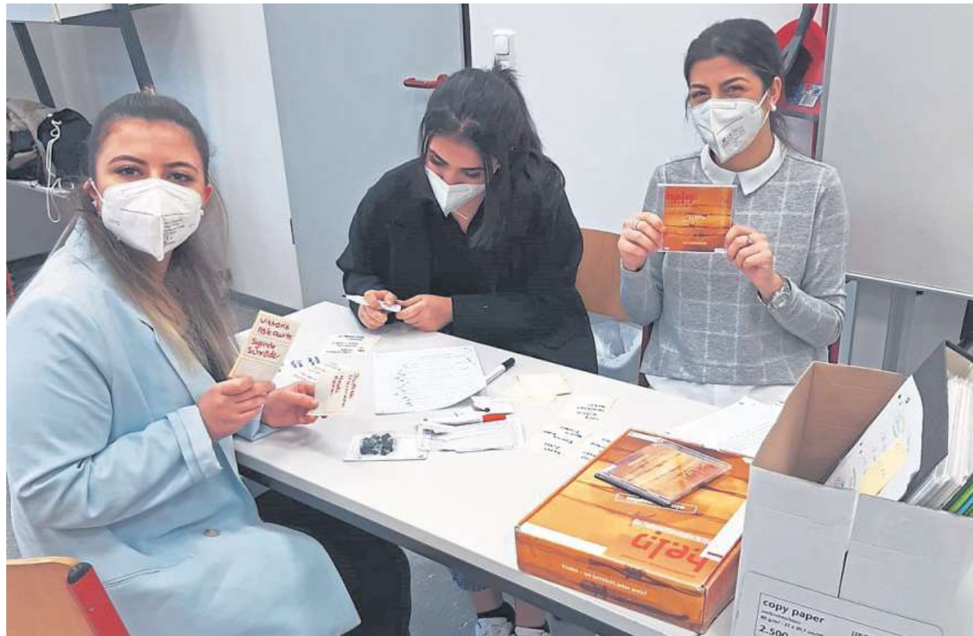
Im Unterricht praxisnah zu arbeiten nimmt an den Rahn Schulen in Nienburg einen hohen Stellenwert ein.

Aber Projekte sollen auch Freude bereiten. Besonders viel Spaß hatten die Schülerinnen und Schüler vor einigen