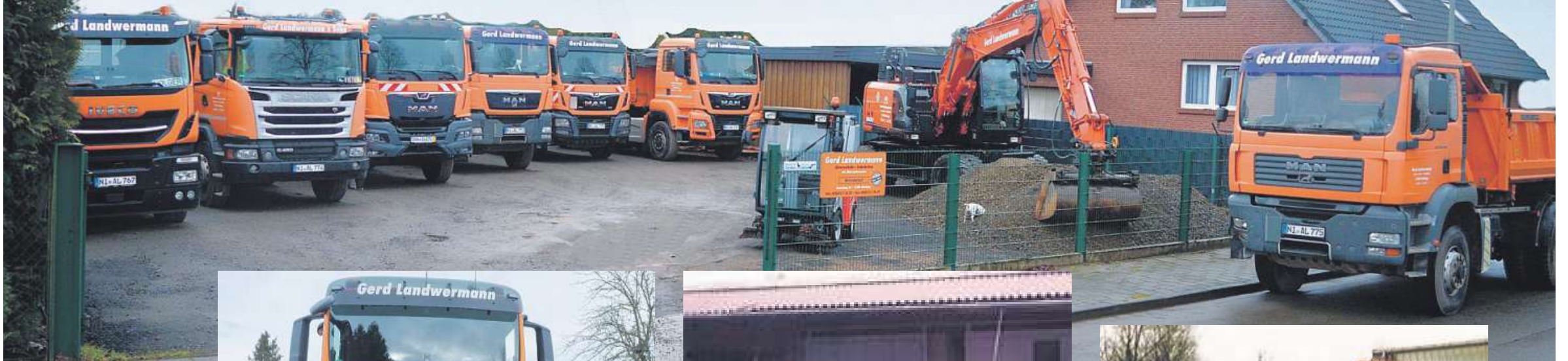
Der Fuhrpark des Unternehmens.