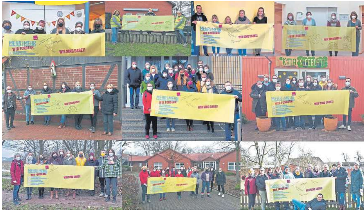
Ergänzend zum Streik läuft derzeit auch eine Transparentenstaffel, wo Beschäftigte aus verschiedenen Einrichtungen zeigen, dass sie hinter den Forderungen stehen. Hierzu gehören Verbesserung der Arbeitsbedingungen, Maßnahmen gegen den Fachkräftemangel, finanzielle Anerkennung der Arbeit.

Selent weist darauf hin, dass ver.di am 8. März nicht mit voller Kraft aufschlagen werde, aber eine sichtbare Warnung abgeben wird. Bereits