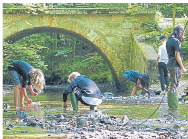
Die BUND-Kreisgruppe Nienburg sucht junge Leute ab 15 Jahren, die Lust haben, den Kohlhofsbach bei Husum und die Huddestorfer Flöte bei Uchte zu untersuchen.

Hier werden an zwei Tagen im Jahr die Struktur des Baches, seine chemischen und seine physikalischen Werte untersucht und die kleineren Tiere im Wasser gefangen,