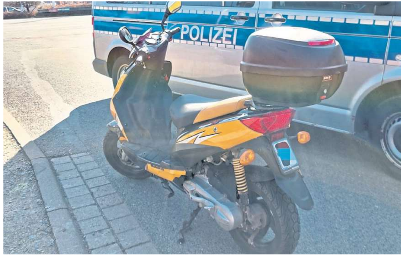
Seit Dienstag gelten die neuen grünen Versicherungskennzeichen. Die Polizeiinspektion Nienburg/Schaumburg stellte bei ihrer Kontrolle mehrere Verstöße fest.

Anderthalb Stunden später erschien die 51-Jährige in der Dienststelle des Kommissariats und zeigte ein grünes, gültiges Versicherungskennzeichen für