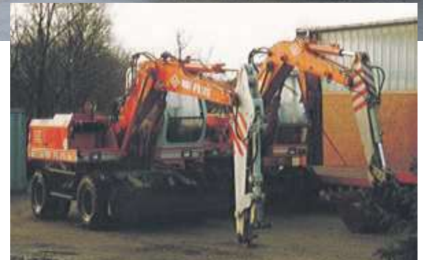
Qualität: Im vorderen Bagger hat Firmengründer Gerd Landwermann rund 17000 Arbeitsstunden verbracht.