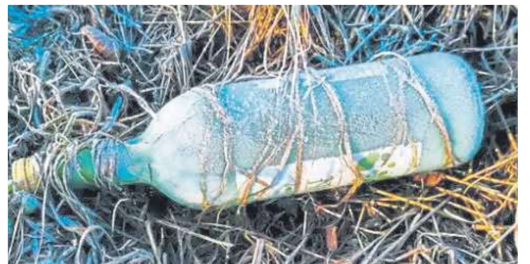
Diese Flasche hat Christina Scharnhorst-Brede ins passende Licht gerückt.