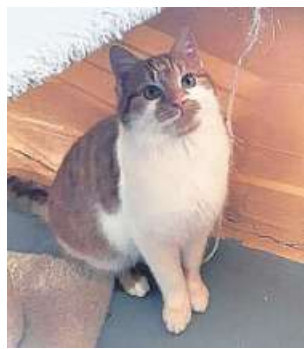
Dieser kleine Kater wurde an der B 215 in Drakenburg aufgegriffen.

Die Tierschützer hoffen, dass sich die Besitzer ermitteln lassen. Diese mögen sich doch bitte unter 05024-8433 im Tierheim Drakenburg melden.