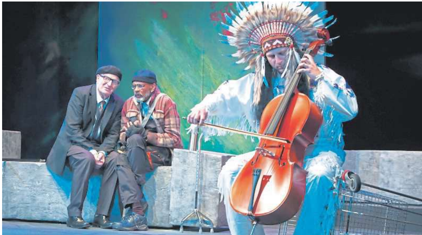
Die Hamburger Kammertheater führen am 10. März die vielfach ausgezeichnete Komödie „Ich bin nicht Rappaport“ im Nienburger Theater auf.

„Ich bin nicht Rappaport“ am 10. März im Nienburger Theater