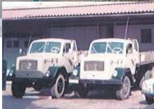
Günstig erworben und selbst restauriert hat Gerd Landwermann die ersten Fahrzeuge.