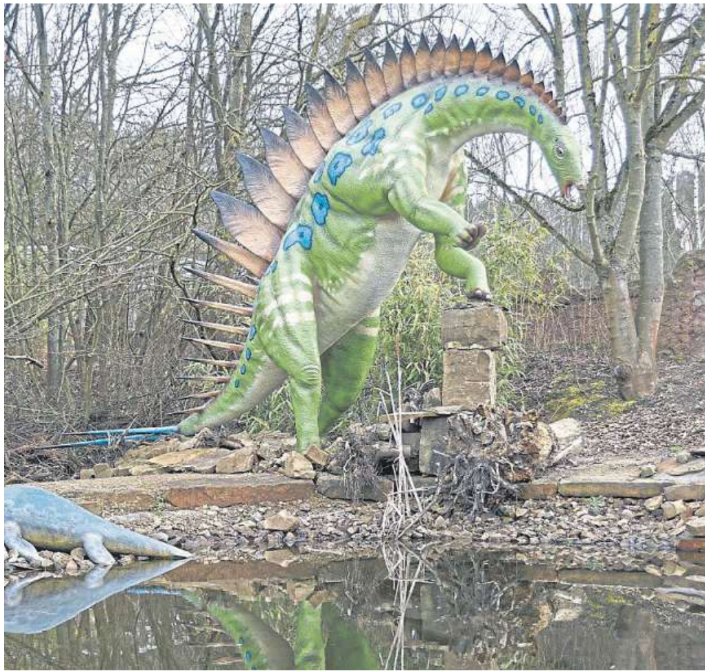
Der jüngste Bewohner des Dinoparks ist Miragaia, ein naher Verwandter des bekannten Stegosaurus. Ab Sonnabend ist auch er in Münchehagen zu bewundern.

Neben den lebensechten Dinosauriern, familiengerech-