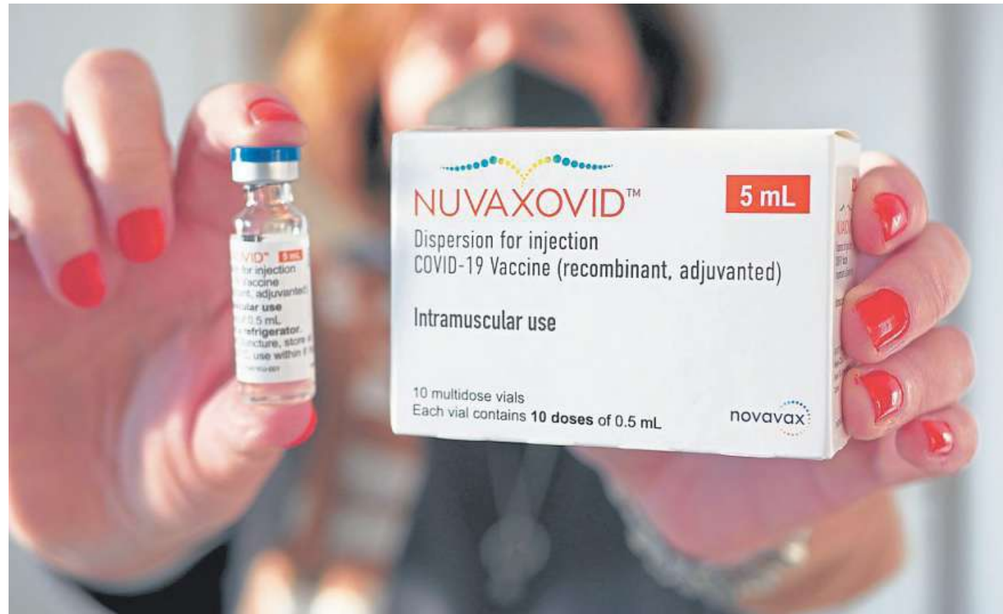
Eine Mitarbeiterin der Impfstelle hält die erste Dosis „Novavax“ in die Kamera.

Novavax ist der fünfte Corona-Impfstoff, den es in Deutschland gibt. Experten hoffen, dass der Proteinimpfstoff eine Alternative für Menschen sein könnte, die sich nicht mit den bisherigen mRNA-Impfstoffen von BioNTech und Moderna impfen lassen wollen. Wer sich mit Novavax impfen lassen möchte, kann sich bei der niedersächsischen Impfhilfe unter der kostenfreien Telefonnummer 0800 - 9988665 anmelden. Anschließend wird per SMS ein Impftermin in der gewünschten Kommune mitgeteilt. Mitzubringen sind der Personalausweis und – sofern vorhanden – der Impfausweis. Um mögliche Wartezeiten vor Ort zu vermeiden, sollten die Aufklärungsunterlagen, der Anamnesebogen und die Einwilligungserklärung bereits ausgefüllt mitgebracht werden.