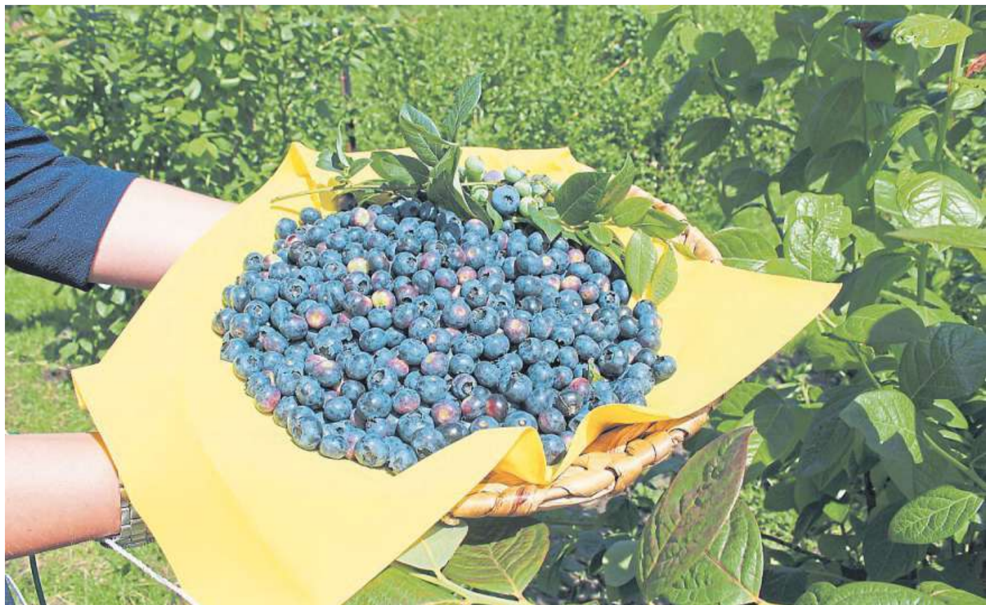
Die Blaubeeren haben im Landkreis Nienburg gerade Hochsaison.