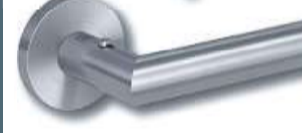
Lucia Professional Edelstahl matt...