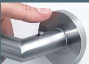
...mit innovativer Smart2Lock-Verriegelung

*Blatt + Zarge + Drücker in der Elementgröße 198,5 x 86 x 14 cm inkl. MwSt.