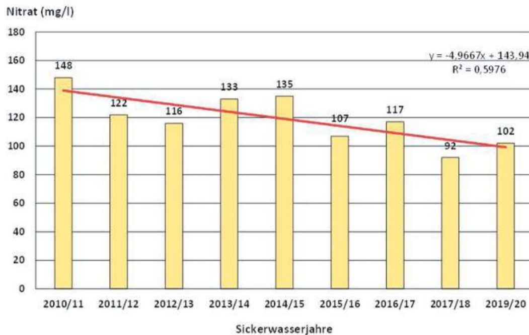
Die Veränderung des Nitratreintrags. Der Schwellenwert laut Grundwasserverordnung liegt bei 50 Milligramm Nitrat pro Liter Grundwasser.