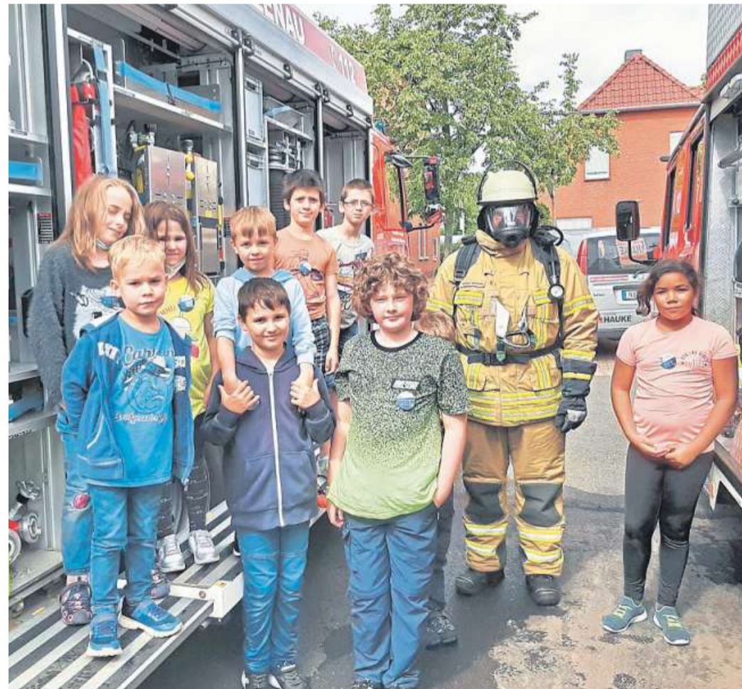
Die Kinder hatten viel Spaß bei der Feuerwehr.

Ein weiterer Höhepunkt war die Foto-Box der Kreisjugendfeuerwehr, die extra für diese Aktion bereitgestellt wurde: „Es gab sehr viele schöne Erinnerungsfotos zum Teil in Jugendfeuerwehrkleidung mit dem besten Freund oder mit der besten Freundin“, heißt es dazu. Zum Abschluss für diesen Nachmittag gab es für jedes Kind eine Teilnehmerurkunde.