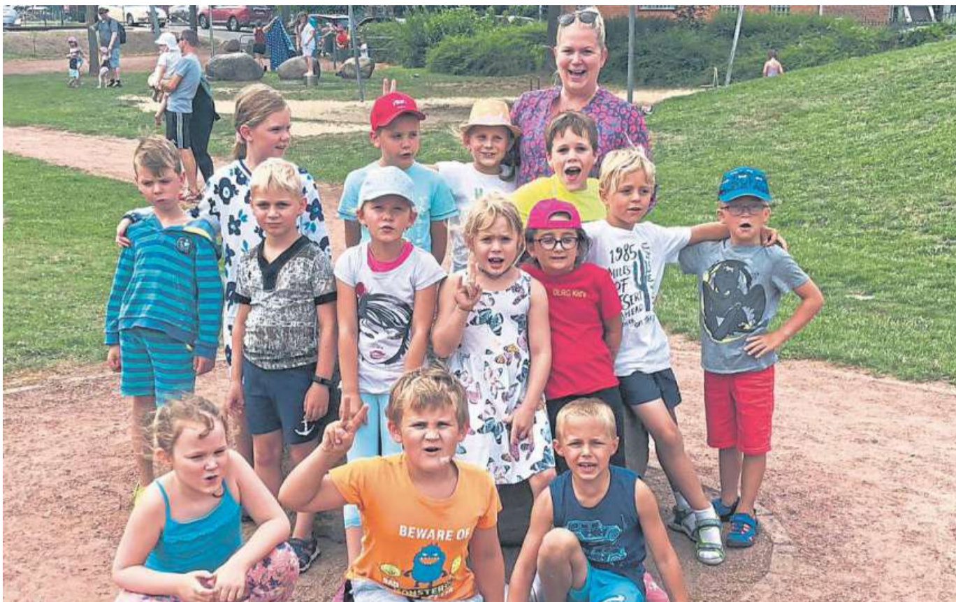
Die Kinder hatten viel Spaß auf dem Wasserspielplatz Bruchhausen-Vilsen.

Halbzeitbilanz beim Haßberger Ferienpass