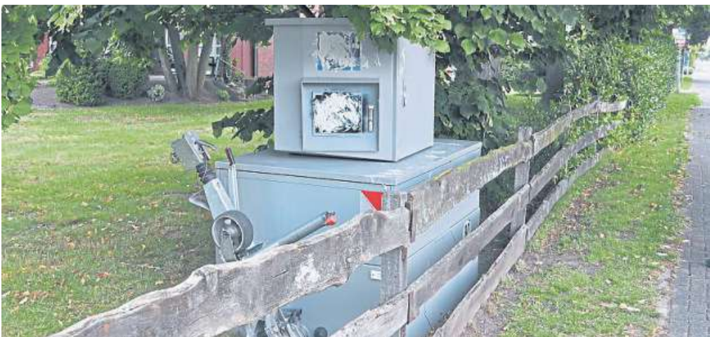
Unbekannte haben den Blitzleranhänger des Landkreises beschädigt. Die Polizei ermittelt wegen Sachbeschädigung.

Hinweise nimmt die Nienburger Polizei unter Telefon (050 21) 977 80 entgegen. seb