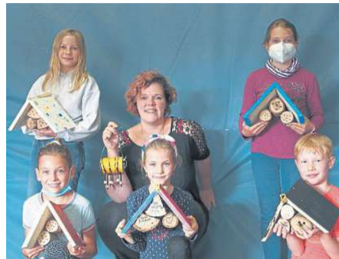
Steyerberger Ferienkinder bauten im Jugendhaus besondere Behausungen für Bienen.