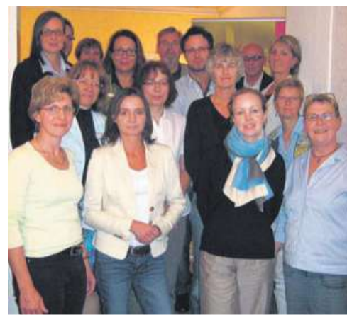
Dieses Bild der ursprünglichen Mitglieder entstand auf der Gründungsveranstaltung.