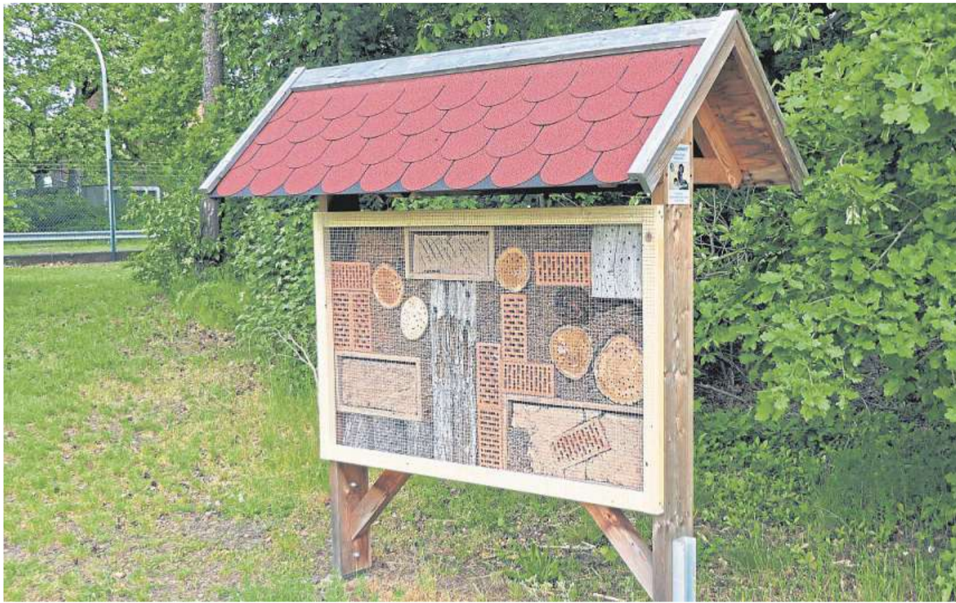
Verschiedene Materialien laden die seltenen Hautflügler zur Eiablage ein. Ein Dach schützt vor Nässe, die zur Verpilzung der Larven führen würde.

Nahrung finden die Bienen ganz in der Nähe ihrer sonnigen, vor Wind und Regen geschützten Kinderstube. Kaum hundert Meter entfernt wurden in der Kaserne Trockenmauern angelegt und mit blühenden Sträuchern und Stauden bepflanzt. Zusätzlich soll noch in diesem Jahr am ehemaligen, heute ungenutzten Tor 2 der Kaserne, dessen