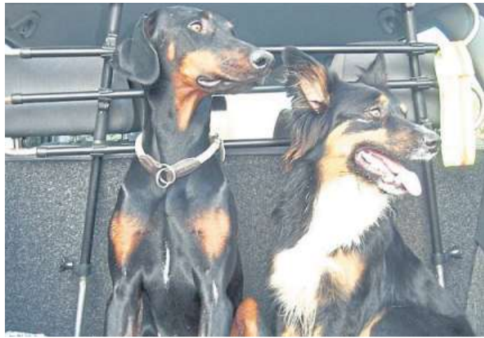
Besonders bei Hitze keinesfalls Hunde in parkenden Autos zurücklassen