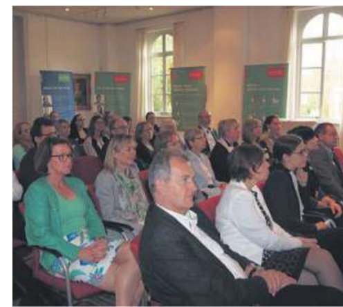
Mitgliederaustausch auf dem Frühlingsempfang im Jahr 2018.

sie betont: „Wir freuen uns stets über weitere Unternehmen, die sich familienorientiert aufstellen und Teil unseres Netzwerkes sein wollen.“ Aus den ursprünglich 15 Gründungsmitgliedern sind mittlerweile 29 Unternehmen unterschiedlichster Branchen geworden. Beim Frühlingsempfang und