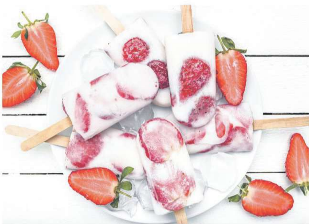
Fruchtiger Genuss für heiße Sommertage: Erdbeer-Eis einmal anders.

Erdbeeren gehören zu den Top 10 der beliebtesten Obstsorten der Deutschen, doch nicht jeder weiß, dass es sich bei den saftig-süßen Köstlichkeiten um eine Scheinfrucht handelt. Aus botanischer Sicht sind die Erdbeeren nämlich keine Beeren, sondern gehören zu den sogenannten Sammelfrüchten. Die eigentliche Frucht der Erdbeere besteht nicht aus dem roten Fruchtfleisch, stattdessen handelt es sich bei den kleinen gelben Körnchen, mit denen die Oberfläche der Erdbeere übersät ist, um winzige Nüsschen. Für die meisten Liebhaber der herzförmigen Köstlichkeit ist es aber sicherlich zweitrangig, welcher Gattung diese angehört, denn die Erdbeeren stehen als unangefochtenes Lieblingsobst für sich. Ob pur, als Marmelade, Kuchen, Eis oder Getränk: Im Sommer führt kein Weg vorbei an der