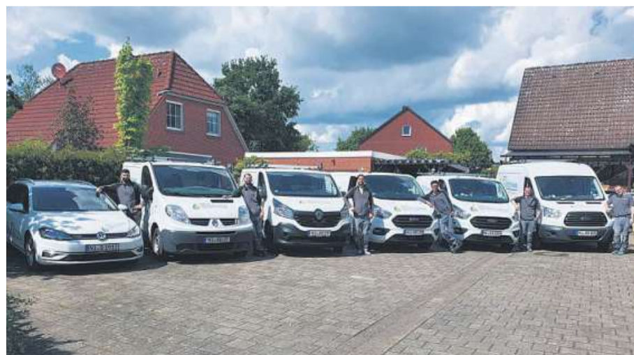
Immer einsatzbereit: Das Team von Defli Haustechnik.

Öffnungszeiten: Montag - Freitag von 7 bis 17 Uhr