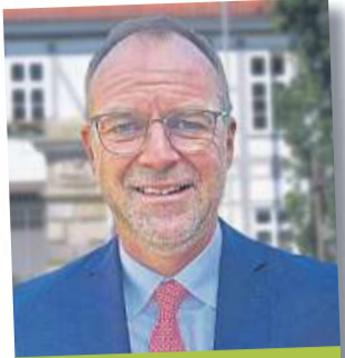
Detlev Kohlmeier Landrat des Landkreises Nienburg/Weser