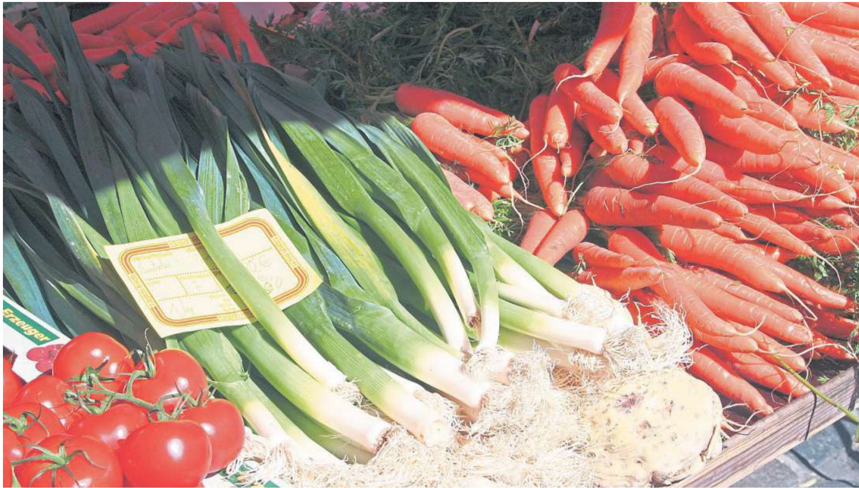
Frisches Gemüse ohne lange Lieferwege gibt es auf Märkten und in Hofläden.

■ gelesen von Jürgen Maiwald, Bücher Leseberg Guillaume Musso: Eine Geschichte, die uns verbindet, Pendo Verlag, 320 Seiten, 17 Euro, ISBN 978-386612-484-4; auch als E-book lieferbar.