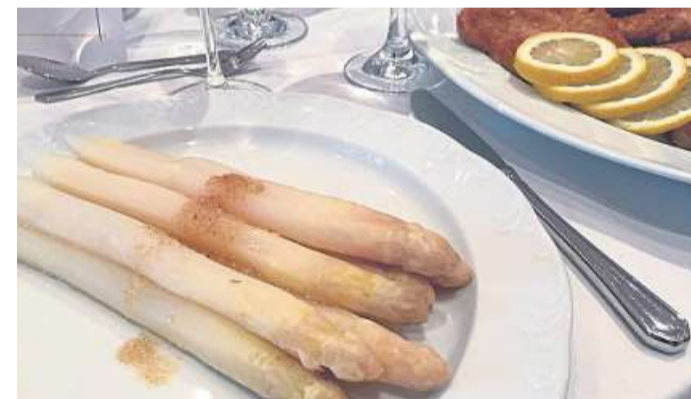
Den Nienburger Spargel gibt es noch bis zum 27. Juni in der heimischen Gastronomie.

Die Kosten betragen 190 Euro für Fahrt, Unterkunft, Vollverpflegung, wenn möglich einem Ausflug und Material. Wer Schwierigkeiten mit der Finanzierung hat möge sich vertrauensvoll an den Jugenddienst, Kirchenkreisjugendwartin Berit Busch, wenden. Sie versucht dann weiterzuhelfen und zu vermitteln. Weitere Informationen und die Anmeldung gibt es auf der Internetseite des Jugenddienstes www.kkj.d.de unter dem Reiter Termine oder unter Telefon (0 50 21) 97 96 51 bei Berit Busch. DH