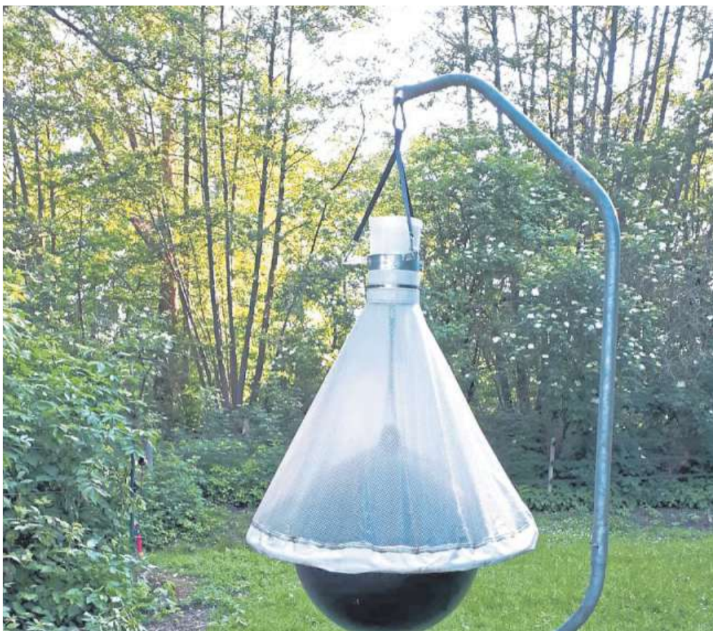
Die untere Naturschutzbehörde appelliert, keine Bremsenfallen aufzuhängen,

bienenarten. Eine andere Studie zu Pferdebremsenfallen im Oldenburger Umland kommt zu ganz ähnlichen Ergebnissen, hier lag der Anteil des Beifangs bei fast 91 Prozent. Gemäß dem Erlass des Umweltministeriums vom 14. Mai dieses Jahres soll durch die unteren Naturschutzbehörden sichergestellt werden, dass Bremsenfallen unter anderem nicht innerhalb von Naturschutzgebieten, FFH-Gebieten (teilweise nur als Landschaftsschutzgebiete ausgewiesen)