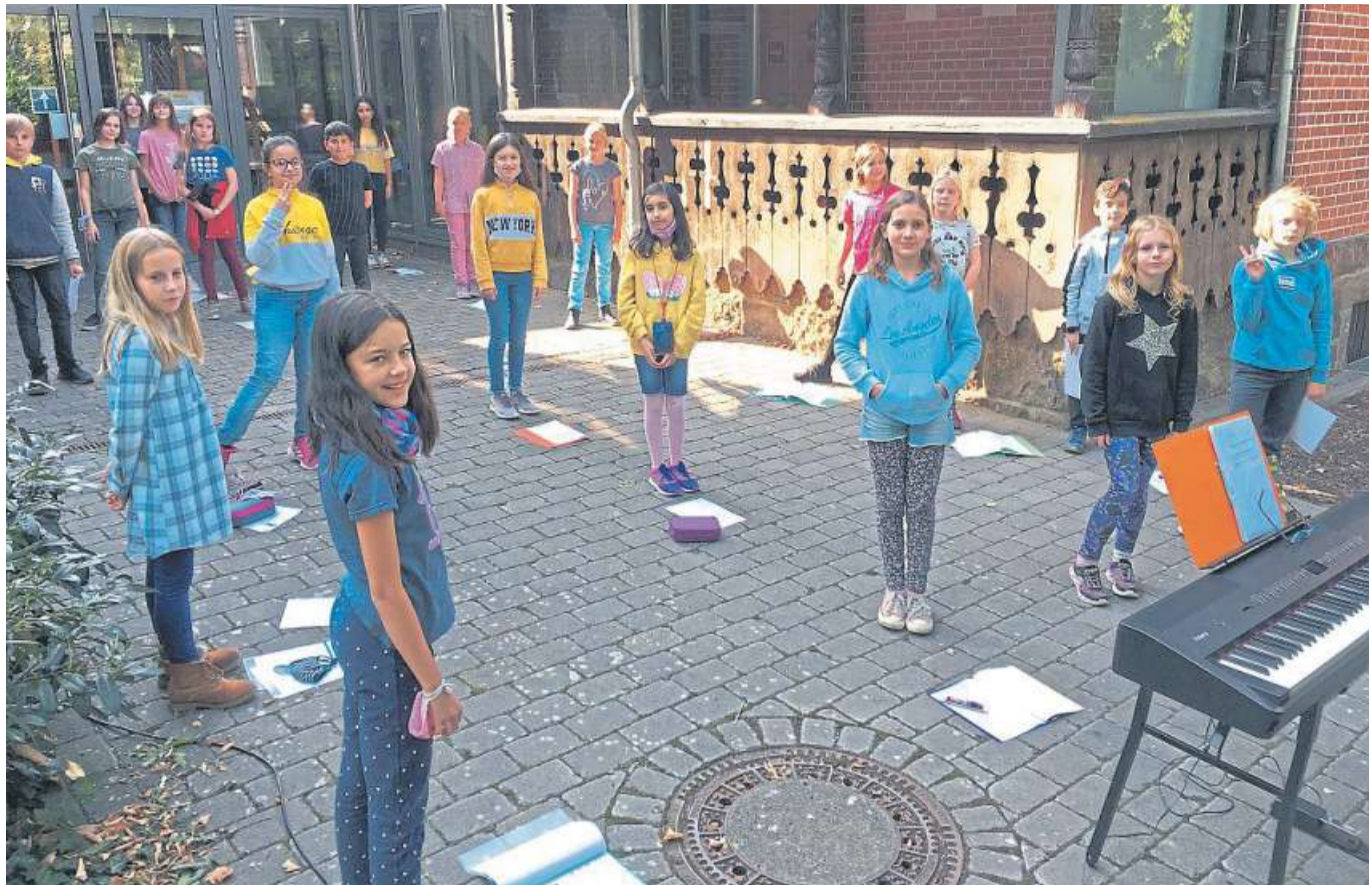
Auf dem Schulgelände durften die Kinder nach langer Pause singen.