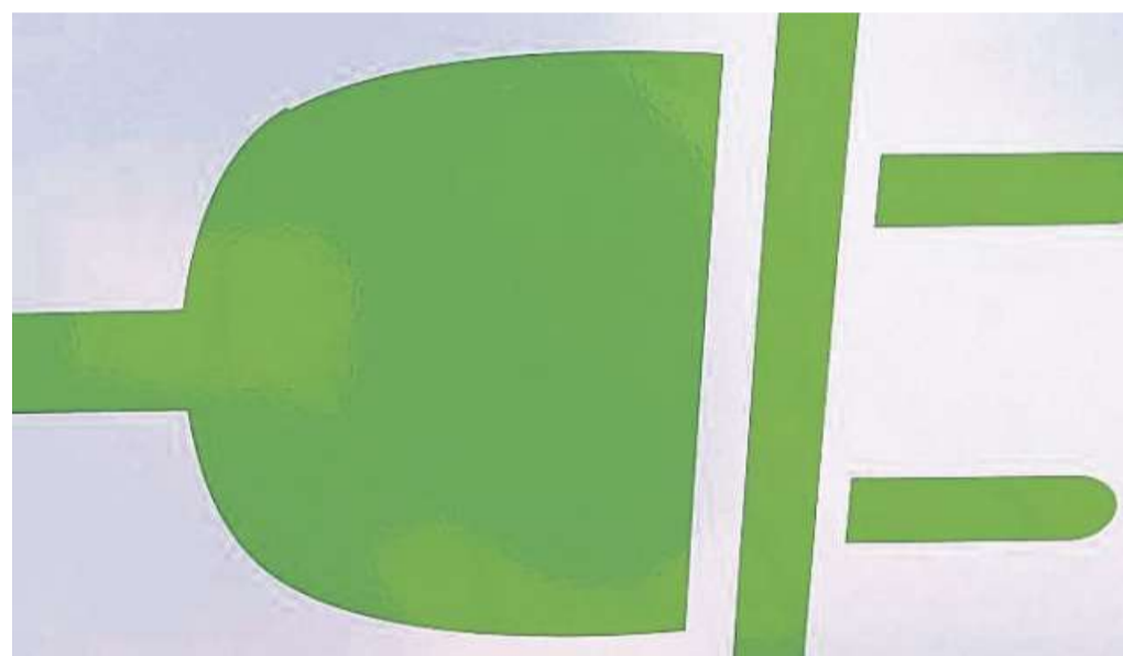
Für die Stadt Nienburg wird ein Elektromobilitätskonzept als Umweltstudie erstellt.

Steinhude. Im Scheunenviertel in Steinhude gibt es am 26. und 27. Juni einen Kunsthandwerkermarkt. Stilvolle Ledertaschen, lässig-elegante Strickmode aus Leinen, rustikale Töpferware, aromatische handgesiedete Seifen, bunte Bildwerke aus mundgeblasenem Glas, Sehnsuchts- und Wimmelbilder, edle Hüte und Kopfbedeckungen und individueller Schmuck sind zu sehen – Erzeugnisse aus Atelier oder Werkstatt der Künstler und Kunsthandwerker. Die Ausstellung ist am Samstag von 11 bis 18 Uhr und am Sonntag von 11 bis 17 Uhr geöffnet. Der Eintritt kostet pro Person einen Euro. Kinder bis 14 Jahre haben freien Eintritt. DH