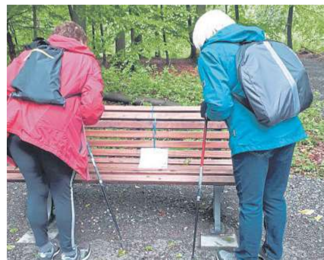
Zwei Spaziergängerinnen lesen eines der Gedichte, die es entlang der Promenaden in Bad Rehburg zu entdecken gibt.

Sie können bei einem Spaziergang genießen, was Novalis, Clemens Brentano, Joseph Freiherr von Eichendorff, Karoline von Günderode und andere den Passanten sagen möchten. „Die blaue Blume ist aber das, was jeder sucht, ohne es selbst zu wissen, nenne man es nun Gott,