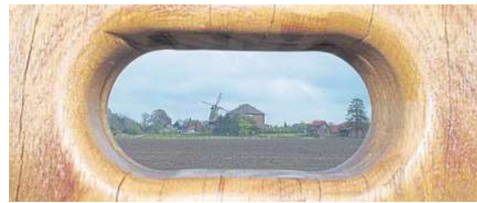
Der Blick auf die Mühle durch das Guckloch.

und ist natürlich auch im Dörverdener Rathaus erhältlich. Daneben steht es zum Download auf der gemeindlichen Internetseite zur Verfügung. Zudem ist die Tour im Landkreis Verden Navigator unter www.landkreis-verden-navigator.de zu finden. Dort kann der Streckenverlauf auch mittels GPS-Daten für Navigationsgeräte heruntergeladen werden.