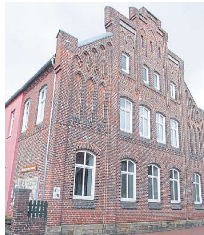
Das Stolzenauer Heimatmuseum an der Schulstraße öffnet am 20. Juni wieder seine Pforten. In der Ausstellung gibt es eine Reihe von Neuerungen.