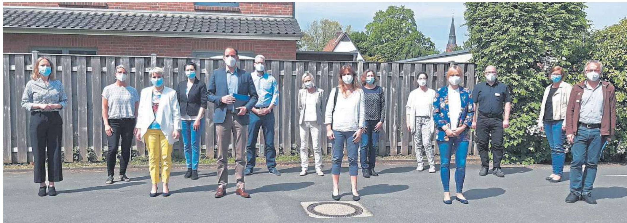
Die Beteiligten des Austauschs über Sprachförderangebote.