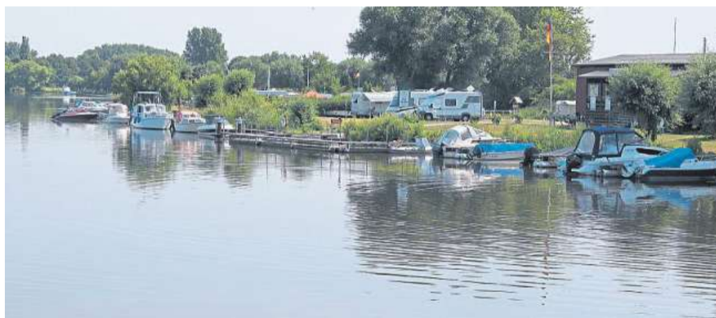
Der Campingplatz in Drakenburg.

des Steinhuder Meeres, der nördlichste Platz liegt vor den Toren Bremens in Achim. Darunter sind auch idyllisch gelegene Plätze direkt am Weserufer wie in Achim, Thedinghausen, Drakenburg, Stolzenau oder Langwedel. Hinzu kommen Plätze an Badeseen wie in Hilgermissen, Asendorf und am Härmelsee. Von allen Campingplätzen können Fahrradtouren auf dem über 3000 Kilometer langen, ausgeschilderten Radwegnetz und dem Weser-Radweg unternommen werden. DH