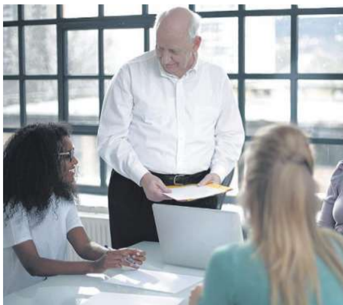
Über die Zeit hinweg können aus Kollegen Freunde werden.