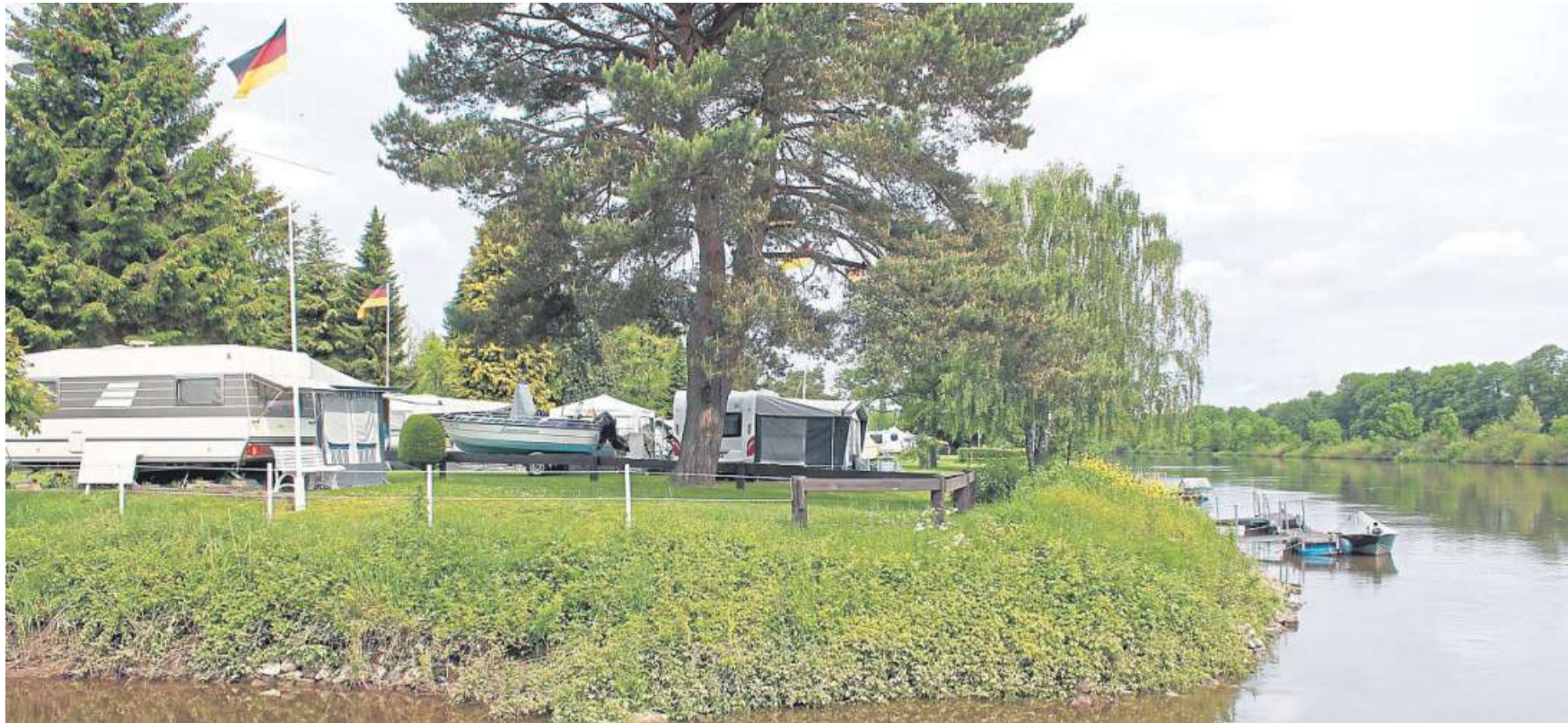
Der Campingplatz in Stolzenau.

Für die Kinder, die bereits die weiterführenden Schulen besuchen, erstellt Heemsens Jugendpflegerin Ilka Schaumberg gerade ein umfangreiches Programm, das vorgestellt werden soll, sobald alle Einzelheiten feststehen. DH