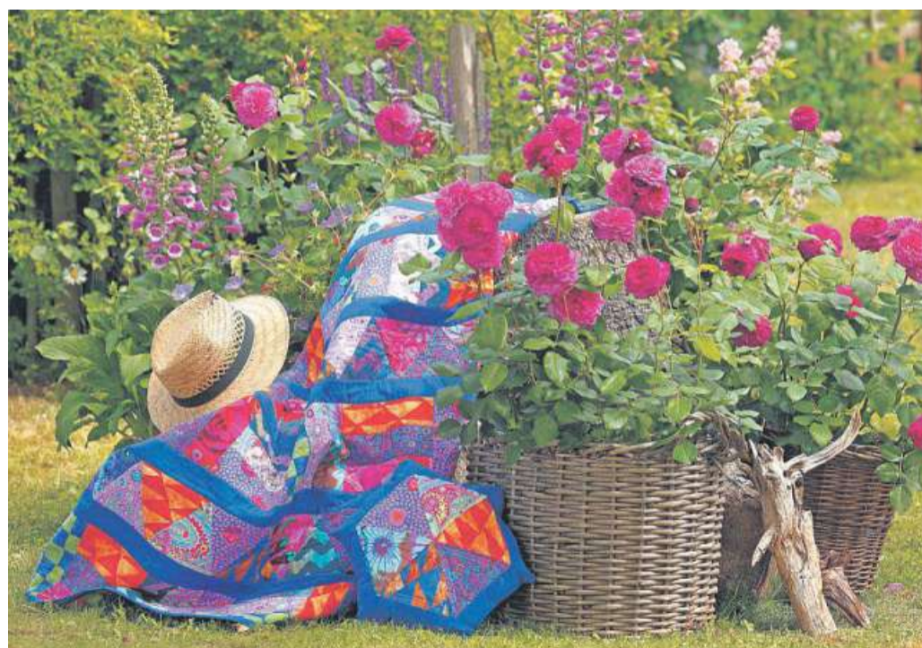
Die intensiv gefärbte Rosensorte Kaffe-Fassett entwickelt ein intensives Zitrus-Aroma.

ne, Orange, Pfirsich, Himbeere, Apfel, Melone, Vanille, Anis, Moos und Pfeffer lassen sich erschnuppeln. Kaum zu glauben, aber entwickelt haben die Rosen ihr Duftbukett nicht für uns, sondern für Bienen, Hummeln, Hornissen, Käfer oder Schwebfliegen, die sie zur Bestäubung anlocken. Duftrosen sind nicht unbedingt die pflegeleichtesten unter den Rosengewächsen. Sie gelten traditionell als eher aufwendig in der Pflege und in den Standortansprüchen. Doch neuerdings bieten immer mehr Züchter gesunde und widerstandsfähige Duftrosensorten an. Bei Rosen Tantau etwa finden sich Varianten mit ausgewiesener guter Blattgesundheit, die sich an sonnigen bis halbschattigen Plätzen wohlfühlen. Potenzielle Feuchtigkeit an den Blättern sollte möglichst vermieden werden, auch Staunässe mögen die Pflanzen nicht.