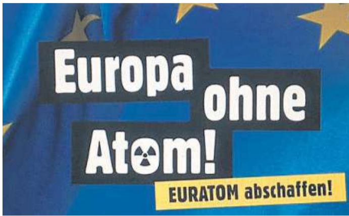
Um den Euratom-Vertrag ging es bei der Online-Diskussion.

Aktuell werde an den nächsten Generationen von Flüssigsalz-Reaktoren geforscht, der sogenannten Generation IV. Der Vertrag lasse sogar zu, dass auch Nicht-Innovationen wie Siede-Wasser-Reaktoren gefördert werden. Alle Umweltverbände, aber auch die Grünen und die Linken im Bundestag forderten aktuell eine Reform von Euratom. Auch die CDU/CSU