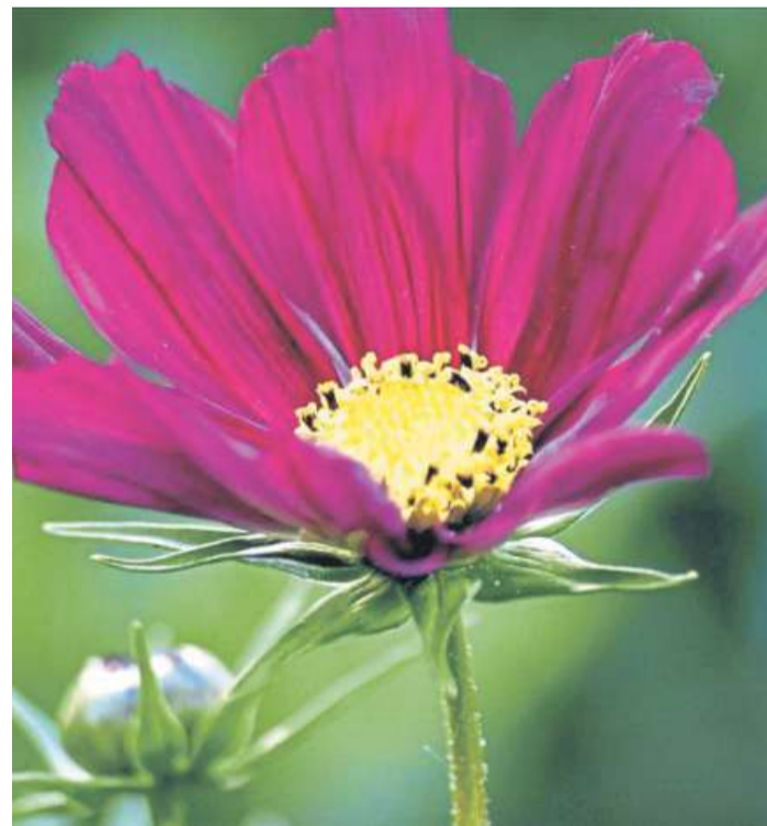
Dieses und viele weitere Blumenfotos hat Angela Domko in der Fotogruppe gepostet.

➔ Schauen Sie doch einmal vorbei, dann entdecken Sie noch viele weitere Gruppen: www.lokalportal.de