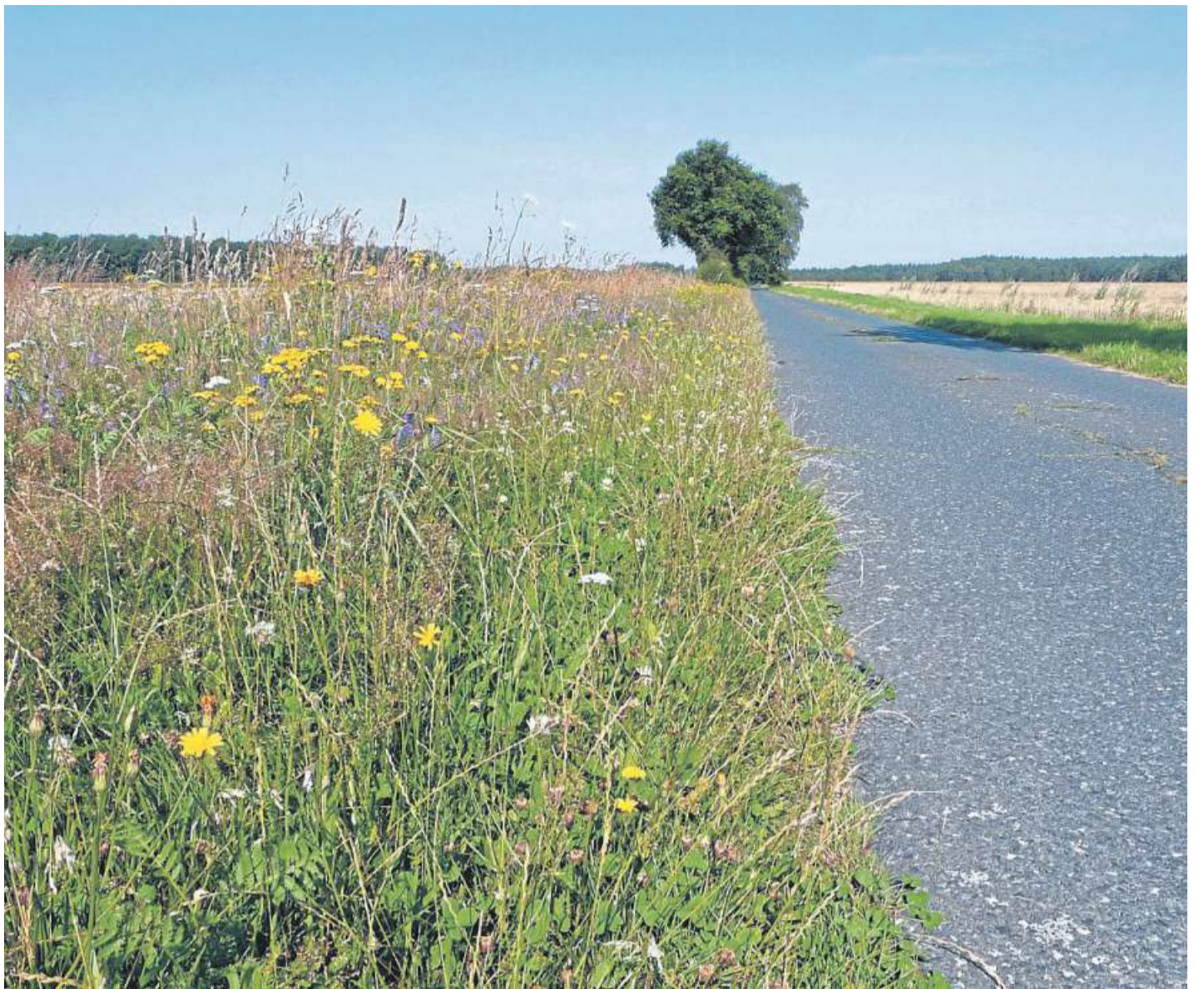
Wegeseitenränder sind Rückzugsort für allerlei Tiere.

Zu diesen Tierarten gehören auch alle europäischen Vogelarten. Sie alle dürfen während der Fortpflanzungs-, Mauser-, Überwinterungs- und Wanderzeiten nicht gestört werden. Damit die Wegeseitenränder ihre Aufgabe als Rückzugsort für sie erfüllen können, müssen sie adäquat gepflegt werden. Dazu gehört, dass auf den Einsatz von Spritz- und Düngemitteln ebenso verzichtet wird, wie auf unnötiges Befahren. Außerdem ist es wünschenswert, dass möglichst nicht gemulcht wird und ein gegebenenfalls notwendiges Mähen ab-