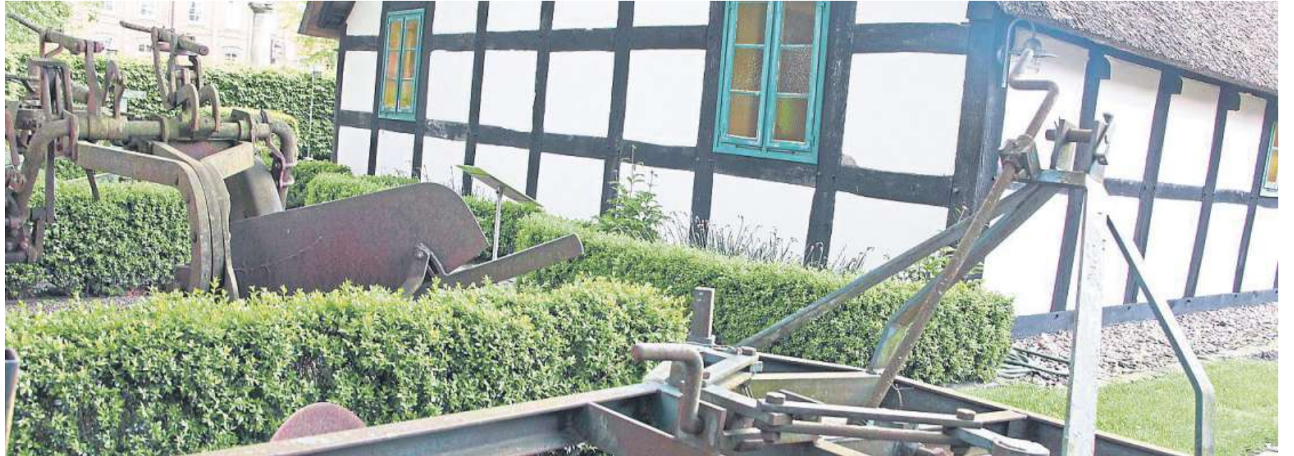
Historische Erntegeräte stehen am Nienburger Spargelmuseum. Eine neue Dauerausstellung ist in Planung.