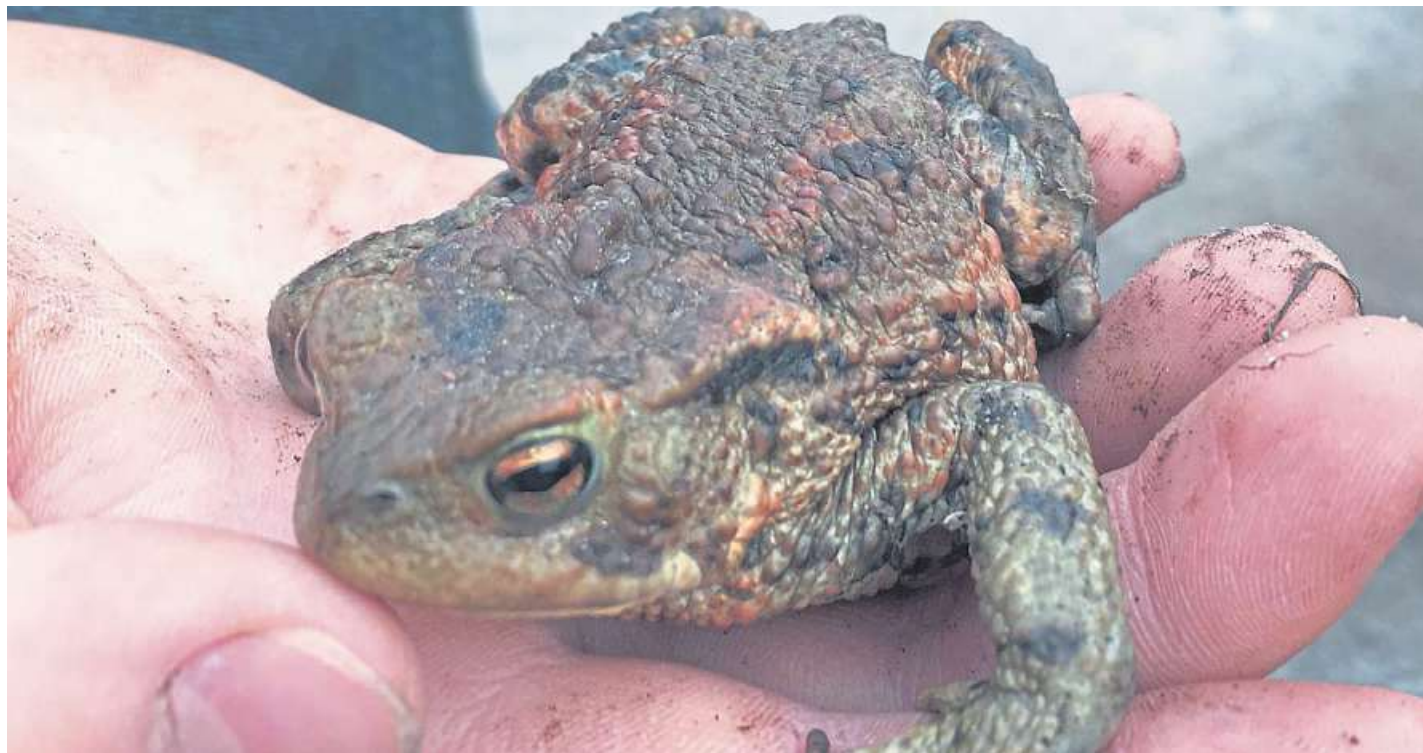
Um Kröten zu helfen, sucht der Landkreis Ehrenamtliche.