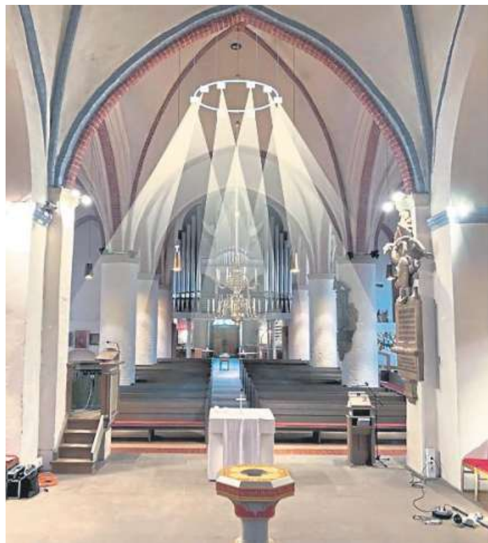
Das künftige Beleuchtungskonzept sieht unter anderem Ringleuchten mit aufgesetzten Einzelstrahlern zur Ausleuchtung der Kirchenbänke vor.

Die Pilotierung wird im kommenden Studienjahr an den drei Studienstandorten fortgesetzt. In Abstimmung mit dem Landes-Innenministerium wird auf Basis einer abschließenden Evaluation Anfang 2022 über die Frage einer dauerhaften Implementierung entschieden. DH