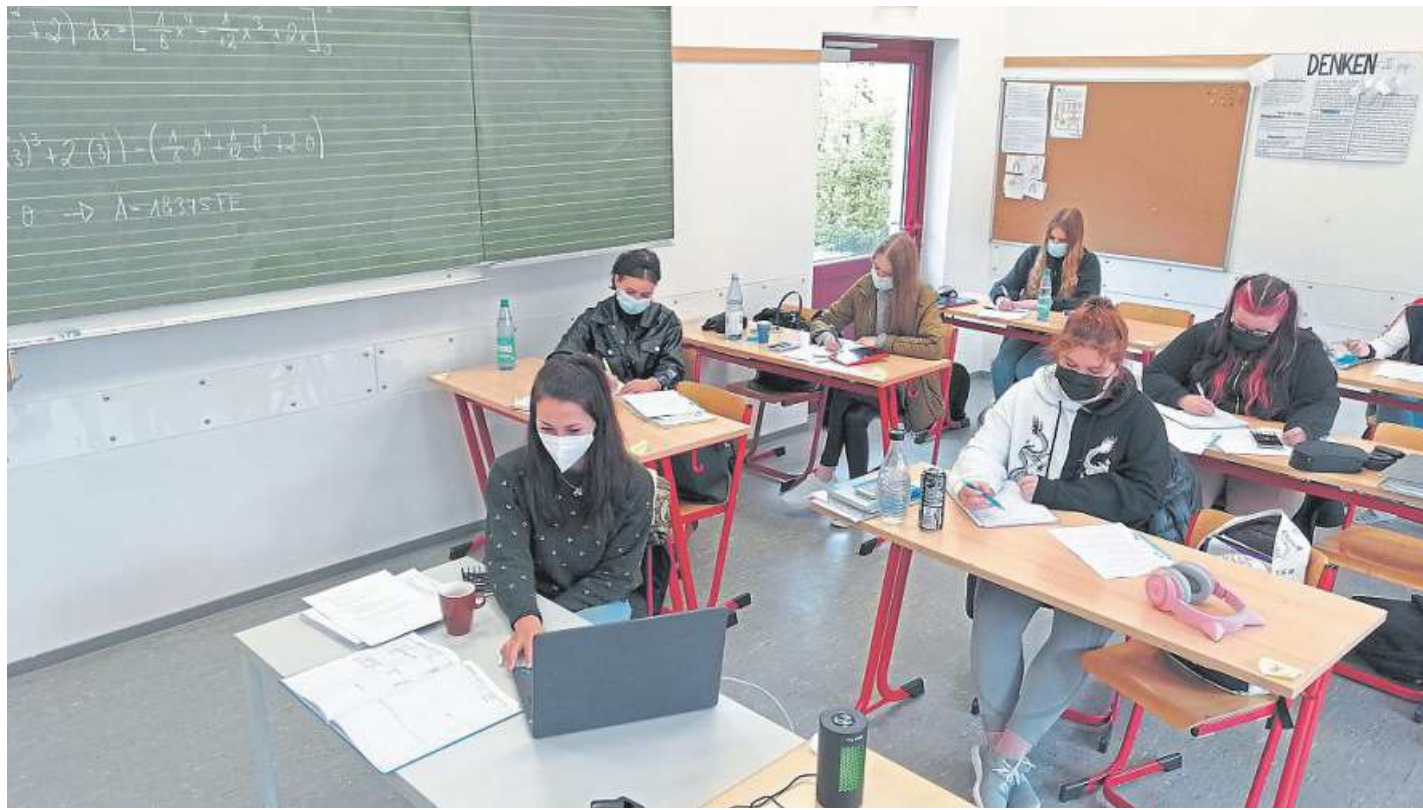
Mathe im Hybridunterricht der Fachoberschule.

Für dieses komplexe System wurde eigens der Schulserver ausgebaut, sodass er nun zu den leistungstärksten Schulservern Niedersachsens bezüglich der Rechenleistung pro Schüler zählt. Ausgestattet mit neuen Dienst-Laptops und I-Pads können die Lehrerinnen und Lehrer nun in jedem Raum der Schule mit ihrem Gerät schnell und un-