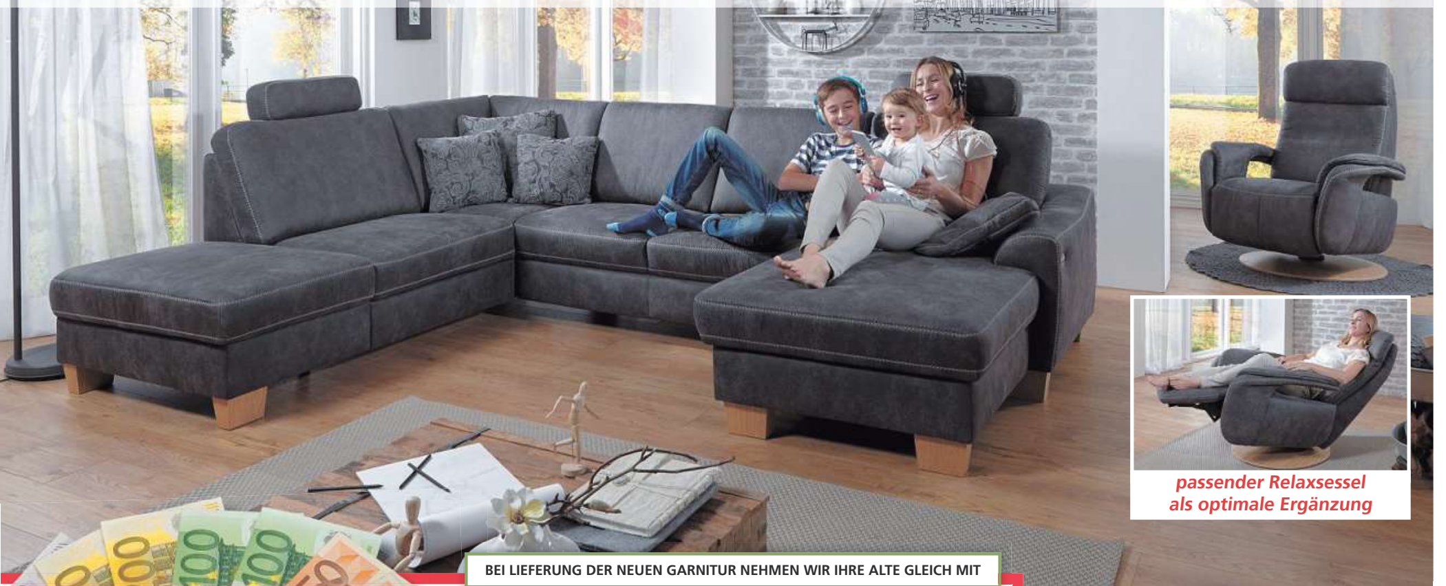
passender Relaxsessel als optimale Ergänzung

Moderne Wohnlandschaft in Stoff mit Kontrastnaht. Abholpreis ohne Funktionen, Kopfstützen und Kissen. Rücken unecht. Ausführung in Kaltschaum oder Federkern preisgleich. Stellmaß der abgebildeten Garnitur ca. 235 x 313 x 167 cm.