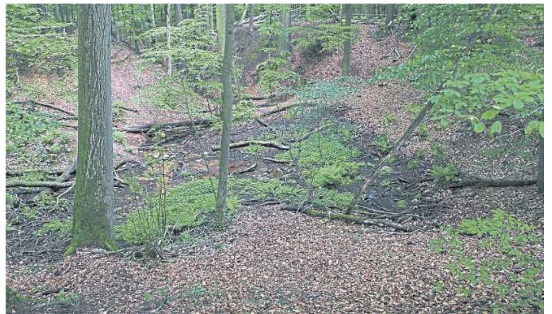
Die Hubertusquelle im Oyler Wald soll möglichst unberührt bleiben.