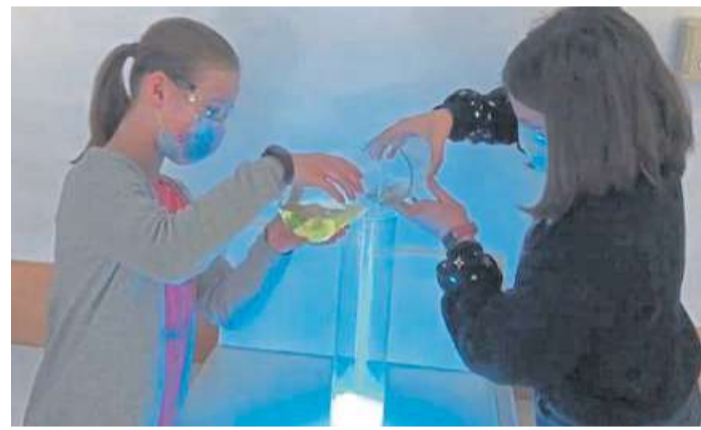
Mit Experimenten können Schülerinnen und Schüler ganz praktisch lernen.

Weil zur Schule hauptsächlich die Schülerinnen und Schüler gehören, haben sie Ideen, Beiträgen und Botschaften für Eltern und Kinder vorbereitet. Ein Klick bei „Gründe für das MDG“ oder „Unsere Schüler“ zeigt sie. DH