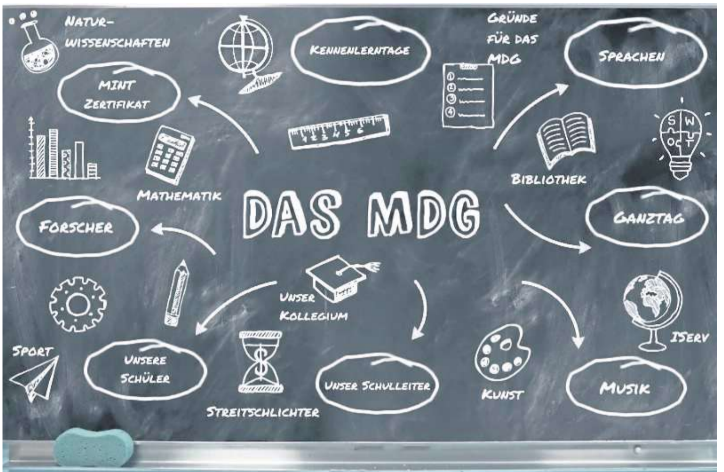
Was es am MDG so gibt, erfahren Kinder und Eltern in diesem Jahr online.

Weitere Klicks führen zur Kunst und zur Musik. Besu-