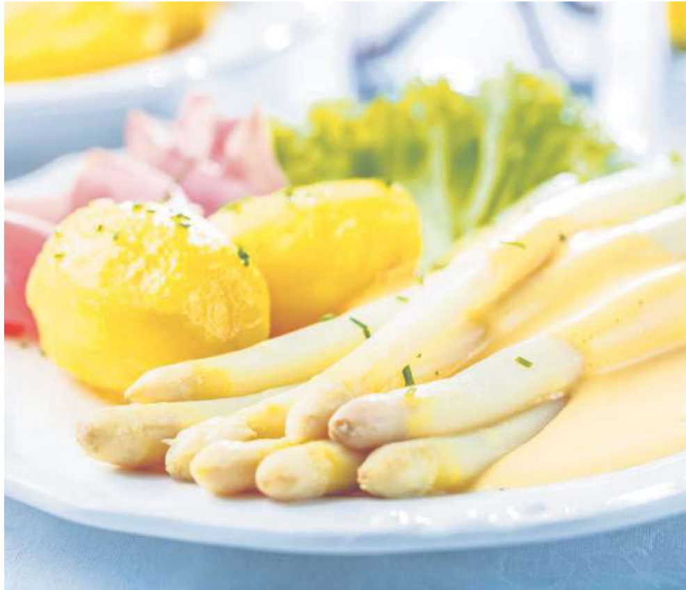
So essen die meisten den „Klassiker“: Spargel mit Kartoffeln und Schinken. Dazu zerlassene Butter oder Sauce Hollandaise.