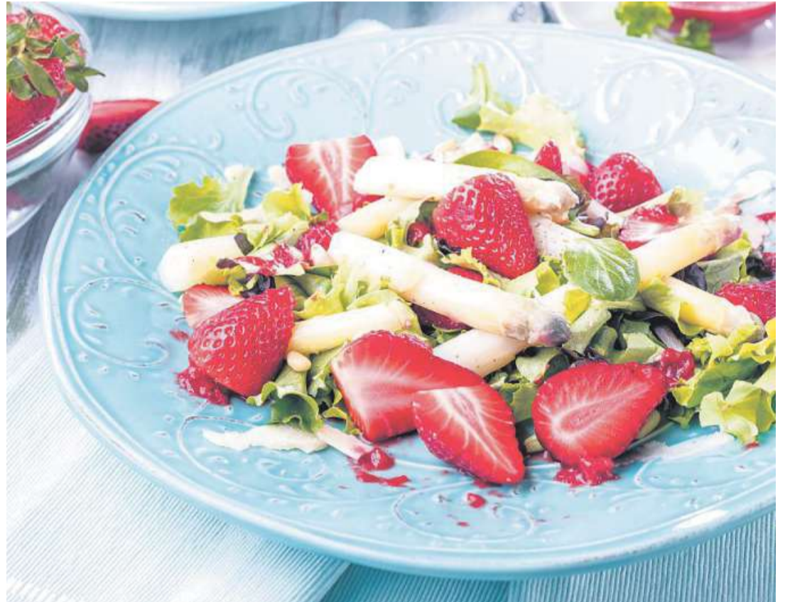
Es gibt aber auch Varianten, etwa einen leichten Salat mit Erdbeeren.