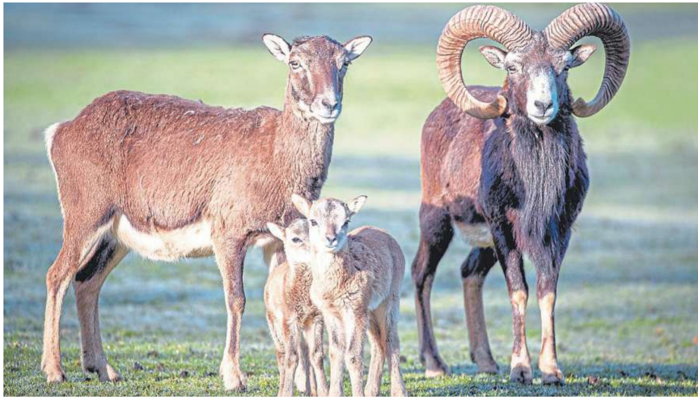
Zwillinge gab es bei den Mufflons in der Lüneburger Heide.