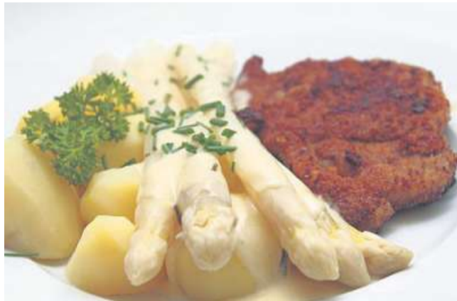
Eine beliebte Variante: Schnitzel zum frischen Spargel.