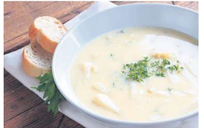
Als Vorspeise eignet sich eine Spargelsuppe.