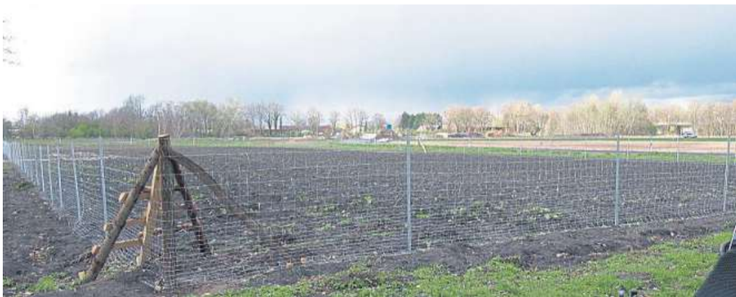
Auch am frisch beplanten Bereich, der zum Klimawald werden soll, führt die Route entlang.

diskutiert wird ebenfalls eine Beschilderung der Radroute sowie Informationstafeln an den Stationen. Der ADFC wird einen GPS-Track erstellen zur Routenfindung mit Fahrradnavigationssystemen oder Smartphones. „Der neue Grüne Ring wird ein Zugewinn für Nienburg sein“, meint ADFC-Sprecher Berthold Vahlsing. „Mit Kindern oder einfach auch nur interessehalber rechnen wir auch mit vielen Nienburgern auf dem grünen Faden.“ DH