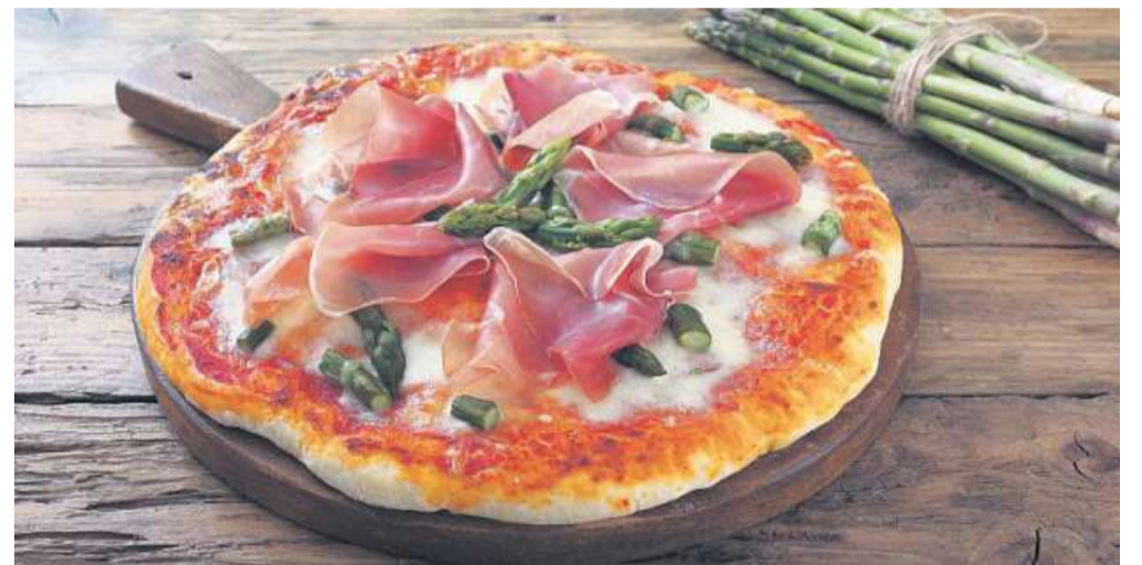
Vielleicht mal so? Spargel auf Pizza.