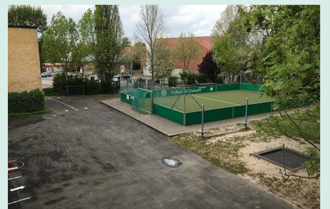
Der Schulhof der Oberschule Mittelweser am Standort Stolzenau.

AG-Angebot: im Aufbau Digitale Ausstattung: iServ, iPads