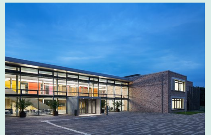
Die Integrierte Gesamtschule in Nienburg ist in einem modernen Gebäude optimal untergebracht.

Medienausstattung, weitläu-figes Außengelände mit Frei-zeit- und Sportstätten, feste Klassenstrukturen und ver-lässliche Beziehungen bis Jahrgang 13, diverse Aus-landsfahrten, Sprachzertifi-kate, Schülerfirmen, Schul-hunde, diverse Kooperatio-nen (unter anderem mit der Hochschule Hannover, BBS Nienburg, Stolpersteine Reh-burg, Dinopark Müncheha-gen, Hannover 96), Ausbil-dungsfreundliche Schule, Schule aktiv für Unicef, Um-weltschule in Europa, Schule ohne Rassismus AG-Angebot: Vielfältige Ganztagsangebote beste-hend aus Studierzeiten, För-der- und Förderangeboten, Werkstätten, Mittagessen, Betreuungsangeboten und Verlässlichkeit. Umfangrei-ches AG-Angebot (inklusive Kooperationspartnern): Rei-ten, Stolpersteine, Verant-wortung, Dinopark, Hunde, Tanzen, Nichtschwimmer, ... und bis zu 70 weitere Ange-bote Digitale Ausstattung: iServ, Moodle, WebUntis, Gigabit-LAN und WLAN, digitale Ta-feln, vielfältiges Equipment für digitale Veranstaltungen