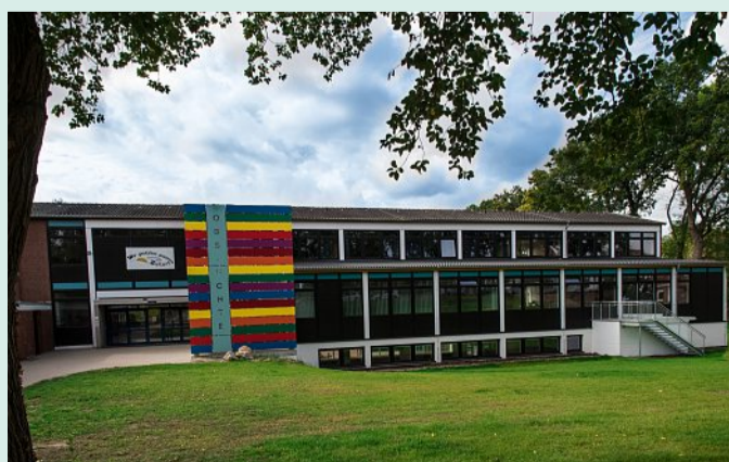
Die Oberschule Uchte.

Adresse: Hannoversche Straße 19, 31600 Uchte