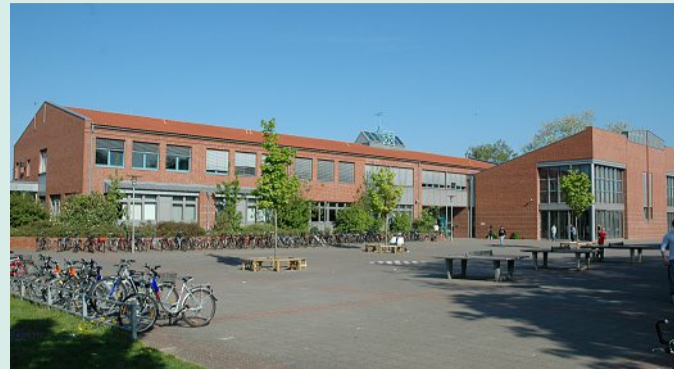
Der großzügige Pausenhof der Marion-Blumenthal-Oberschule.

sisch, Angebot, Informatik oder Philosophie in der Oberstufe Besonderheiten: Schulhund, vielfältiges Angebot zur Berufsorientierung (Speed-Dating, Berufe-Parcours, Kooperation mit BBS) AG-Angebot: derzeit eingeschränkt wegen Corona, „Mode macht Schule“, „Schülerscouts“, „Schulgarten“, „Rockband“ Digitale Ausstattung: alle Klassenräume mit Smartboards ausgestattet, digitales Lernen über IServ, Nutzung verschiedener Lernplattformen