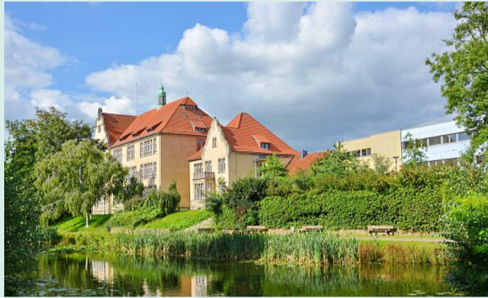
Die Alber-Schweitzer-Schule Nienburg