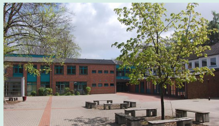
Die Oberschule Loccum.

AG-Angebot: Unter anderem Sport-, Musik- und Tanzange-