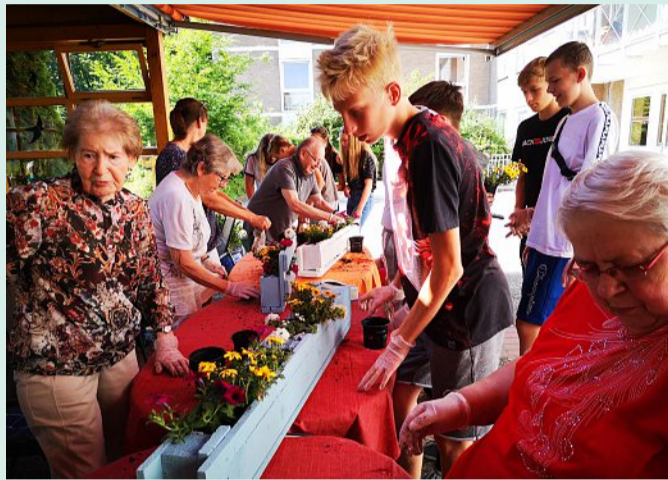
Gemeinsame Blumenkasten-Aktion mit Senioren aus Marklohe.

Schwerpunkte: Berufsorientierendes Profil, zwei Schülerfirmen, sportliches Profil (große Turnhalle und Außenanlage), Kooperation mit örtlichen Sportvereinen und