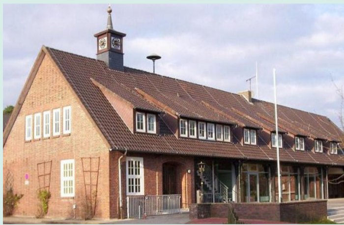
Die Oberschule Steimbke.

Adresse: Sonnenborsteler Kirchweg 2, 31634 Steimbke Telefon: (0 50 26) 89 12 Schulleitung: Andreas Geuß E-Mail-Adresse: sekretariat@obs-steimbke.de Internet: www.obs-steimbke.de Informationstag: Pandemiebedingt sind individuelle Termine geplant Organisation: Ganztagschule, Montag und Freitag 8.15 bis 12.45 Uhr, Dienstag bis Donnerstag 8.15 bis 15.45, montags findet von 12.45 bis 15.45 Uhr ein freiwilliges AG-Angebot statt Essensangebote: Mensa Schülerzahl: Insgesamt gut 370 Schülerinnen und Schüler in den Jahrgängen 5 bis 10. Im aktuellen Schuljahr werden drei fünfte Klassen