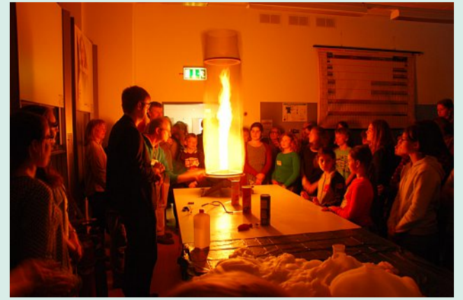
Am MDG gibt es Forschergruppen.