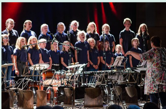
Sommerschulkonzert in Stolzenau.