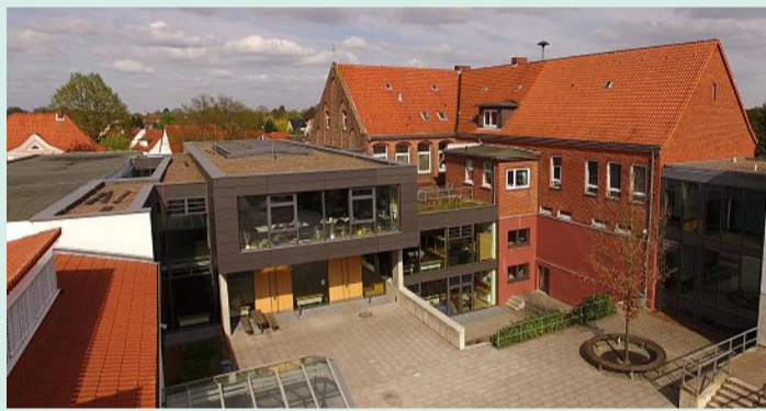
Ein Blick auf den Schulhof und das Gebäude der früheren Leintorschule von hinten.

Essensangebote: In der Schule kann auf Antrag Mittagessen eingenommen werden. Zudem steht ein durch die Schülerfirma betriebener Schulkiosk zur Verfügung Schülerzahl: aktuell 399 (Schule im Aufbau, derzeit Jahrgänge fünf bis neun); Jahrgang fünf dreizügig Fremdsprachen: Englisch ab Jahrgang 5, Französisch ab Jahrgang 6