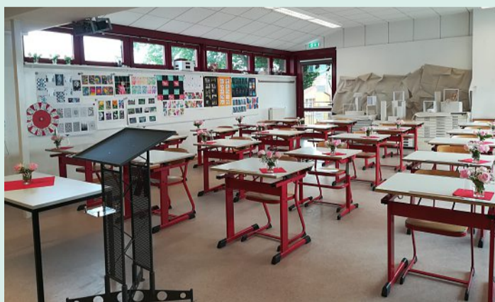
Ein Kunstraum der privaten Realschule.

Organisation: Teilgebundene Ganztags-schule. Regel-schulbetrieb 8 -13 Uhr und zweimal pro Woche bis 15 Uhr. Zusätzlich Ganztagsan-gebot von Montag bis Frei-tag von 7 bis 16 Uhr Essensangebote: Mensa-Mittagessen mit Essensaus-